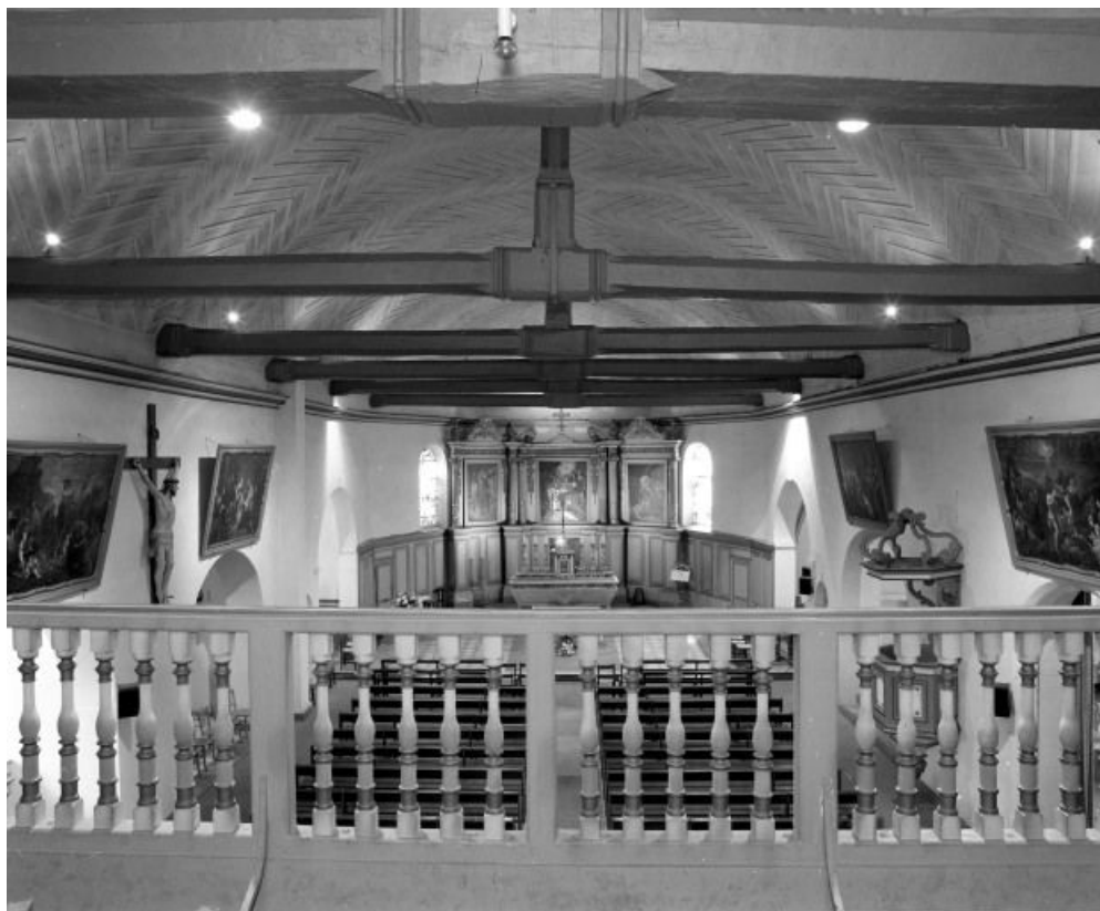
Vue d'ensemble depuis la tribune