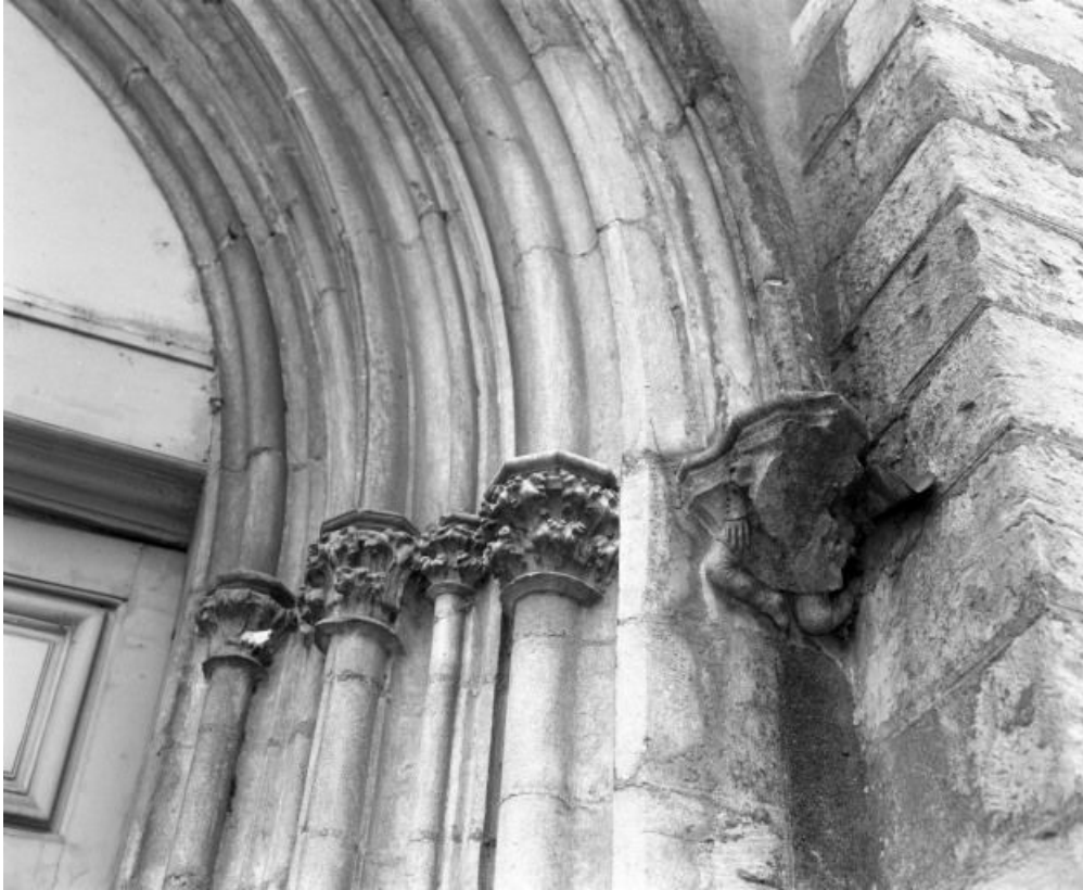
Culot et chapiteaux droits du portail.