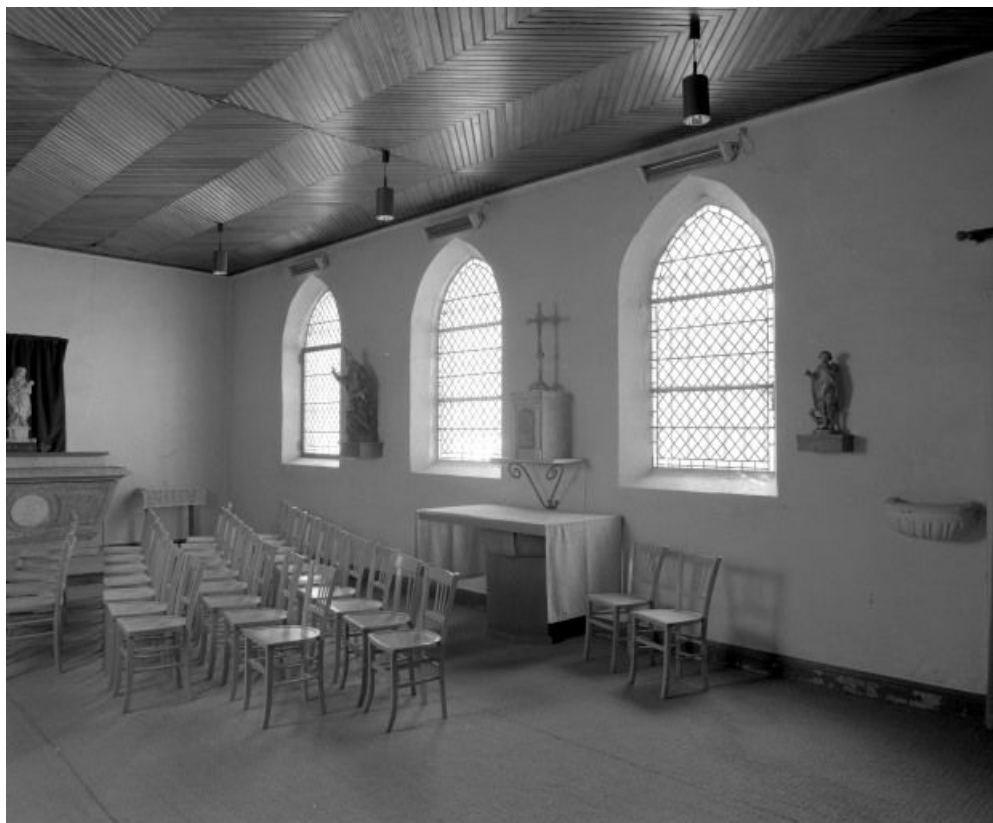
Première chapelle droite, dite chapelle Notre-Dame des treize.