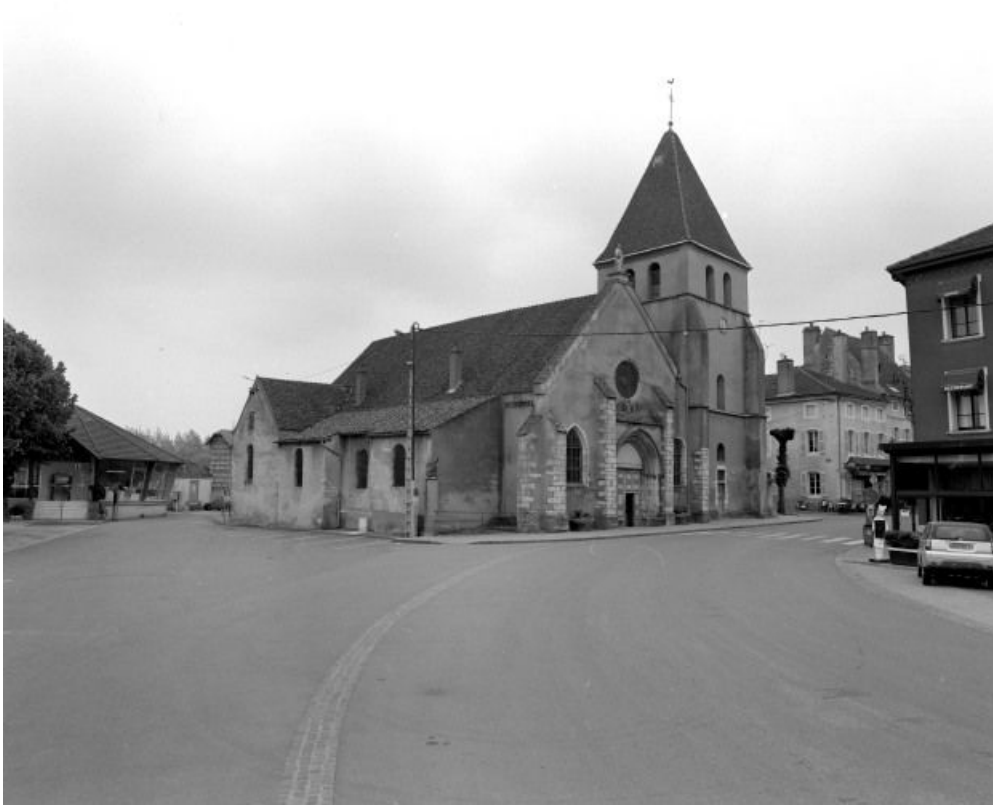
Façade et élévation gauche.