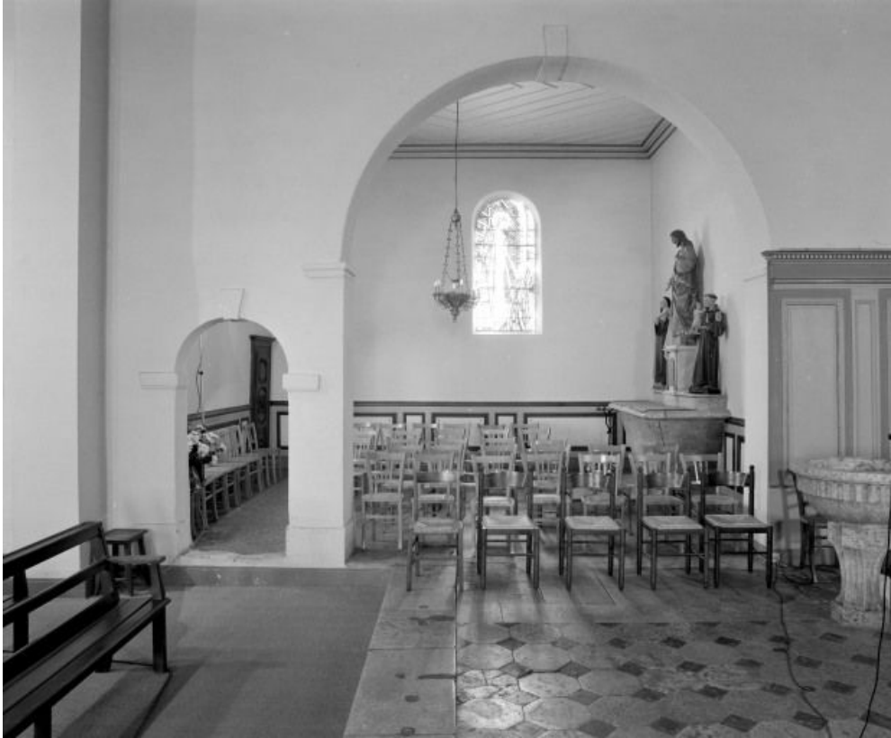
Quatrième chapelle gauche.