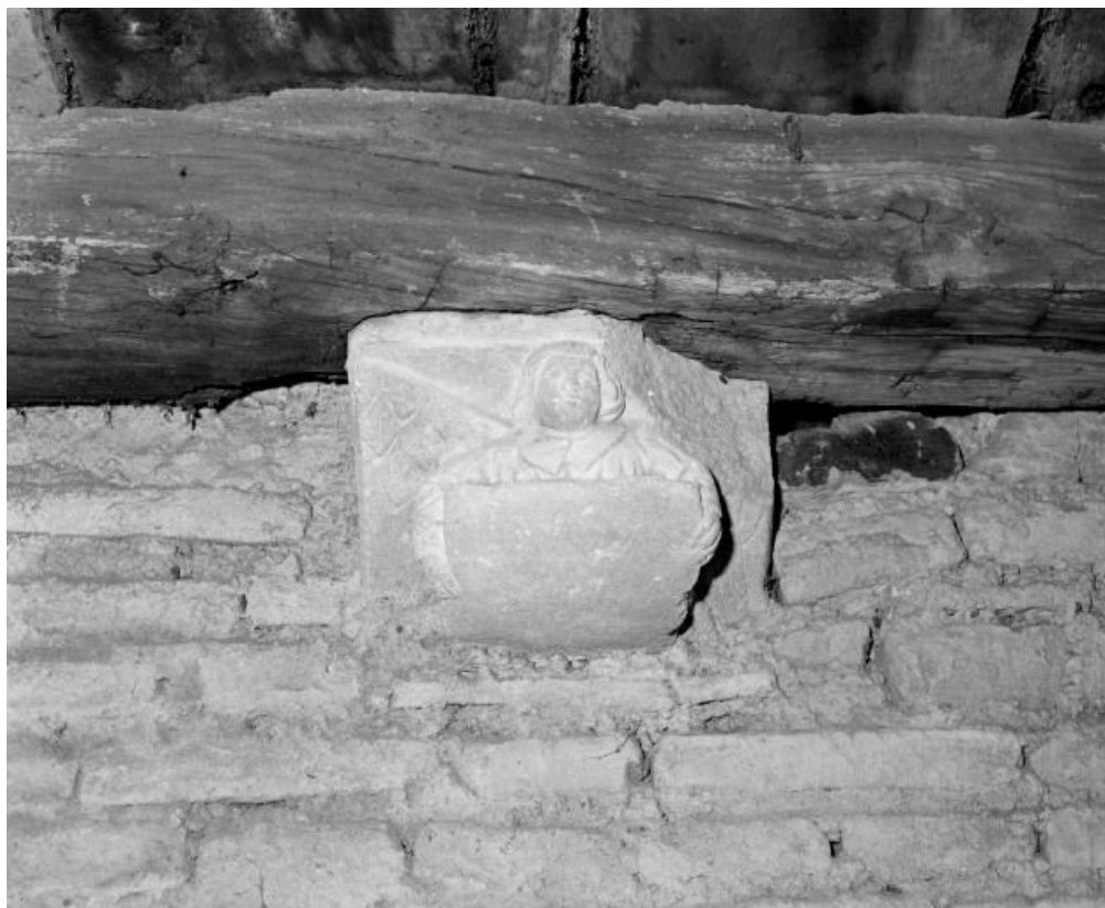
Clocher, 2e niveau : corbeau sculpté.