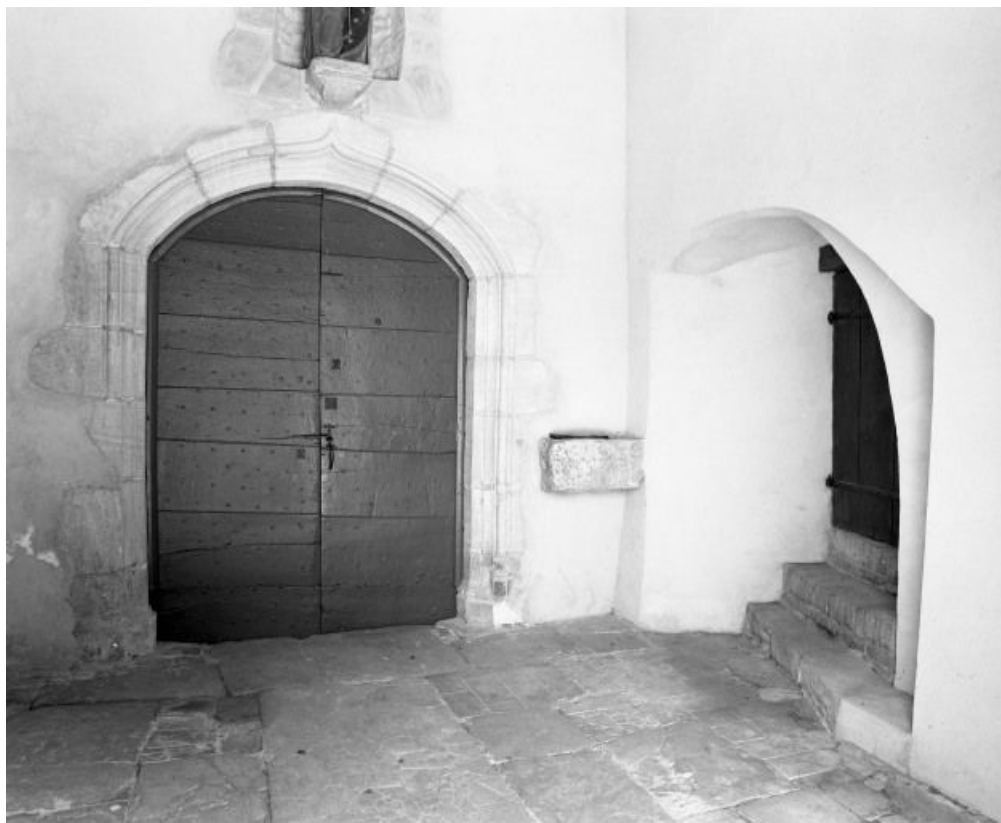
Vestibule, portail de la nef et entrée du clocher.