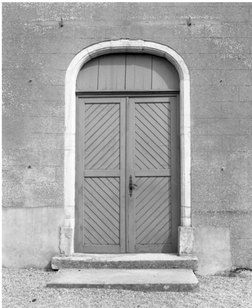
Portail de la façade, daté 1787.