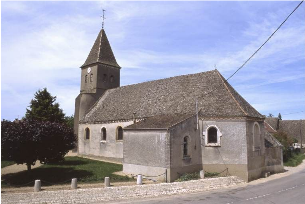
Elévation droite et chevet.