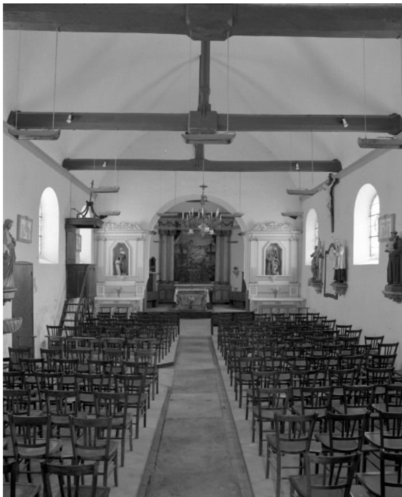
Vue intérieure prise de l'entrée.