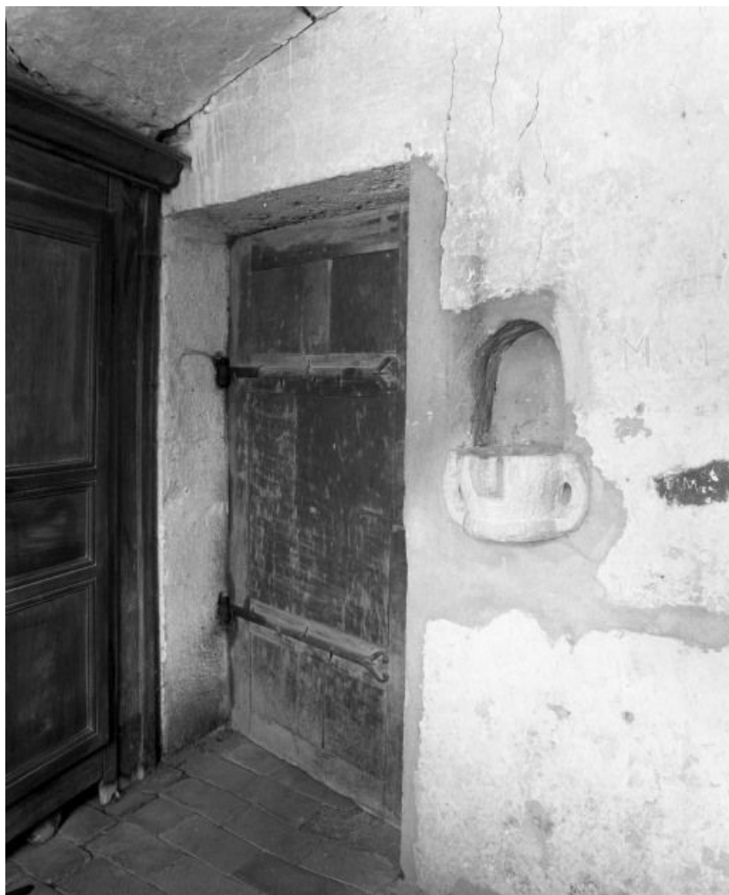
Sacristie gauche, porte et bénitier.