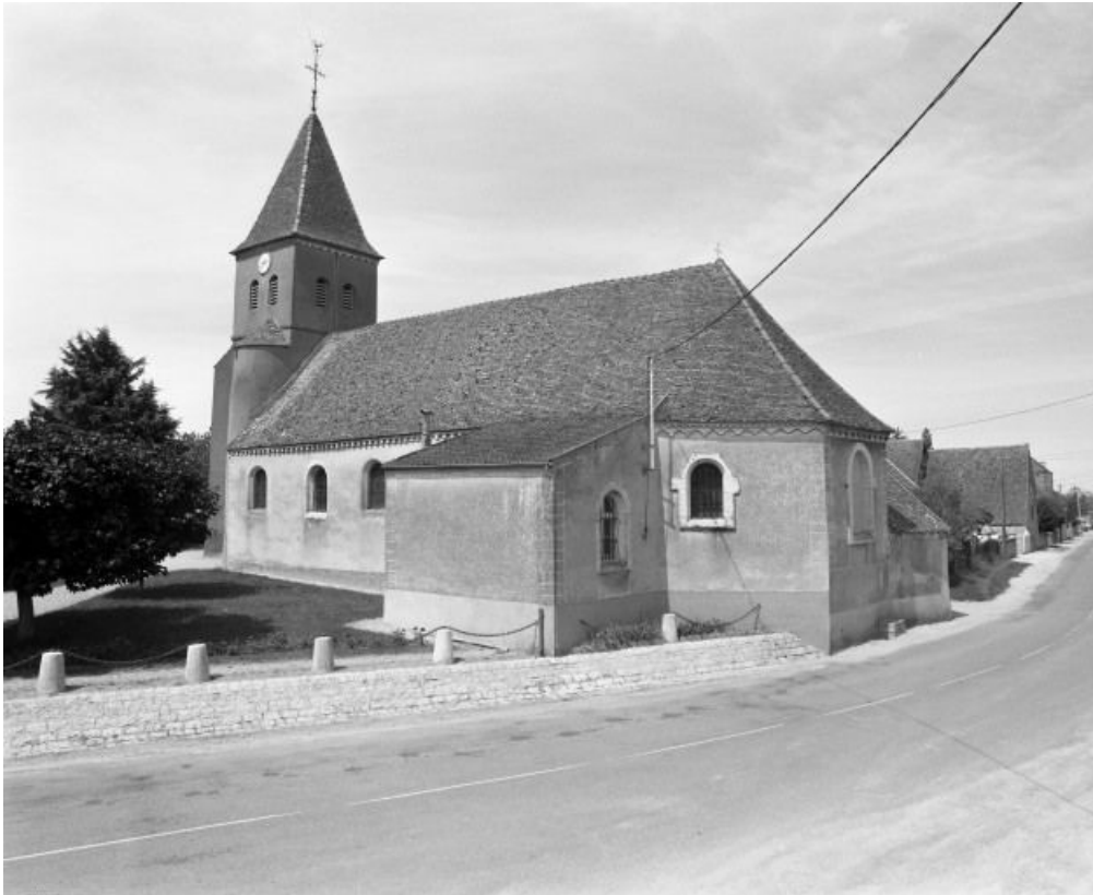
Elévation droite et chevet.