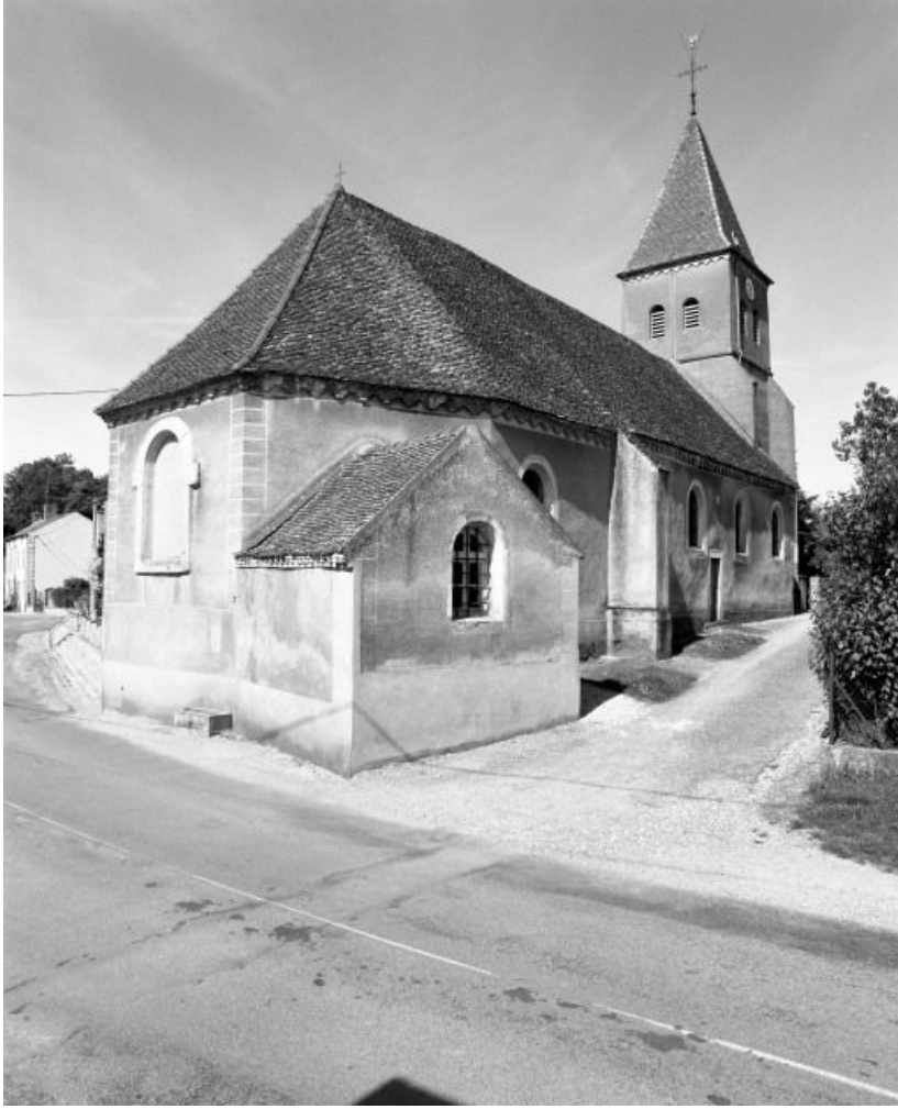
Chevet et élévation gauche.