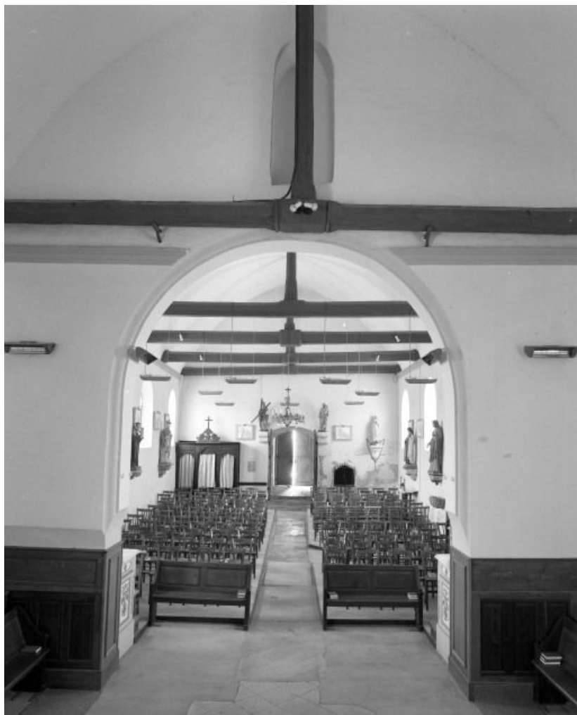
Vue de la nef prise du chœur.