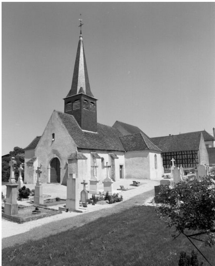
Façade et élévation droite.