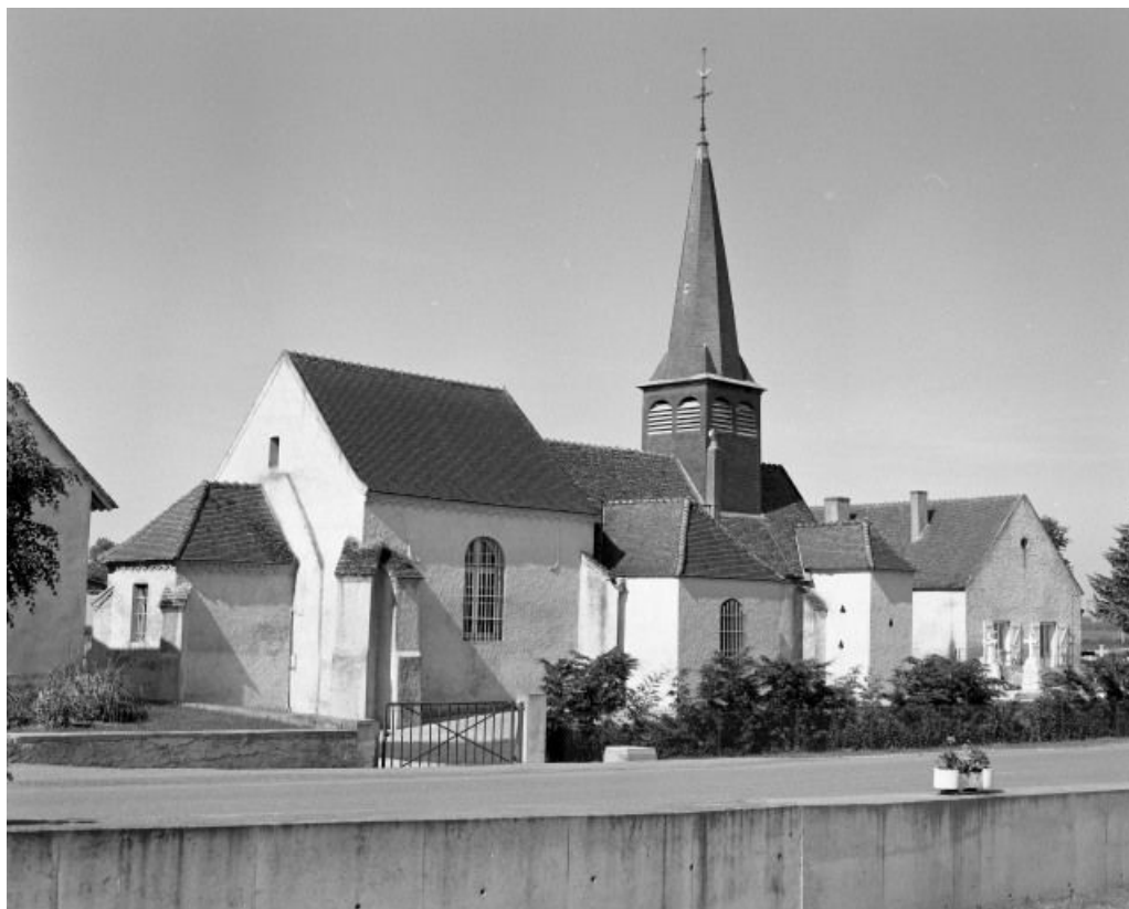
Chevet et élévation gauche.