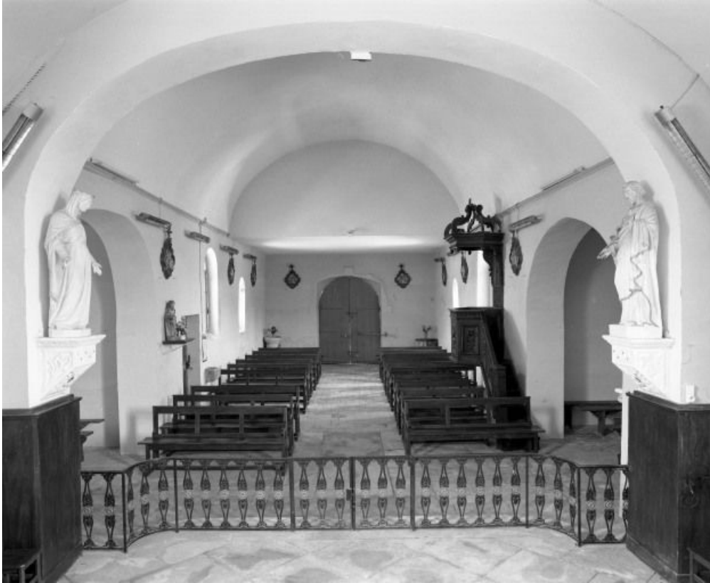
Vue d'ensemble prise du chœur.