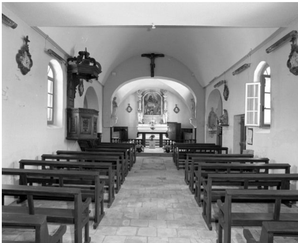
Vue d'ensemble prise de l'entrée.