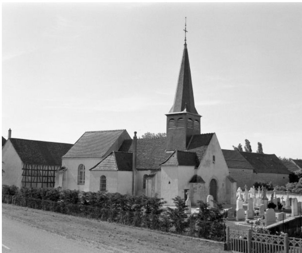
Élévation gauche et façade.