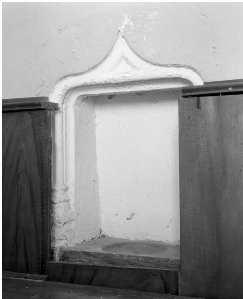
Lavabo du choeur.