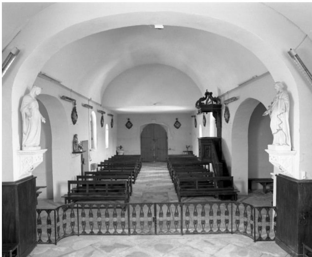
Vue d'ensemble prise du chœur.