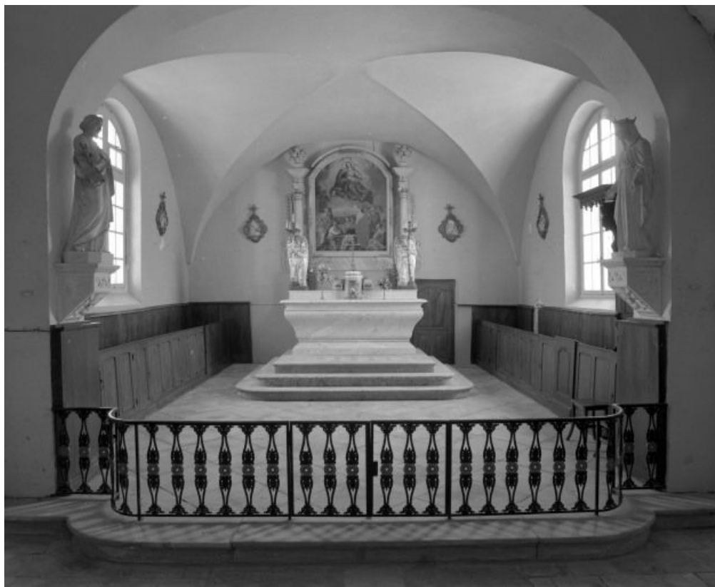
Vue rapprochée du chœur.