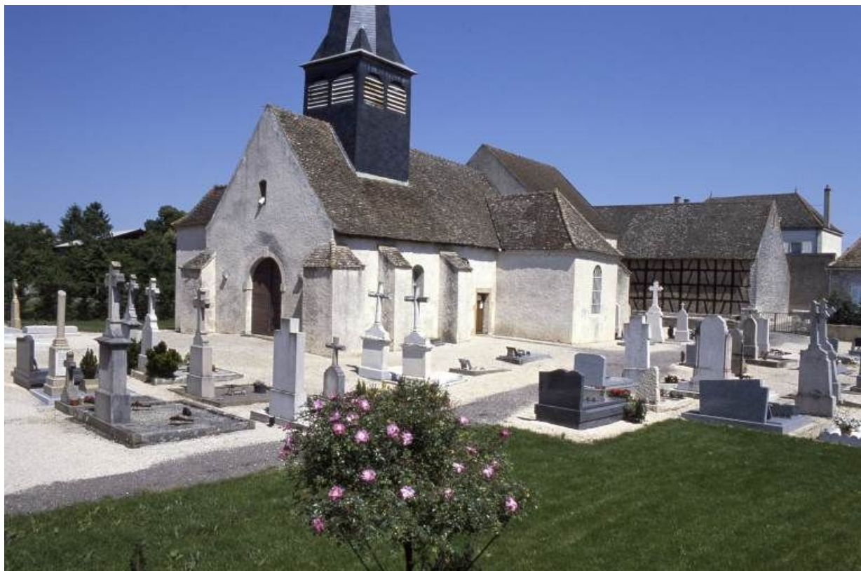
Façade et élévation droite.