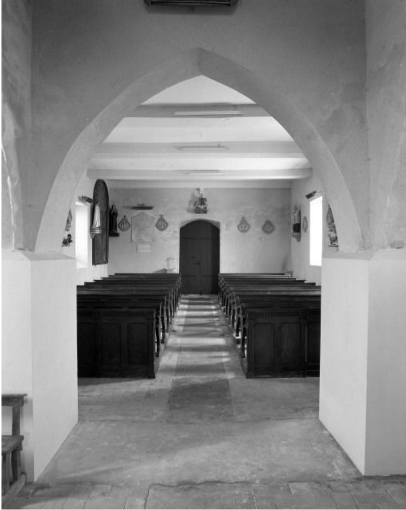
Vue d'ensemble prise du chœur.