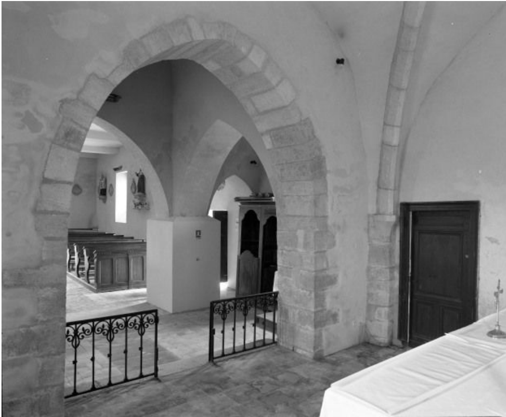
Arcade du chœur, vue prise du chevet.