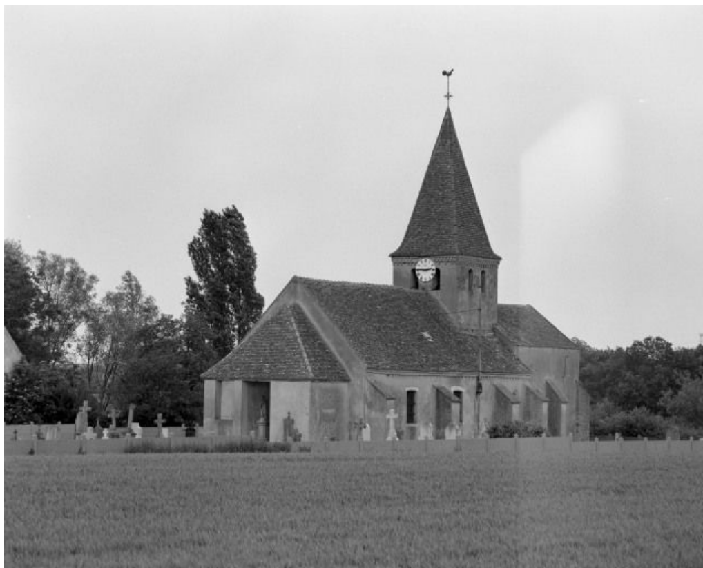
Vue d'ensemble : porche et élévation droite.