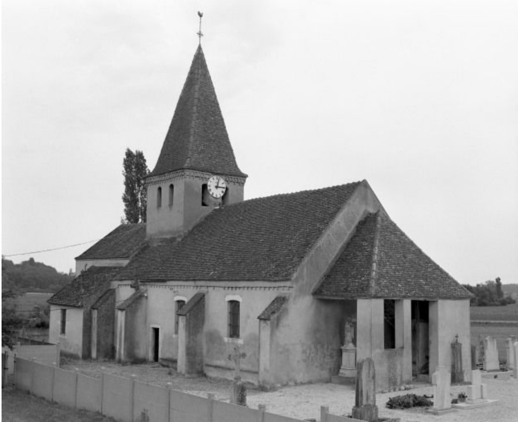
Vue d'ensemble : porche antérieur et élévation gauche.