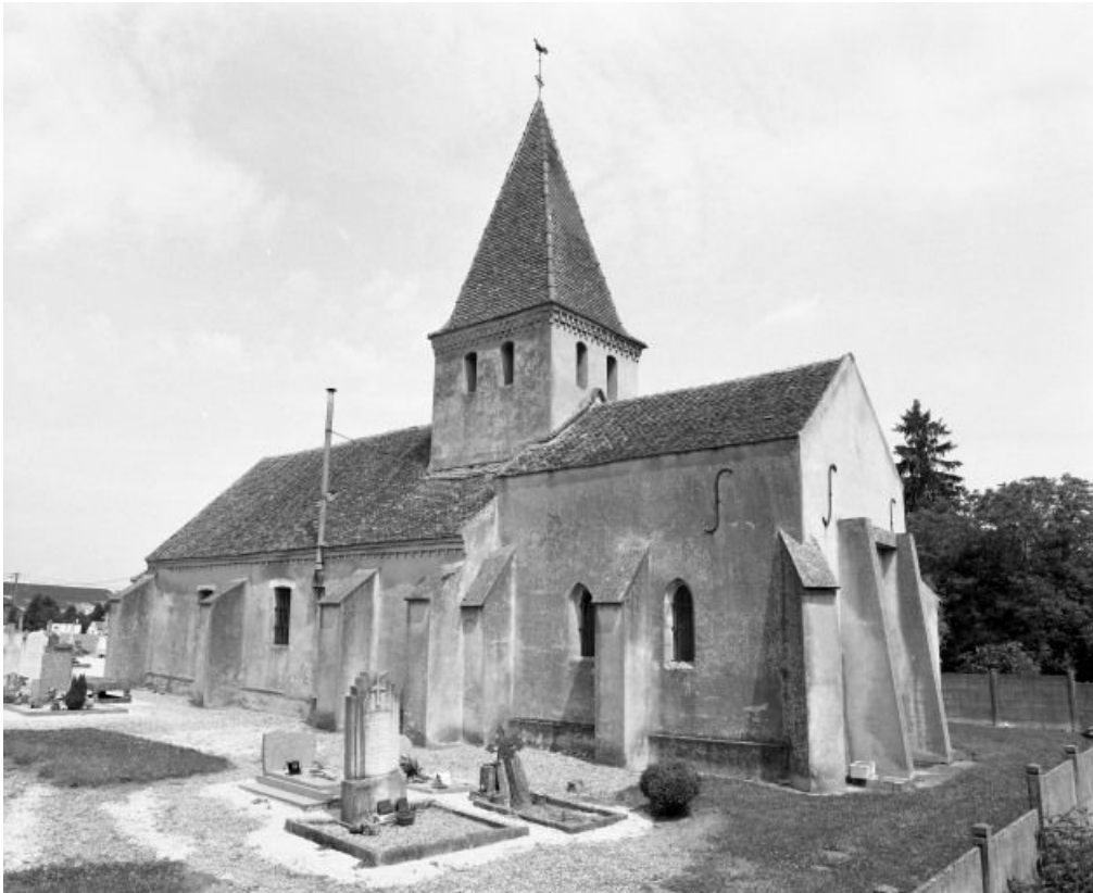
Vue d'ensemble : élévation droite et chevet.