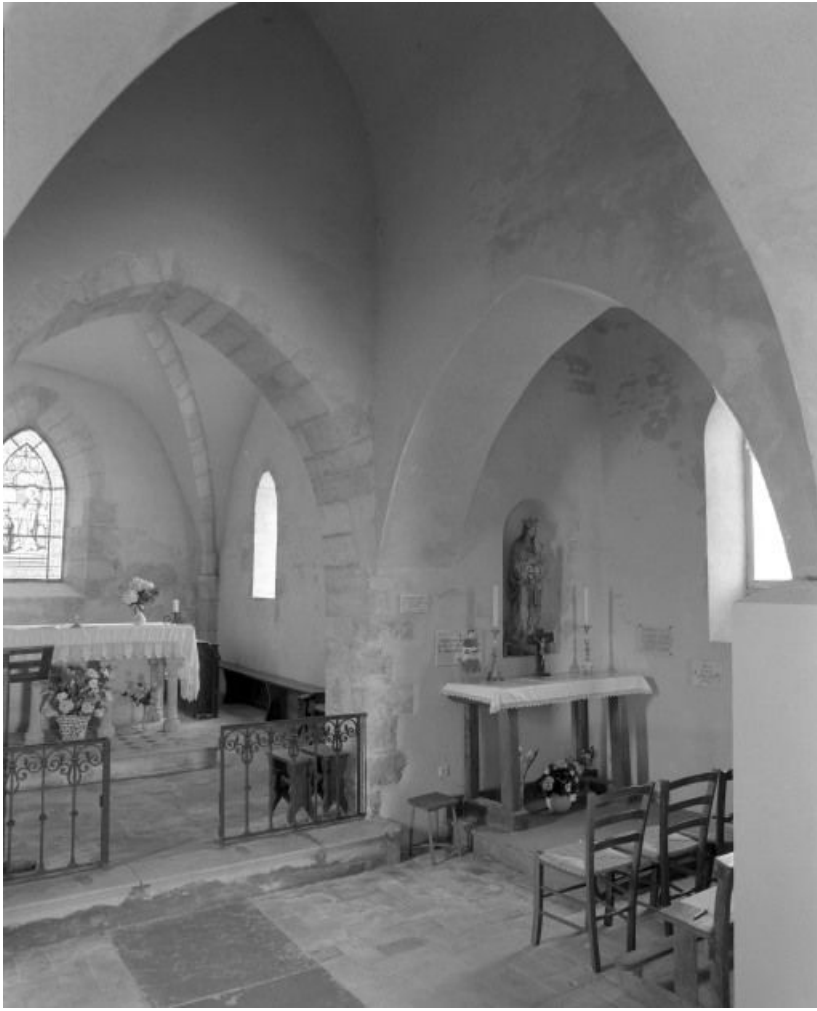
Choeur, travée sous clocher et chapelle droite.