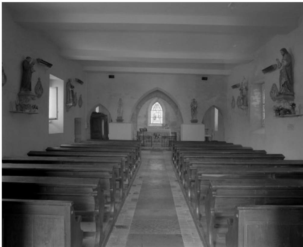
Vue d'ensemble prise de l'entrée.