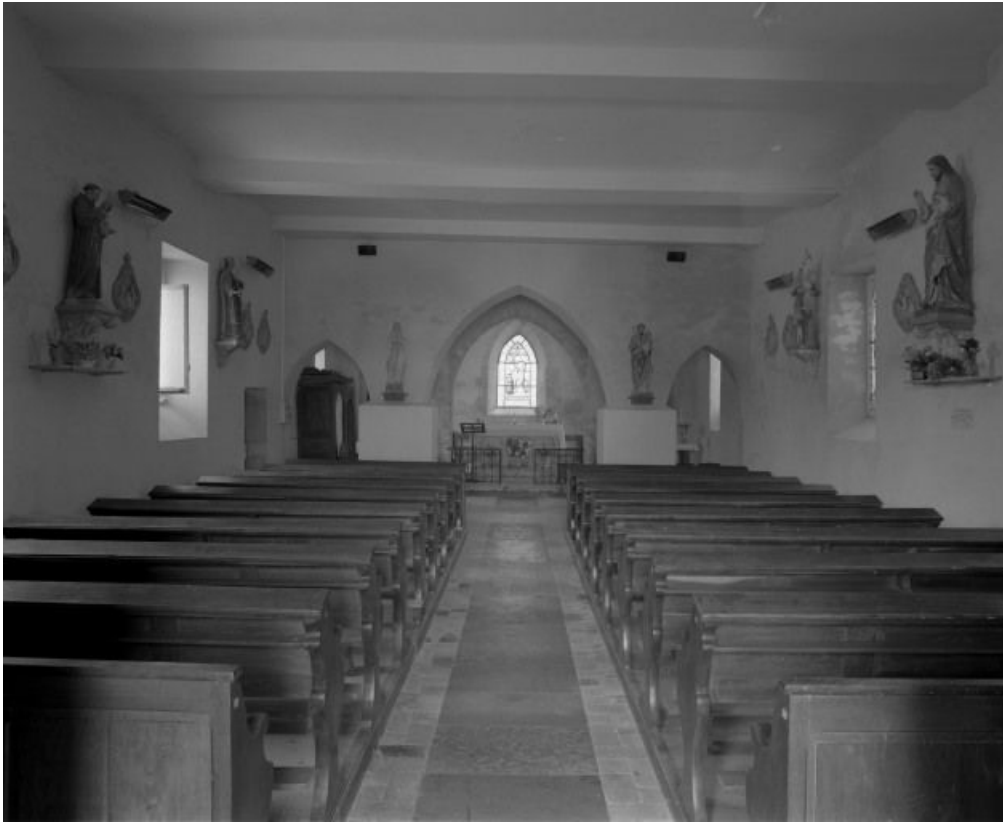
Vue d'ensemble prise de l'entrée.