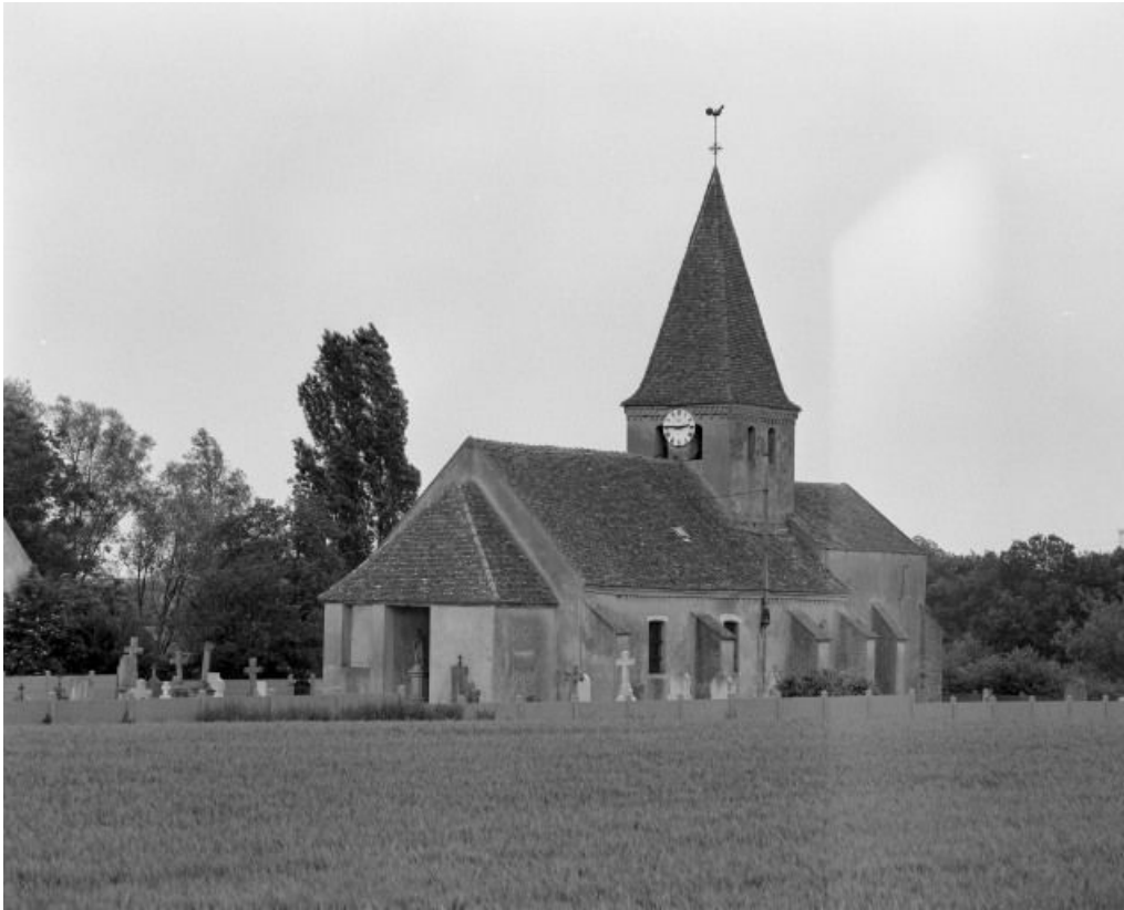
Vue d'ensemble : porche et élévation droite.