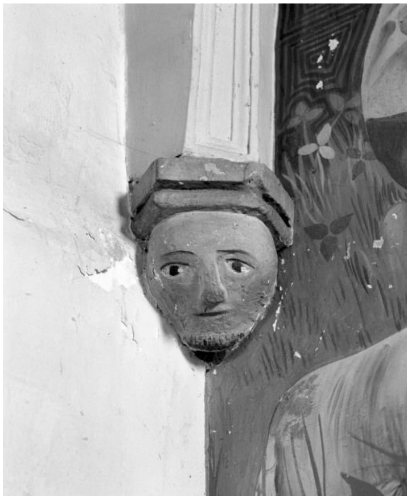
Choeur : culot postérieur gauche.