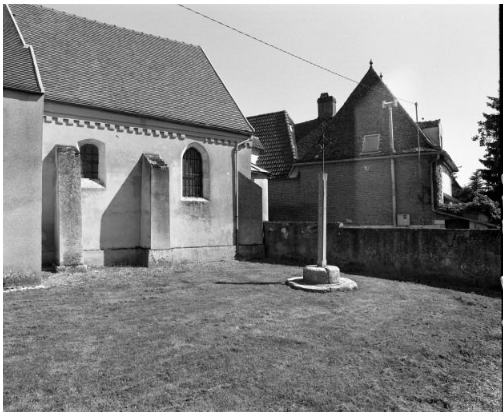
Élévation droite du chœur.