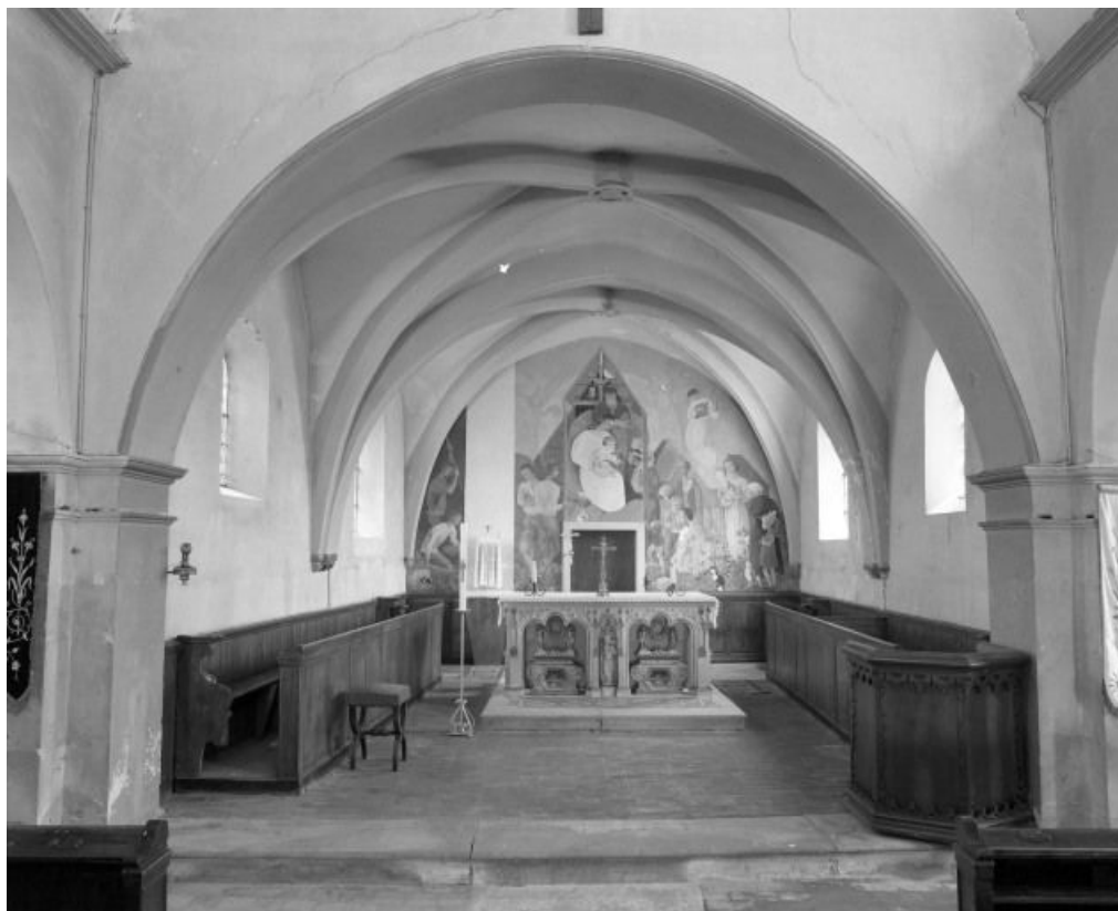
Vue rapprochée du chœur.