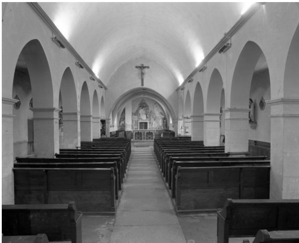
Vue d'ensemble prise de l'entrée.