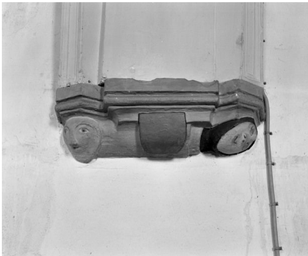
Choeur : culot central gauche.