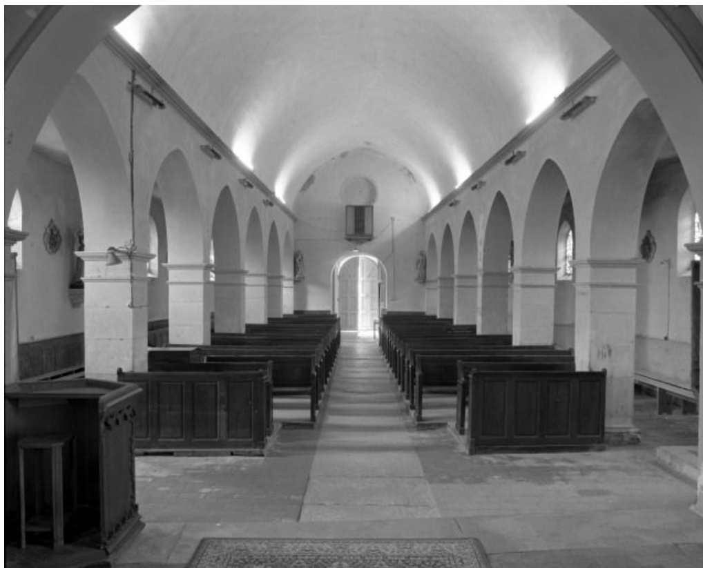
Vue d'ensemble prise du chœur.