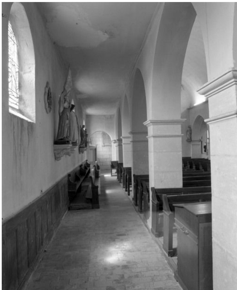
Bas-côté droit. 71, Écuellen Eglise