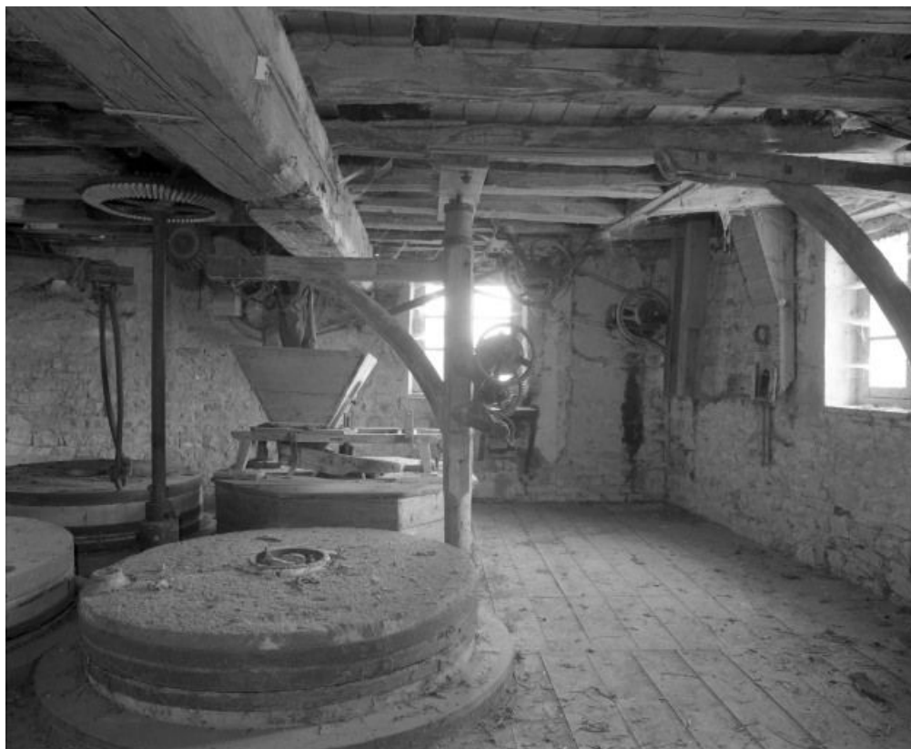
Bâtiment est : niveau supérieur, vue prise du sud.

71, Allerey-sur-Saône, lieudit : Moulin-Neuf