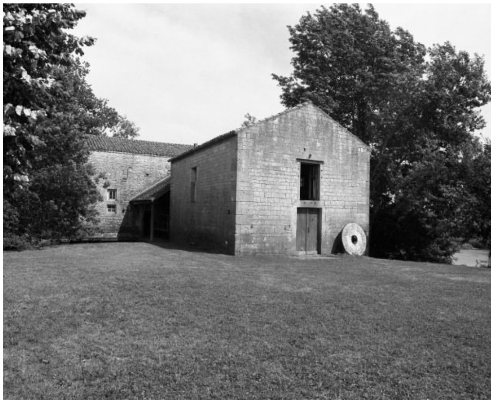
Vue du nord-ouest.

71, Allerey-sur-Saône, lieudit : Moulin-Neuf