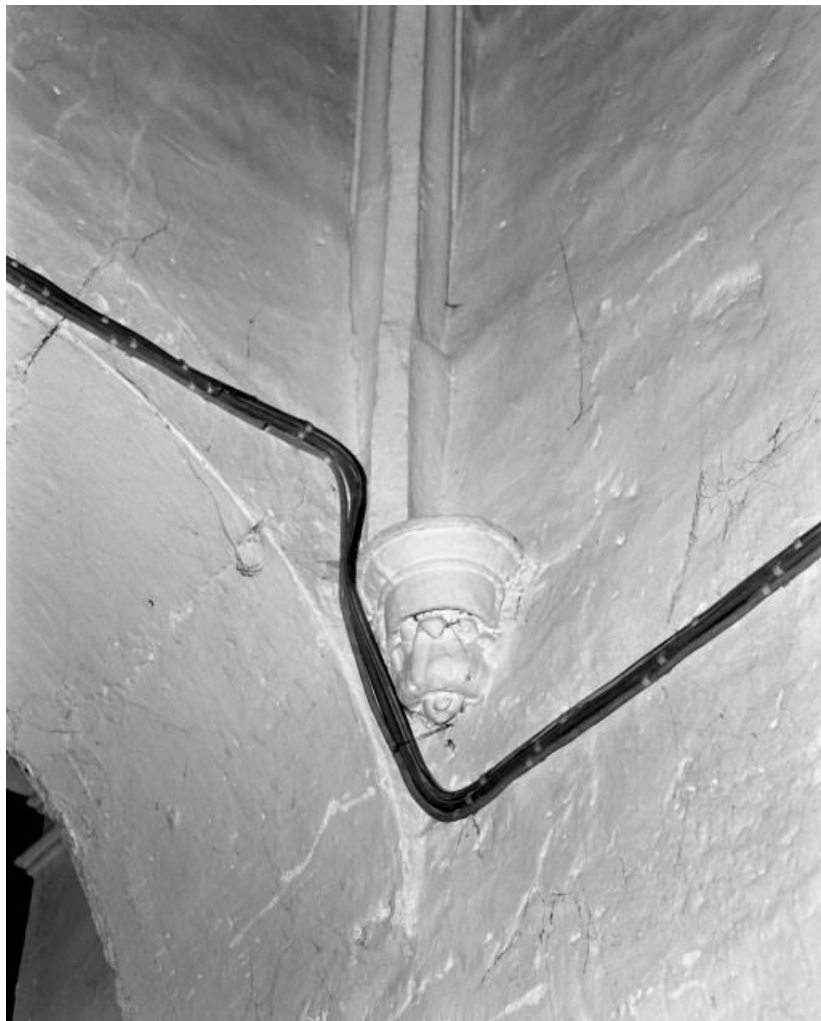
Chapelle des fonts baptismaux : culot postérieur droit.