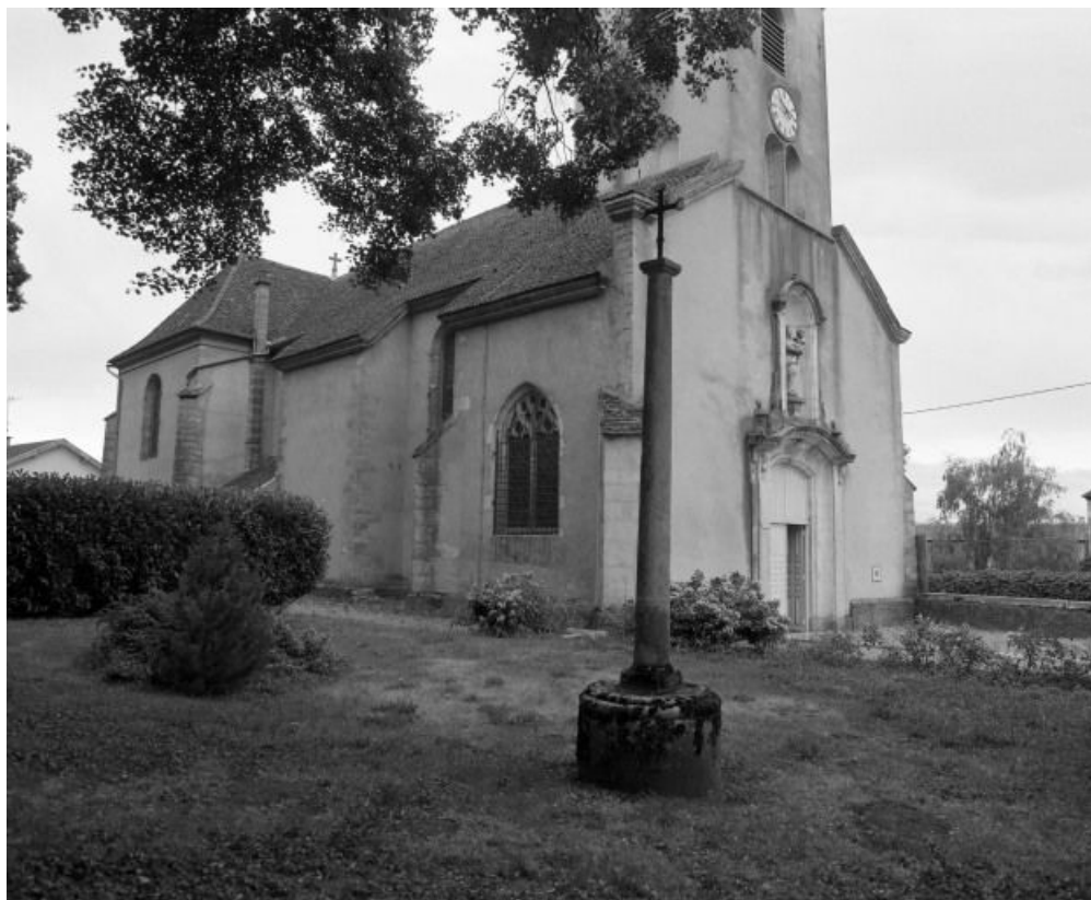
Façade et élévation gauche.