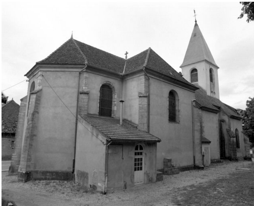
Abside, sacristie et élévation gauche.