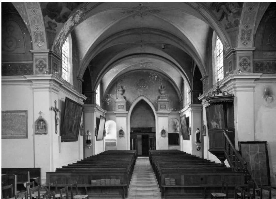
Intérieur, vue d'ensemble prise du chœur.