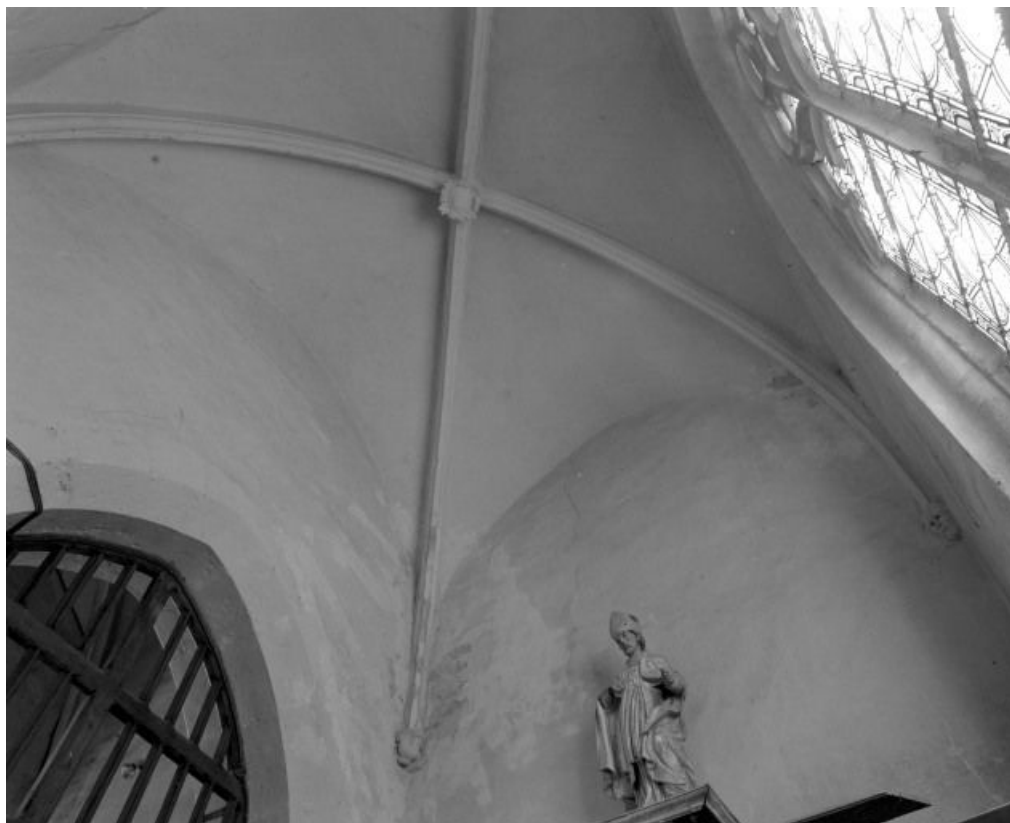
Chapelle des fonts baptismaux : voûte