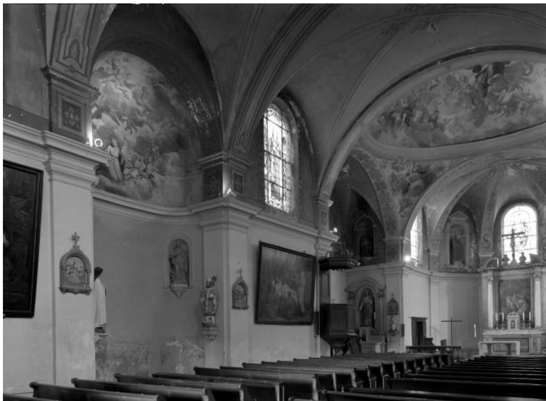
Intérieur, vue d'ensemble de trois-quarts gauche.