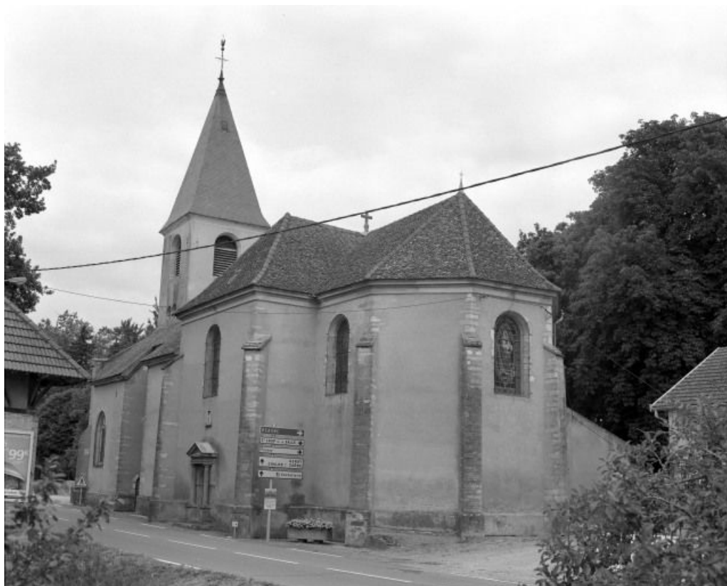
Abside et élévation droite.