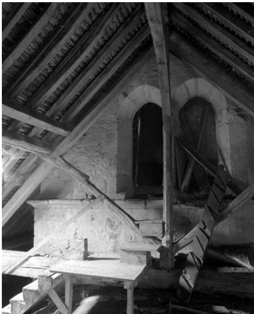
Face postérieure du clocher, vue depuis le comble de la nef.