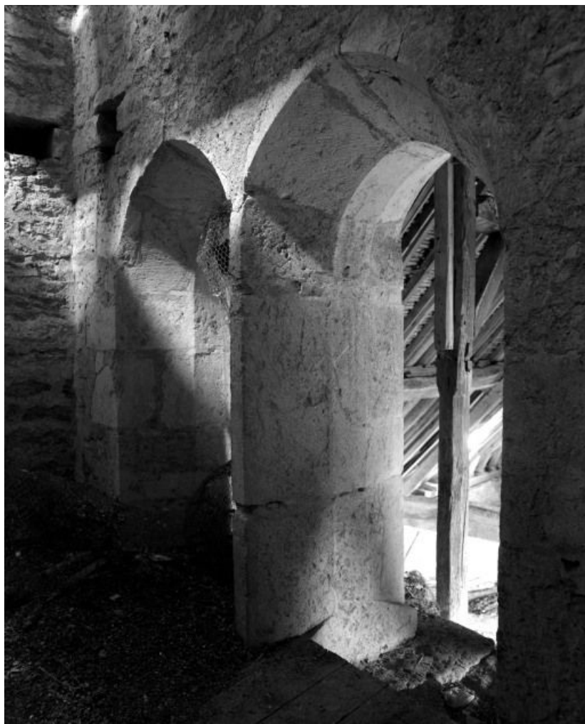
Baies postérieures du clocher, vue prise de l'intérieur.