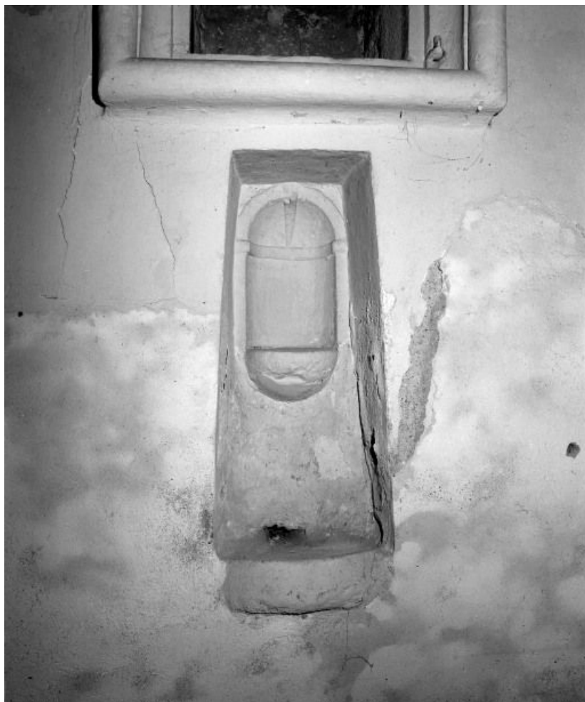
Choeur, lavabo derrière l'autel.