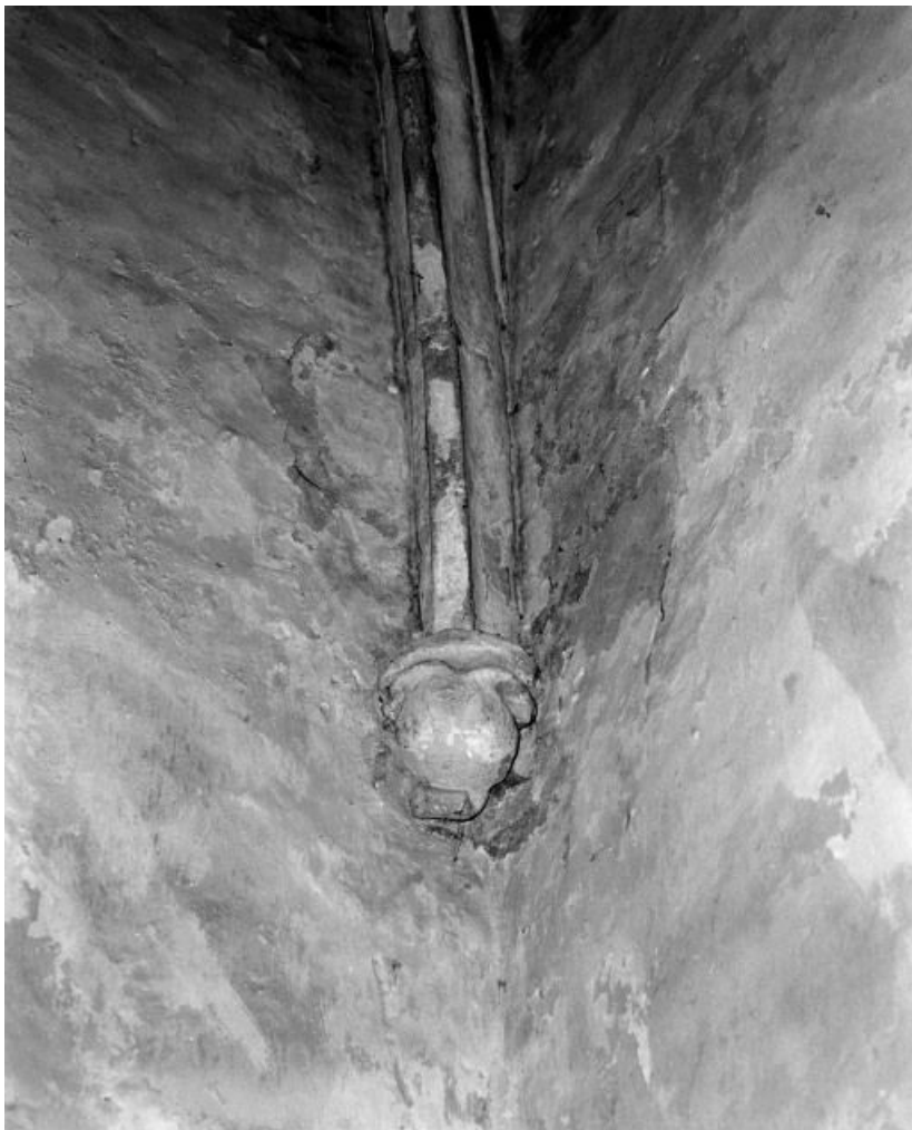
Chapelle des fonts baptismaux : culot antérieur droit.