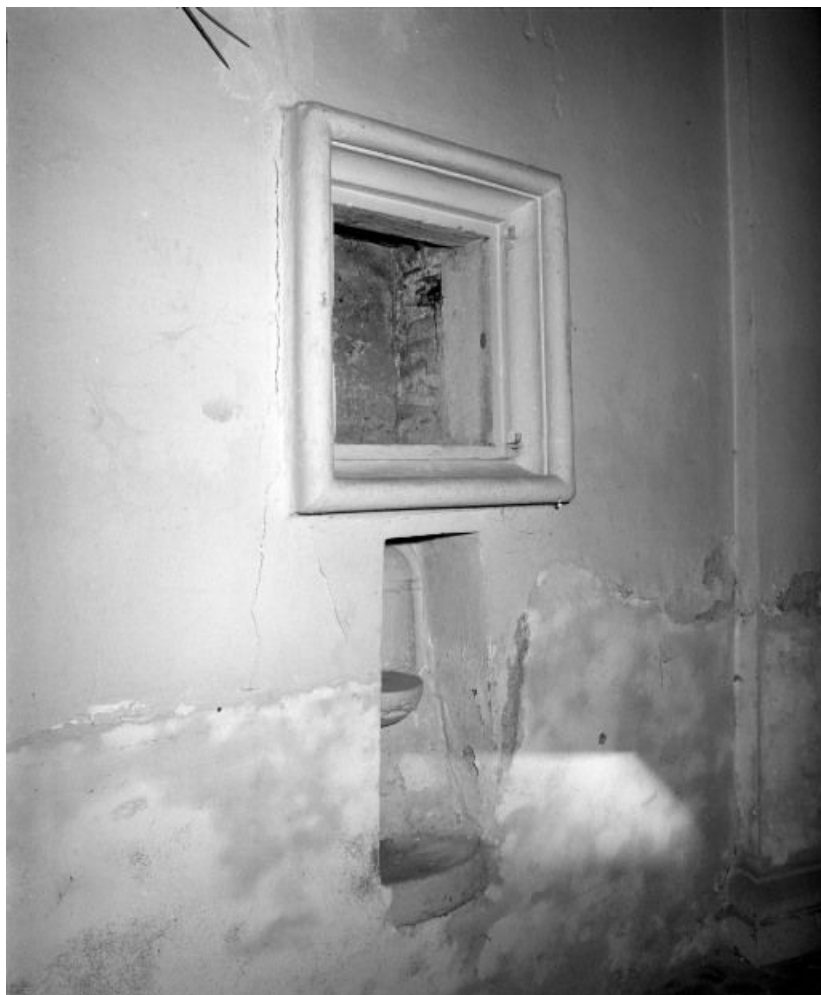
Choeur, lavabo et petite armoire derrière l'autel.