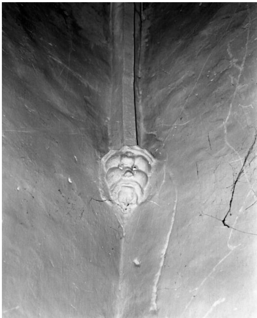
Chapelle des fonts baptismaux : culot antérieur gauche.