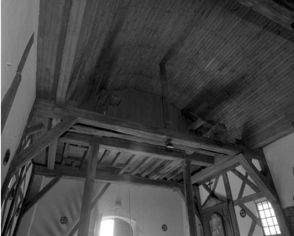
Nef, charpente soutenant le clocher.