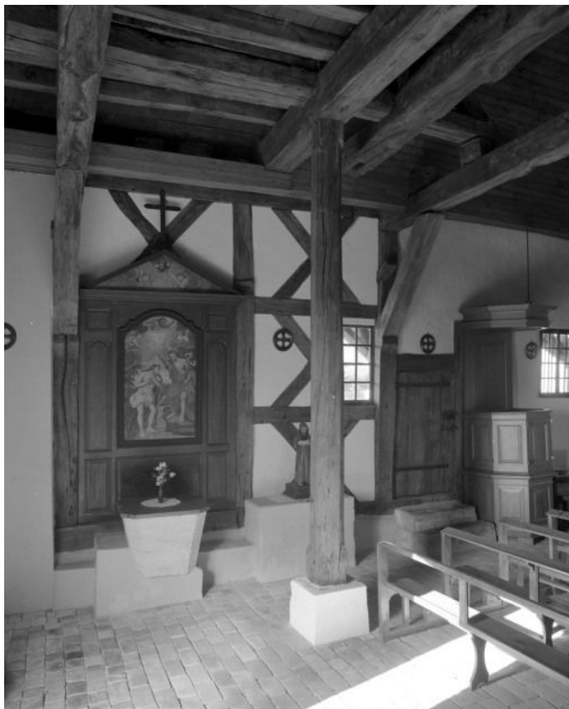
Nef, partie antérieure gauche.