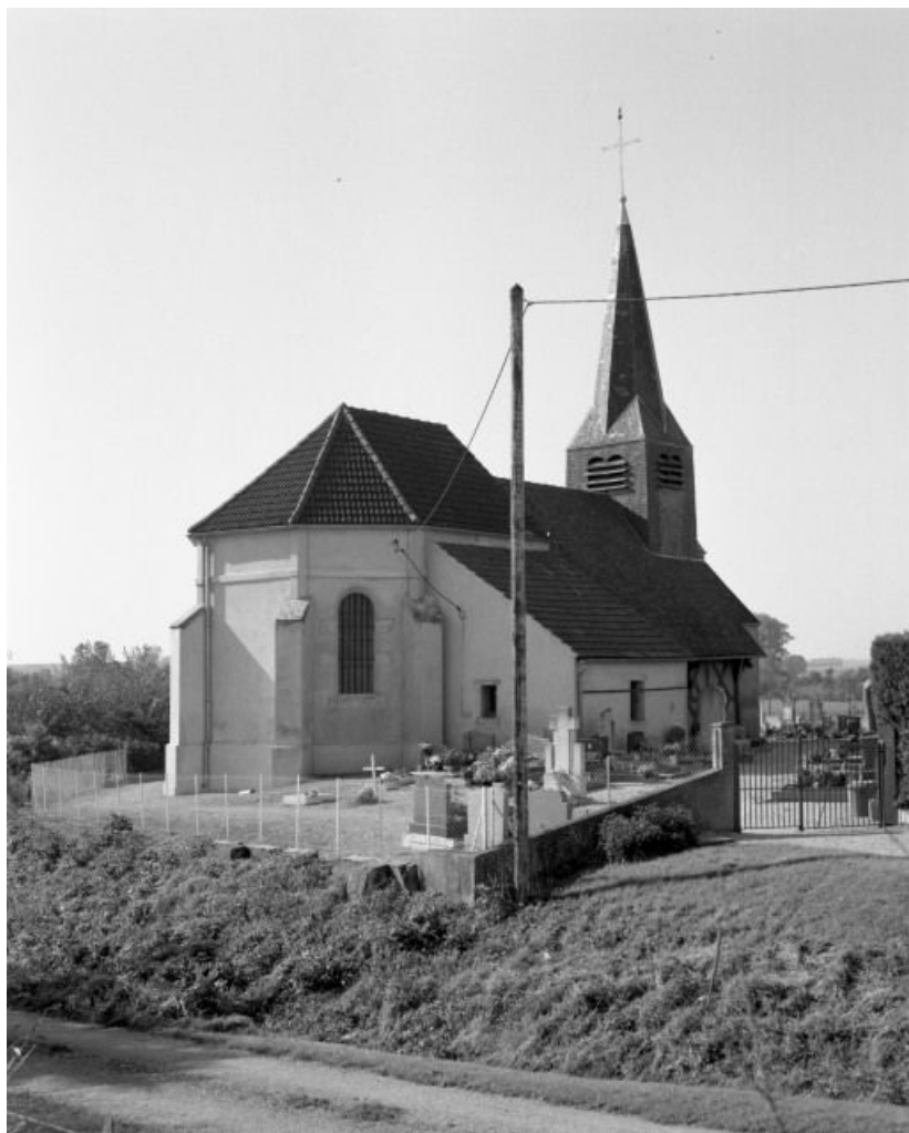
Chevet et élévation gauche.