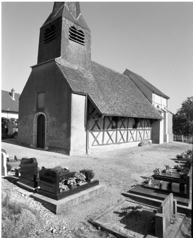
Façade et élévation droite.