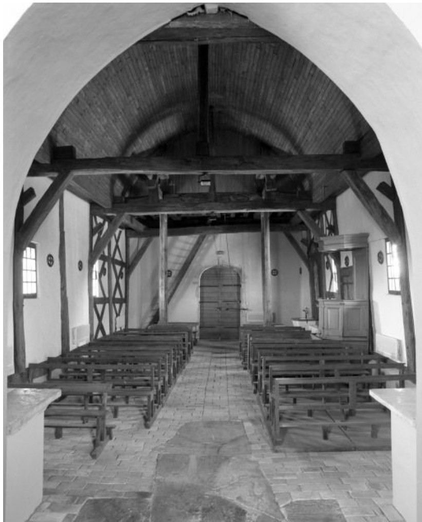
Vue d'ensemble prise du chœur.