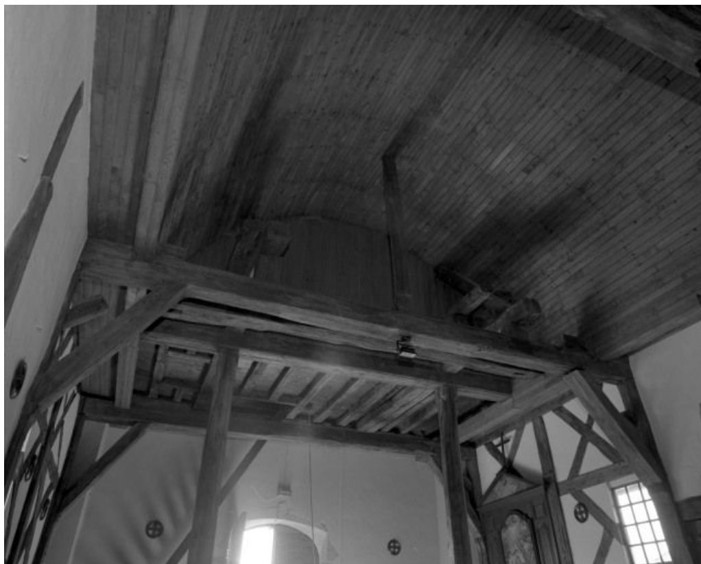
Nef, charpente soutenant le clocher.