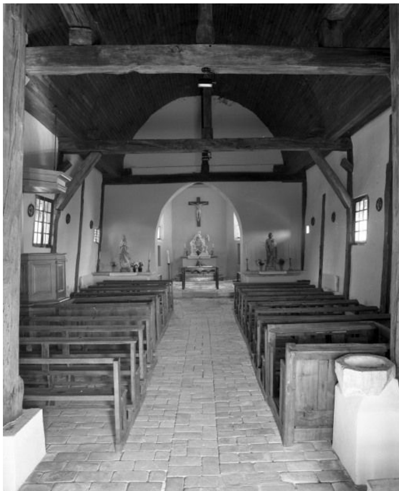
Vue d'ensemble prise de l'entrée.