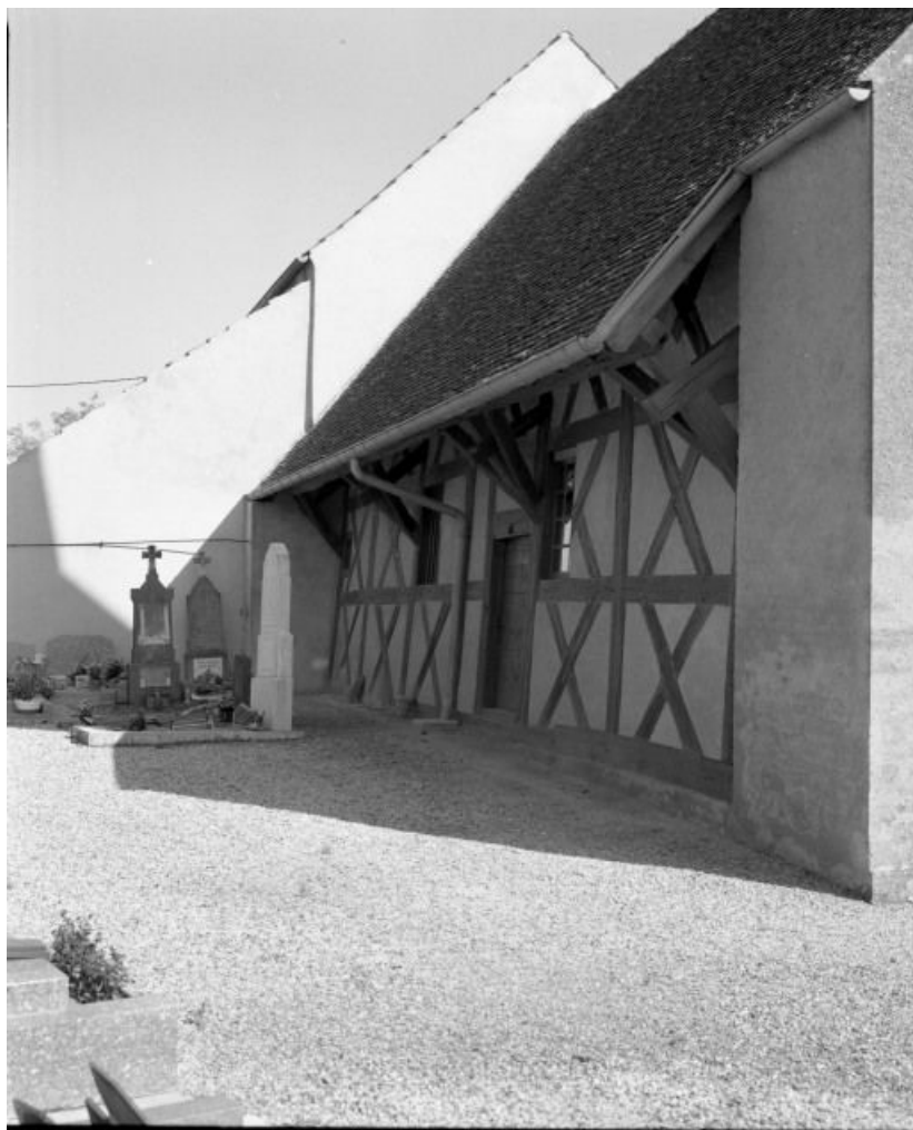
Élévation gauche de la nef.