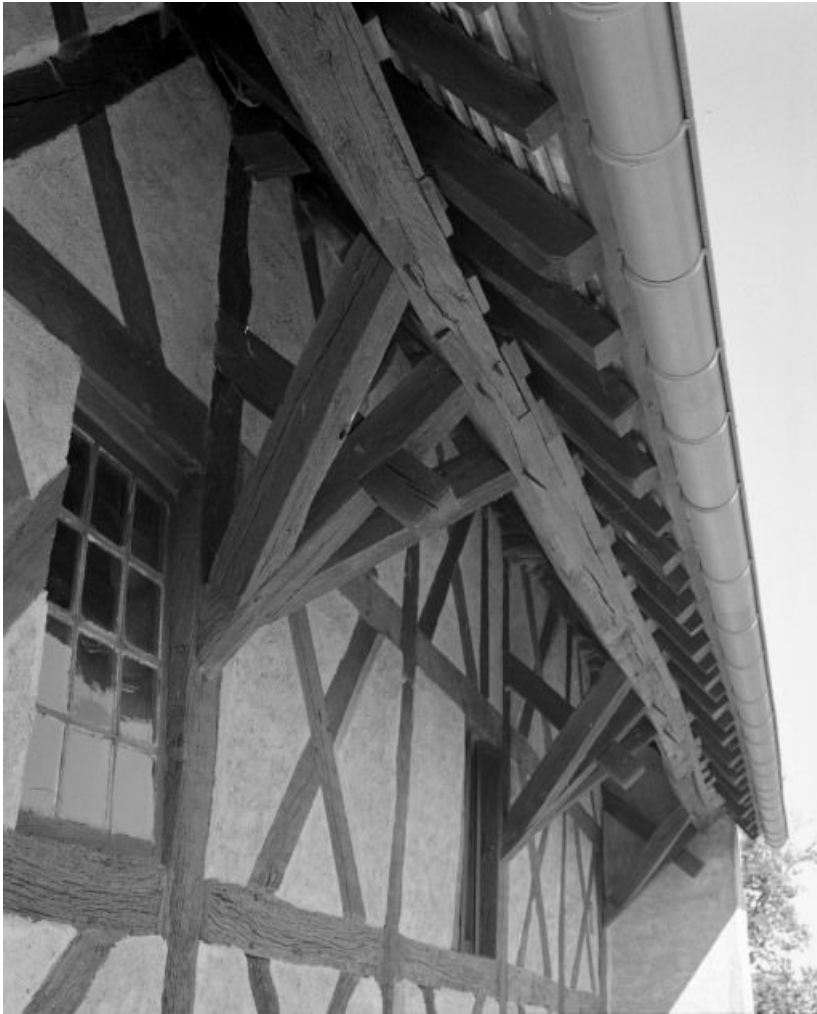
Elévation gauche de la nef, détail.