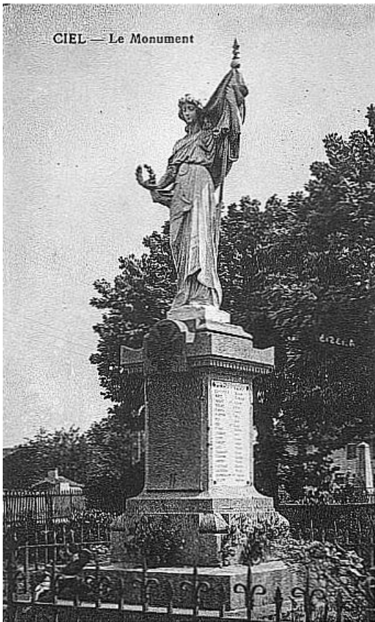
Vue d'ensemble, carte postale ancienne, éd. Bourgeois Frères. 71, Ciel C.D. 970