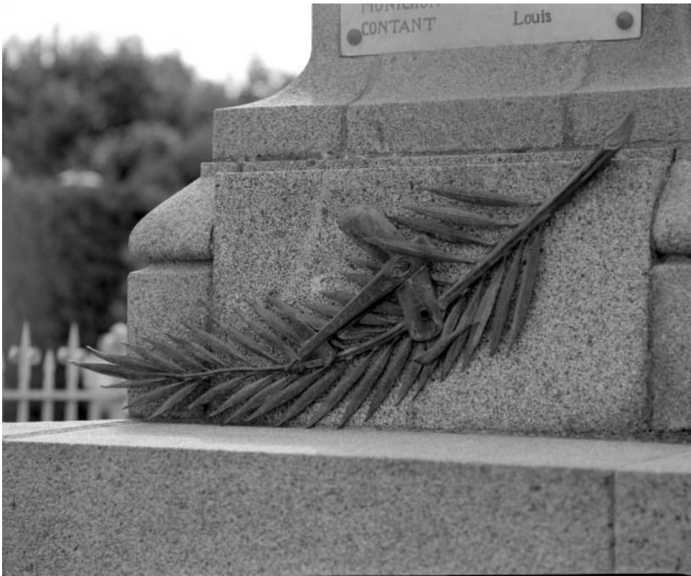
Détail du piédestal.