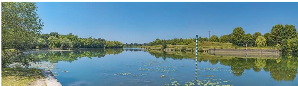
La Saône à hauteur de l'ancien barrage, depuis la rive gauche.

71, Les Bordes rue de l' Ile, lieudit : PK 167,5