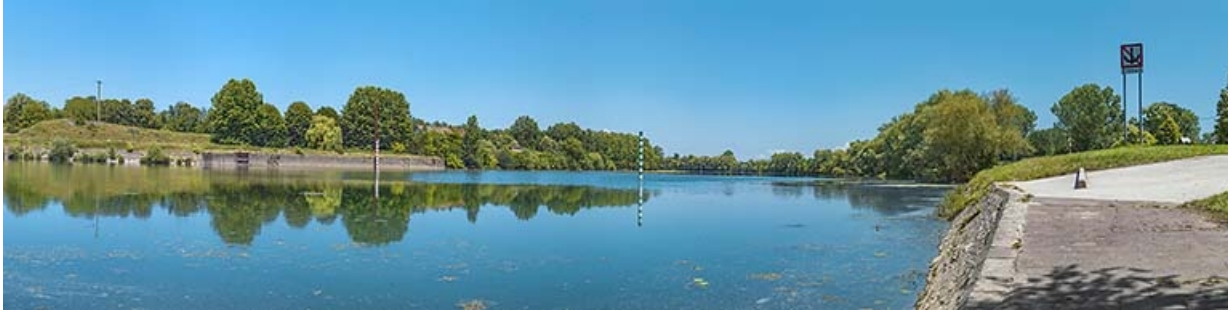
La Saône à hauteur de l'ancien barrage, en aval de la culée rive gauche.

71, Les Bordes rue de l' Ile, lieudit : PK 167,5