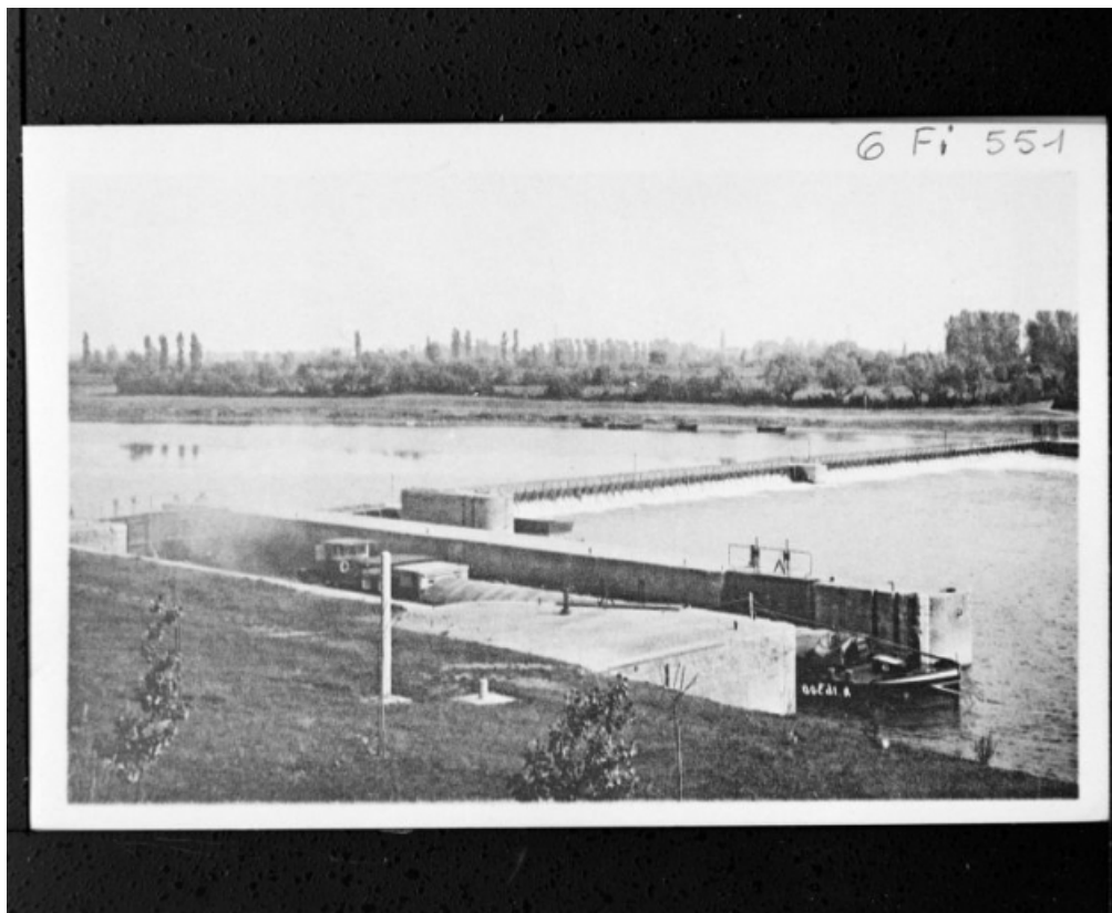
Petite écluse et barrage, carte postale ancienne, imp. Bourgeois Ch. s.s. 71, Les Bordes rue de l' Ile, lieudit : PK 167,5