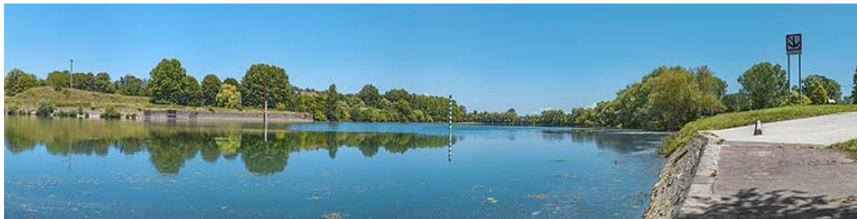
La Saône à hauteur de l'ancien barrage, en aval de la culée rive gauche.

71, Les Bordes rue de l' Ile, lieudit : PK 167,5