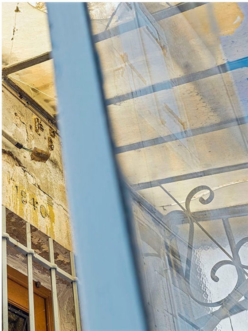
Détail de la marquise et du linteau de la porte d'entrée.

71, Les Bordes rue de l' Ile, lieudit : PK 167,5