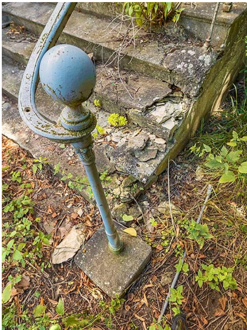
Départ de rampe de l'escalier de la maison éclusière.

71, Les Bordes rue de l' Ile, lieudit : PK 167,5