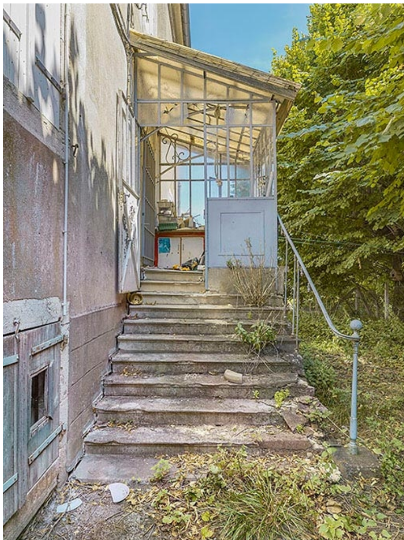
Escalier d'entrée de la maison éclusière.

71, Les Bordes rue de l' Ile, lieudit : PK 167,5