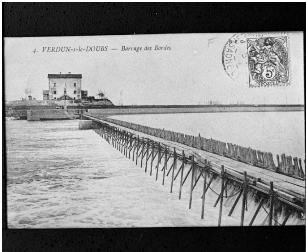
Barrage des Bordes, carte postale ancienne.

71, Les Bordes rue de l' Ile, lieudit : PK 167,5