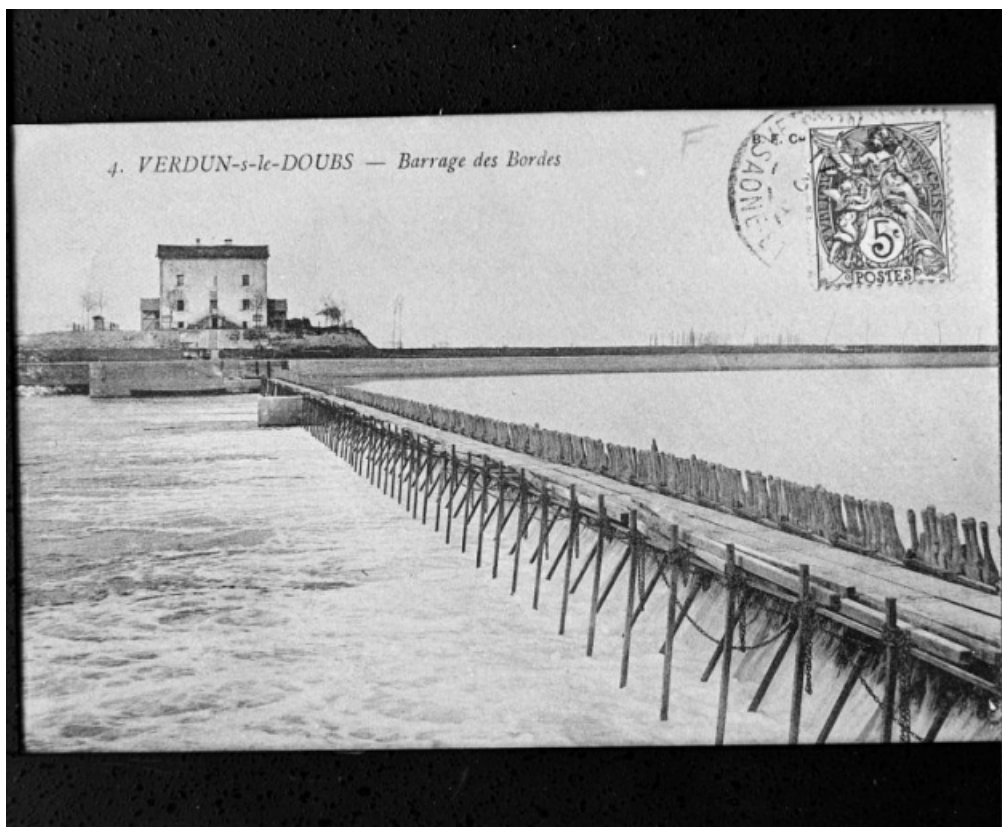
Barrage des Bordes, carte postale ancienne.

71, Les Bordes rue de l' Ile, lieudit : PK 167,5