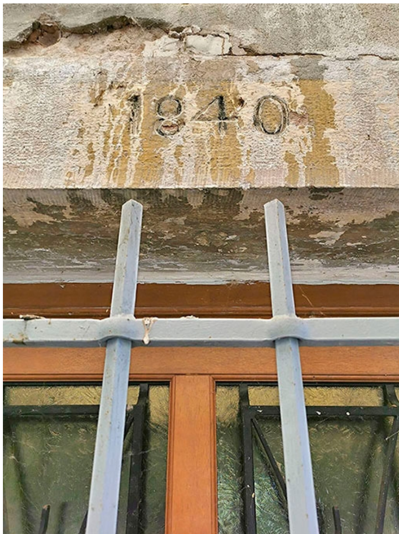
Détail de la date portée sur le linteau de la porte d'entrée.

71, Les Bordes rue de l' Ile, lieudit : PK 167,5