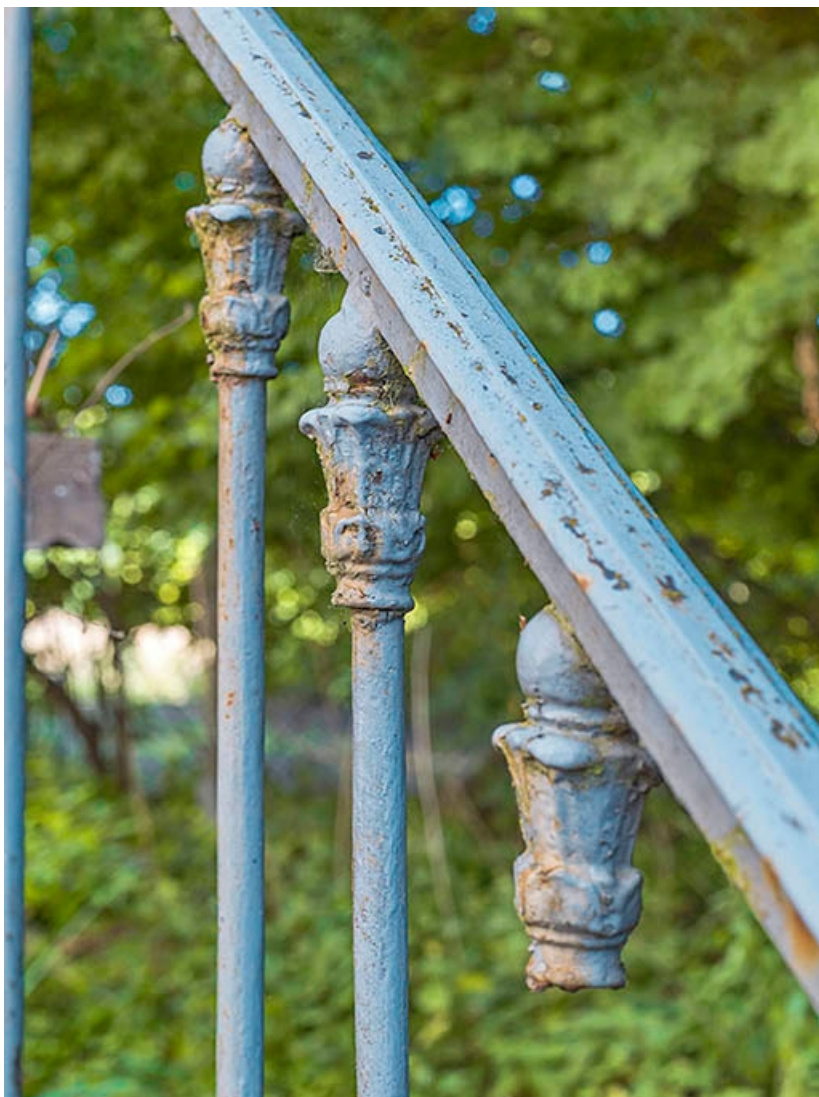
Détail des balustres du garde-corps de l'escalier.

71, Les Bordes rue de l' Ile, lieudit : PK 167,5