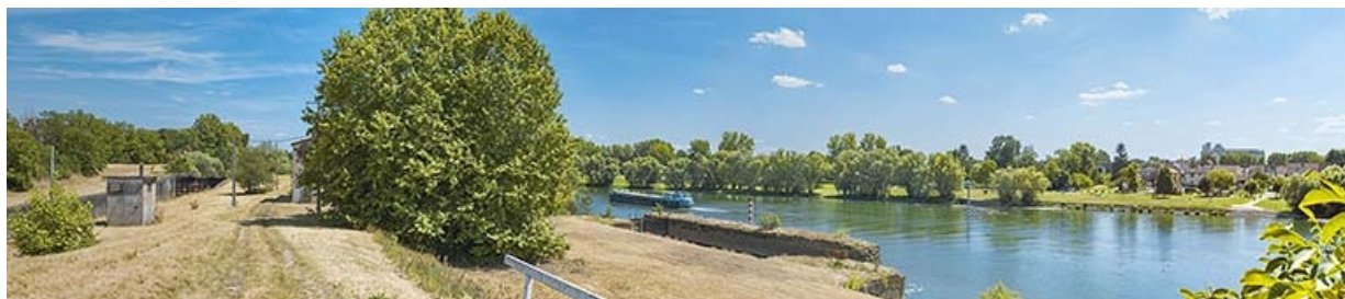
Vue panoramique de la Saône à hauteur de l'ancien barrage des Bordes, depuis la rive droite.

71, Les Bordes rue de l' Ile, lieudit : PK 167,5