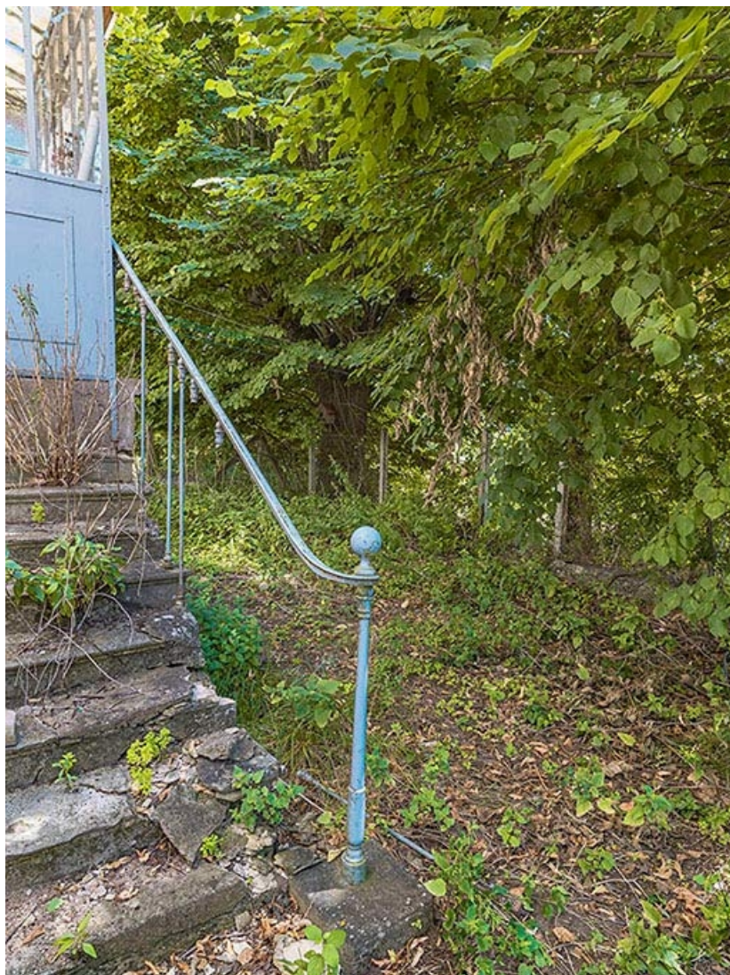
Départ de rampe de l'escalier de la maison éclusière.

71, Les Bordes rue de l' Ile, lieudit : PK 167,5