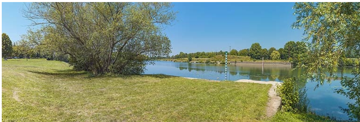
Culée de l'ancien barrage sur la rive gauche. On peut lire la tracé de l'ancien barrage jusqu'à l'ancienne écluse, rive droite. 71, Les Bordes rue de l' Ile, lieudit : PK 167,5