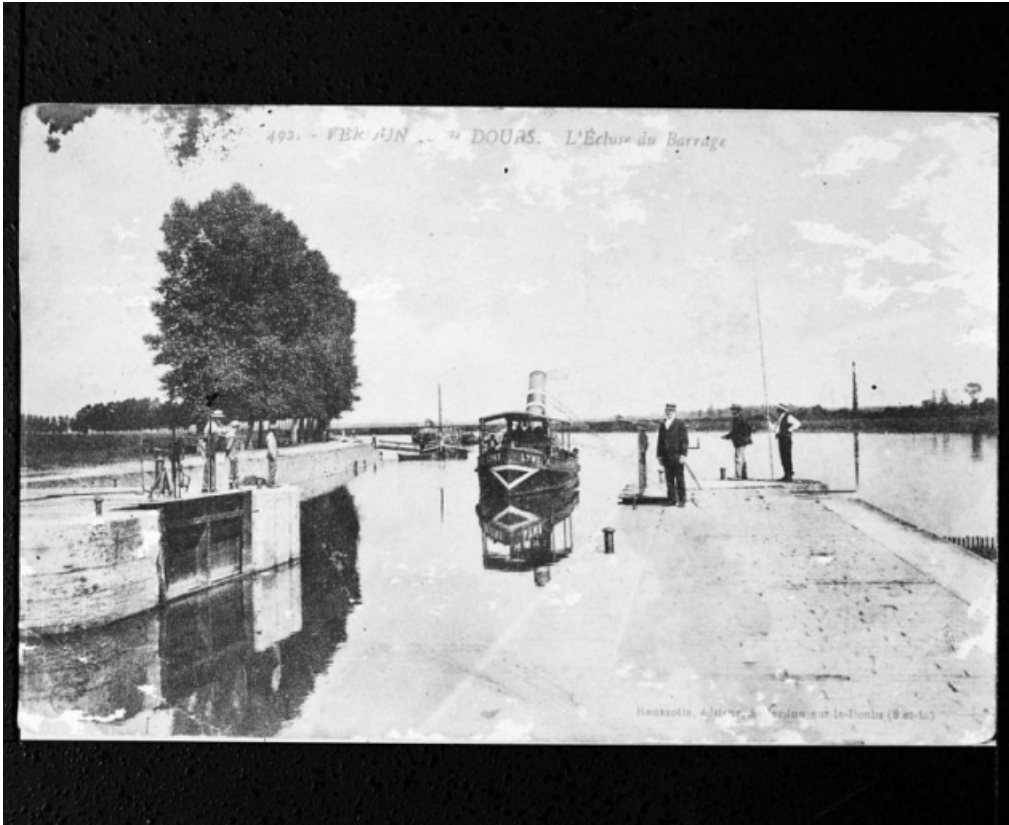
L'écluse du barrage, carte postale ancienne.

71, Les Bordes rue de l' Ile, lieudit : PK 167,5