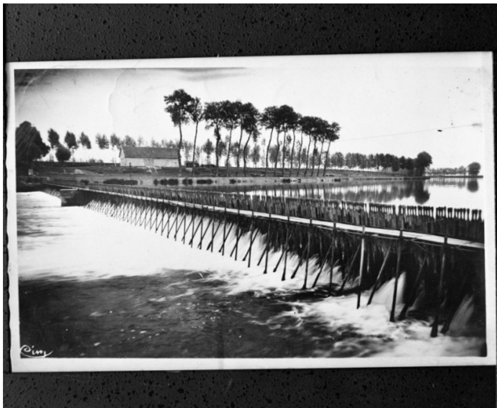
Barrage des Bordes, carte postale ancienne datée 1949 par le cachet de la poste. 71, Les Bordes rue de l' Ile, lieudit : PK 167,5