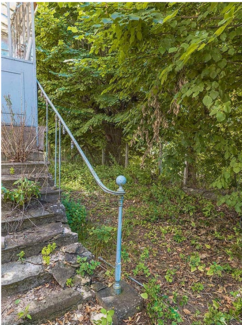
Départ de rampe de l'escalier de la maison éclusière.

71, Les Bordes rue de l' Ile, lieudit : PK 167,5