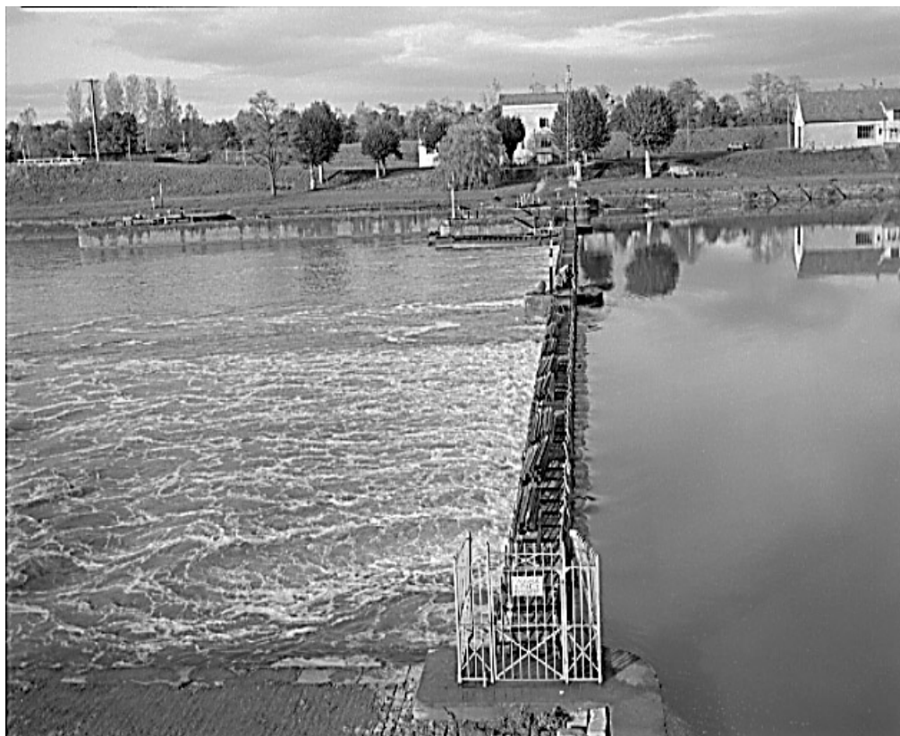
Vue d'ensemble du barrage (en 1986).

71, Les Bordes rue de l' Ile, lieudit : PK 167,5