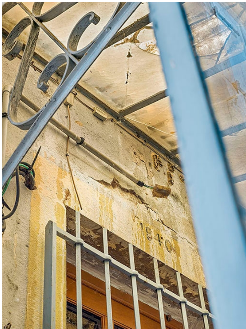
Détail de la marquise et du linteau de la porte d'entrée.

71, Les Bordes rue de l' Ile, lieudit : PK 167,5