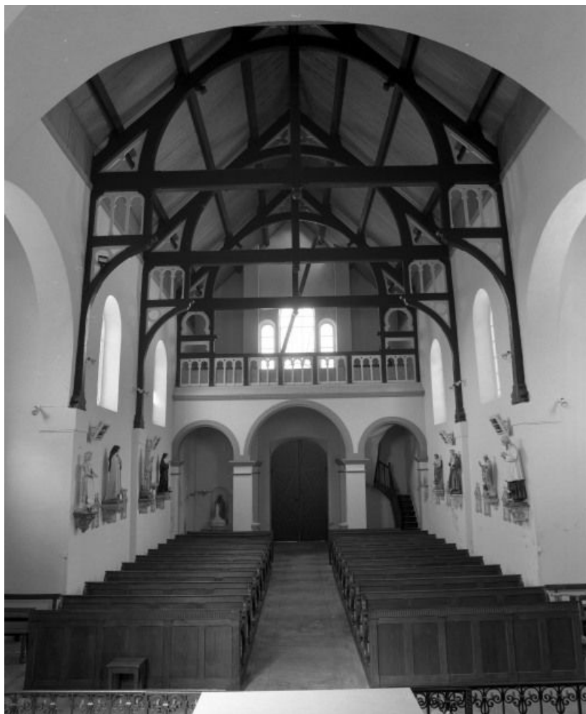
Vue d'ensemble prise du chœur.