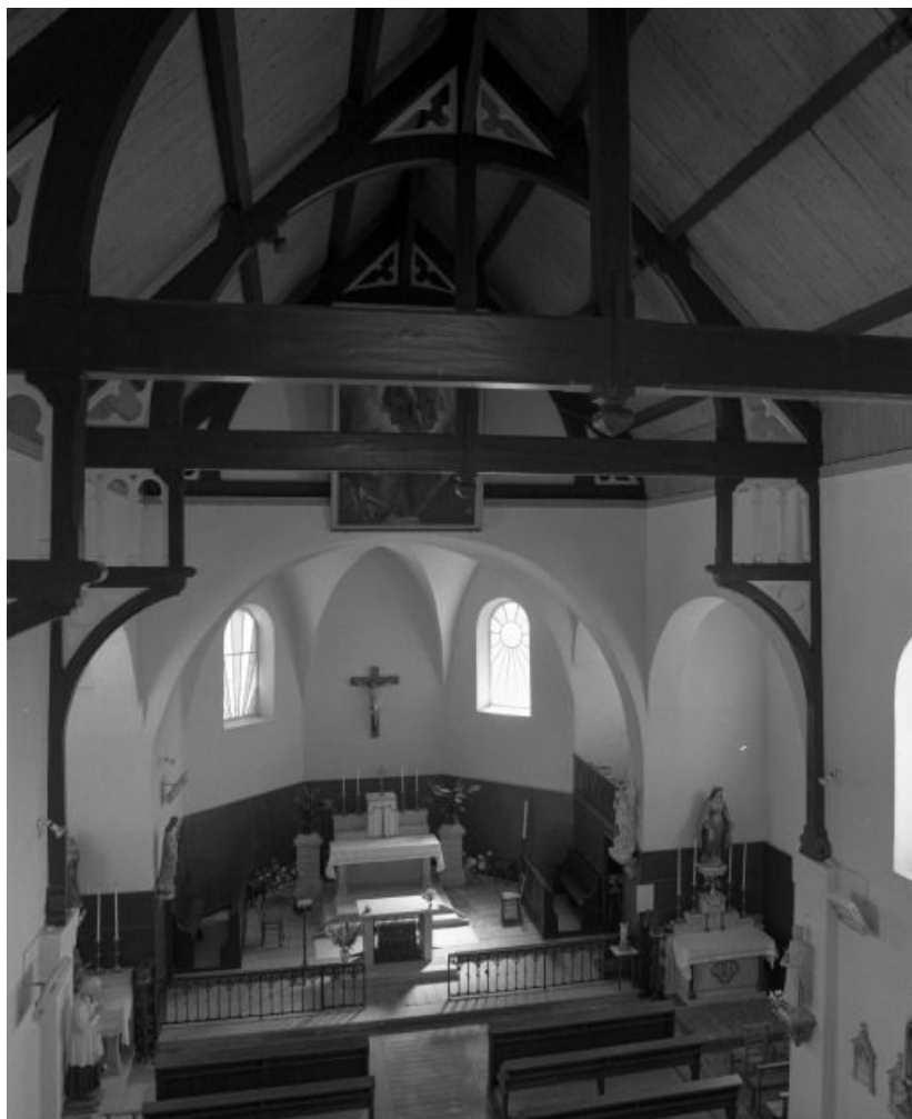
Vue du chœur depuis la tribune.