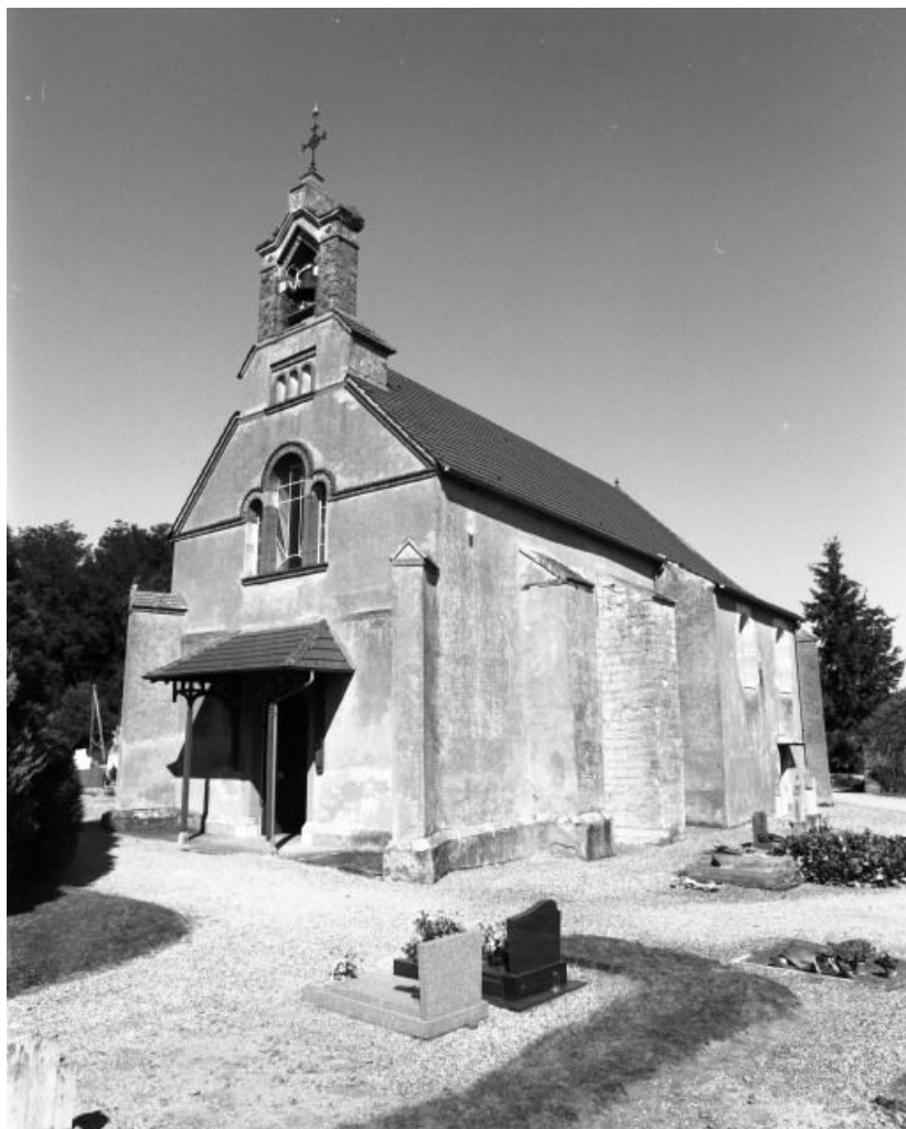
Façade et élévation droite.