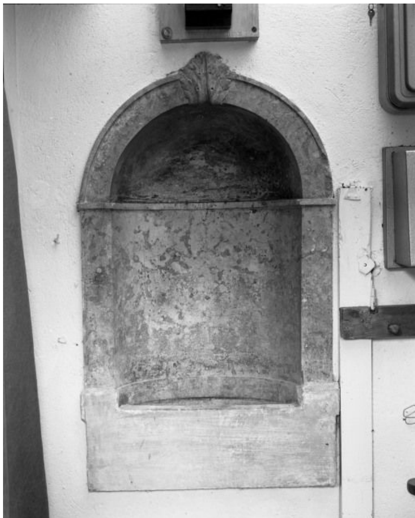
Lavabo de la sacristie.