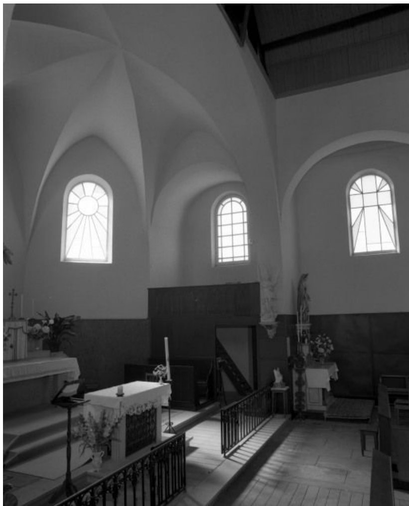
Choeur, mur droit.