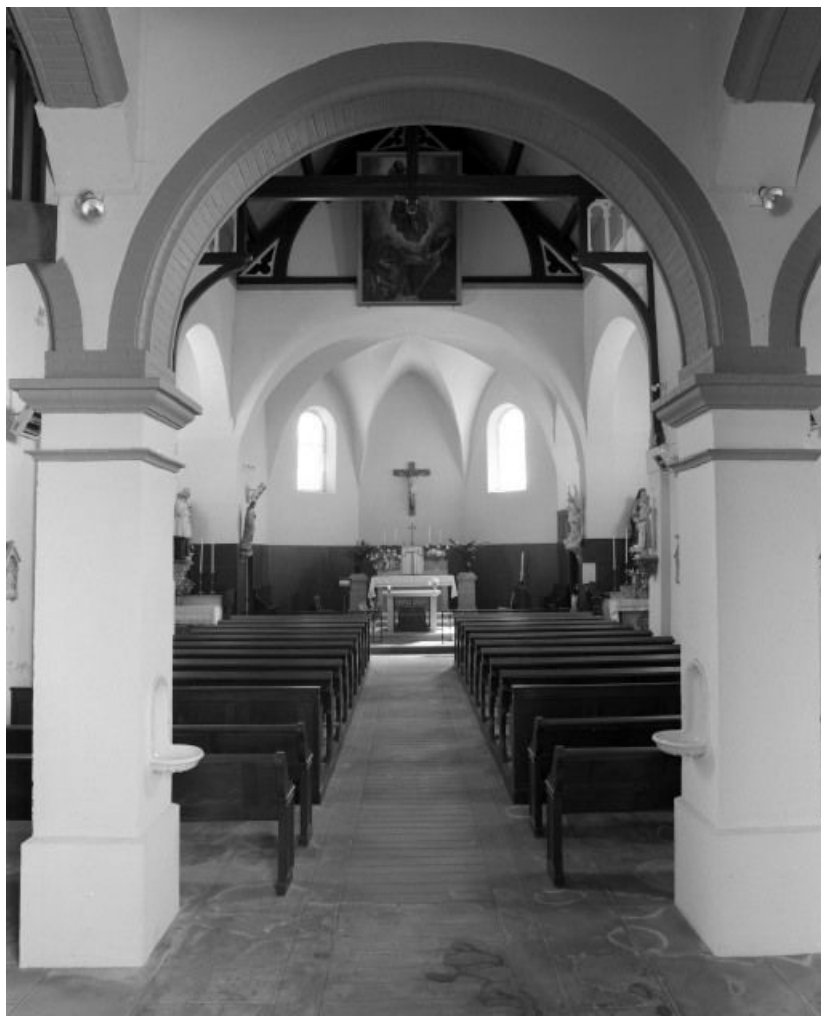
Vue d'ensemble prise de l'entrée.