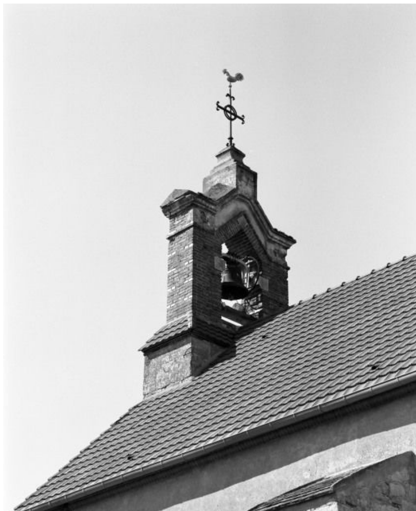
Clocher-mur, face postérieure.