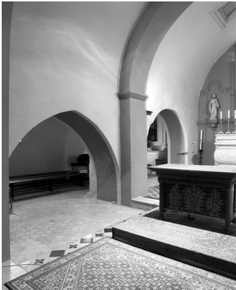
Choeur, mur gauche.