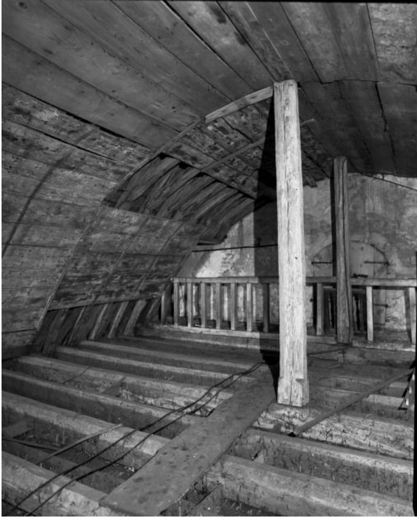
Comble de la nef, vue prise depuis le revers de façade.