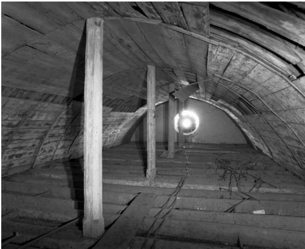
Comble de la nef, vue prise depuis le clocher.