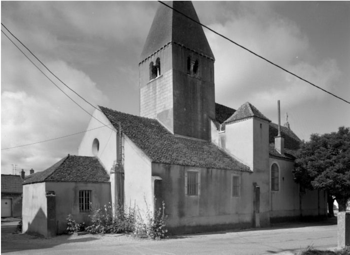
Chevet et élévation gauche.