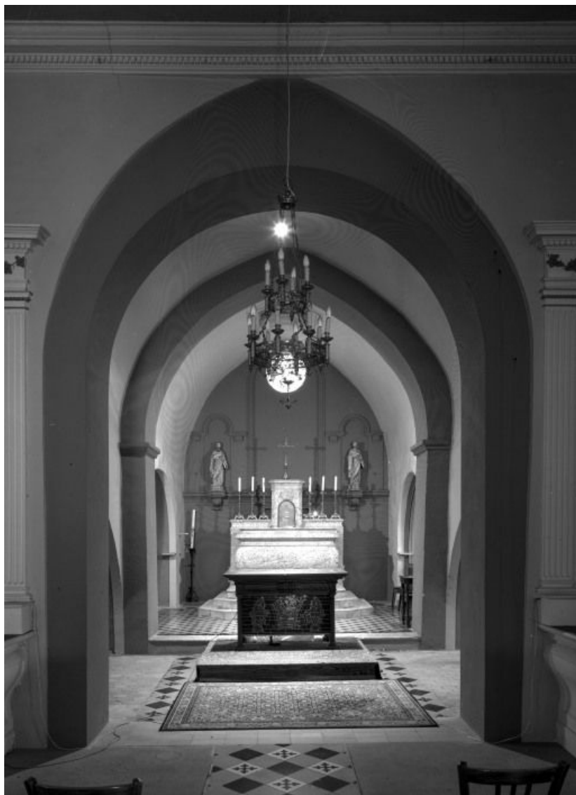
Chœur 71, Verjux Eglise