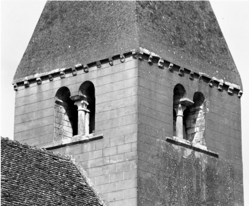
Clocher, détail des baies.