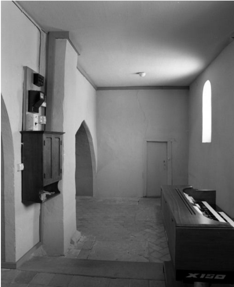
Chapelle droite, vue prise de l'autel.