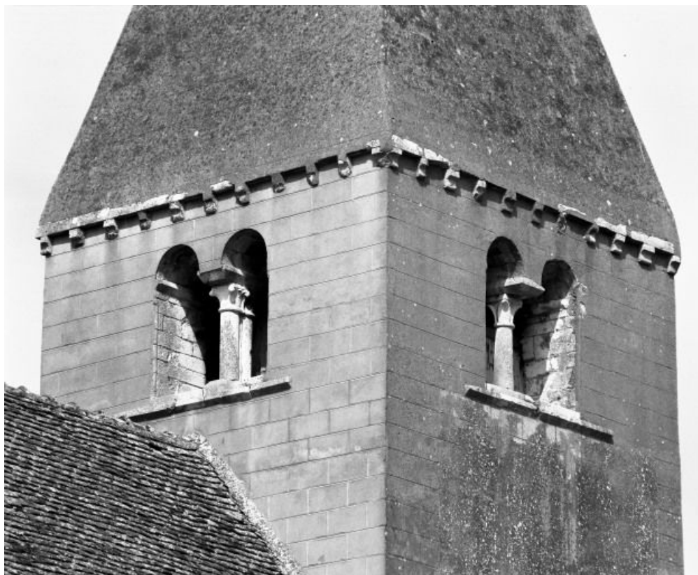
Clocher, détail des baies.