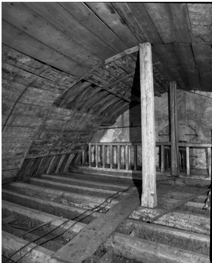
Comble de la nef, vue prise depuis le revers de façade.