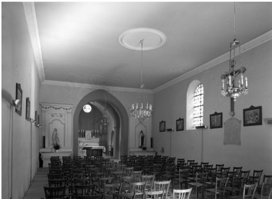
Vue d'ensemble depuis l'entrée.