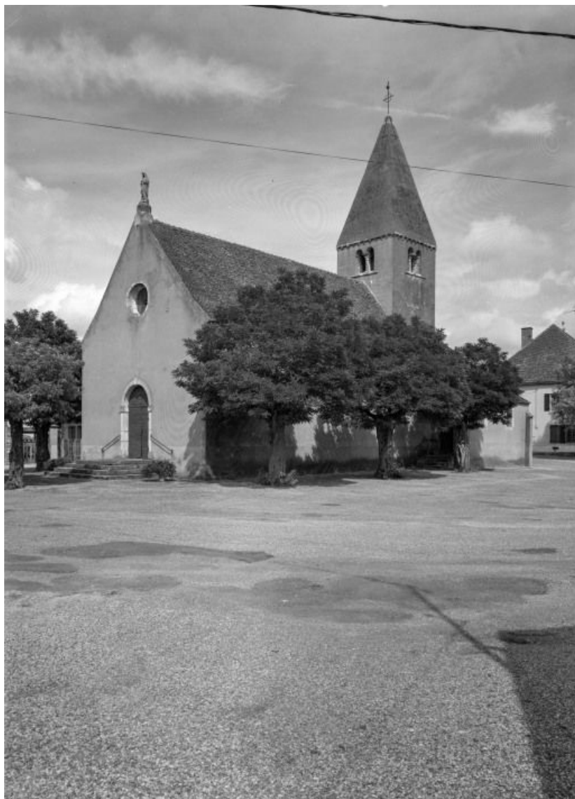
Façade et élévation droite.