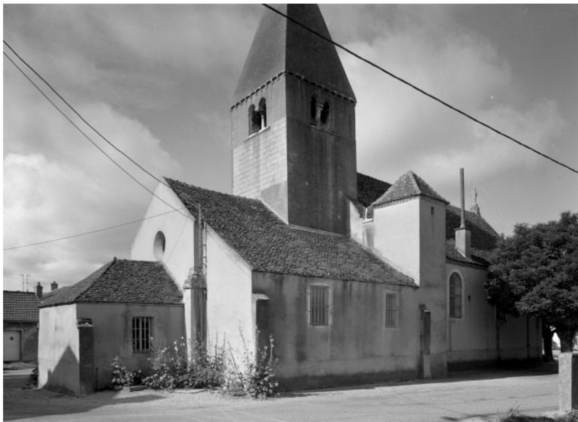
Chevet et élévation gauche.