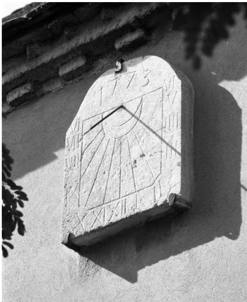
Élévation droite, détail du cadran solaire.