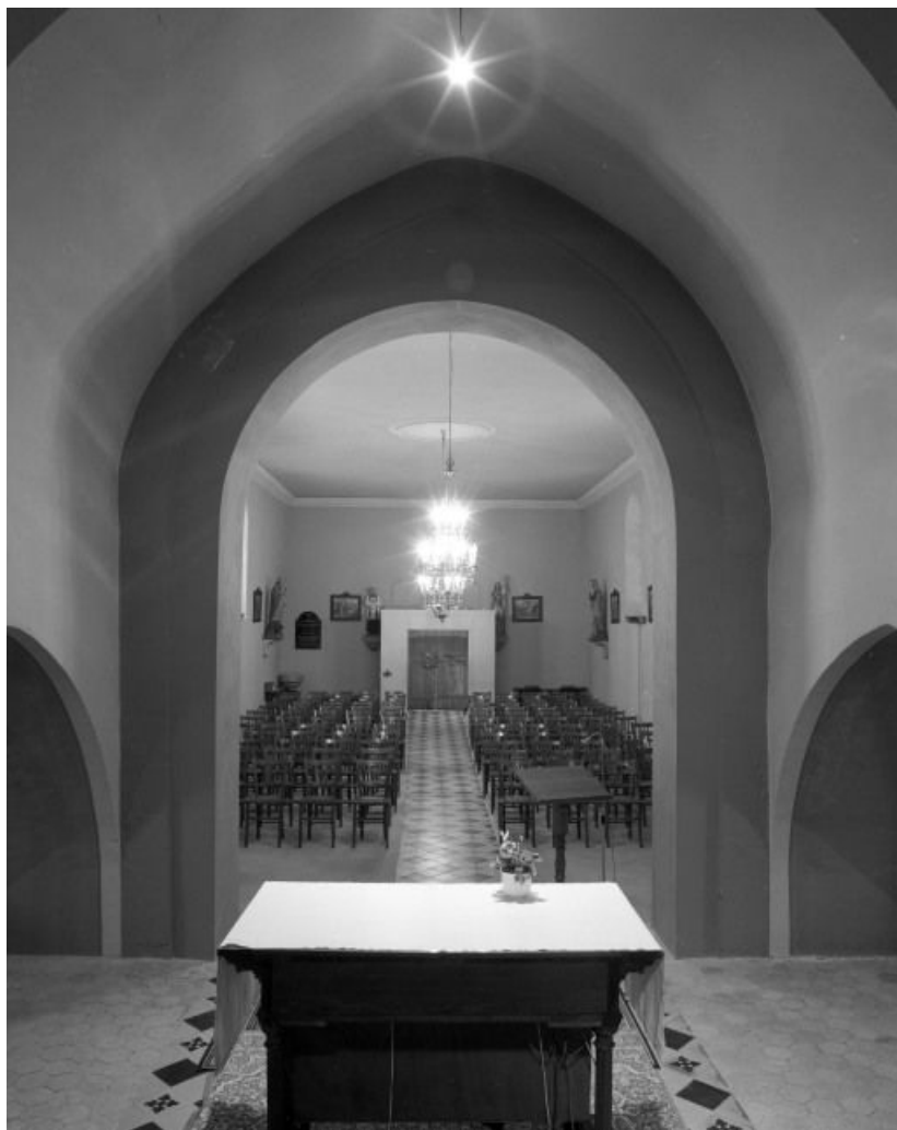
Vue d'ensemble depuis le chœur.