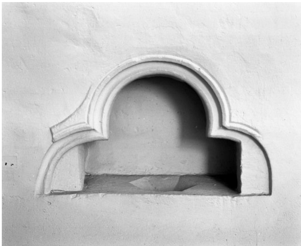
Nef, lavabo de l'autel droit.