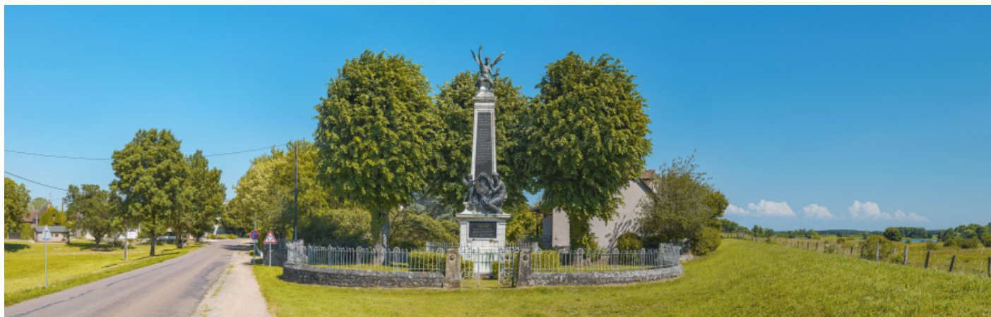
Vue d'ensemble du monument à l'entrée du village.