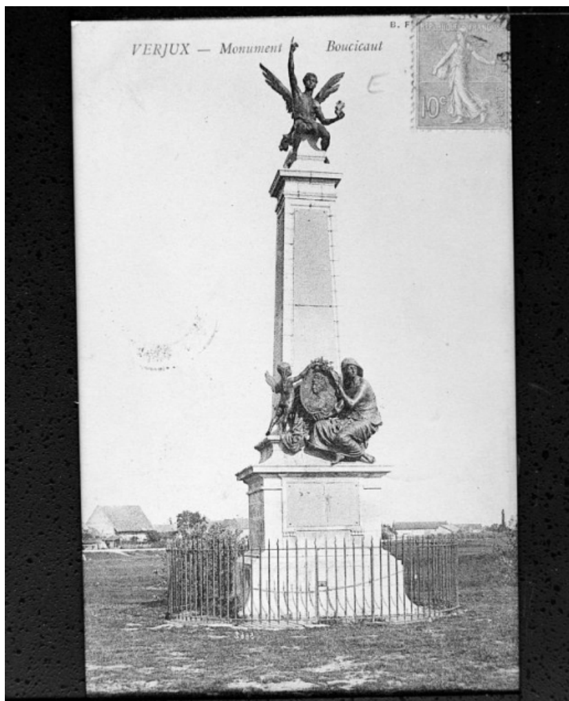
VERJUX - Monument Boucicaut.