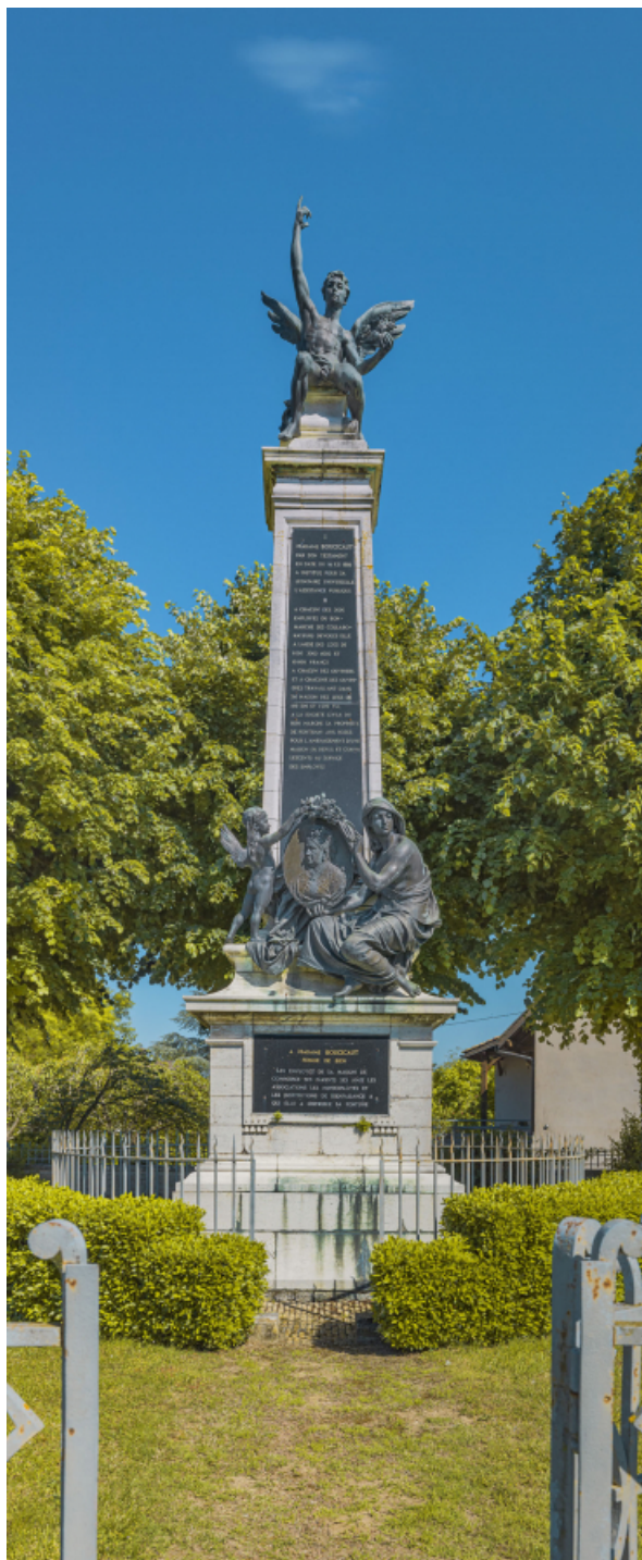
Vue rapprochée du monument.