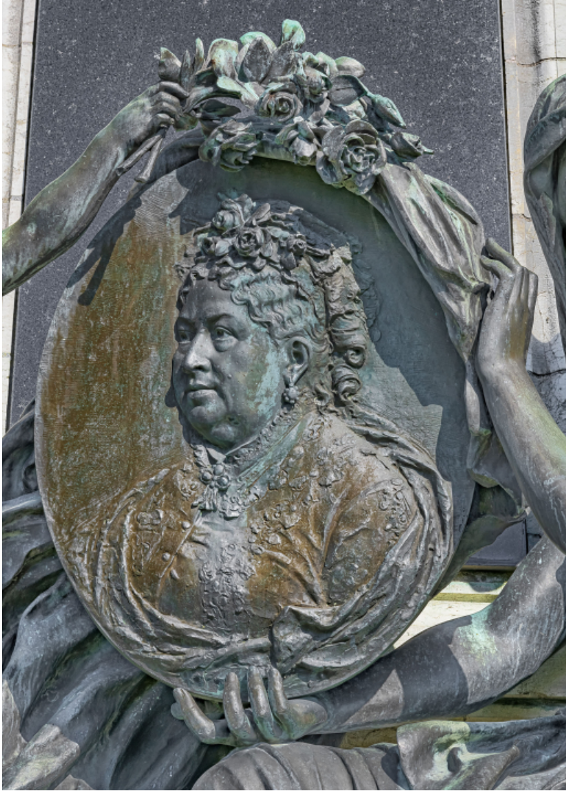
Face antérieure : détail du médaillon.