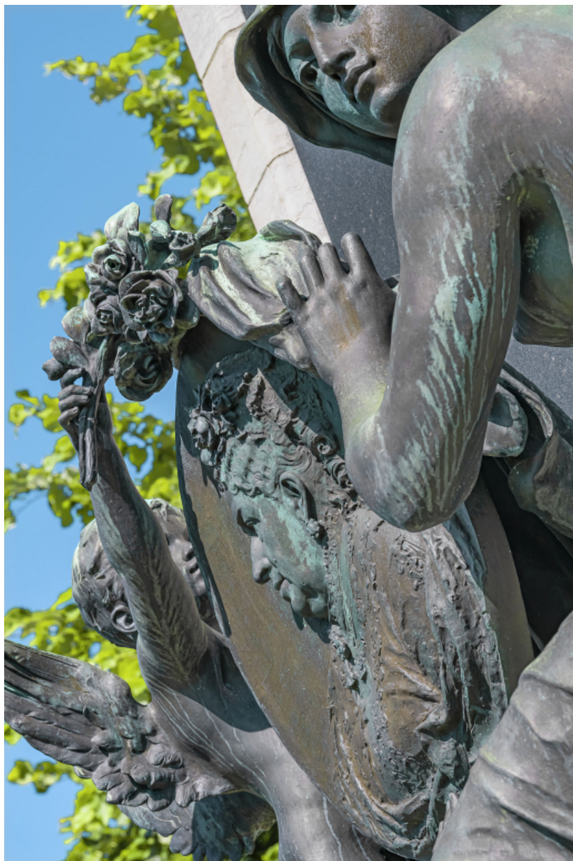
Face antérieure : détail du médaillon.