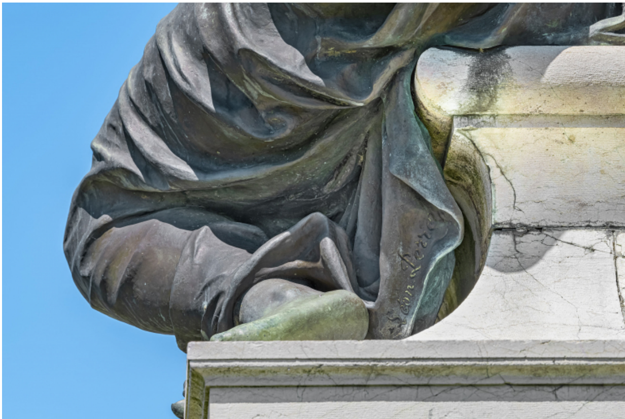
Détail de la signature de Léon Perrey.