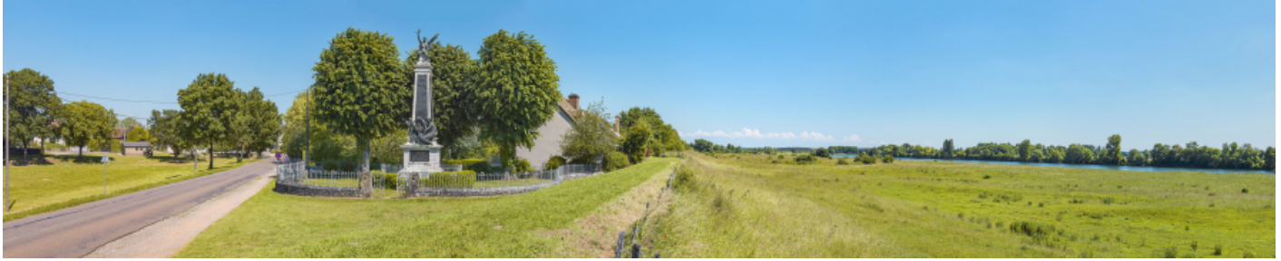
Vue panoramique du monument et de la Saône.