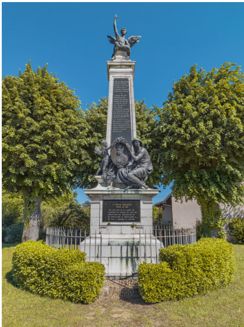
Vue rapprochée du monument.