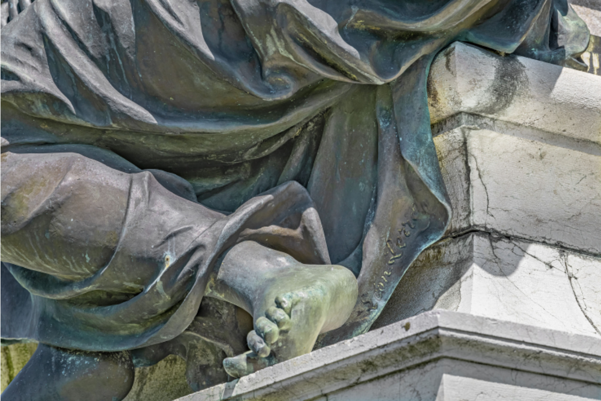
Détail de la signature de Léon Perrey.