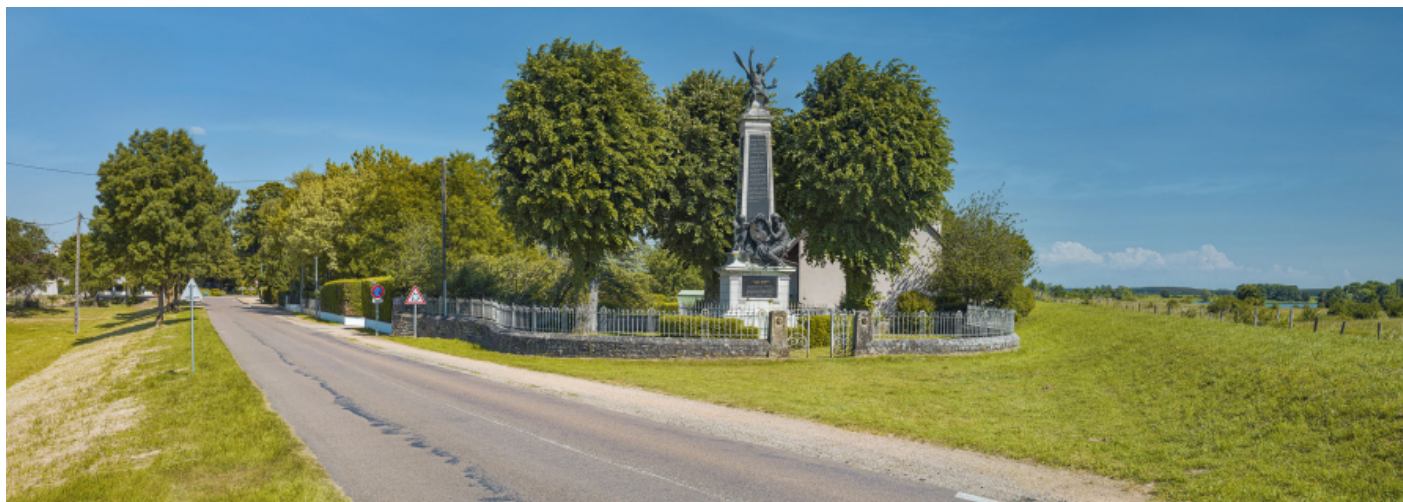
Vue d'ensemble du monument à l'entrée du village.