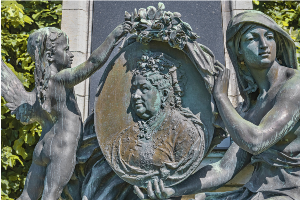
Face antérieure : détail du médaillon.