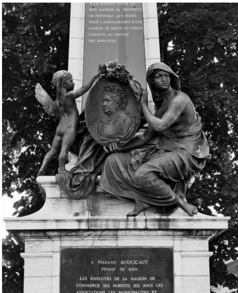
Détail de la sculpture en bronze (en 1986).