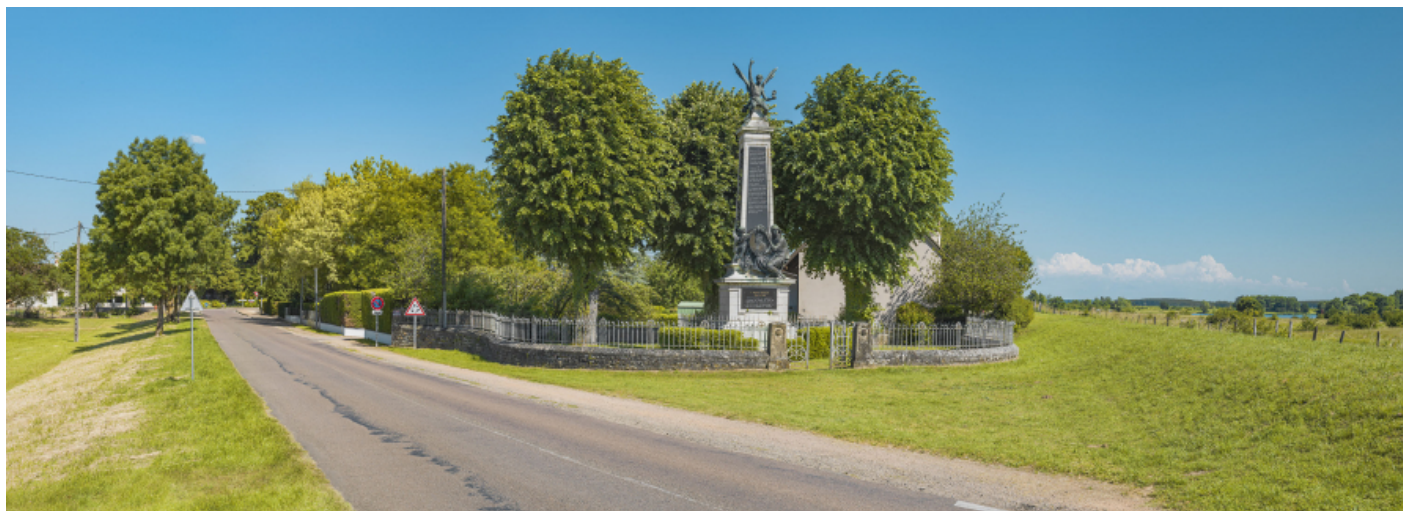
Vue d'ensemble du monument à l'entrée du village.