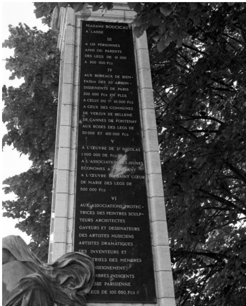
Inscription, face droite de l'obélisque.