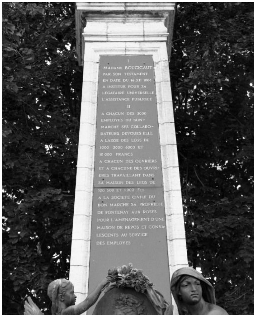
Inscription, face antérieure de l'obélisque.