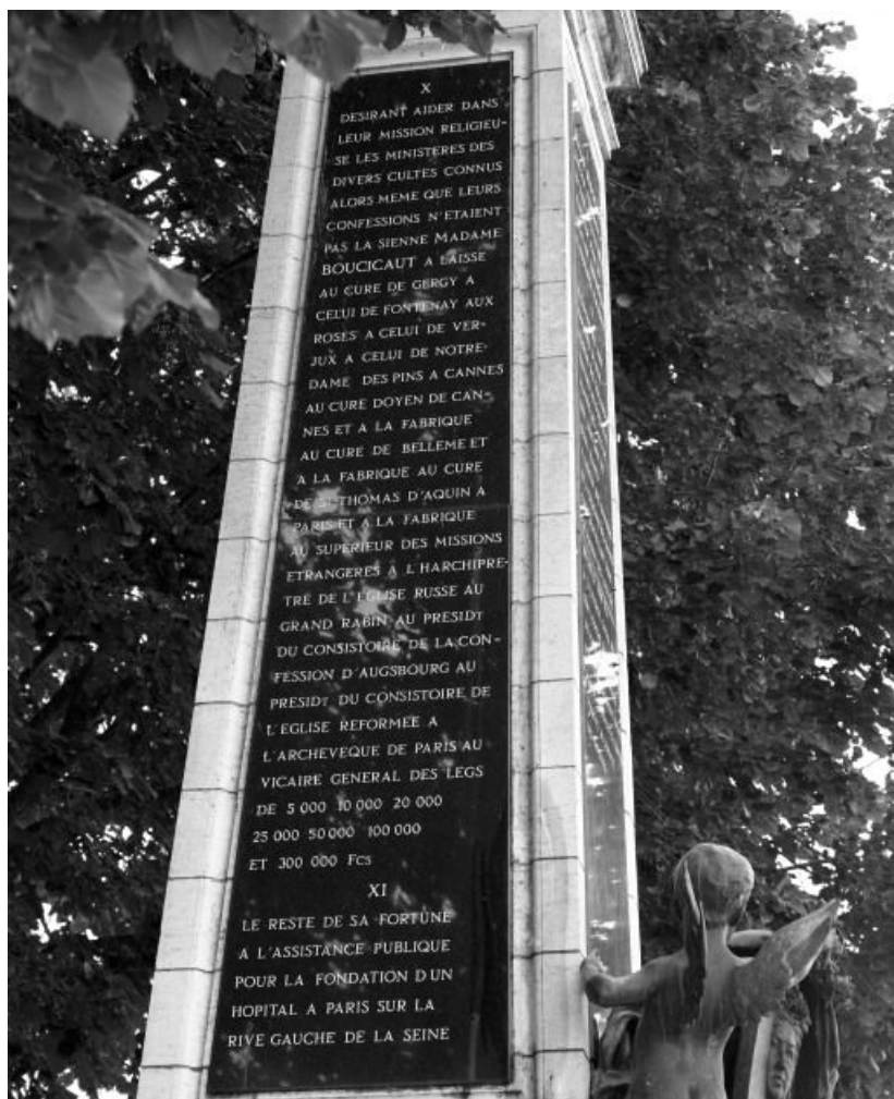
Inscription, face postérieure de l'obélisque.