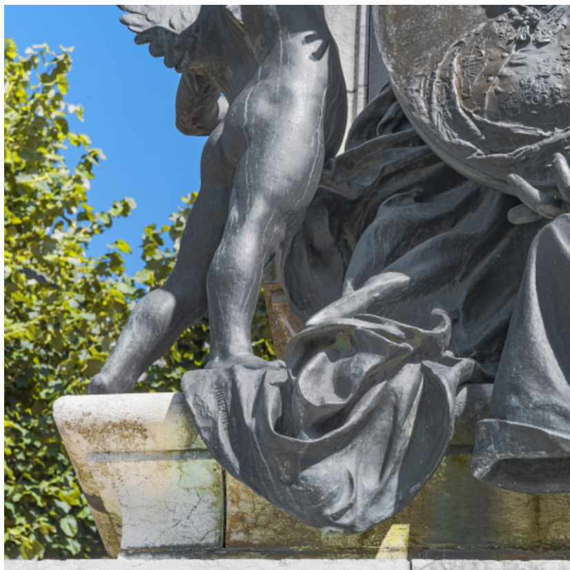
Détail de la signature de Thiébault.