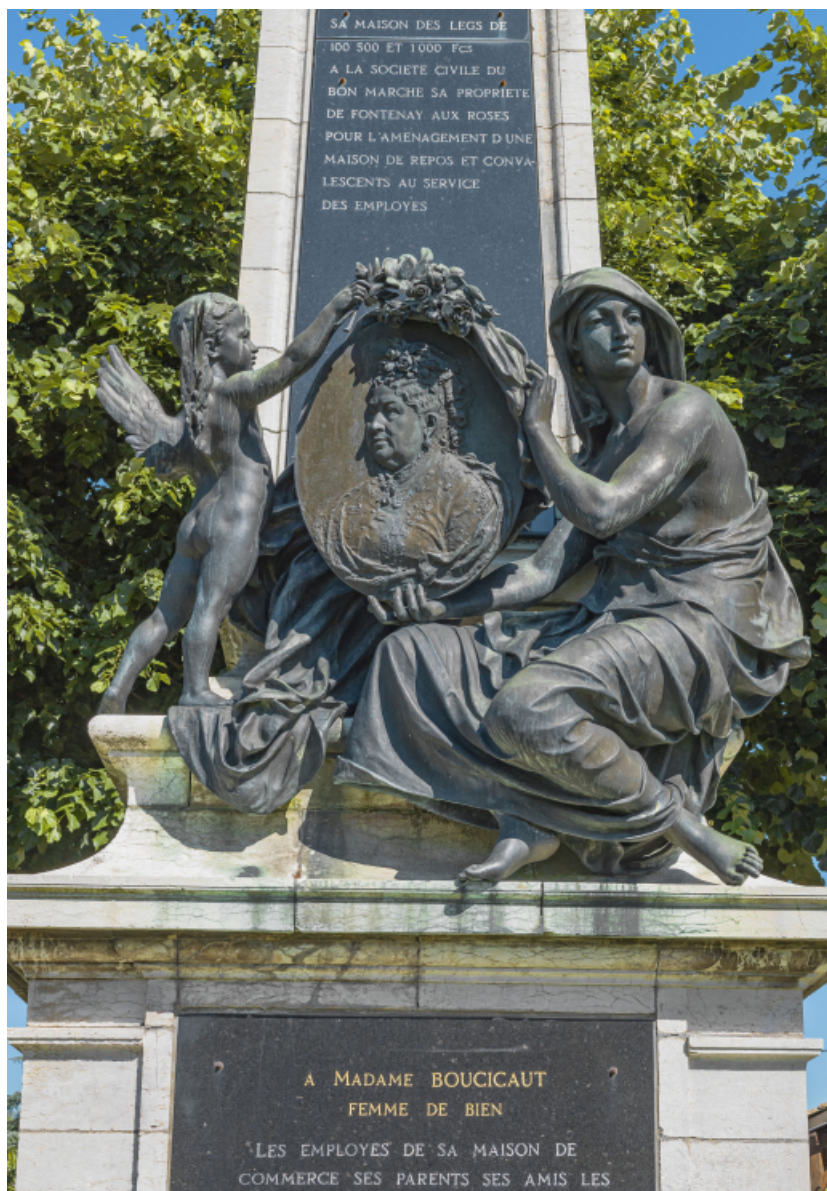
Face antérieure : détail du médaillon.