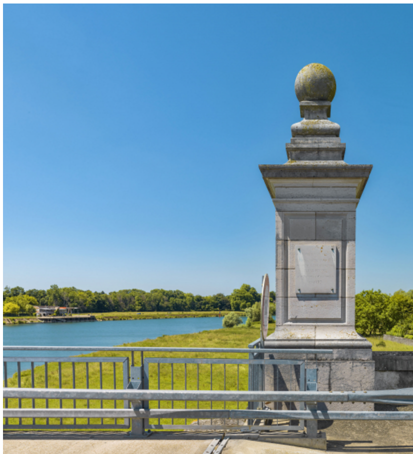
Détail d'une "borne" d'entrée du pont et de la plaque commémorative.