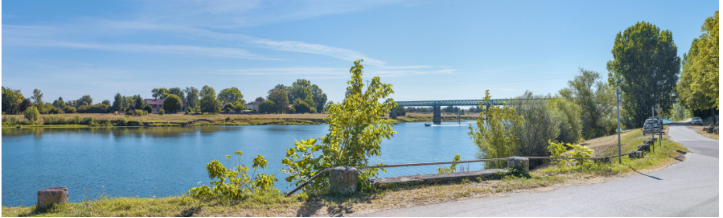
Le pont Boucicaut depuis le ponceau du Creux d'Enfer.