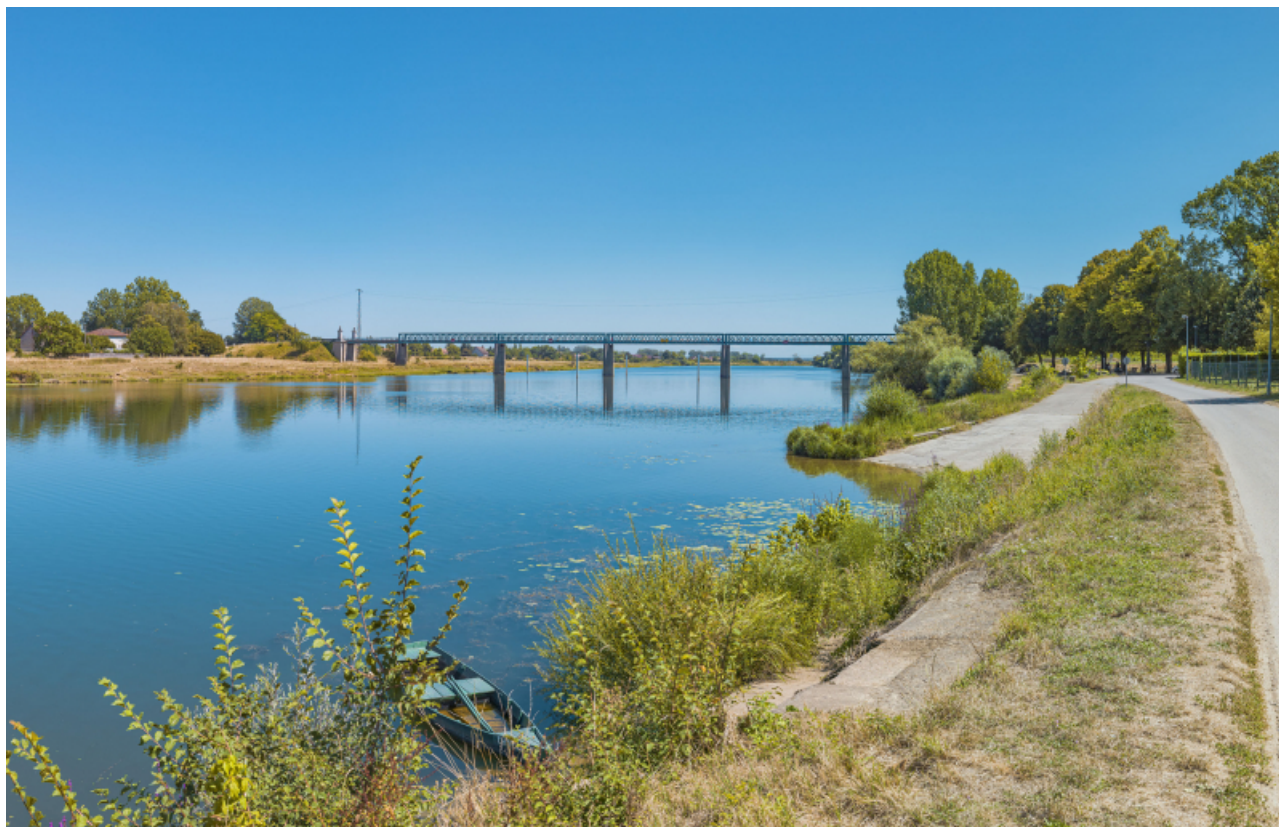
Le pont Boucicaut et le tracé de l'ancien bac, au premier plan.