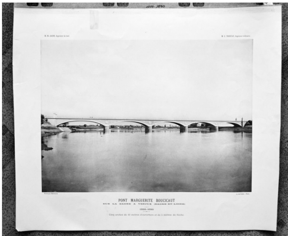
PONT MARGUERITE BOUCICAUD / sur la Saône à Verjux (Saône-et-Loire) / 1888-1890 / cinq arches de 40 mètres d'ouverture et de 5 mètres de flèche..