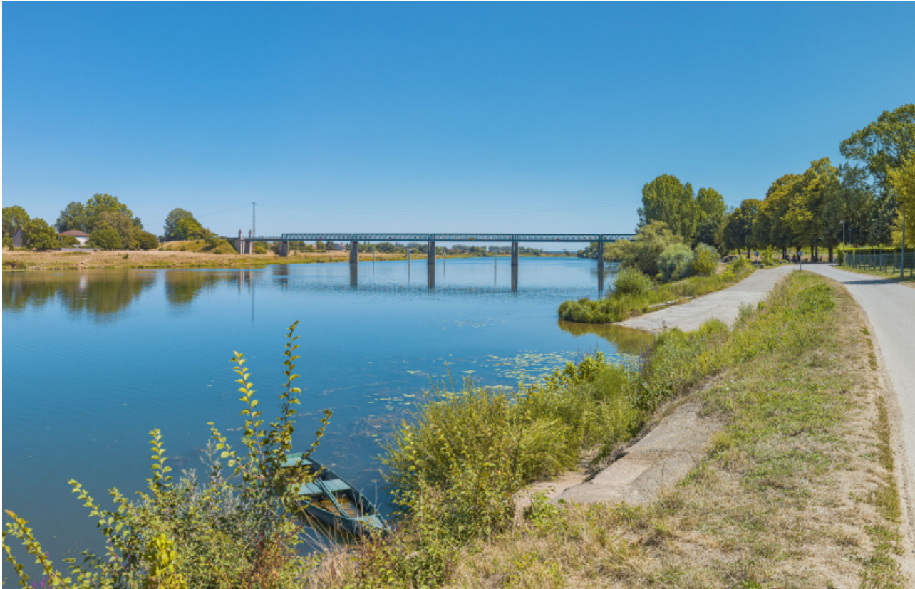
Le pont Boucicaut et le tracé de l'ancien bac, au premier plan.