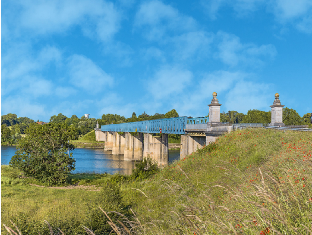
Vue d'ensemble du pont, d'aval.