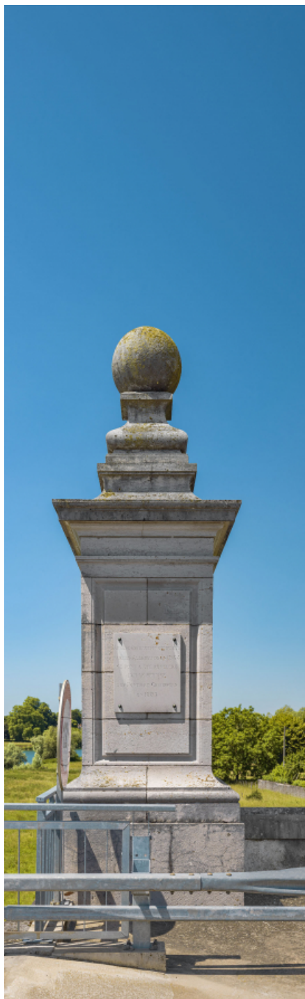
Détail d'une "borne" d'entrée du pont et de la plaque commémorative.