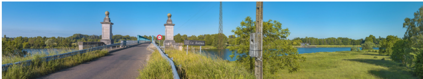
Entrée du pont côté Verjux et en arrière-plan, le port de Gergy.