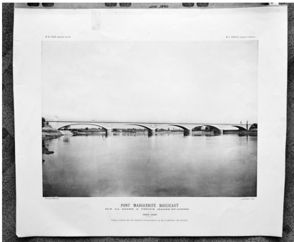
PONT MARGUERITE BOUCICAUT / sur la Saône à Verjux (Saône-et-Loire) / 1888-1890 / cinq arches de 40 mètres d'ouverture et de 5 mètres de flèche..