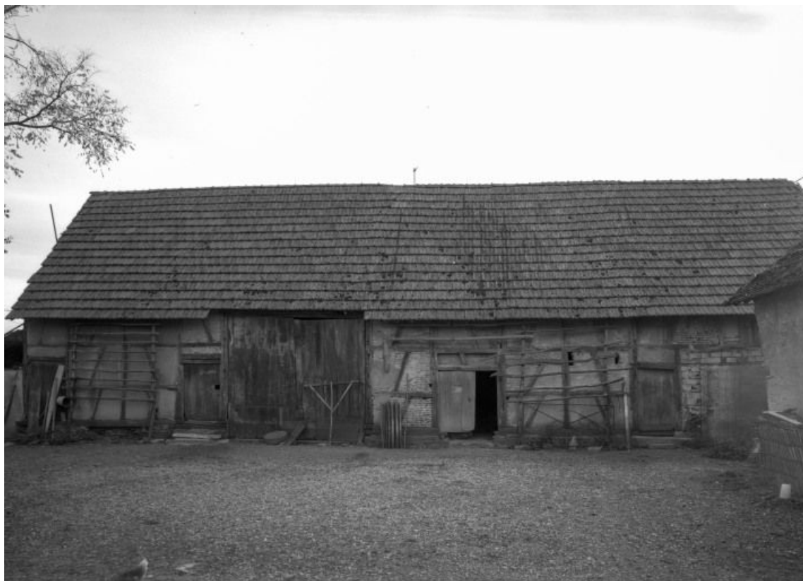
Bâtiment des dépendances, vue de trois-quarts.