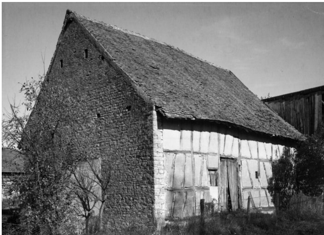
Bâtiment des dépendances.