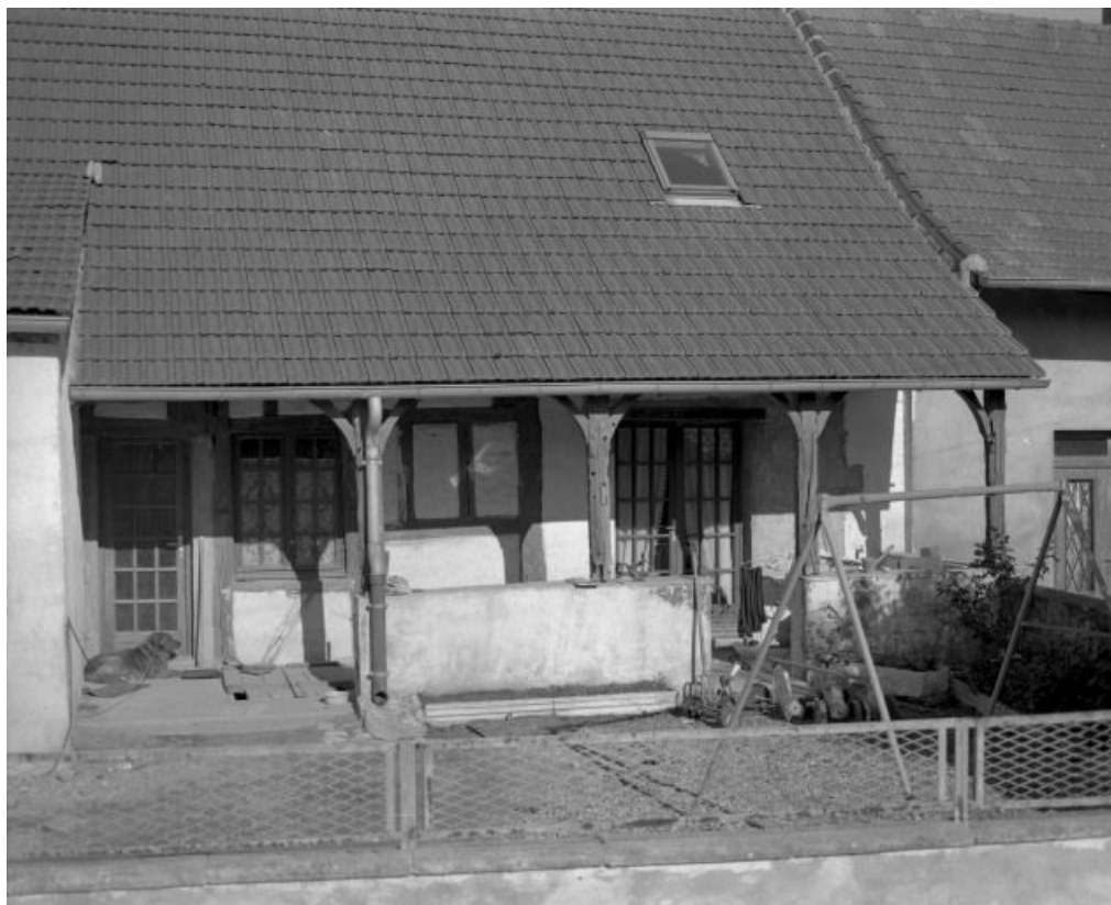
Logis de ferme.