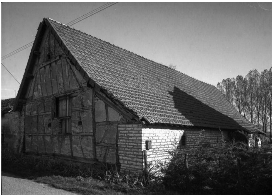
Bâtiment des dépendances, façade sur cour.