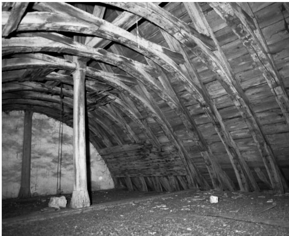
Comble du choeur, partie droite.