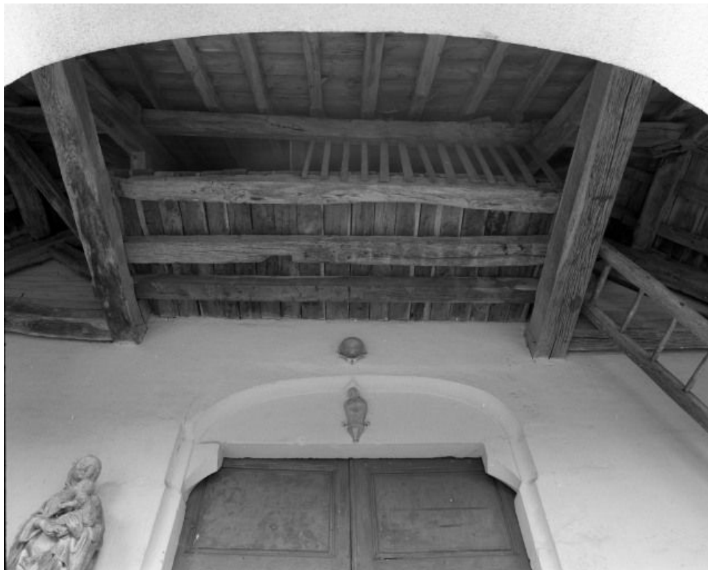
Porche, galerie permettant l'accès au clocher.