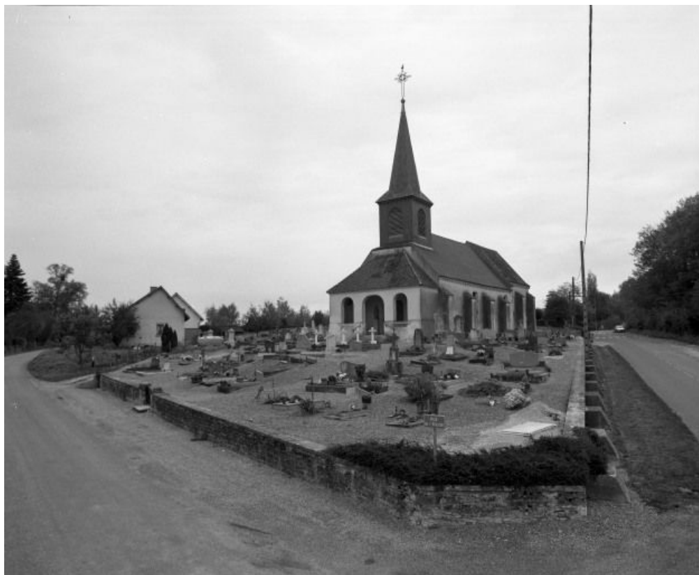
Vue d'ensemble, façade et élévation droite.