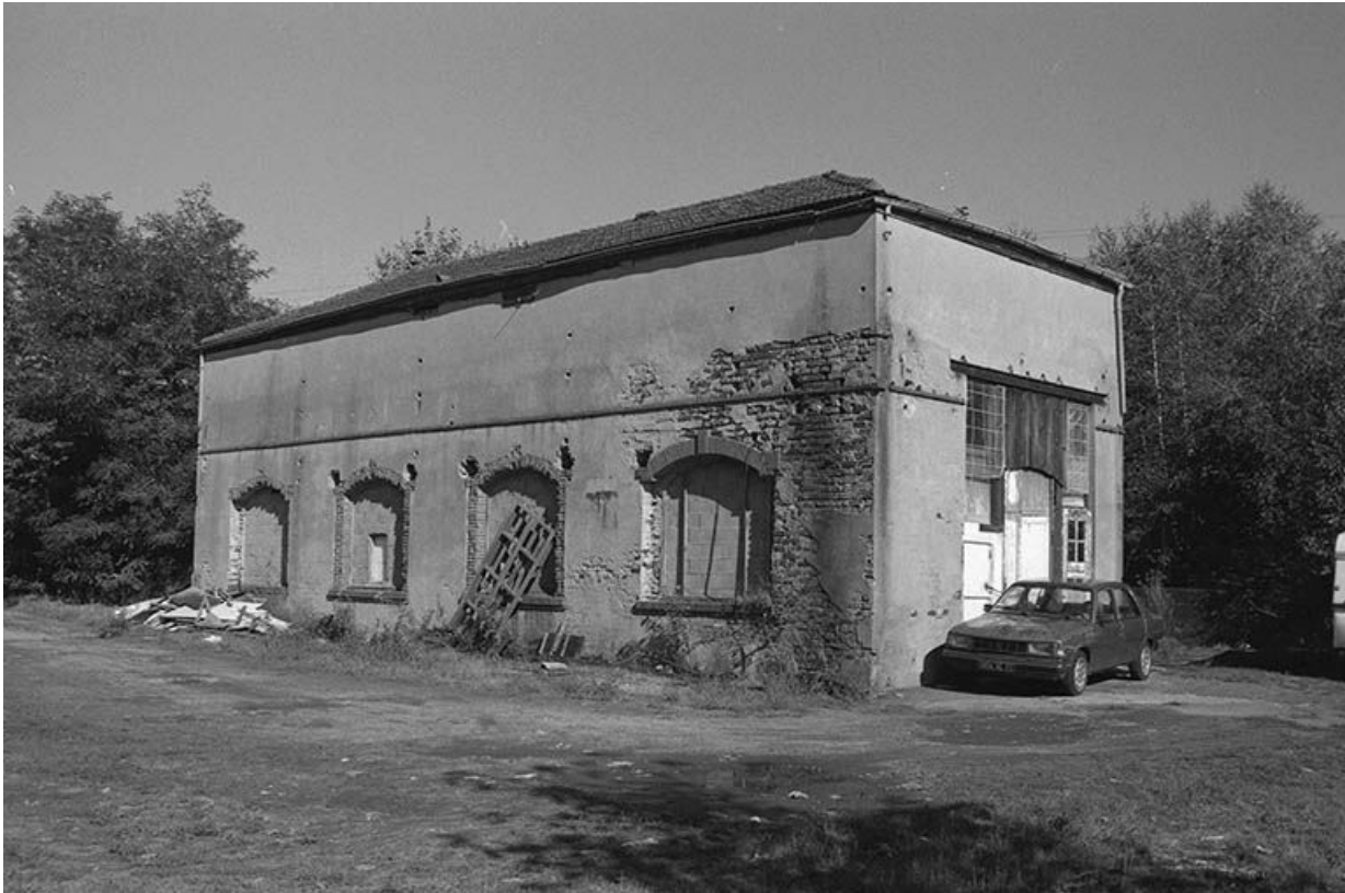
Salle des machines, vue du sud-ouest.

71, Écuisses, lieudit : la Première Ecluse