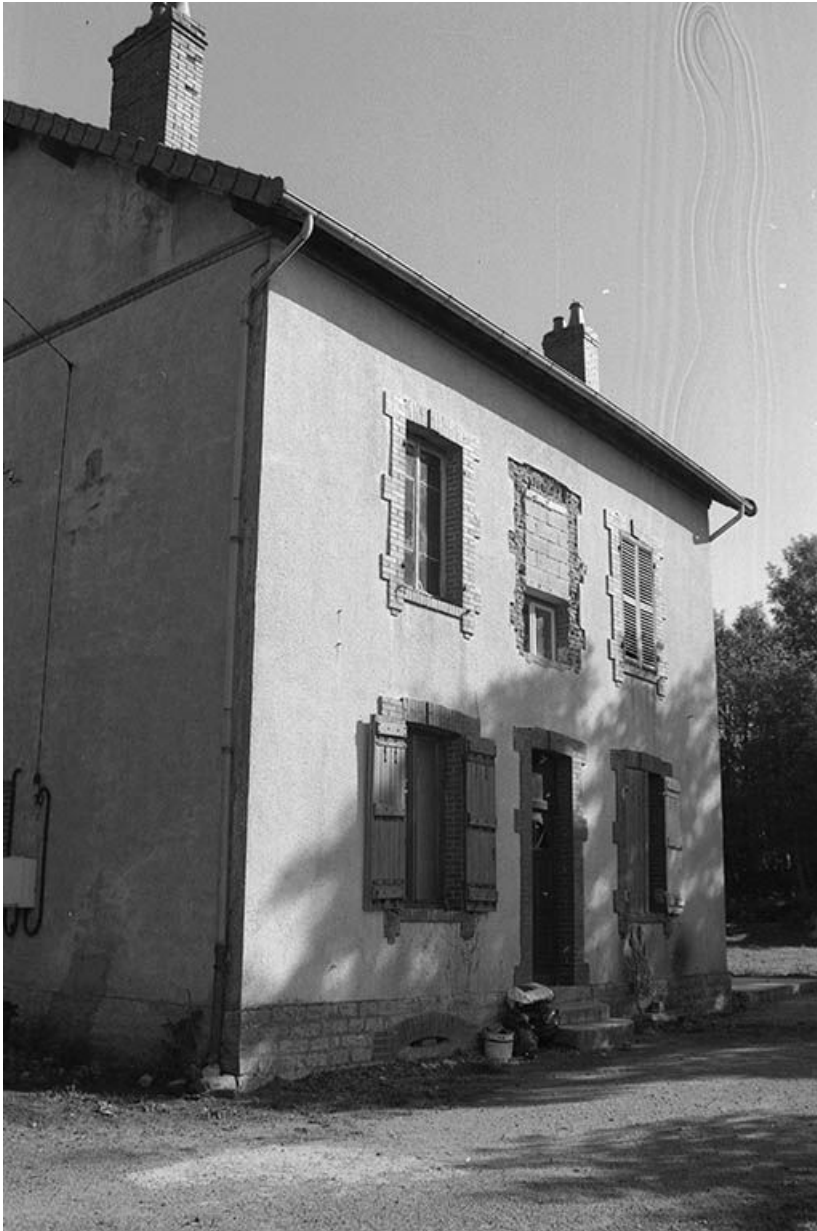
Logement d'ingénieur, vu du nord-est.

71, Écuisses, lieudit : la Première Ecluse