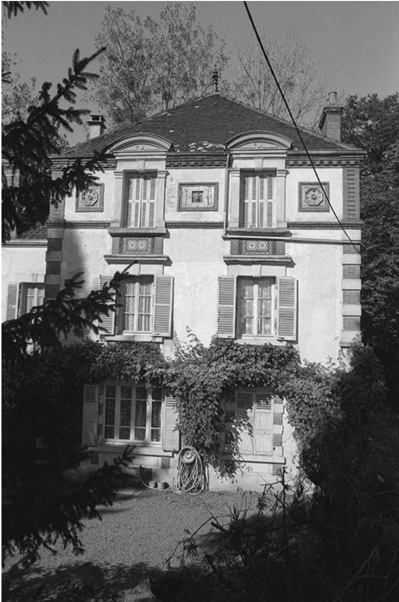
Façade sud du logement patronal.

71, Écuisses, lieudit : la Première Ecluse