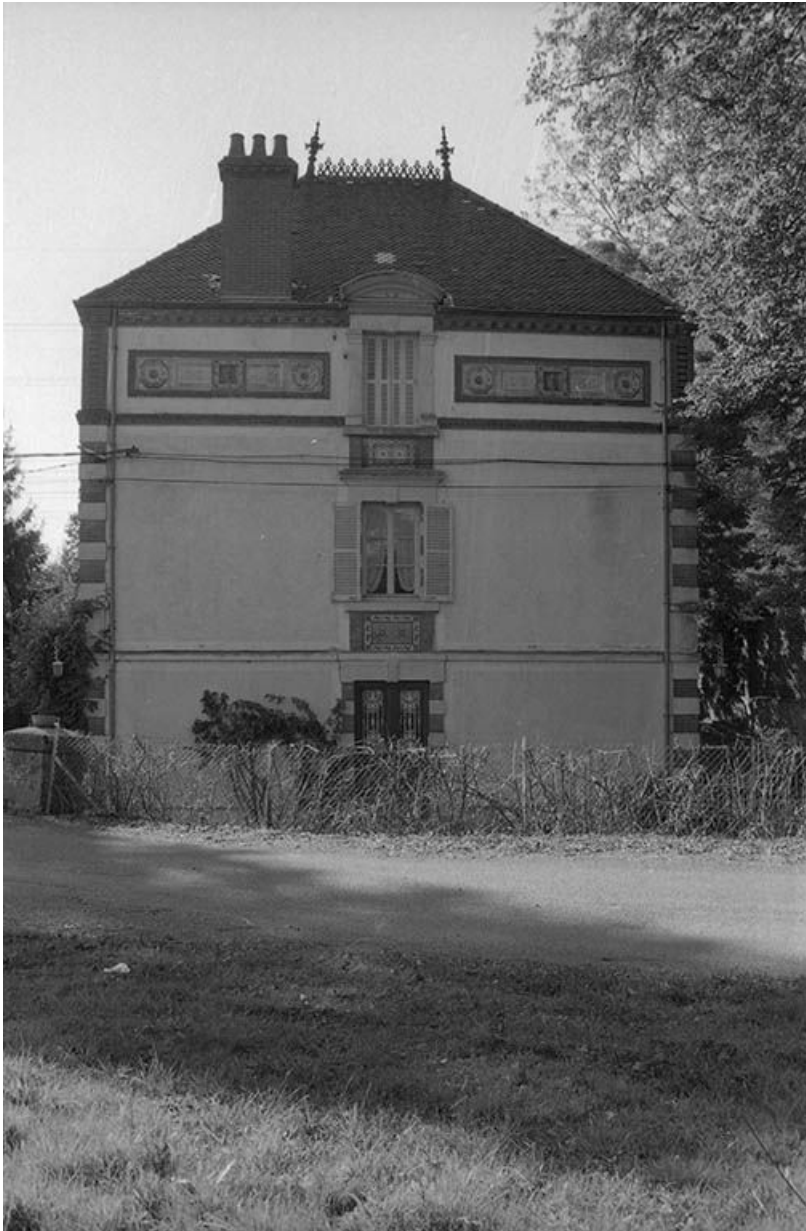
Façade est du logement patronal.

71, Écuisses, lieudit : la Première Ecluse