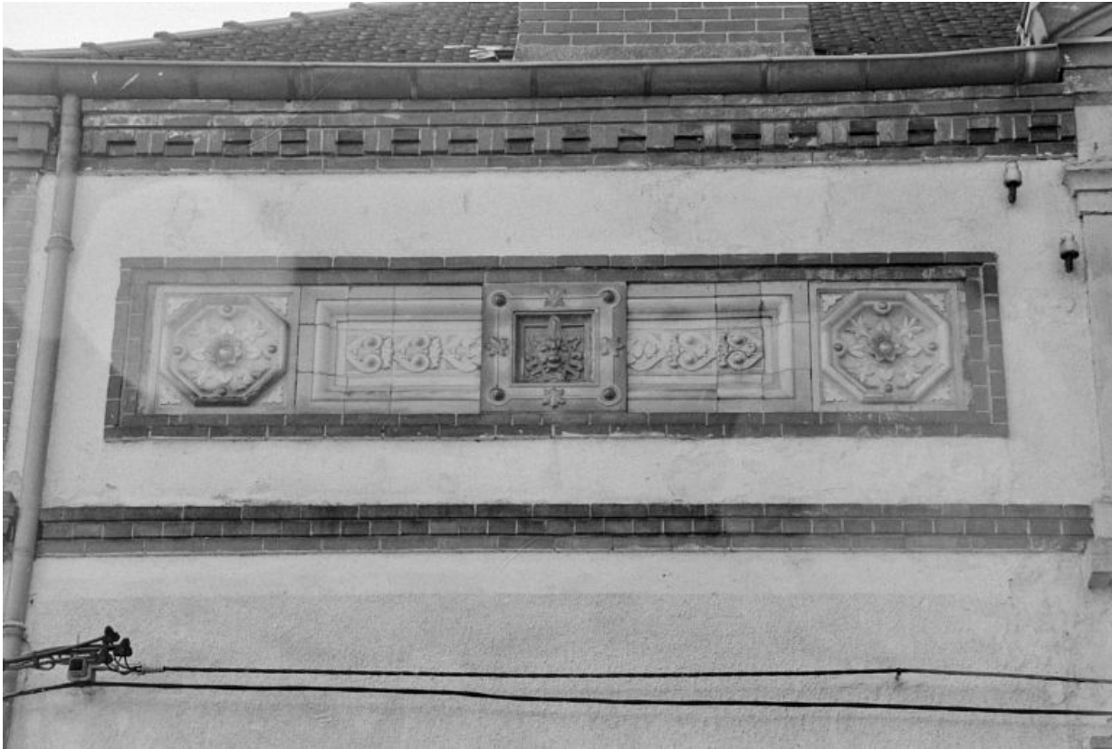
Détail de la façade est : panneaux de céramique (provenance indéterminée).

71, Écuisses, lieudit : la Première Ecluse