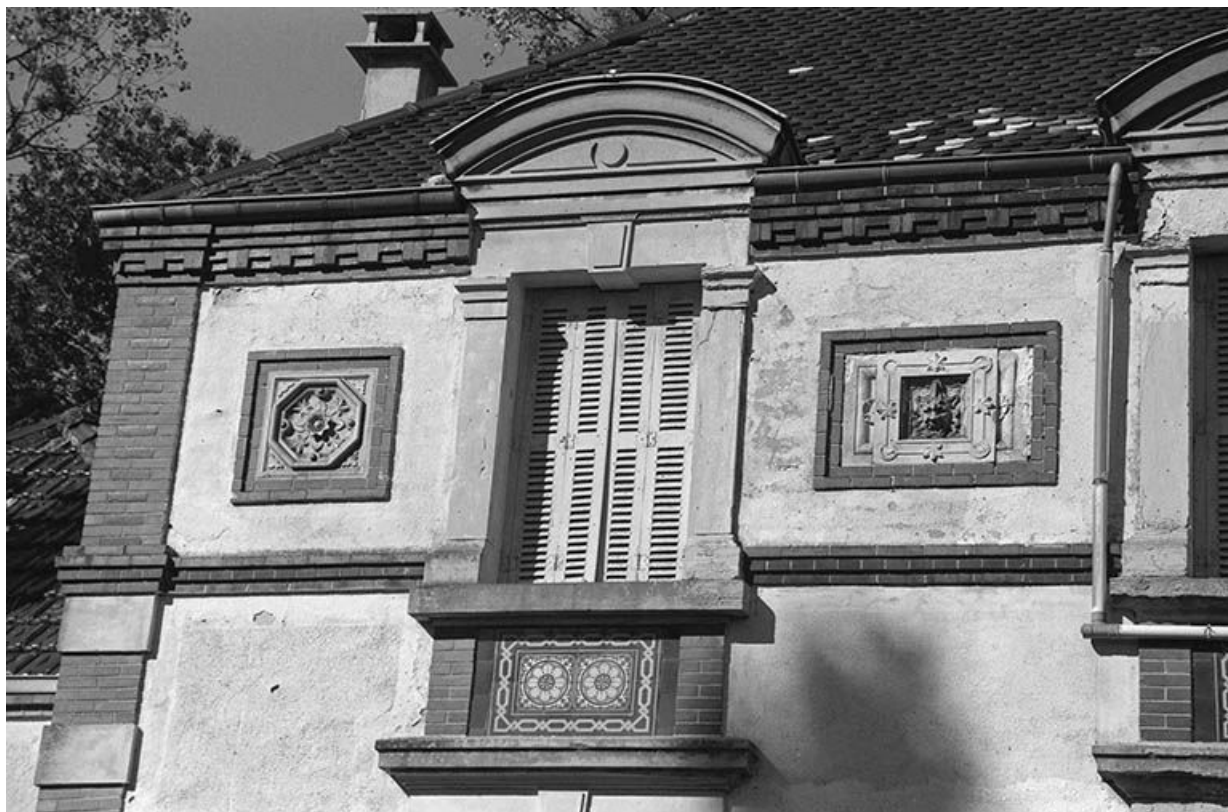
Détail de la façade sud : panneaux de céramique encadrant une baie de l'étage en surcroît (provenance indéterminée). 71, Écuisses, lieudit : la Première Ecluse