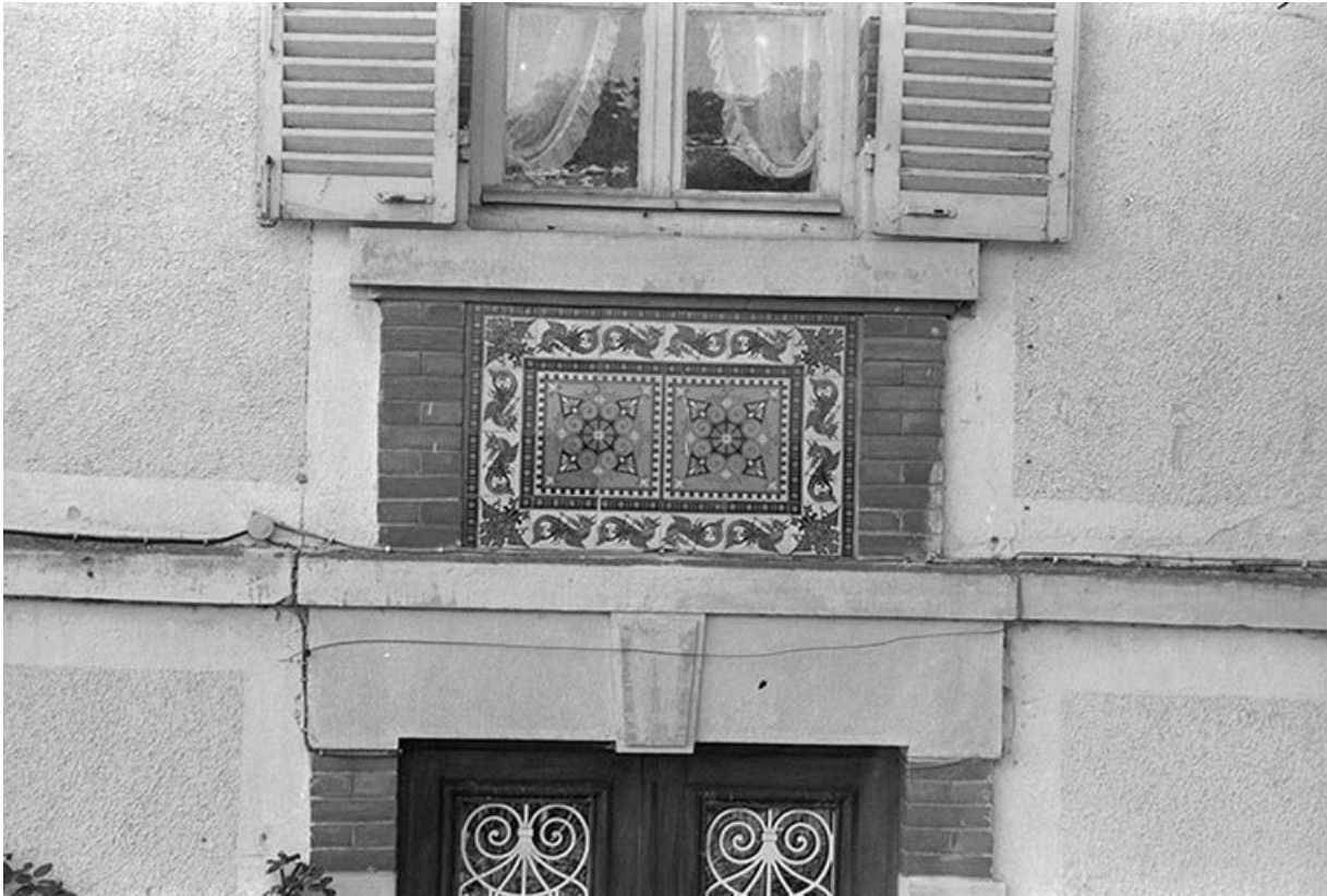
Détail de la façade est : allège de la baie du premier étage (carreaux de grès cérame produits par les Ets Perrusson d'Ecuisses). 71, Écuisses, lieudit : la Première Ecluse