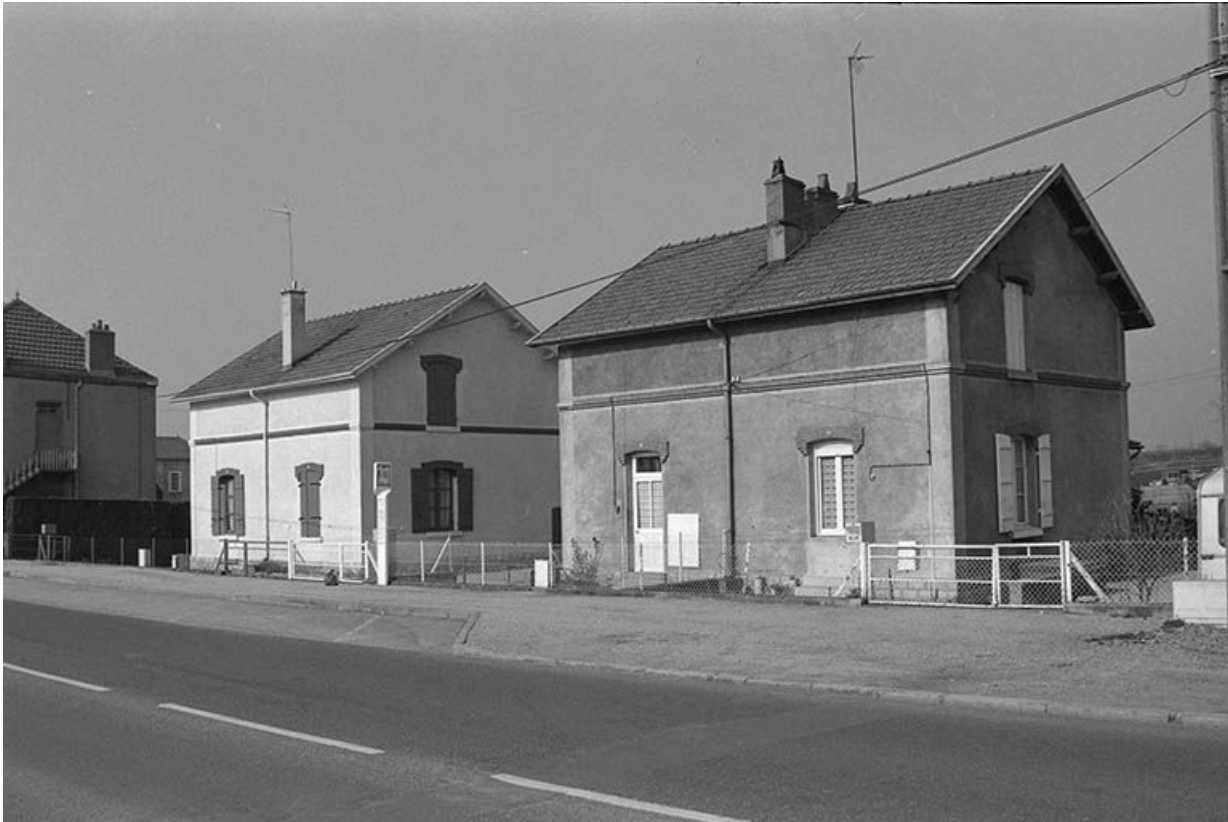
Logements ouvriers quai de Moulins (types 8).

71, Montceau-les-Mines, 20 quai de Moulins