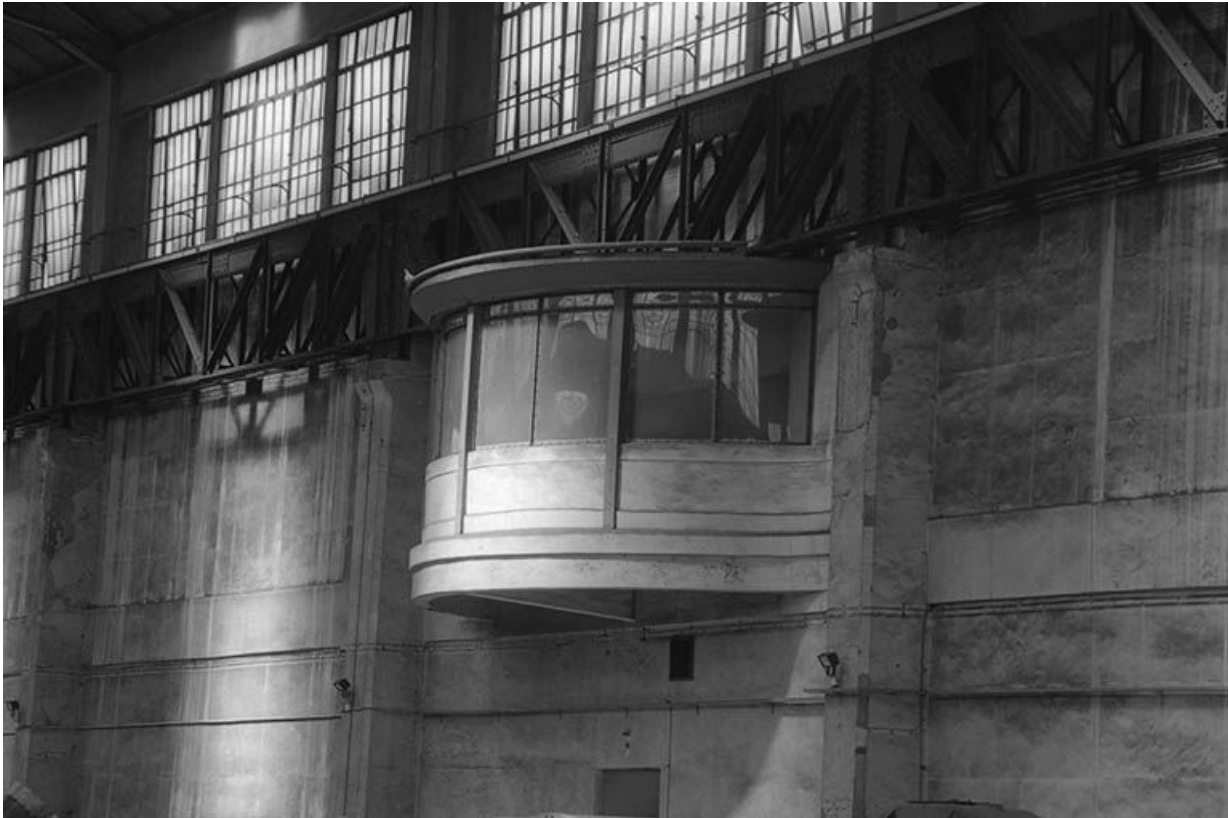
Le poste de contrôle de la salle des machines, installé dans le bâtiment des tableaux de distribution.

71, Montceau-les-Mines, 20 quai de Moulins