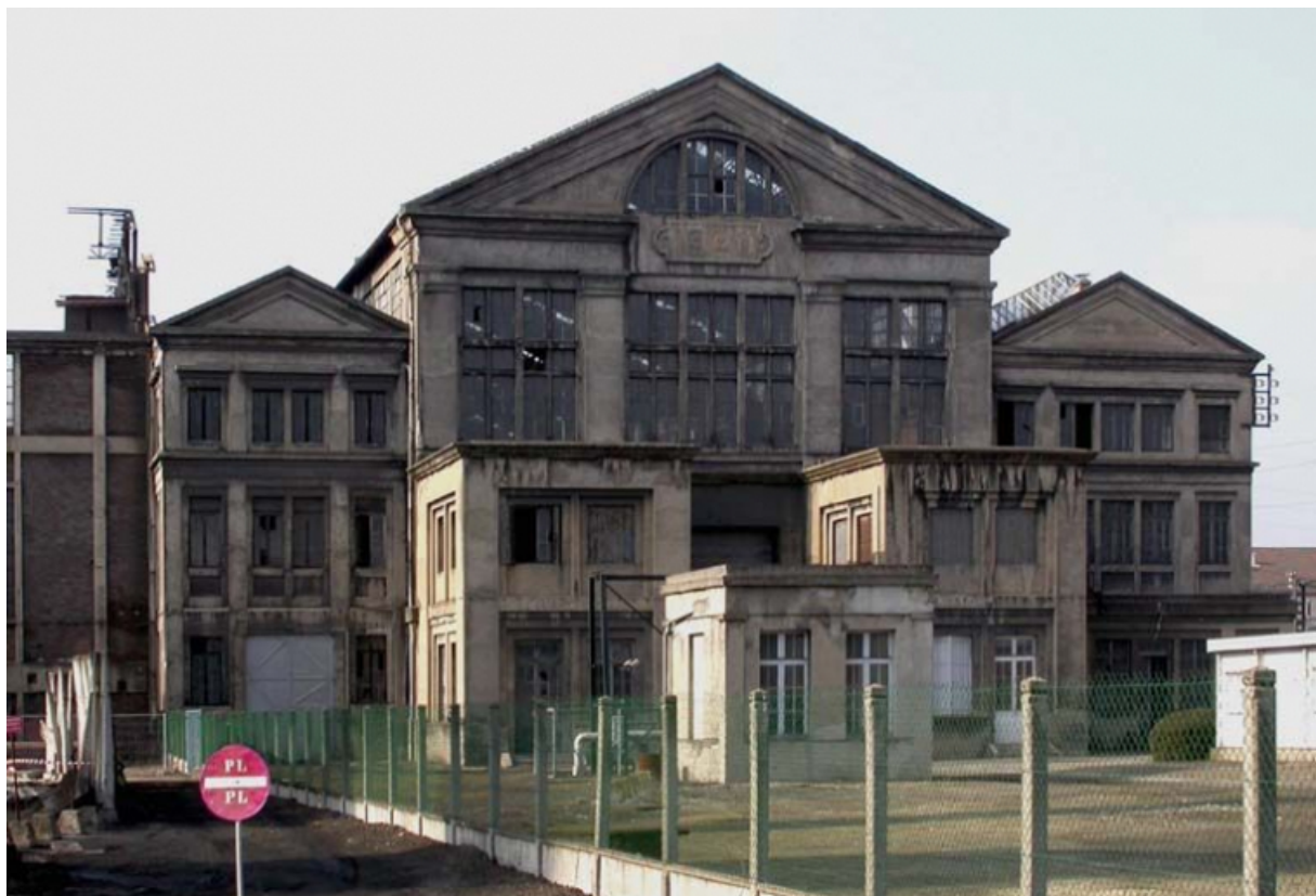
Élévation principale du bâtiments des alternateurs.

71, Montceau-les-Mines, 20 quai de Moulins