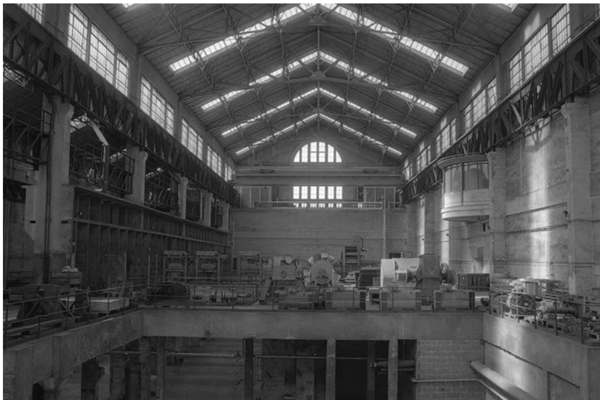
Pignon nord-ouest de la salle des machines vu depuis l'ancienne plate-forme des turboalternateurs. 71, Montceau-les-Mines, 20 quai de Moulins