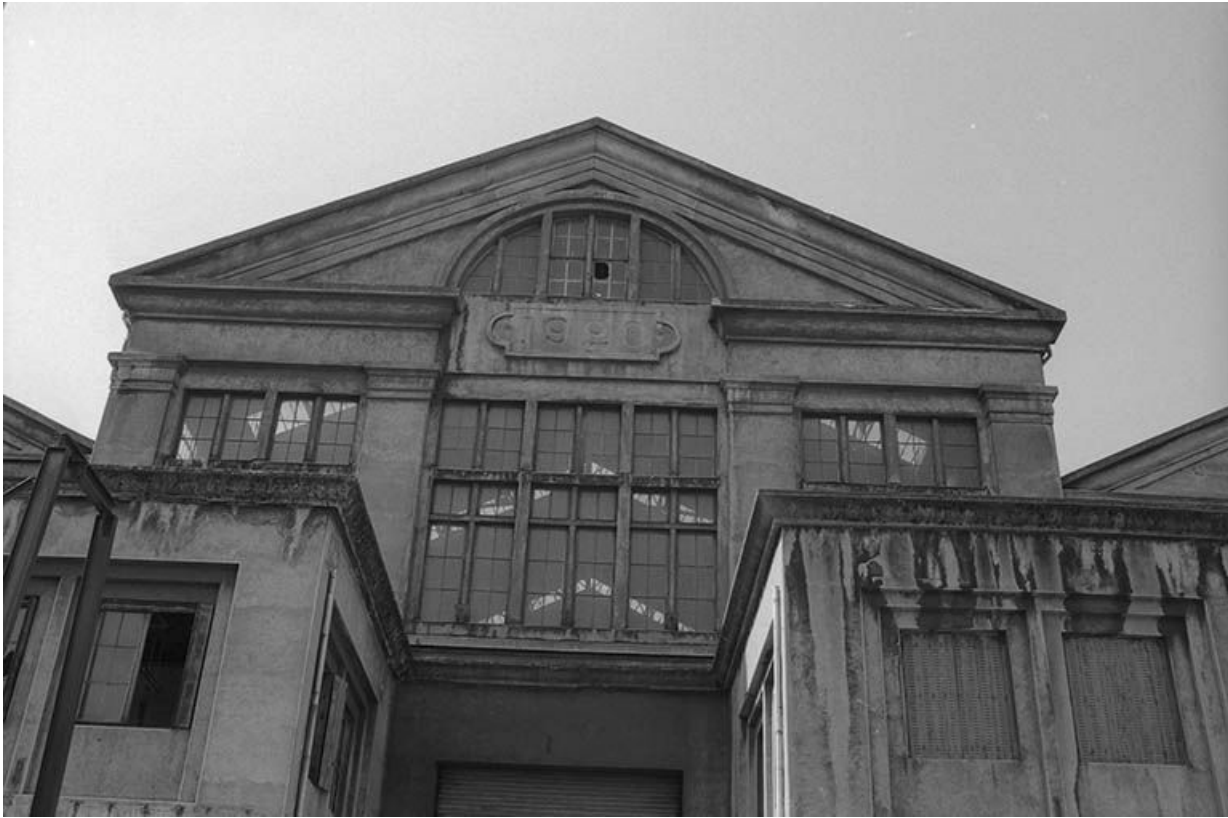
Détail de la façade de la centrale thermique de Lucy II.

71, Montceau-les-Mines, 20 quai de Moulins