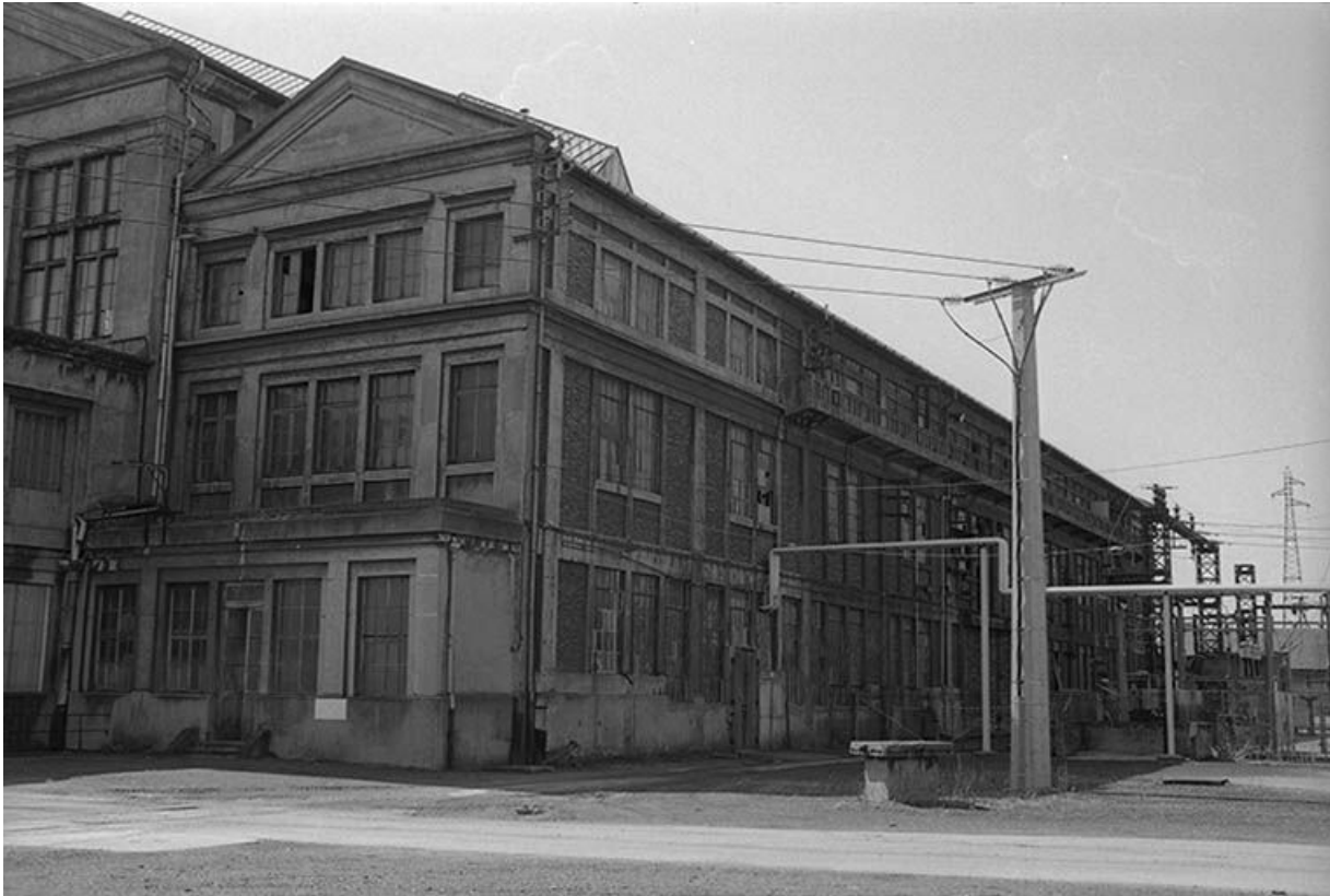
Le bâtiment des tableaux de distribution vu depuis l'est.

71, Montceau-les-Mines, 20 quai de Moulins