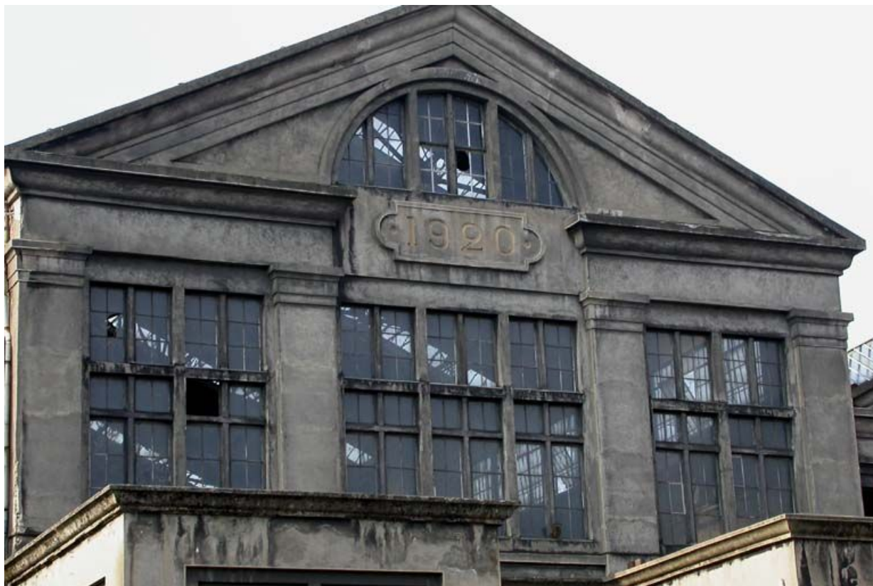
Élévation principale du bâtiments des alternateurs, détail.

71, Montceau-les-Mines, 20 quai de Moulins