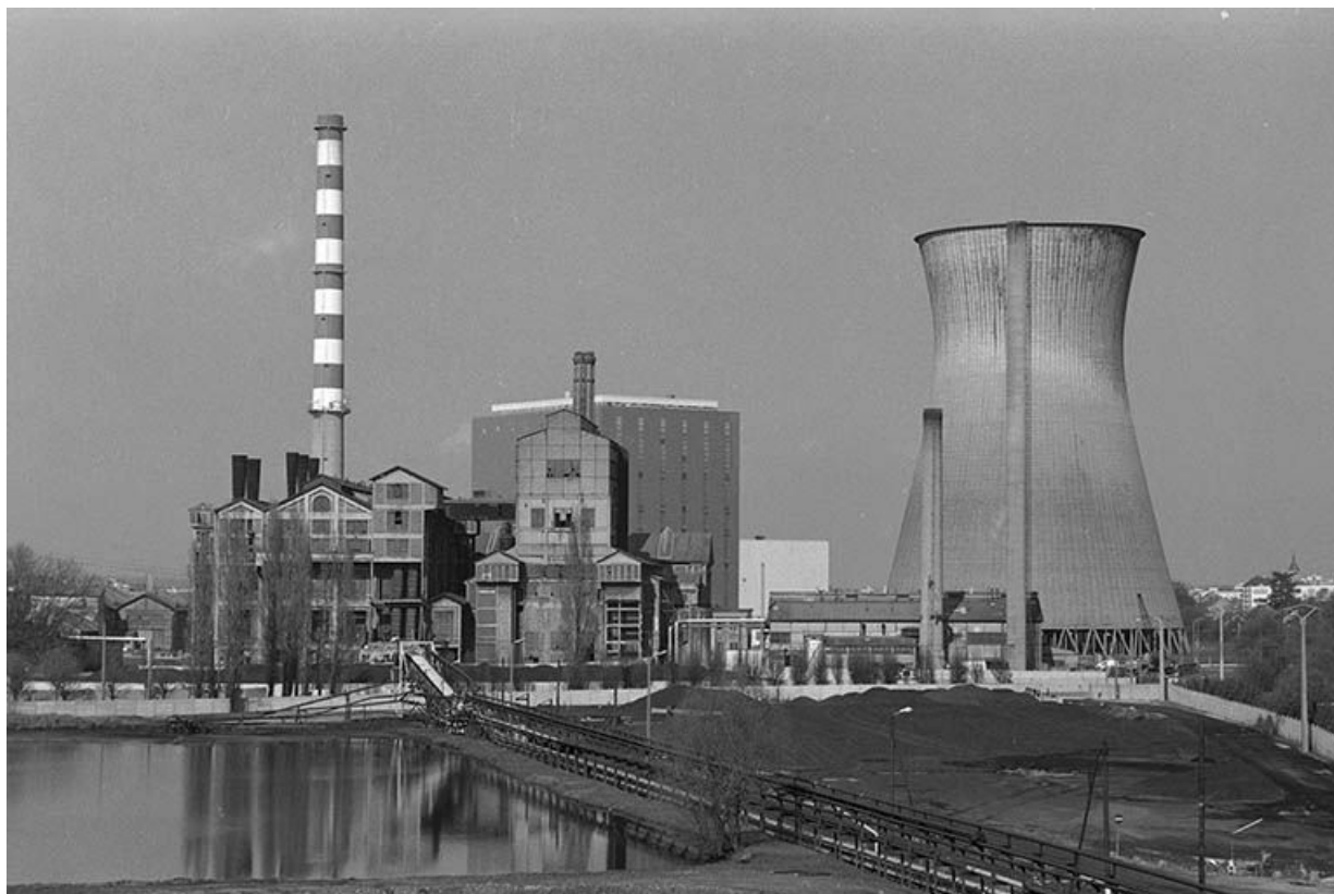
Les chaufferies de la centrale thermique de Lucy II photographiées depuis l'estacade de rebroussement du Lavoir des Chavannes (an arrière plan : cheminée, salle des machines et tour de réfrigération de Lucy III).

71, Montceau-les-Mines, 20 quai de Moulins