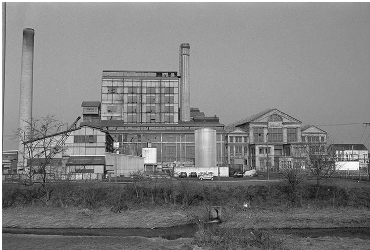
Le site de la centrale thermique de Lucy II vu depuis le canal du Centre.

71, Montceau-les-Mines, 20 quai de Moulins