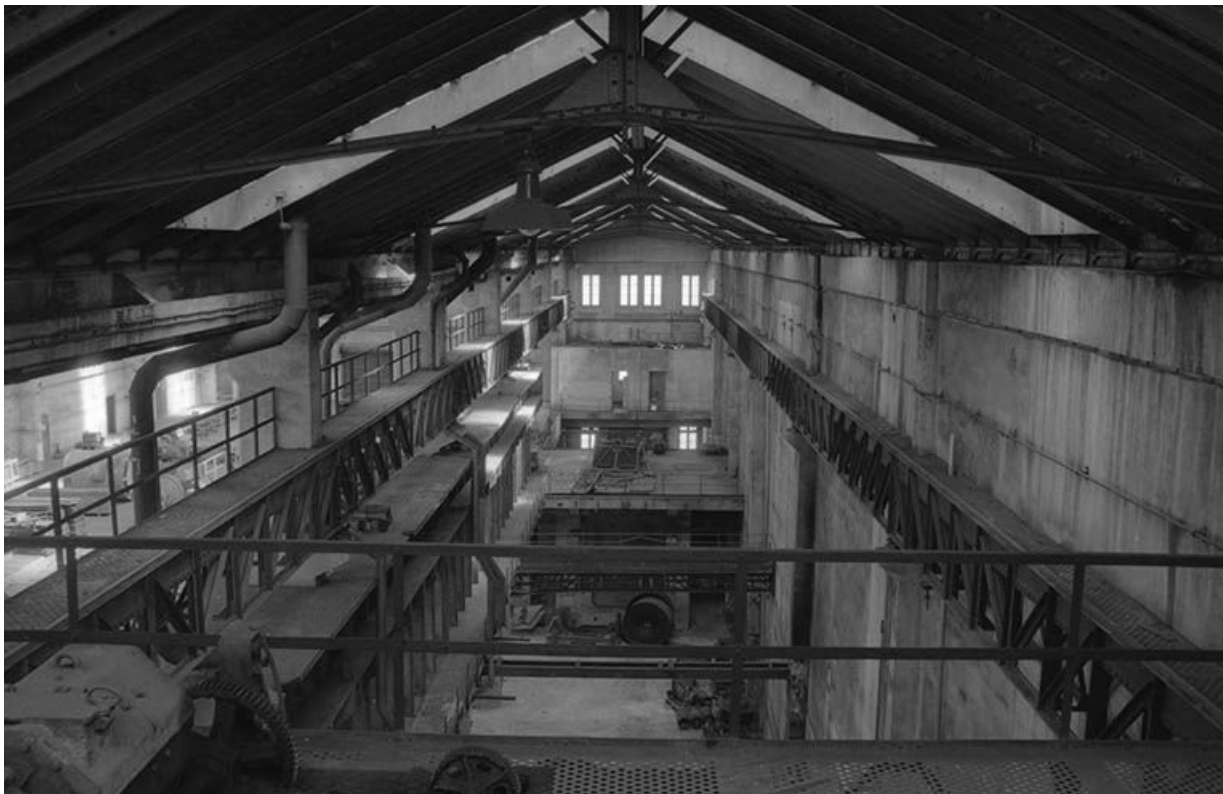
La salle des pompes photographiée depuis le pont roulant.

71, Montceau-les-Mines, 20 quai de Moulins