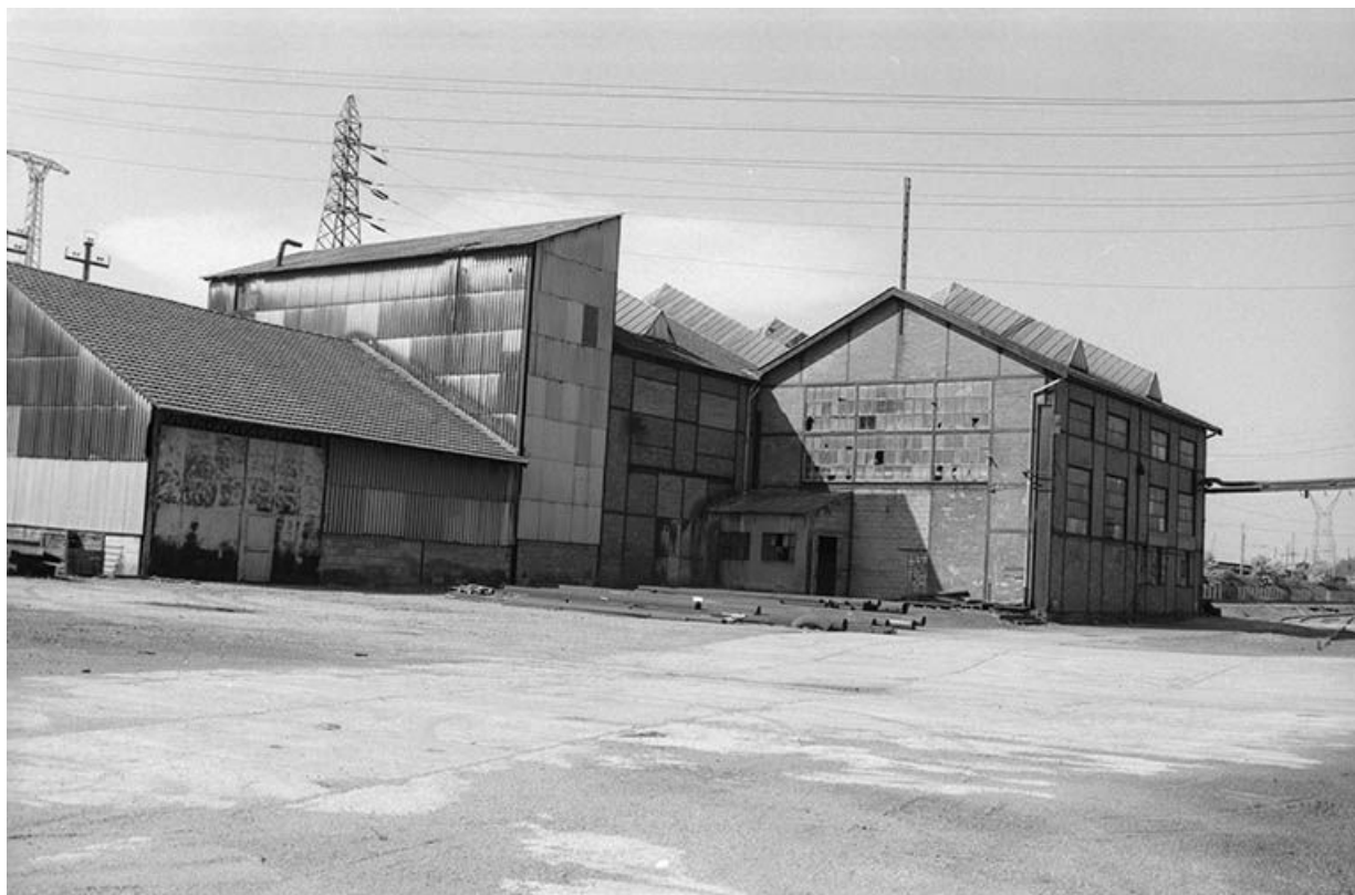
Magasins et ancien atelier " béton gaz " vus du sud.

71, Montceau-les-Mines, 20 quai de Moulins