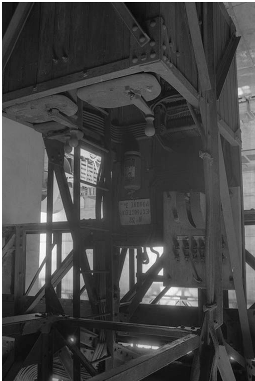
Le poste de commande du pont roulant de la salle des pompes.

71, Montceau-les-Mines, 20 quai de Moulins