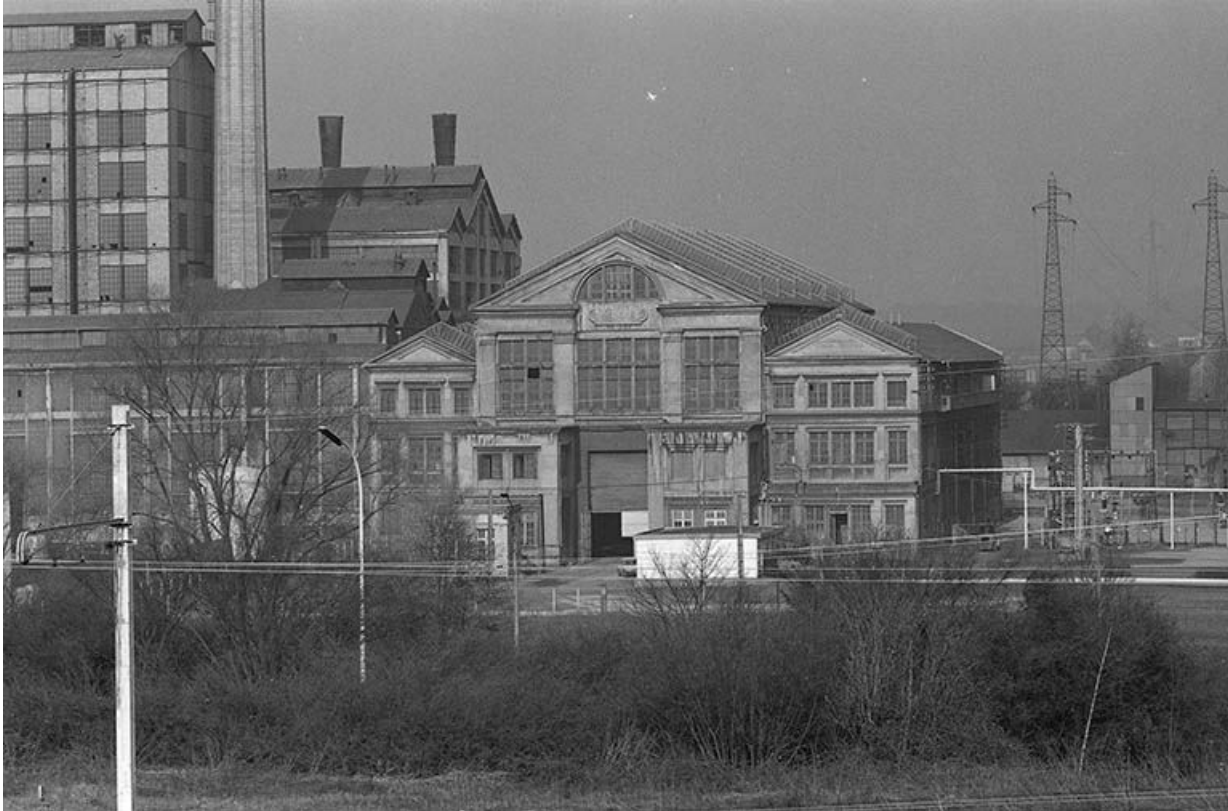
Façade antérieure de la centrale thermique de Lucy II vue de l'est.

71, Montceau-les-Mines, 20 quai de Moulins