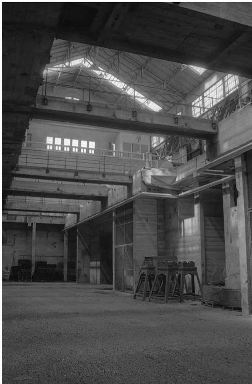
La salle des machines et les massifs formant la plate-forme des turboalternateurs.

71, Montceau-les-Mines, 20 quai de Moulins