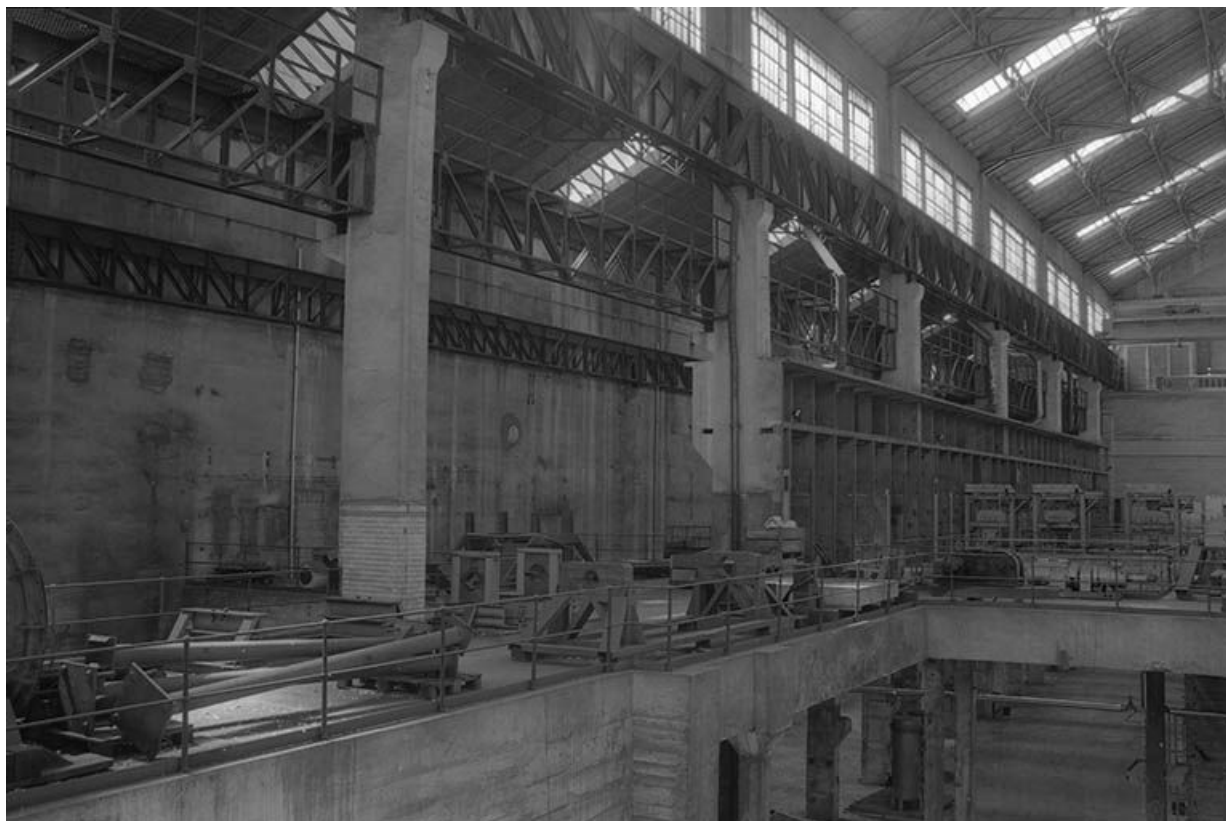
Le bâtiment des pompes vu depuis la salle des machines (ancienne plate-forme des turboalternateurs).

71, Montceau-les-Mines, 20 quai de Moulins