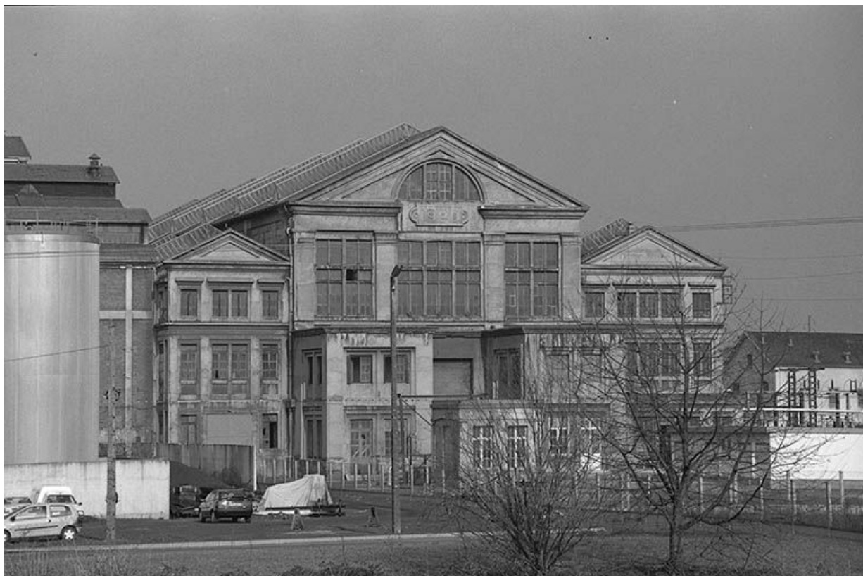
Façade antérieure de la centrale thermique de Lucy II vue depuis le canal du Centre.

71, Montceau-les-Mines, 20 quai de Moulins