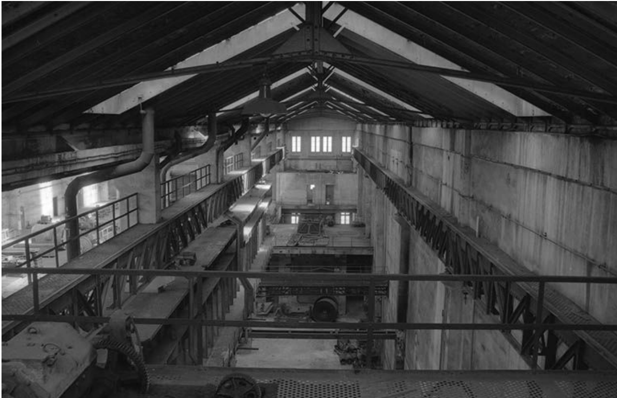
La salle des pompes photographiée depuis le pont roulant.

71, Montceau-les-Mines, 20 quai de Moulins