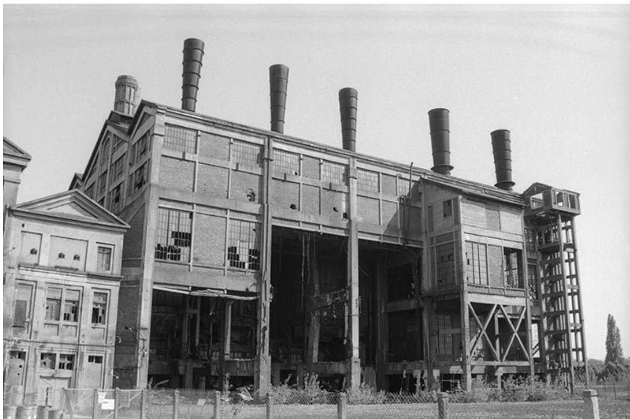
La chaufferie de Lucy II construite en 1923-1924, façade ouest.

71, Montceau-les-Mines, 20 quai de Moulins