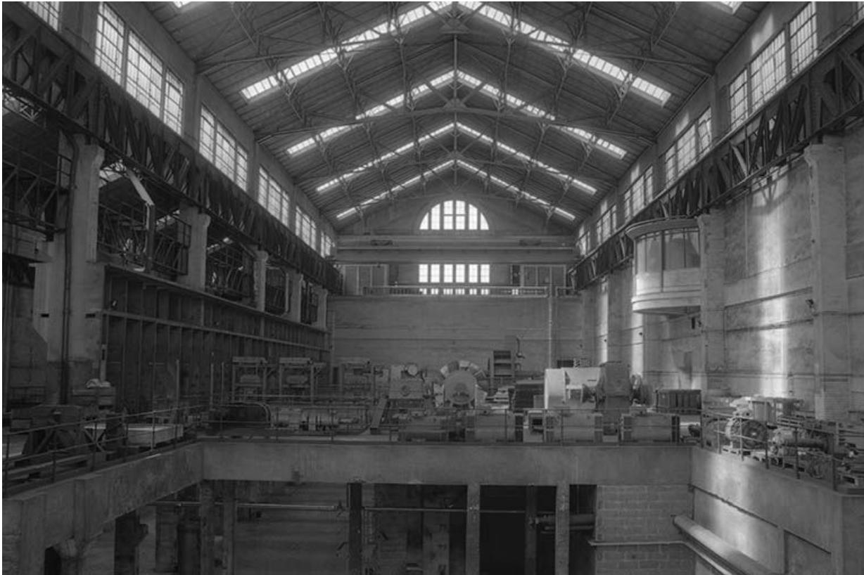
Pignon nord-ouest de la salle des machines vu depuis l'ancienne plate-forme des turboalternateurs.

71, Montceau-les-Mines, 20 quai de Moulins