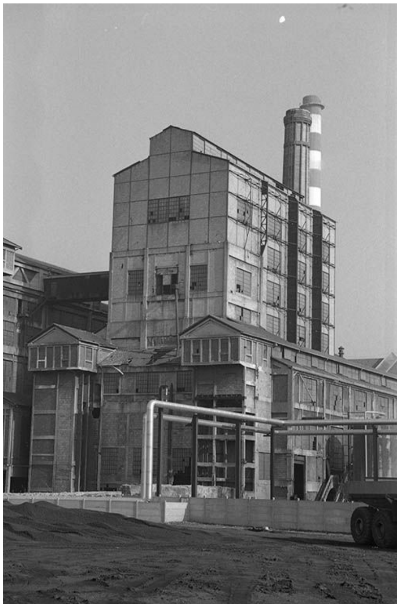
La chaufferie de Lucy II construite en 1919-1920 et son extension, pignons sud.

71, Montceau-les-Mines, 20 quai de Moulins