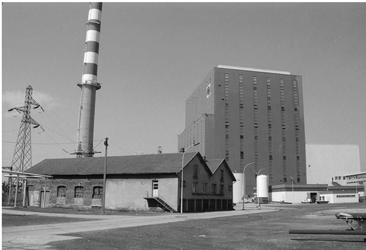
Vestiges de l'ancienne cartonnerie de Lucy vus du sud (à l'arrière, Lucy III). 71, Montceau-les-Mines, 20 quai de Moulins