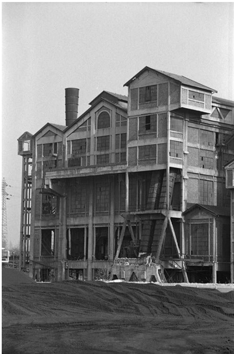
La chaufferie de Lucy II construite en 1923-1924, pignons sud.

71, Montceau-les-Mines, 20 quai de Moulins