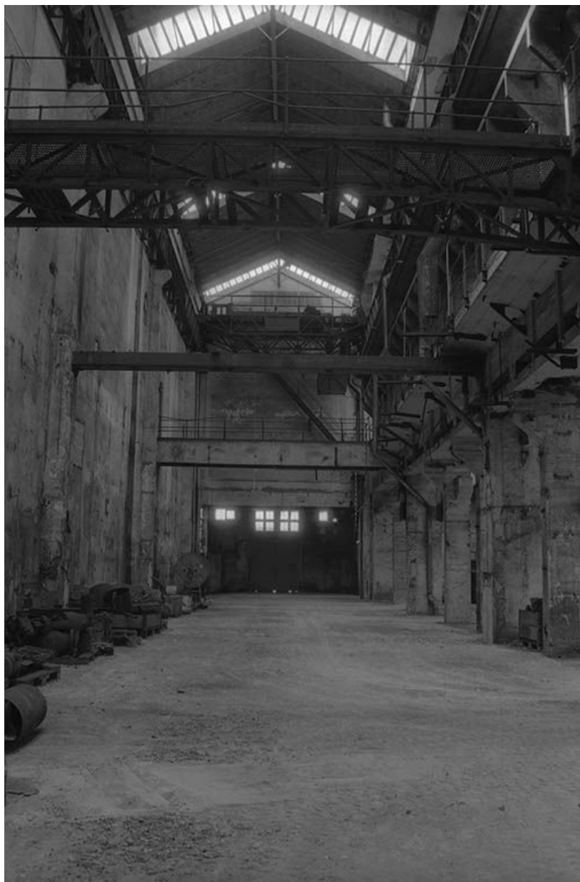
La salle des pompes (vue du pignon est). 71, Montceau-les-Mines, 20 quai de Moulins