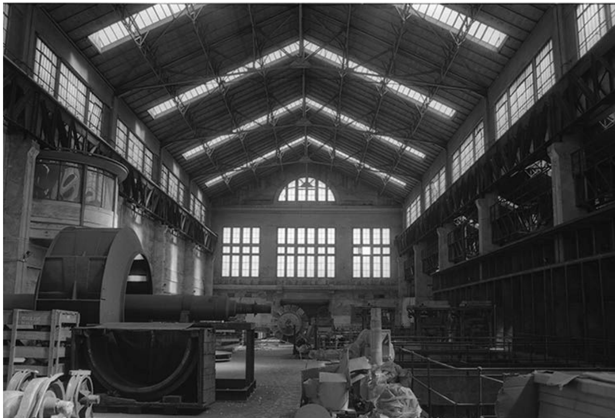
Pignon sud-est de la salle des machines vu depuis l'ancienne plate-forme des turbo-alternateurs.

71, Montceau-les-Mines, 20 quai de Moulins