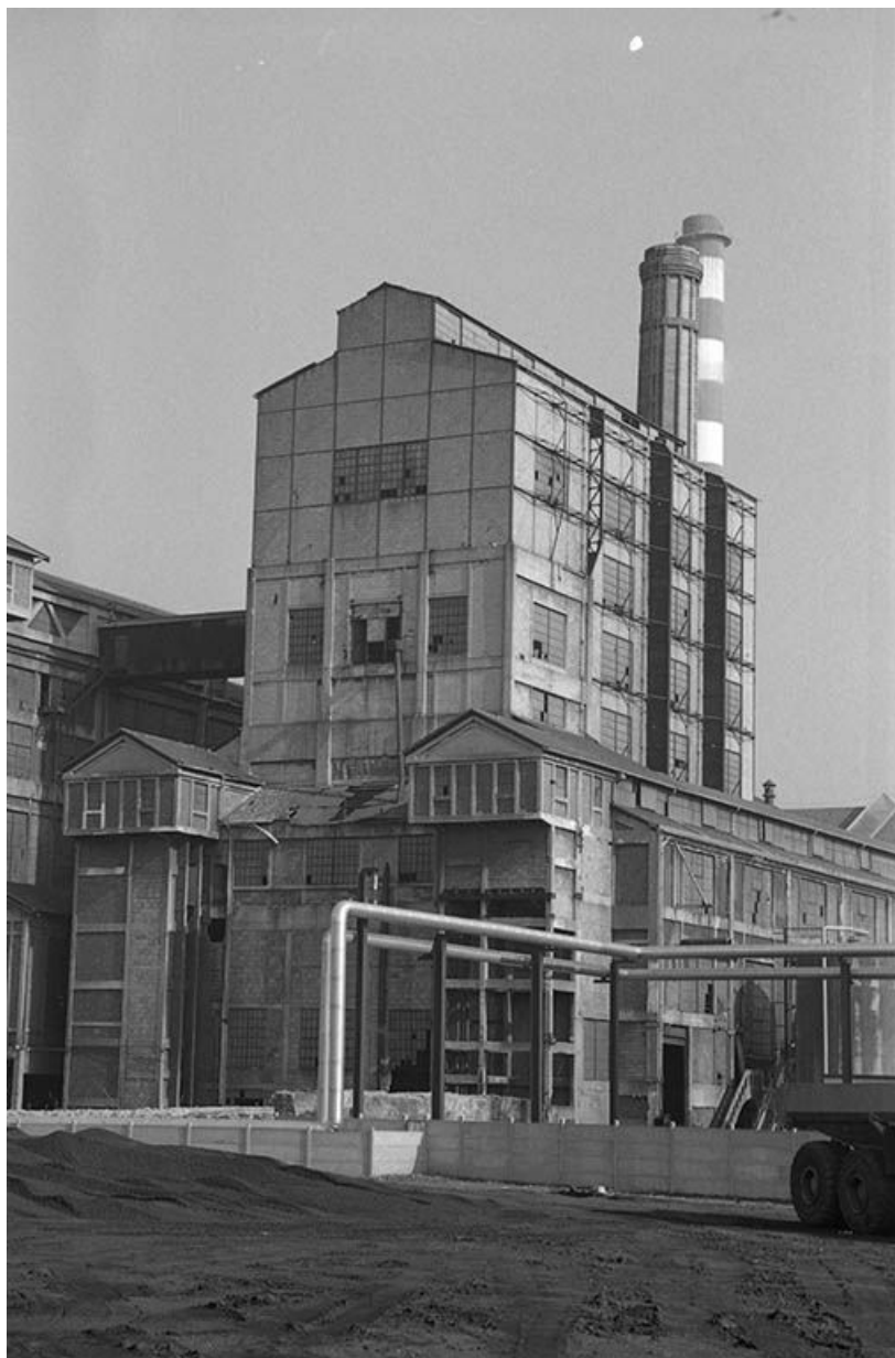
La chaufferie de Lucy II construite en 1919-1920 et son extension, pignons sud. 71, Montceau-les-Mines, 20 quai de Moulins