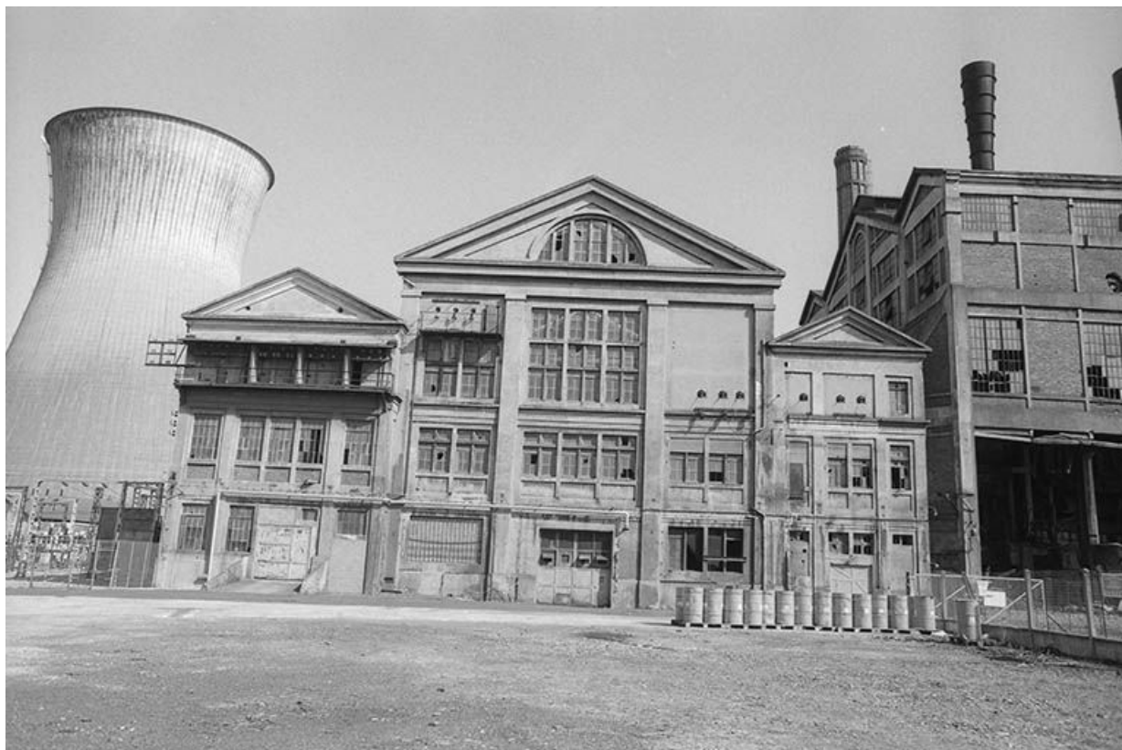
Façade postérieure de la centrale thermique de LUCY II (à droite les chaufferies, à gauche la tour de réfrigération de Lucy III). 71, Montceau-les-Mines, 20 quai de Moulins