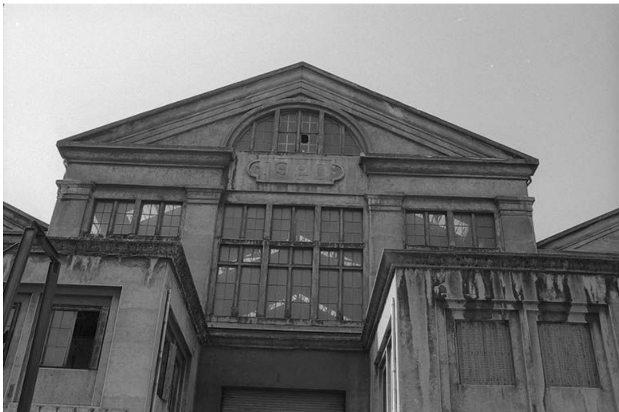
Détail de la façade de la centrale thermique de Lucy II.

71, Montceau-les-Mines, 20 quai de Moulins