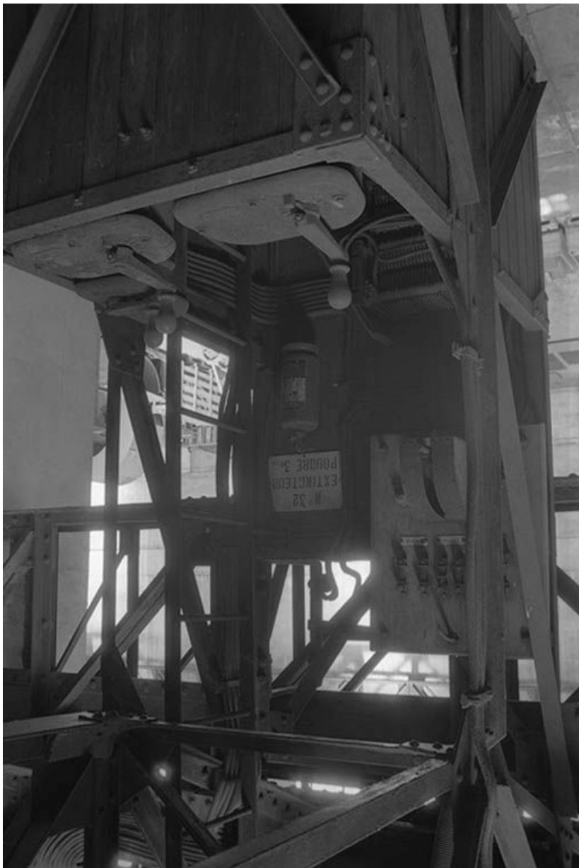
Le poste de commande du pont roulant de la salle des pompes.

71, Montceau-les-Mines, 20 quai de Moulines