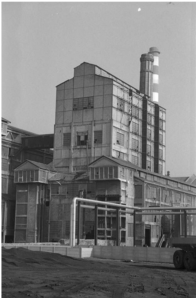
La chaufferie de Lucy II construite en 1919-1920 et son extension, pignons sud. 71, Montceau-les-Mines, 20 quai de Moulins