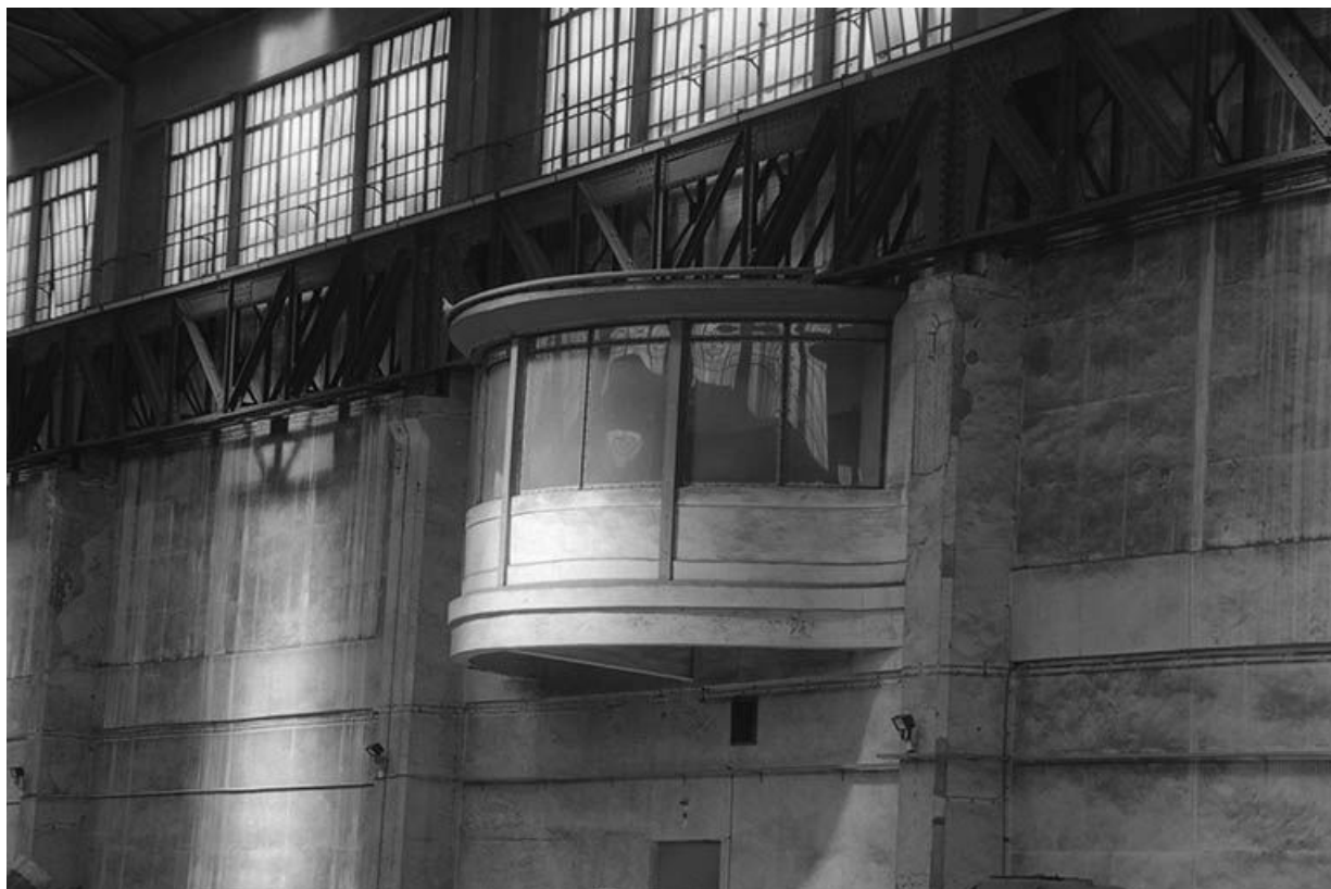
Le poste de contrôle de la salle des machines, installé dans le bâtiment des tableaux de distribution. 71, Montceau-les-Mines, 20 quai de Moulins