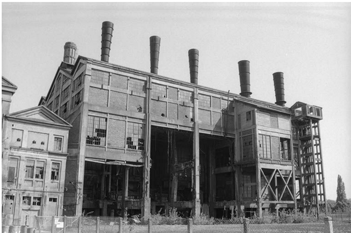
La chaufferie de Lucy II construite en 1923-1924, façade ouest.

71, Montceau-les-Mines, 20 quai de Moulins