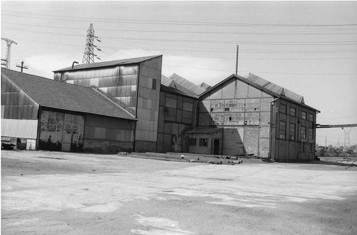
Magasins et ancien atelier " béton gaz " vus du sud.

71, Montceau-les-Mines, 20 quai de Moulins