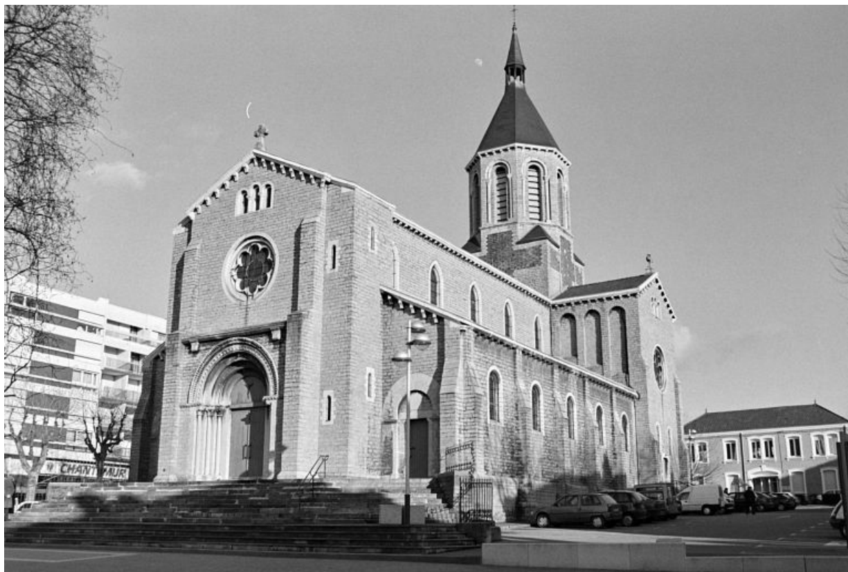
L'église paroissiale Notre-Dame vue de l'ouest.

71, Montceau-les-Mines, 53 rue de la République