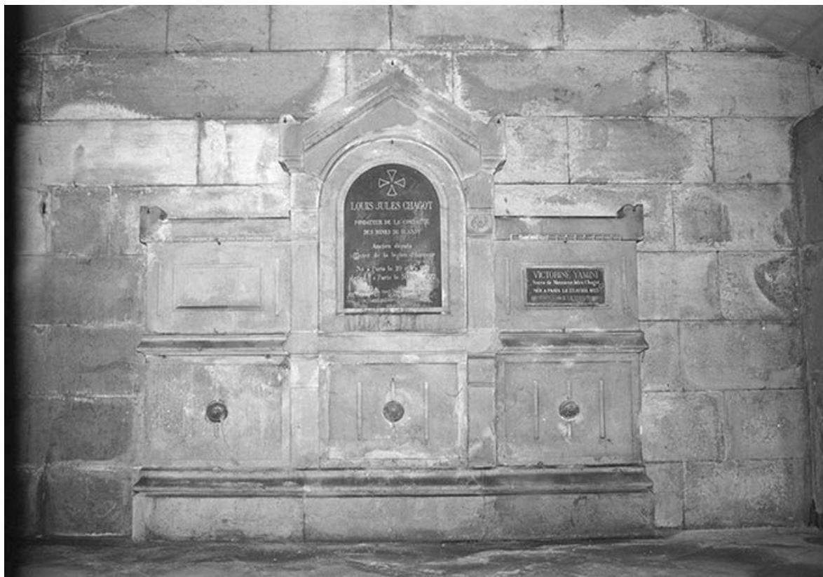
Le tombeau de Jules Chagot et Victorine Yamini (son épouse).

71, Montceau-les-Mines, 53 rue de la République