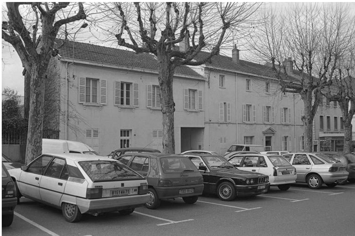
Façade antérieure du presbytère, vue de l'est. 71, Montceau-les-Mines, 53 rue de la République