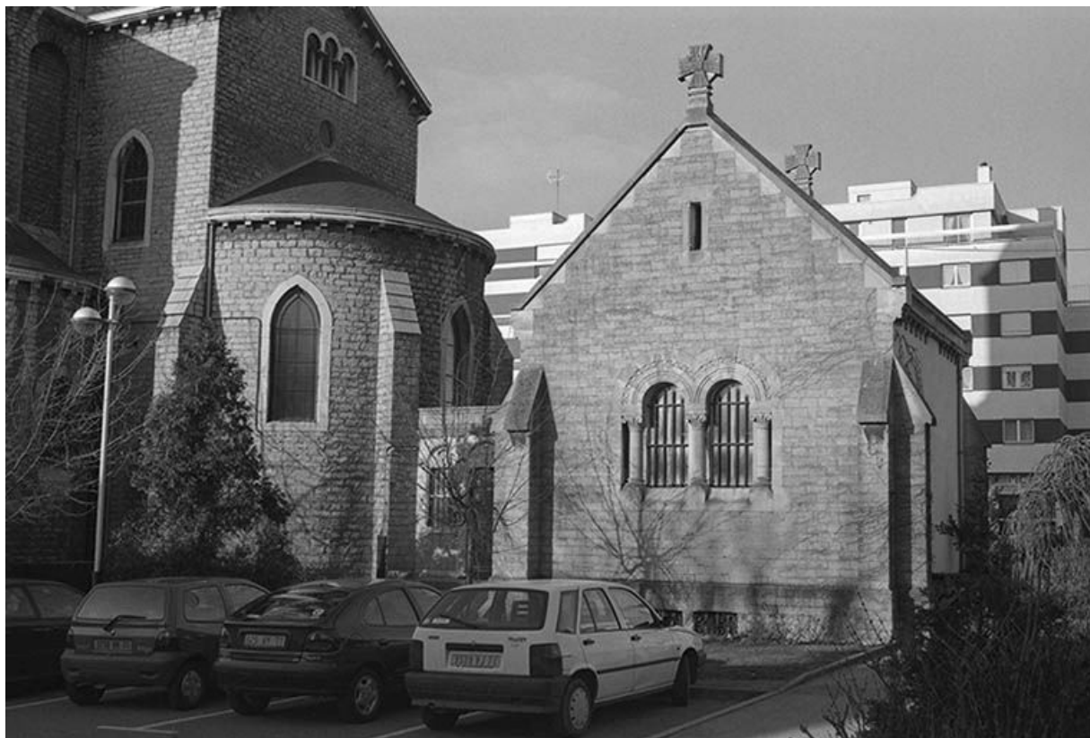
La chapelle funéraire des gérants de la Compagnie des Mines de Blanzky vue du sud. 71, Montceau-les-Mines, 53 rue de la République