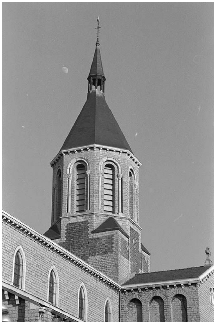
Clocher de l'église paroissiale Notre-Dame.

71, Montceau-les-Mines, 53 rue de la République