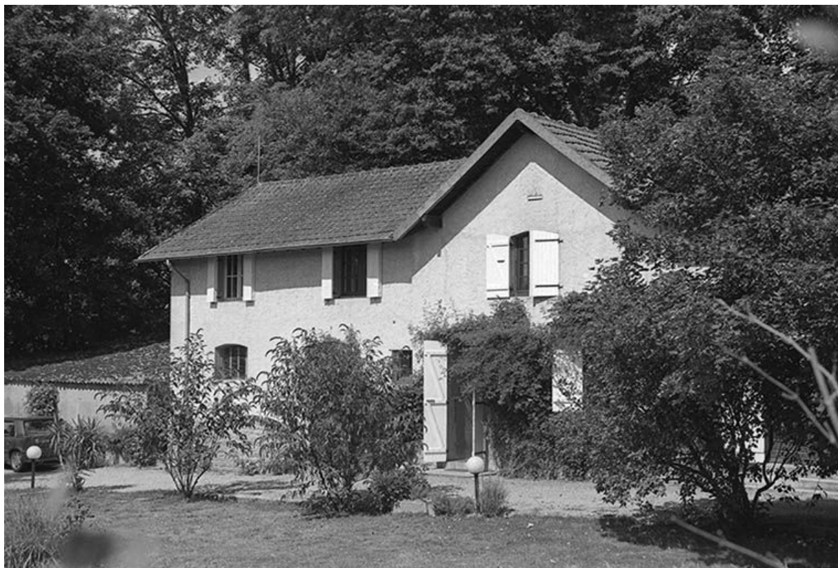
Anciennes écuries vues du Sud, façade antérieure.

71, Blanzly, 31-49 route de Montchanin, lieudit : les Angliers