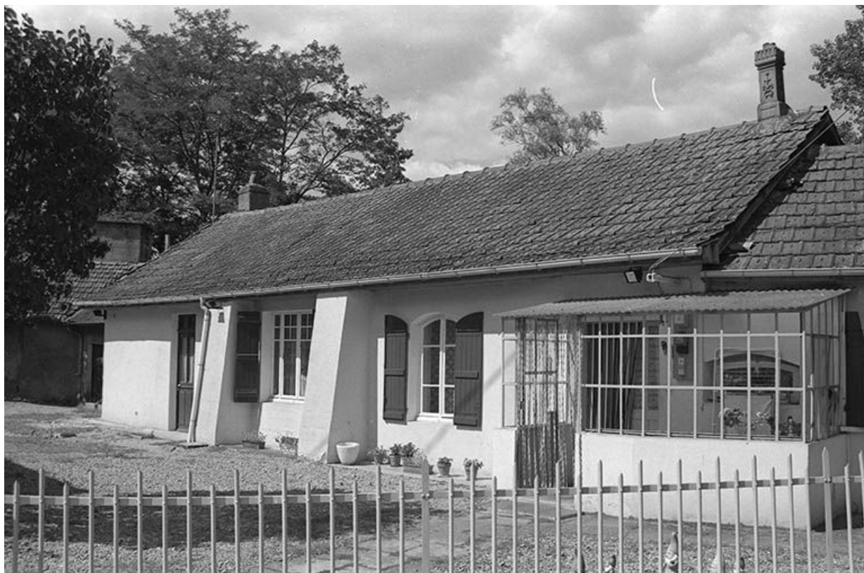
Anciens logements ouvriers (?) vus du Sud Est, façade antérieure.

71, Blanzay, 31-49 route de Montchanin, lieudit : les Angliers