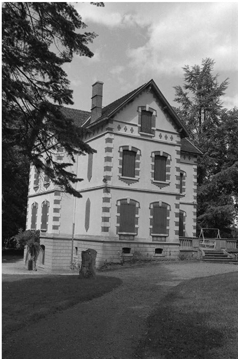
Ancien logement patronal dit " villa des Angliers " vu du Sud, façade antérieure. 71, Blanzly, 31-49 route de Montchanin, lieudit : les Angliers