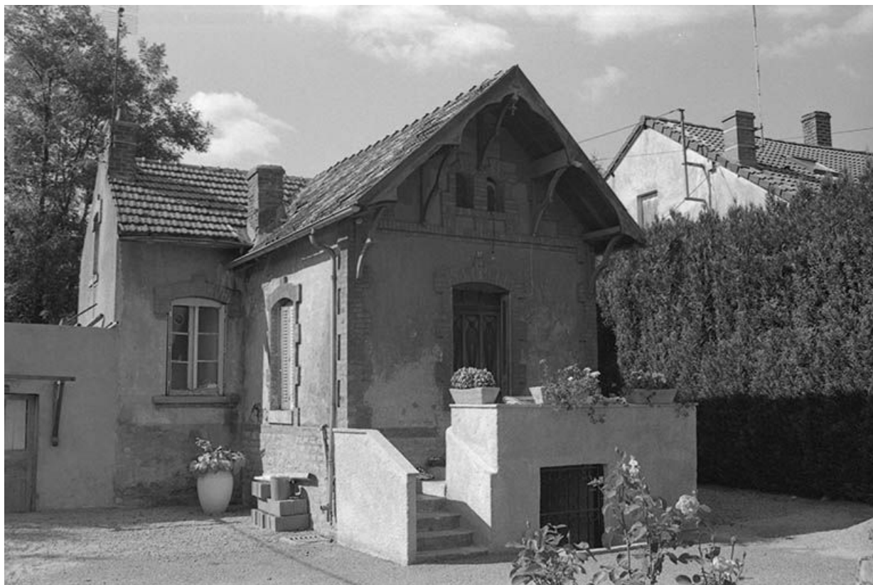
Anciens bureaux (?) vus du Sud Est, façade antérieure. 71, Blanzly, 31-49 route de Montchanin, lieudit : les Angliers