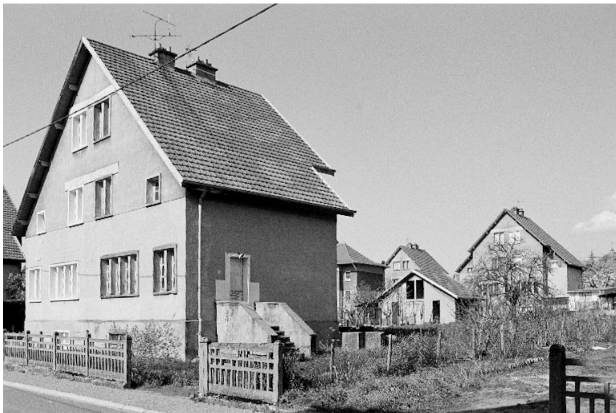
Bâtiment à 2 logements " type 16 " à meneaux, 1946-1948.