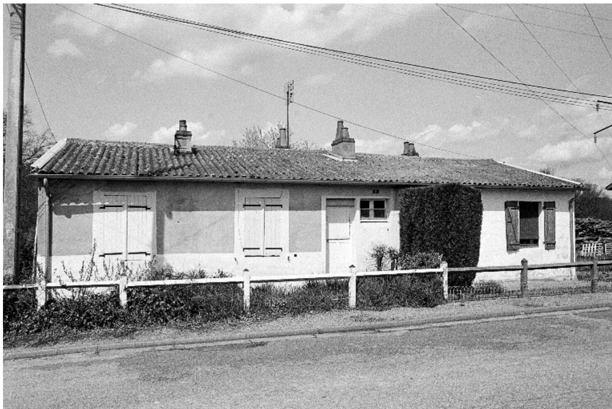
Bâtiment à 3 logements " type R ", 1939-1945.