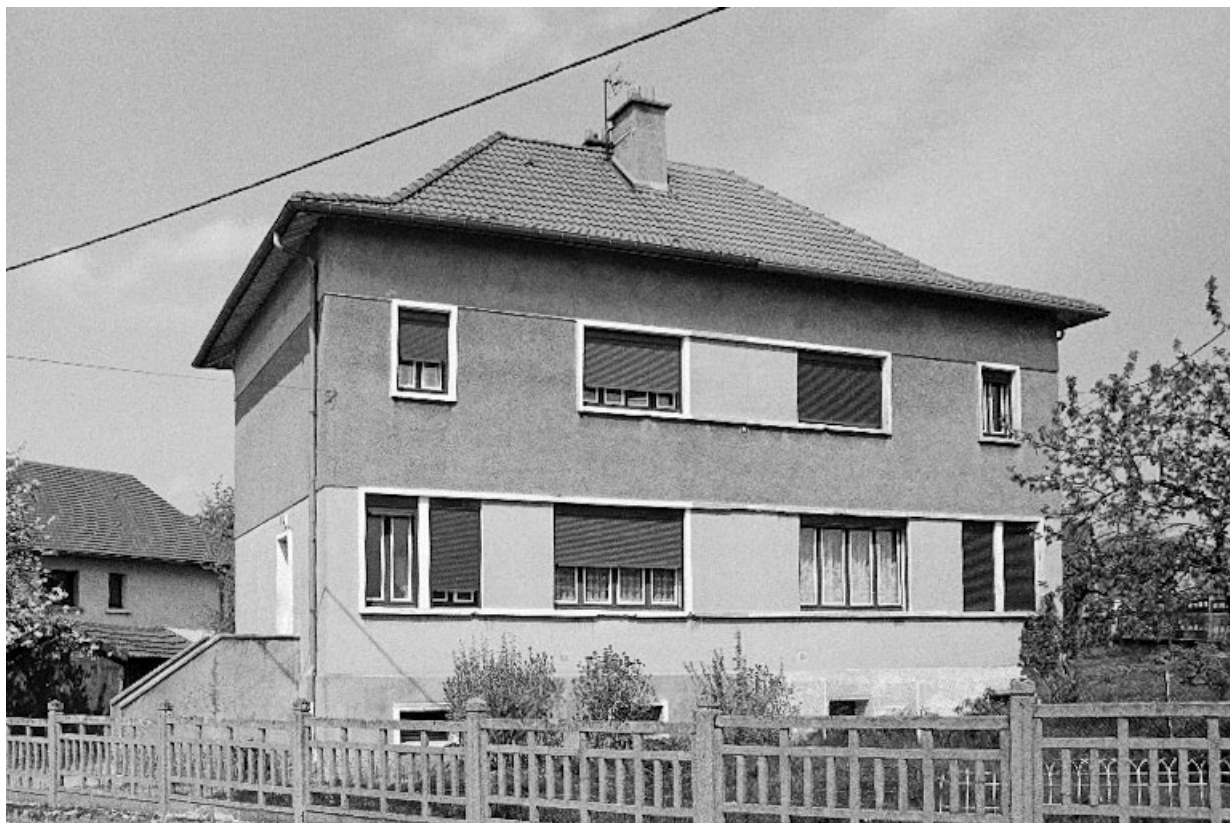
Bâtiment à 2 logements " type 16 rectifié ", toit à longs pans et croupes, 1946-1948.