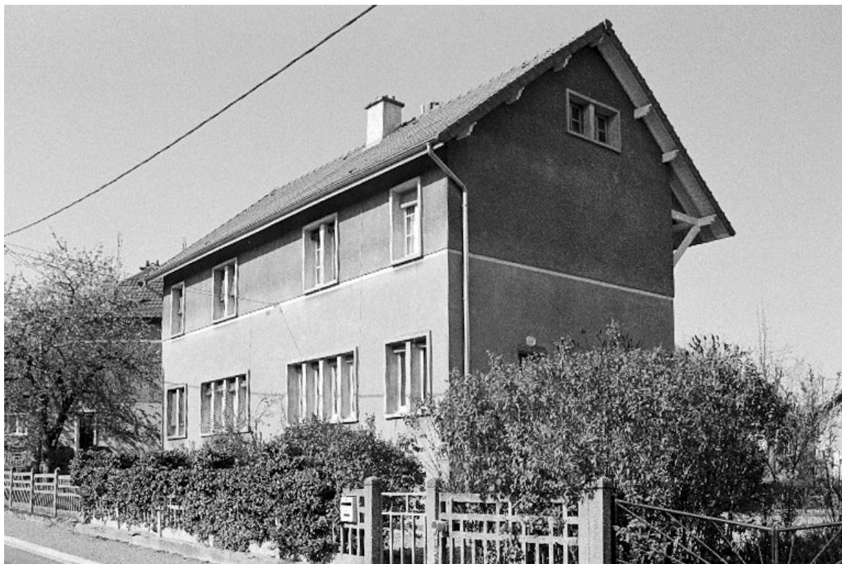
Bâtiment à 2 logements " type 16 rectifié ", toit à longs pans, 1946-1948. 71, Ciry-le-Noble, lieudit : Rozelay