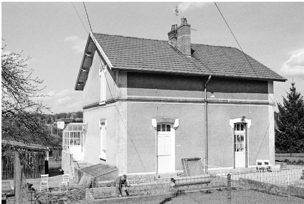
Bâtiment à 2 logements " type 8 ", 1938-1939.