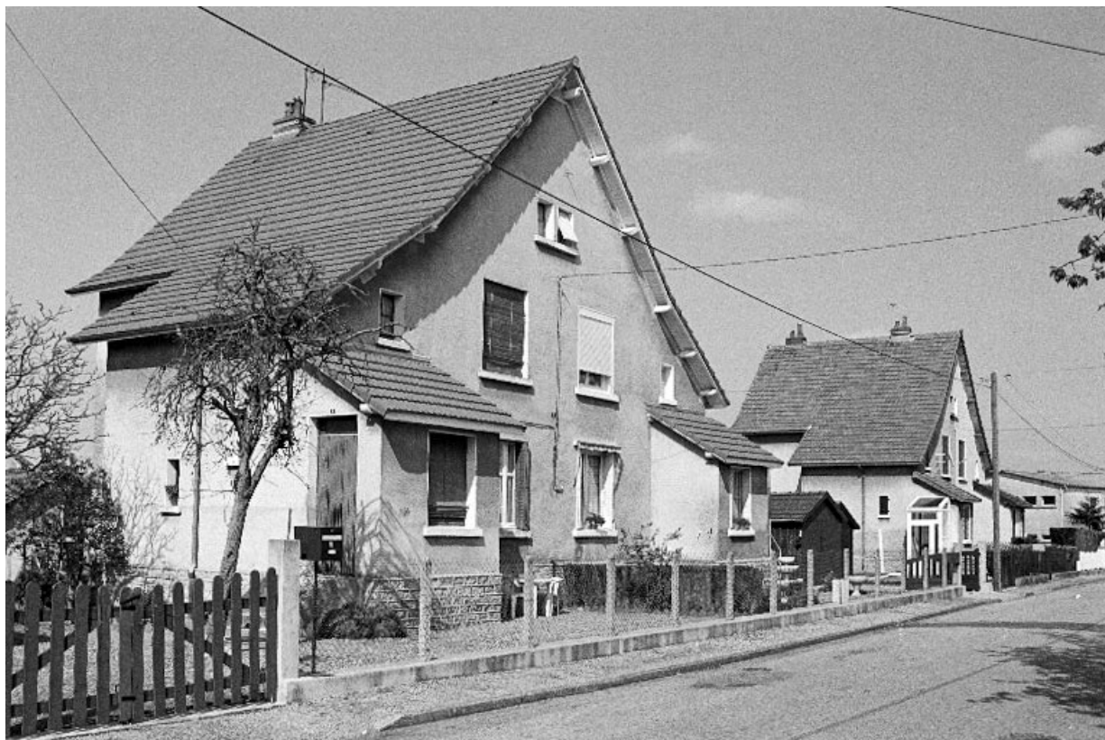
Bâtiment à logements " type 14 ", 1939-1945. 71, Ciry-le-Noble, lieudit : Rozelay