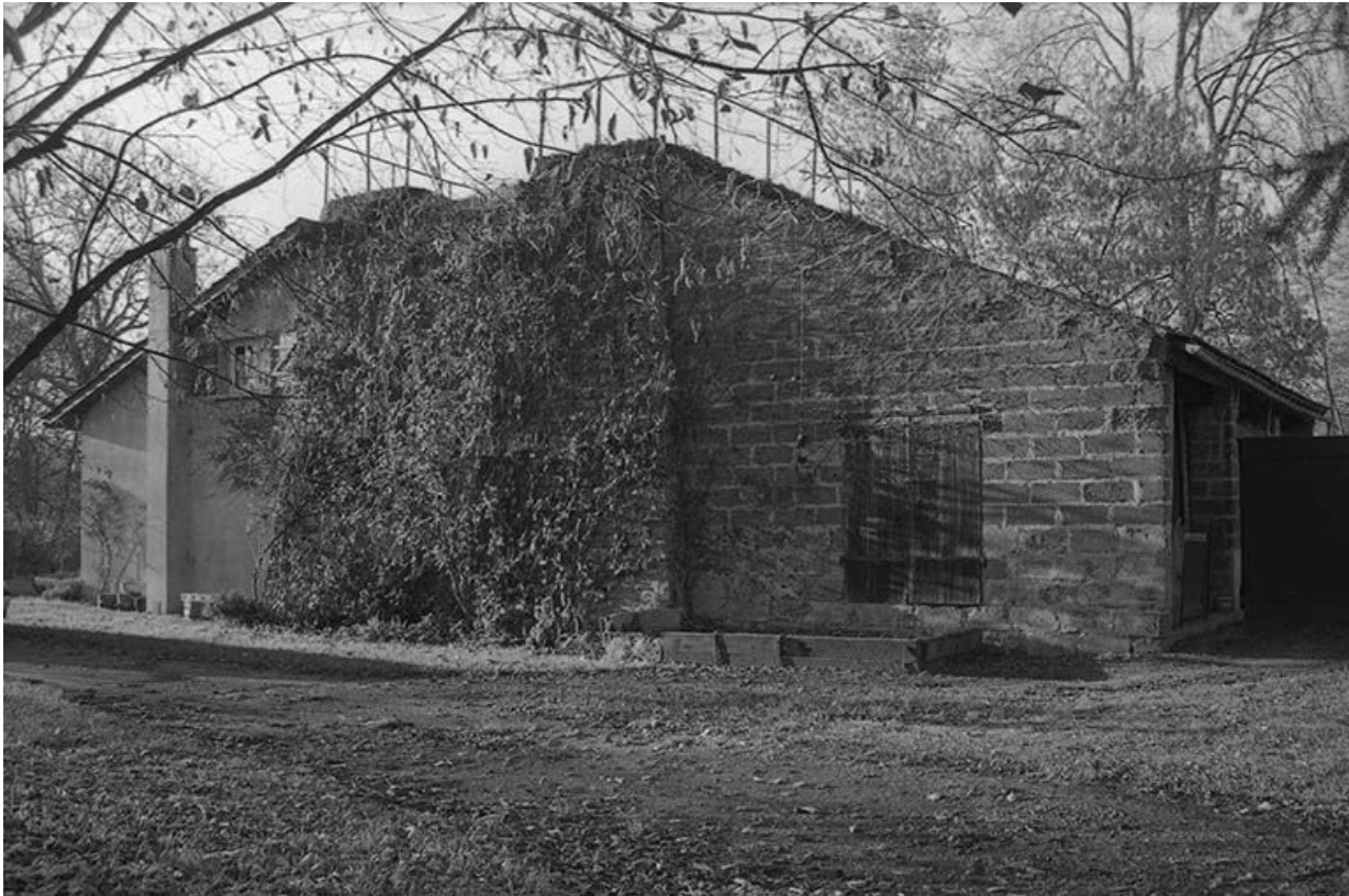
Fours à chaux vus du sud-est.

71, Ciry-le-Noble rue du 11 Novembre 1918, lieudit : le Bassin