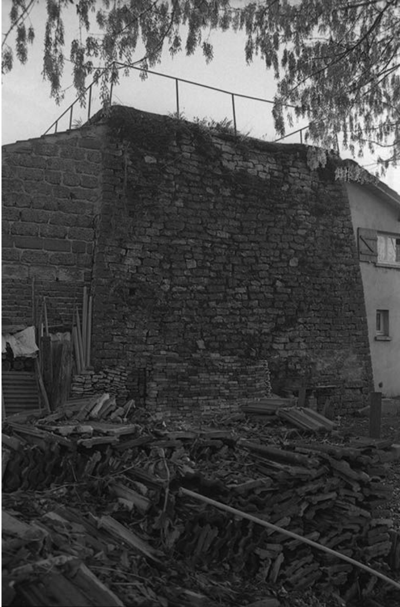
Fours à chaux vus du nord-ouest.

71, Ciry-le-Noble rue du 11 Novembre 1918, lieudit : le Bassin