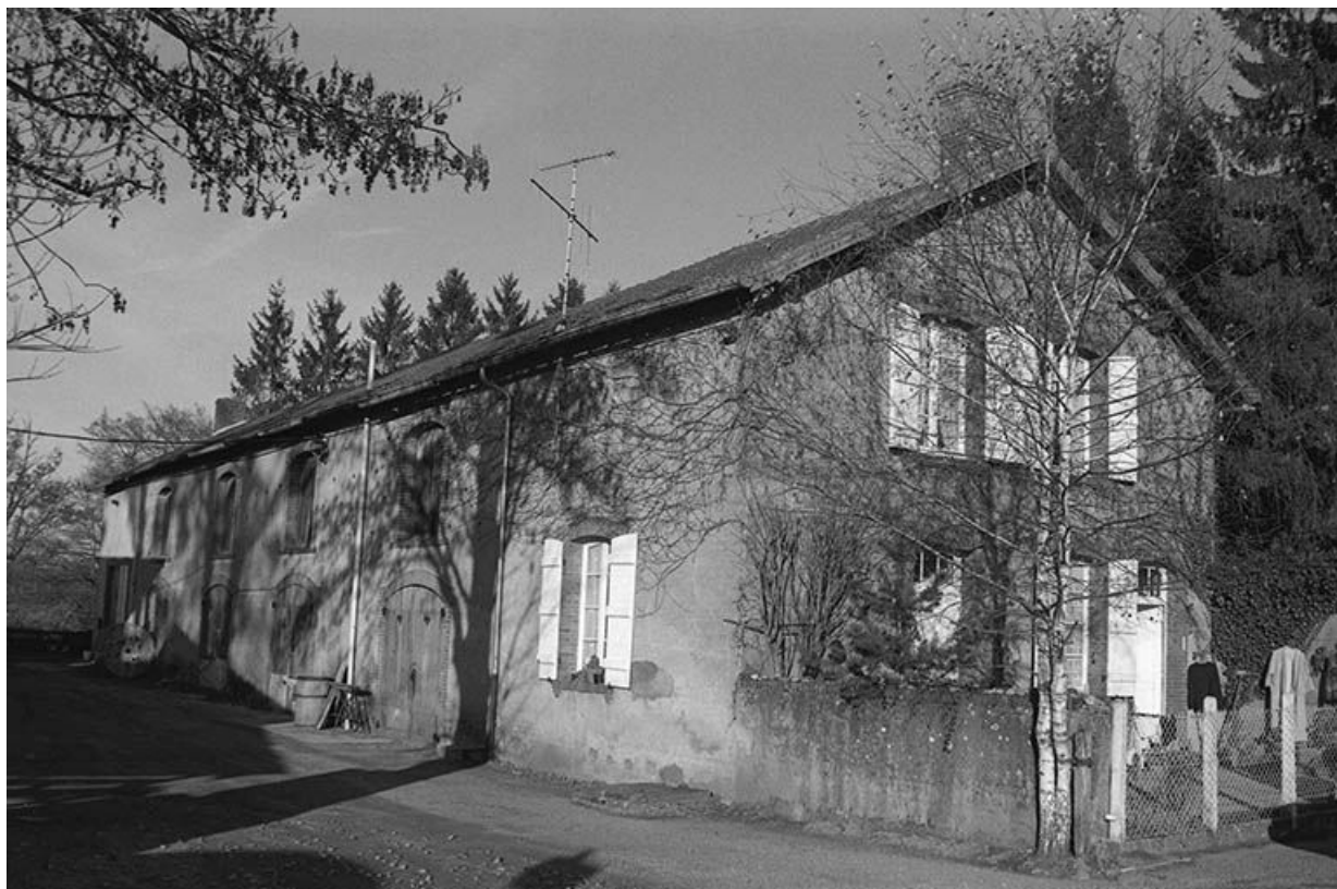
Ecuries et logement, vus depuis le canal.

71, Ciry-le-Noble, lieudit : Les Touillards