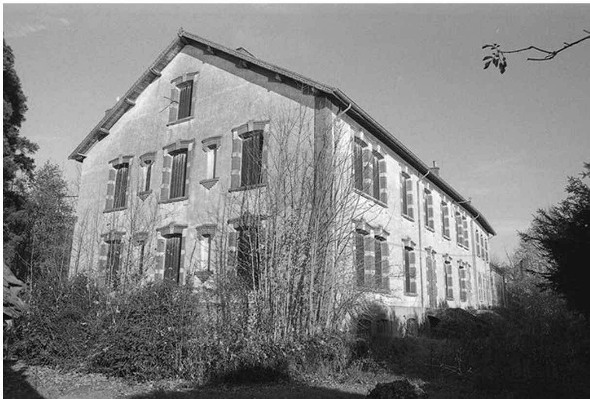
L'ancien bâtiment des fours et séchoirs, transformé en habitation Pignon et façade antérieure, vus du sud-ouest (depuis le bâtiment d'eau).

71, Ciry-le-Noble, lieudit : Les Touillards