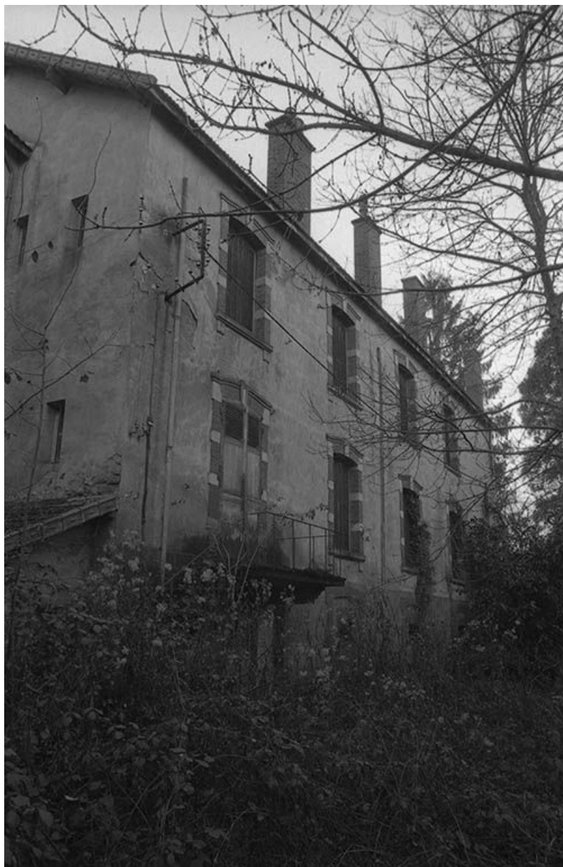
L'ancien bâtiment des fours et séchoirs, transformé en habitation Façade postérieure, vue du nord-est. 71, Ciry-le-Noble, lieudit : Les Touillards