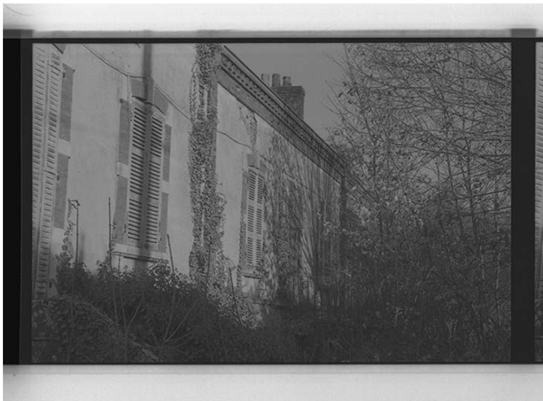
Les plus anciens logements patronaux du site de l'usine Baudot, façade antérieure vue du sud-ouest. 71, Ciry-le-Noble, lieudit : Les Touillards