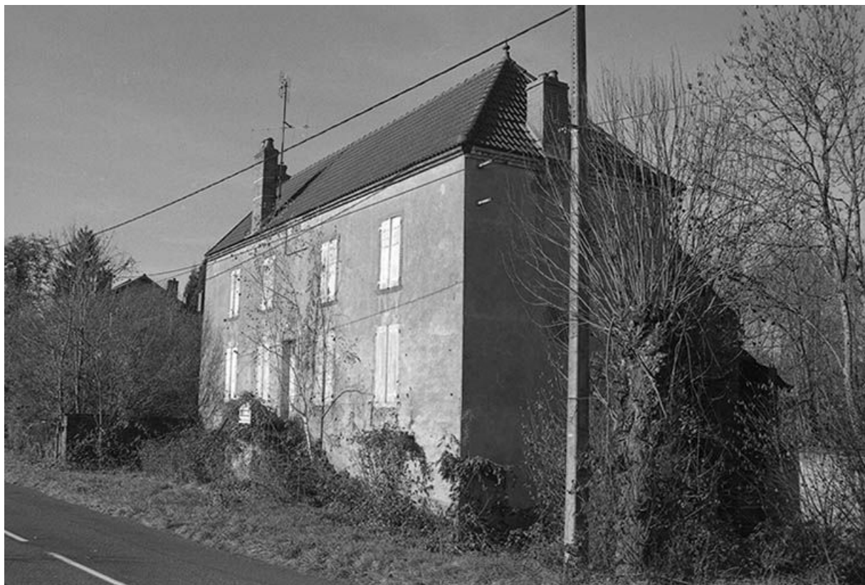
Logements d'ouvriers à l'est de l'usine, façade antérieure vue du sud-est.

71, Ciry-le-Noble, lieudit : Les Touillards