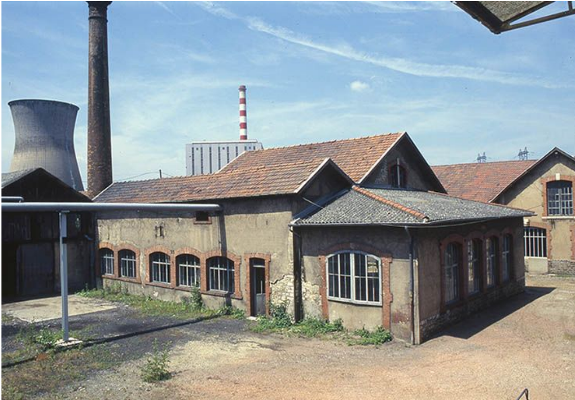
Façade postérieure de l'atelier de montage.