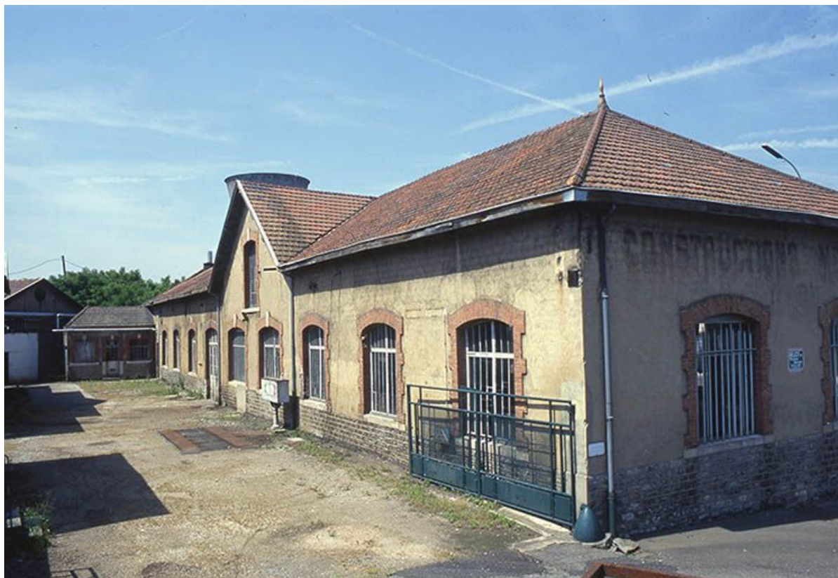
Façade antérieure de l'atelier d'ajustage et de tournage.