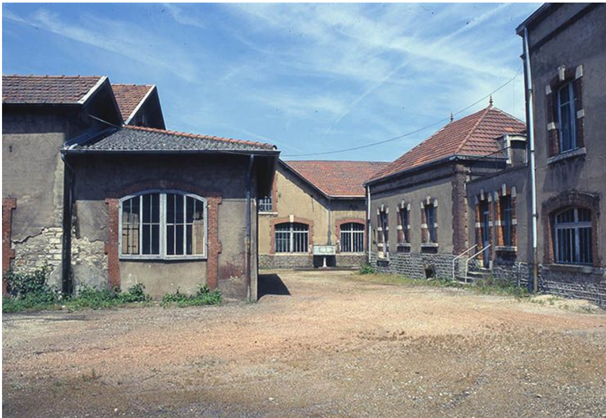
Cour des ateliers : à gauche une extension de l'atelier de montage, au fond l'atelier d'ajustage, à droite les bureaux. 71, Montceau-les-Mines, 2 rue de Gilly