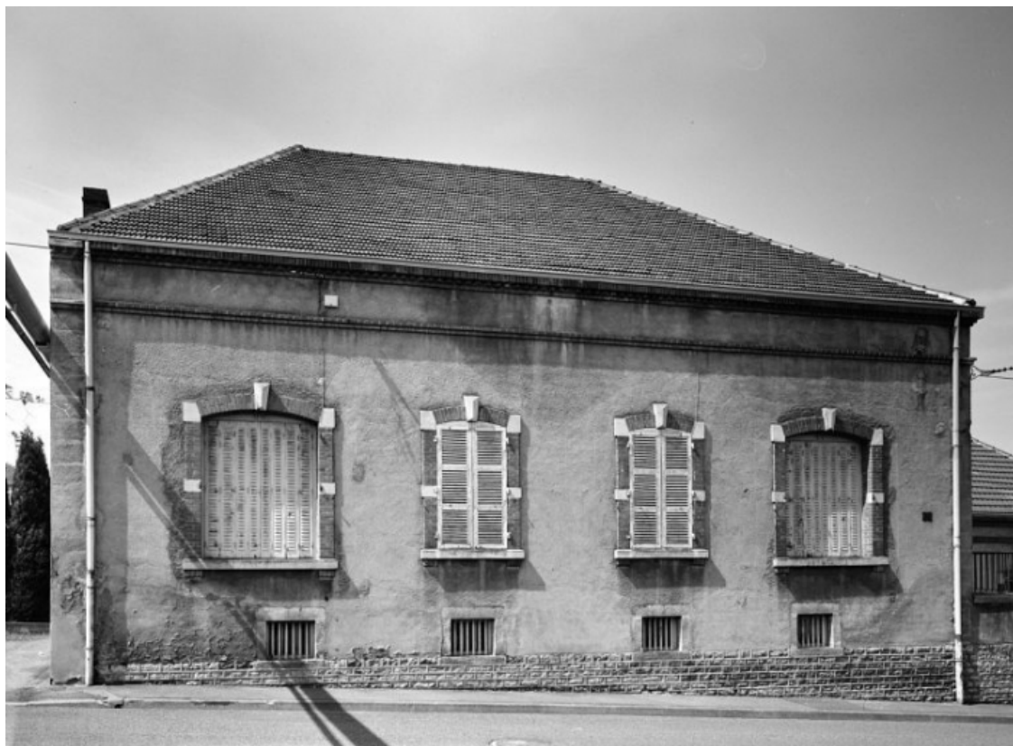
Façade postérieure de l'ancien logement du directeur, transformé en bureau après 1945.