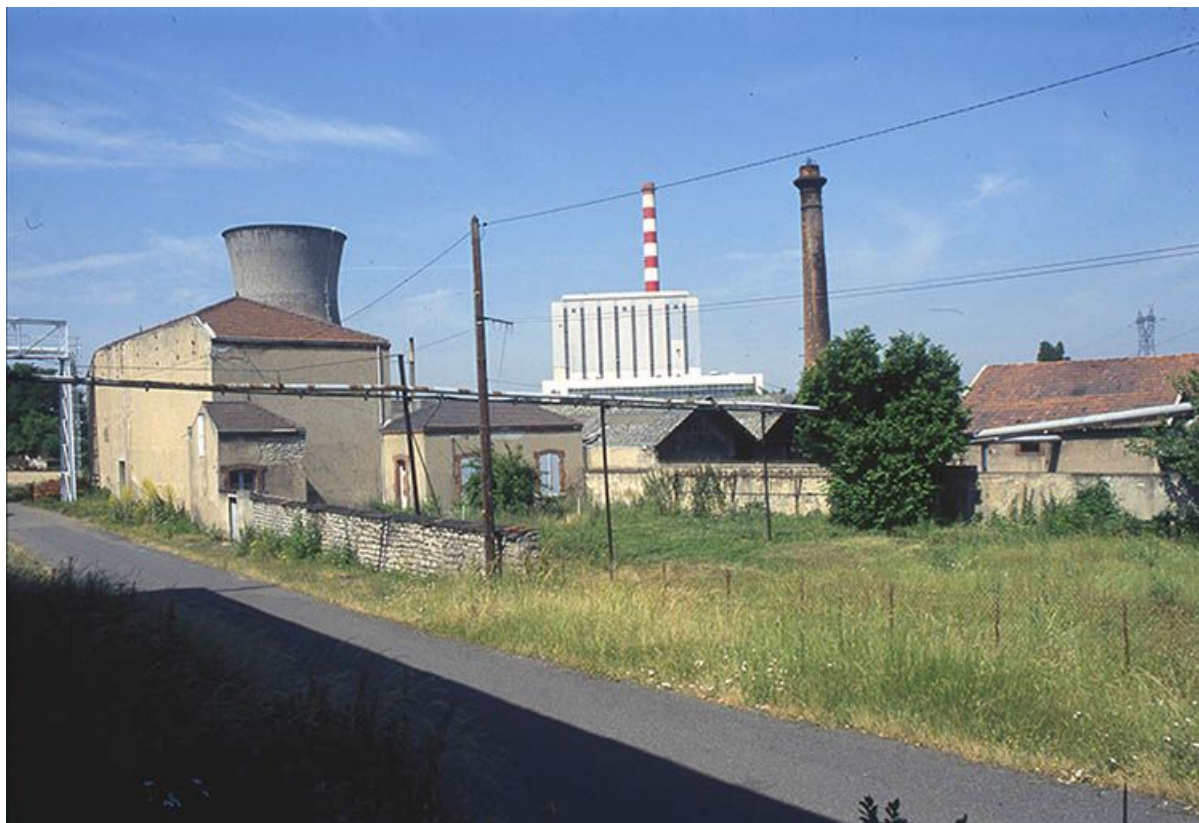
Le site des Ateliers de Constructions mécaniques Aillot vu depuis la rue des Prés.