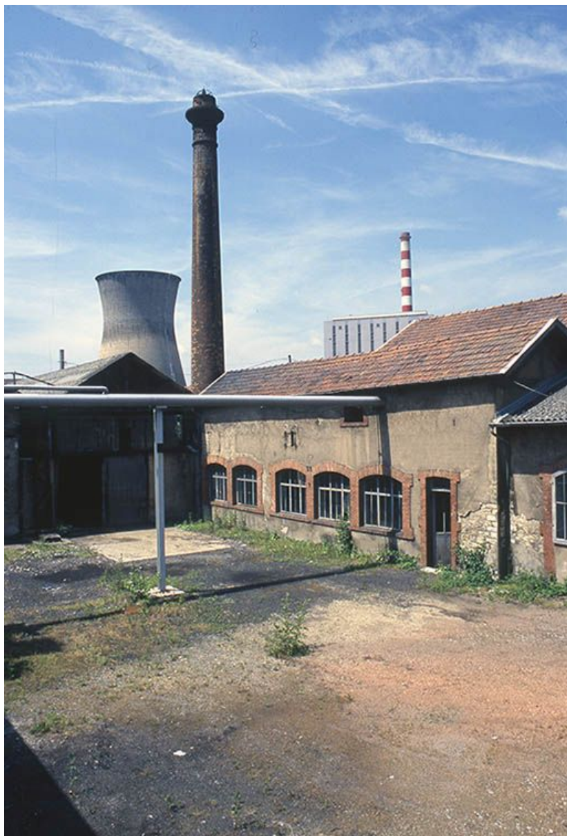
Façade postérieure de l'atelier de montage.