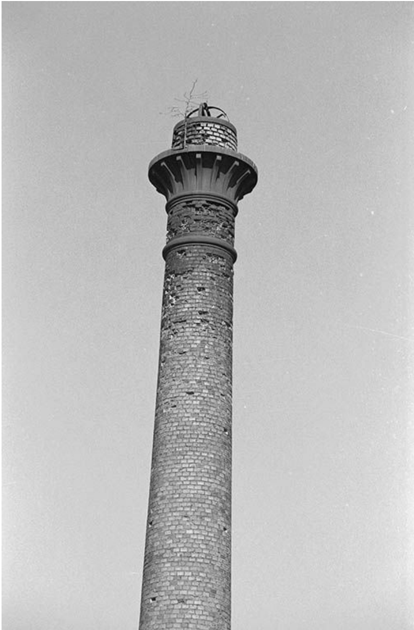
Cheminée des ateliers et son couronnement en fonte.