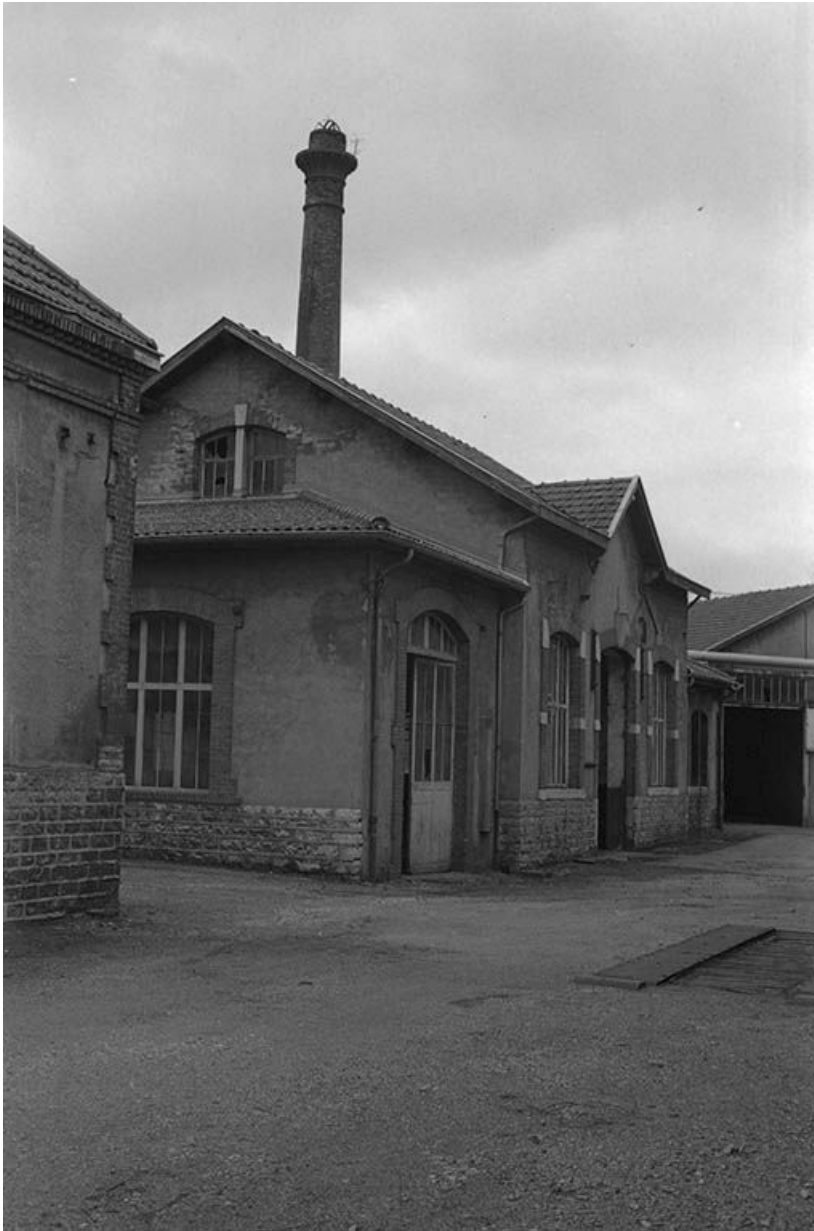
Façade antérieure de l'atelier de montage.