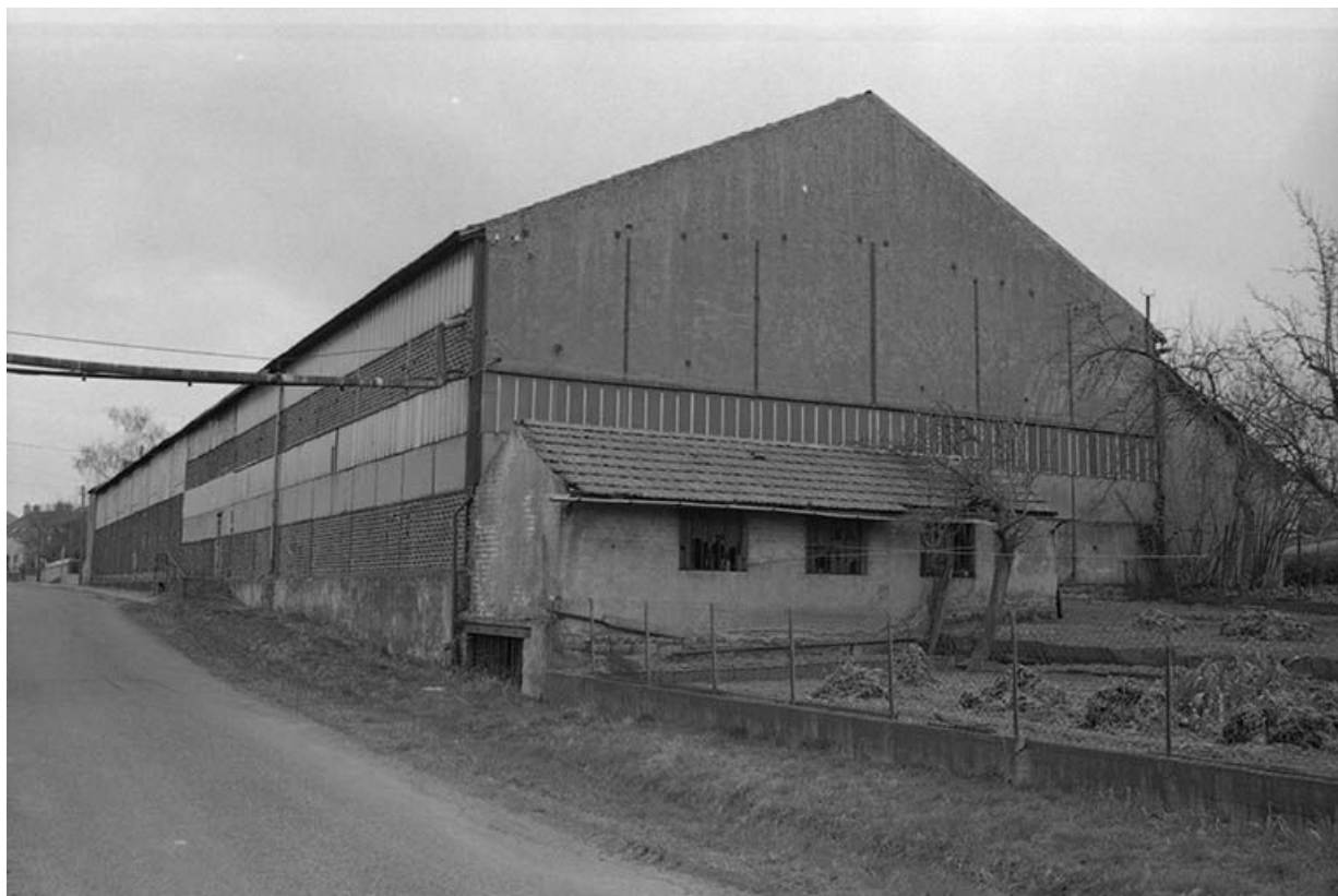
Ancienne chaudronnerie Prudhon acquise par les Ateliers de Constructions Mécaniques Aillot en 1937-39. 71, Montceau-les-Mines, 2 rue de Gilly