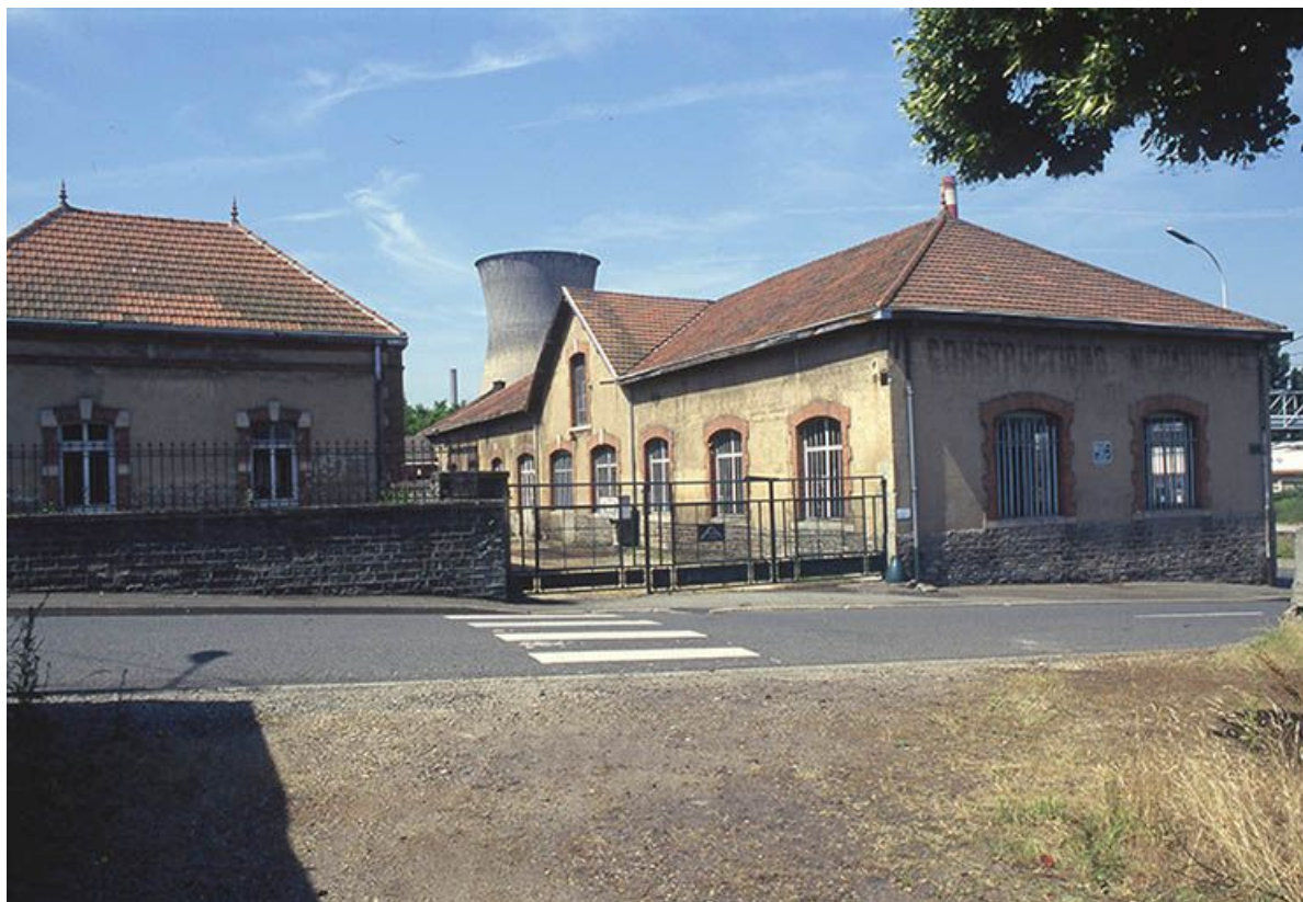
Façade postérieure de l'ancien logement du directeur, transformé en bureau après 1945.