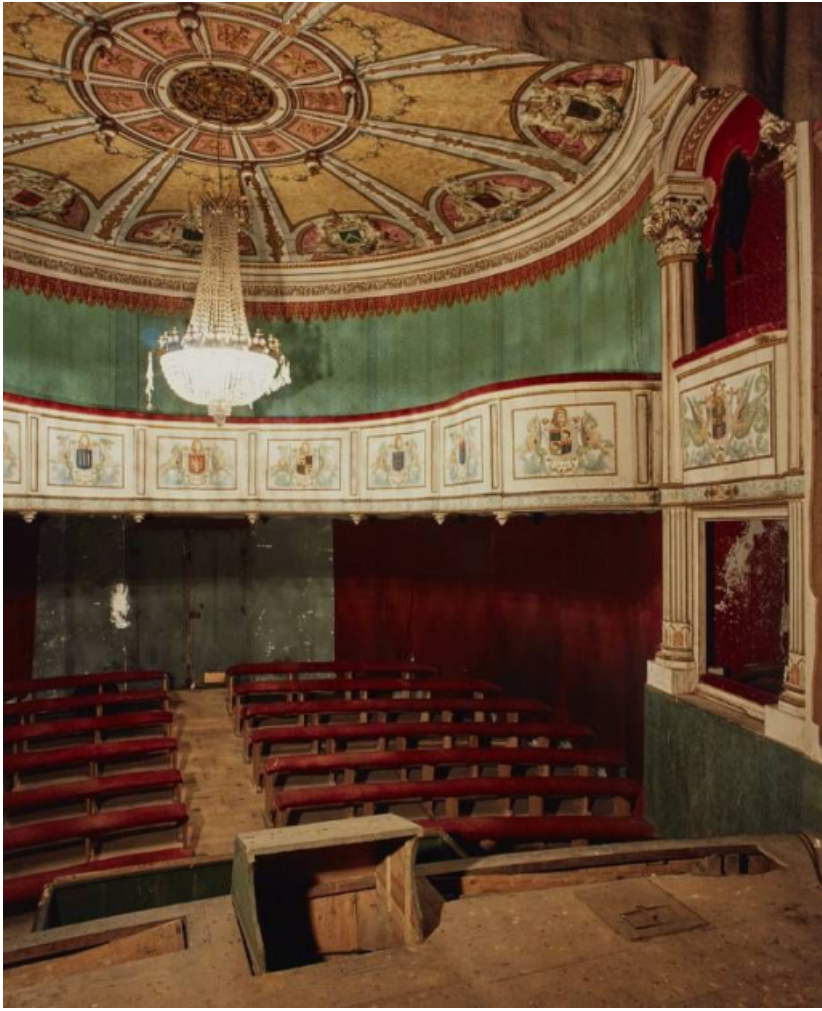
Salle vue depuis la scène.