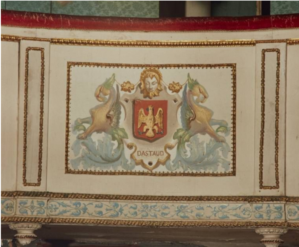
Garde-corps de la galerie : détail des armoiries.