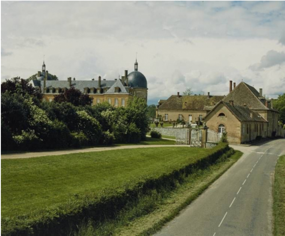
Vue d'ensemble du château.