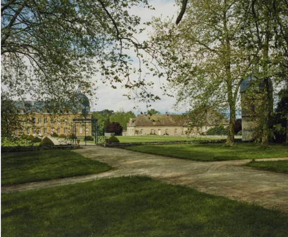
Vue d'ensemble : château et ses dépendances abritant le théâtre.