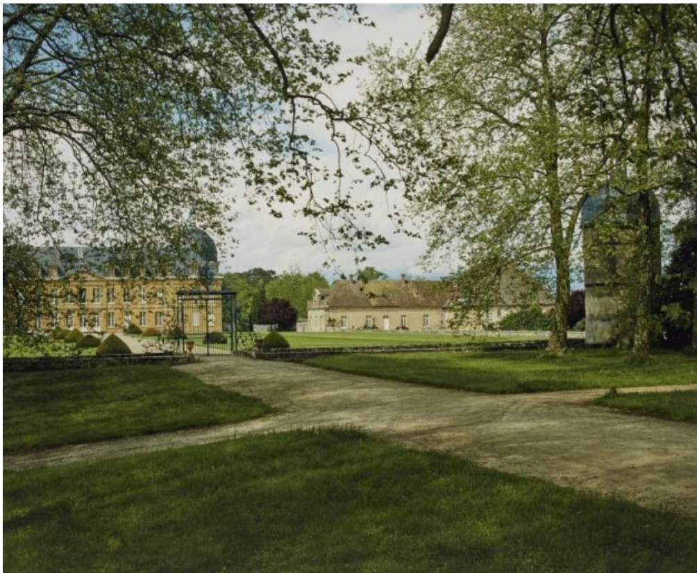
Vue d'ensemble : château et ses dépendances abritant le théâtre.