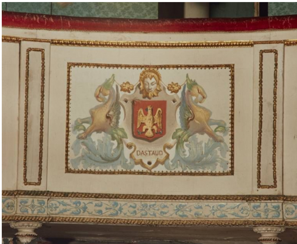
Garde-corps de la galerie : détail des armoiries.