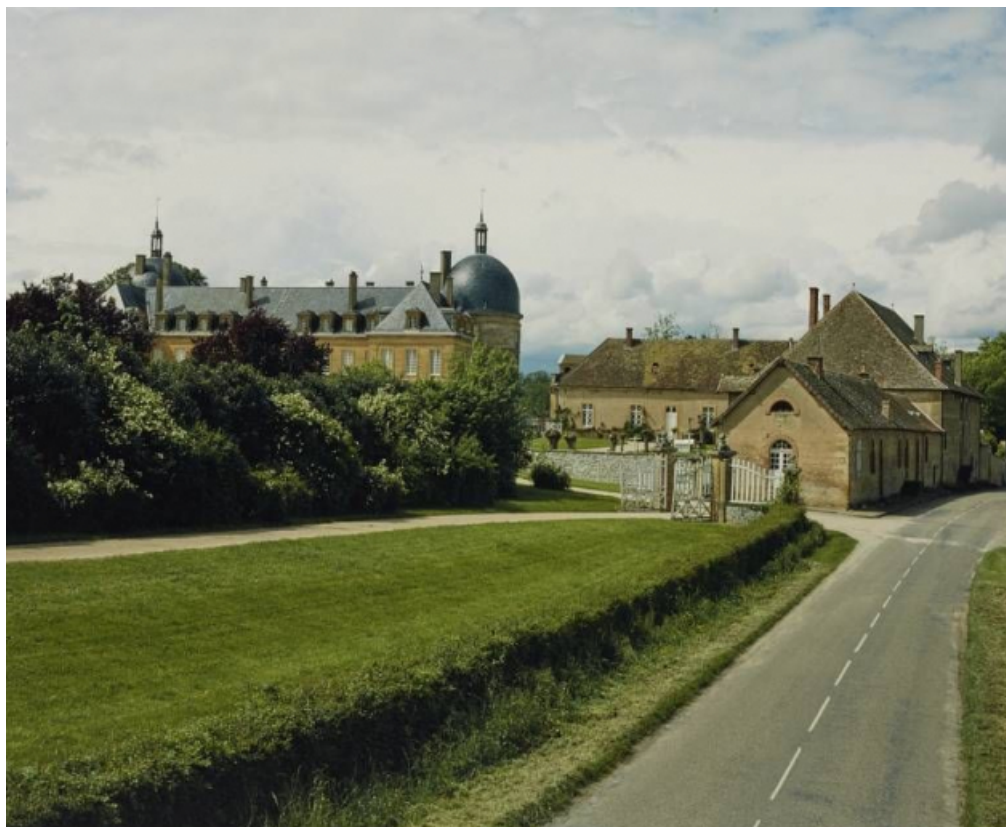
Vue d'ensemble du château.