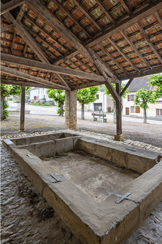
L'intérieur du lavoir, depuis le fond.