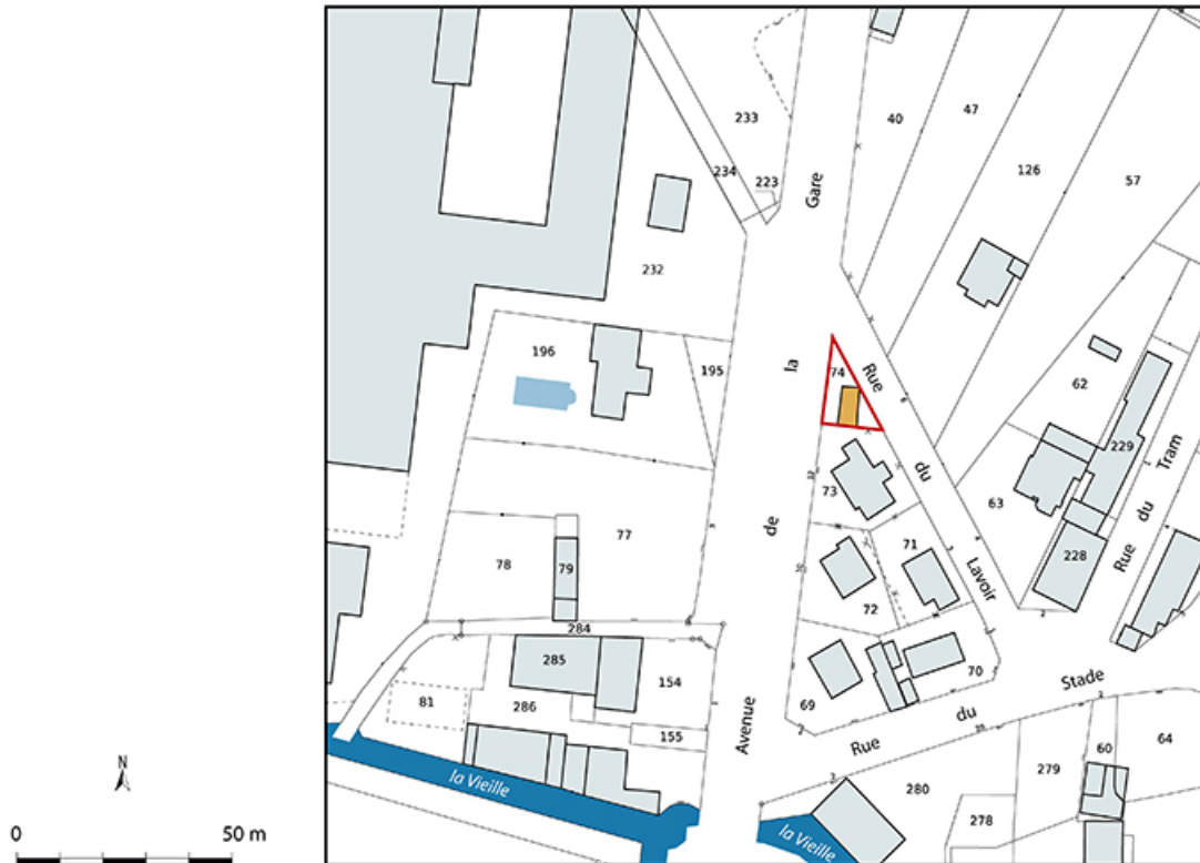
Plan-masse et de situation. Extrait du plan cadastral numérisé de la direction générale des finances publiques, 2025, 1/1 000. 70, Jussey avenue de la Gare, lieudit : la gare