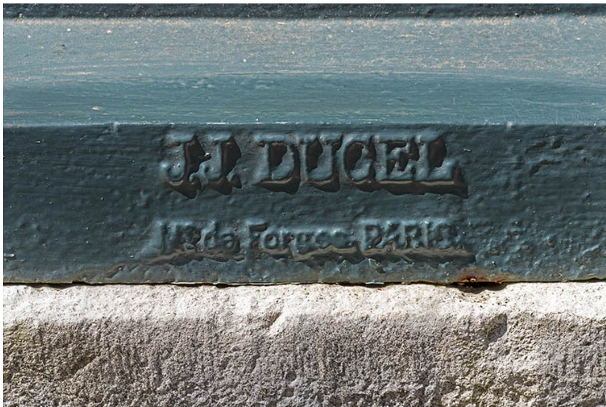
Signature de la fonderie au revers de la fontaine.