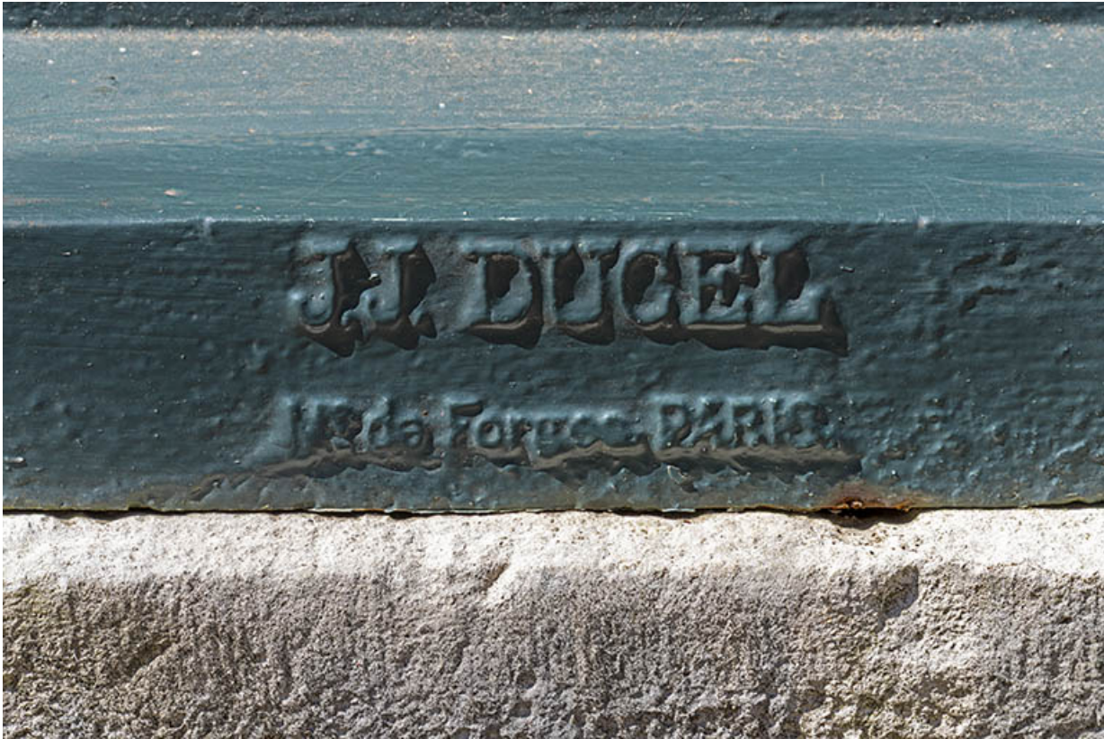
Signature de la fonderie au revers de la fontaine.