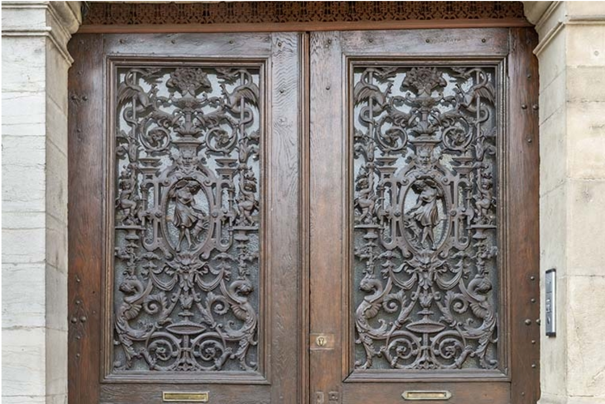
Vantaux de la porte cochère.