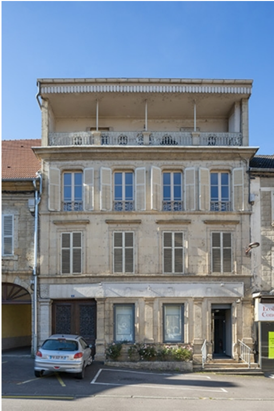
Façade de l'immeuble sur la rue.