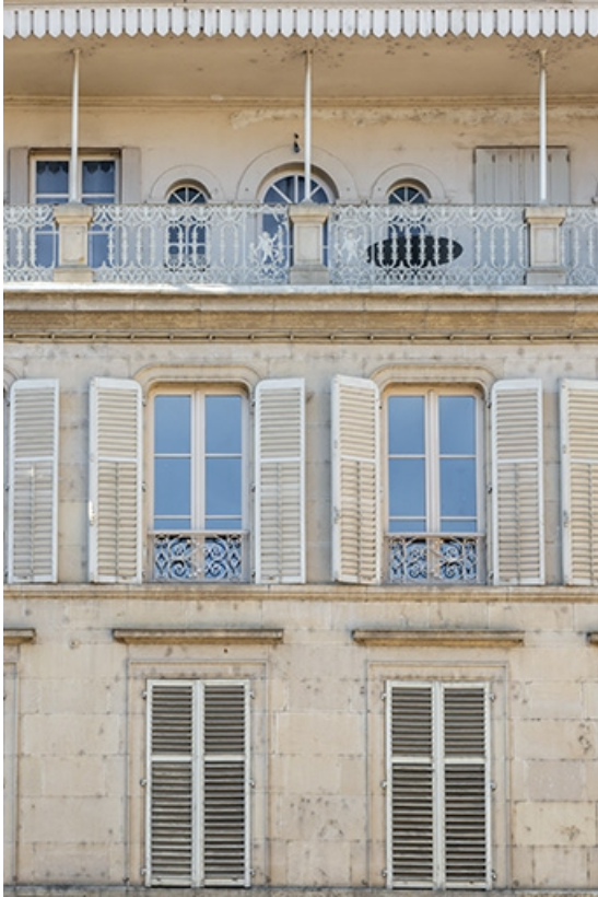
Détail de deux travées des étages.