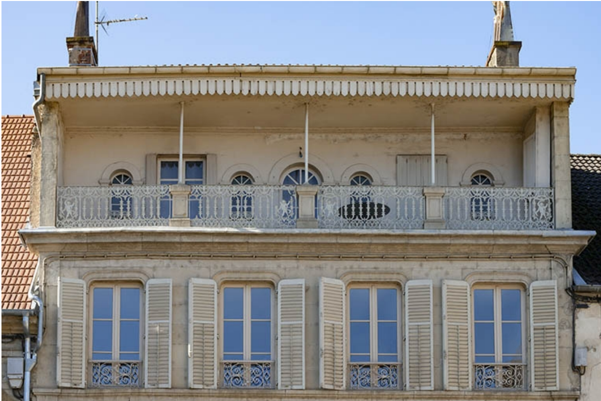
Détail des deux derniers niveaux.