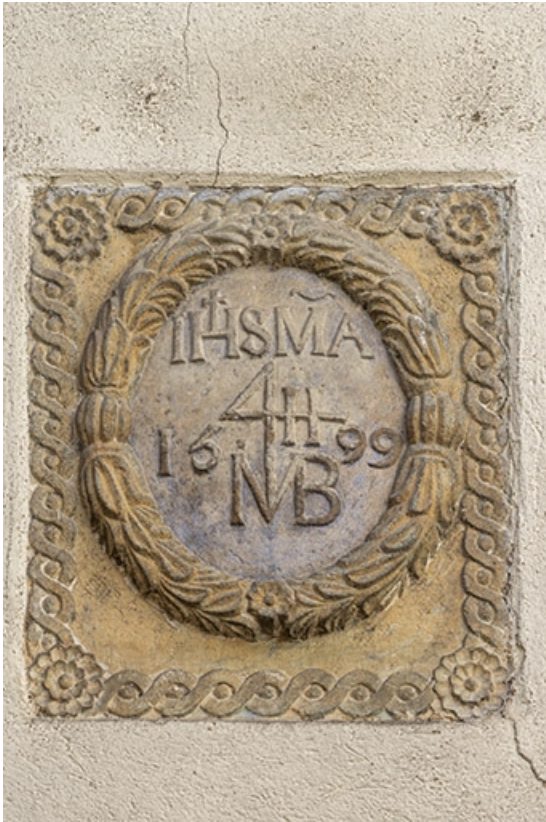
Cartouche inséré dans un mur de la cour, portant le millésime 1599.