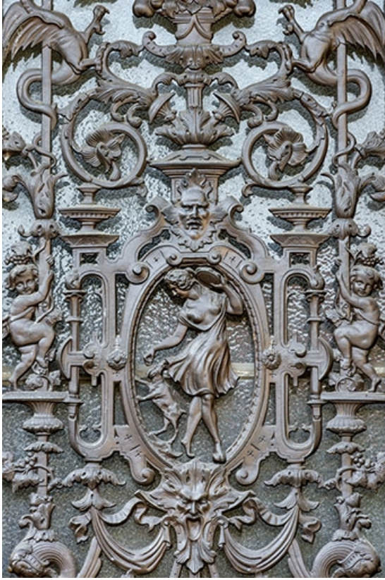
Détail de la grille droite de la porte cochère.