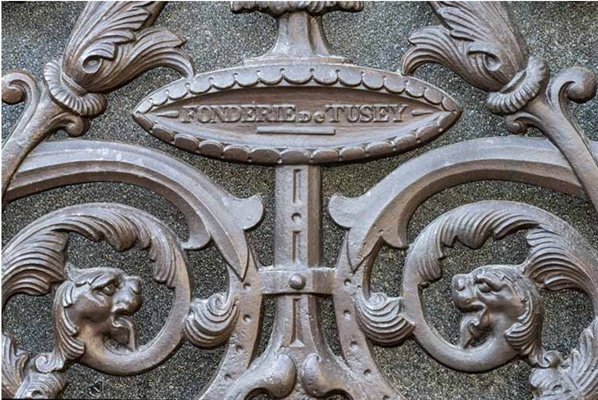
Détail de la grille droite de la porte cochère avec marque de fabrique : "Fonderie de Tusey". 70, Jussey, 8 rue Charles-Bontemps