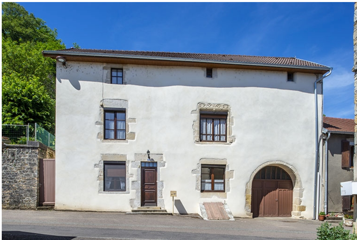
Face antérieure du n° 37.