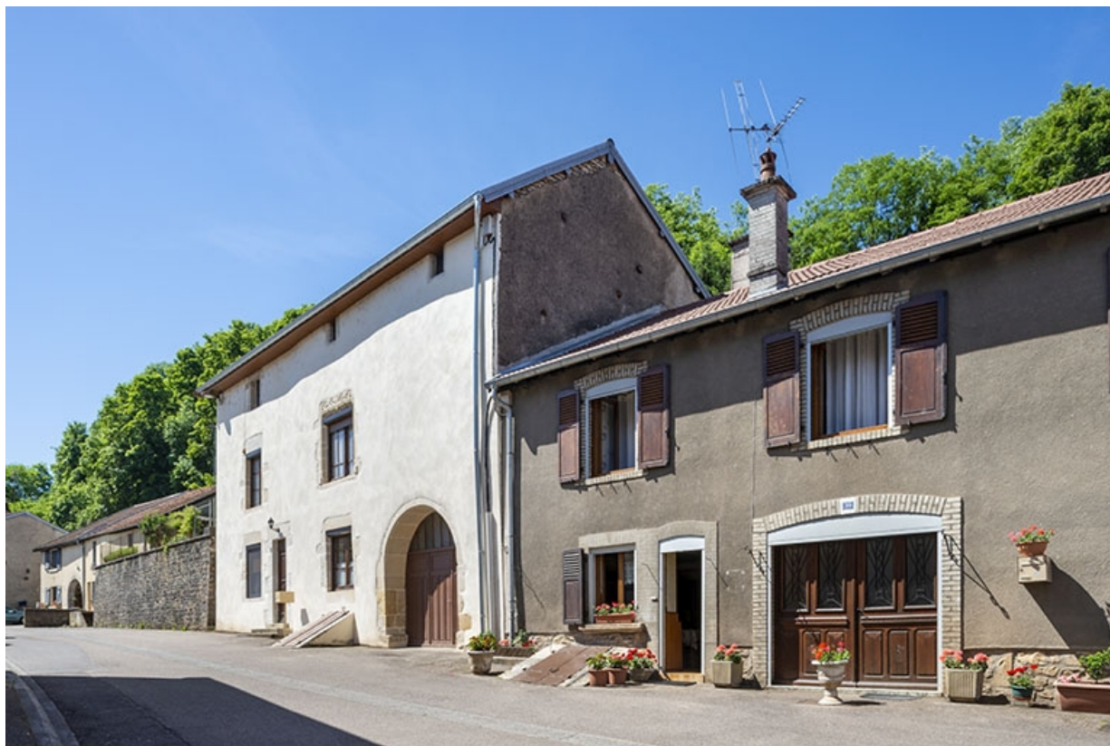
Trois quarts de la façade, du mur de soutènement du jardin et du pignon nord du n° 37 et de la façade du n° 39. 70, Jussey rue Charles Rech