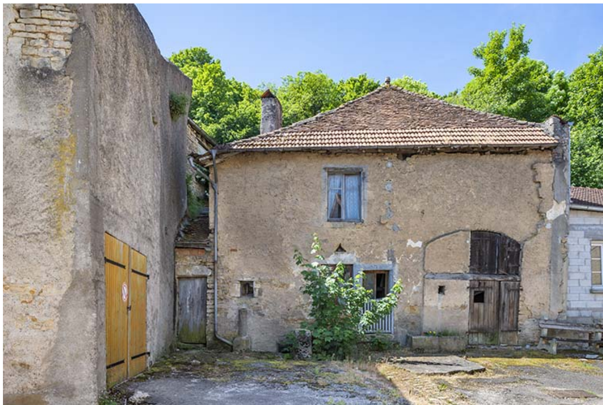
Façade antérieur de la ferme au n° 69. 70, Jussey rue Charles Rech