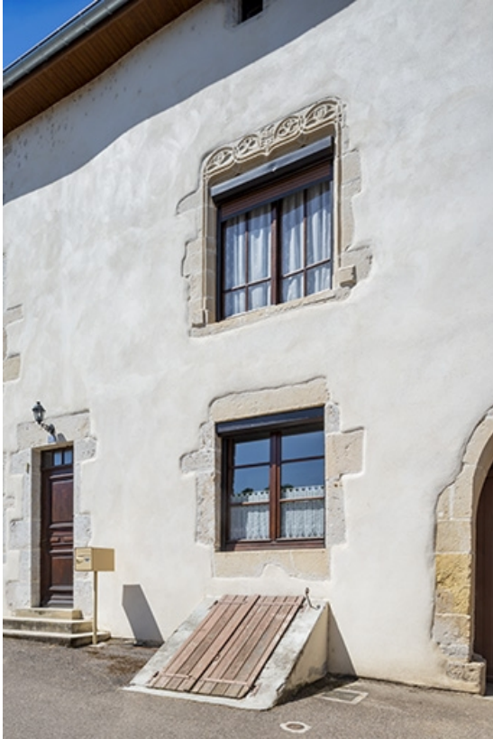
Détail de la façade, de l'entrée du cellier et des baies du n° 37. 70, Jussey rue Charles Rech