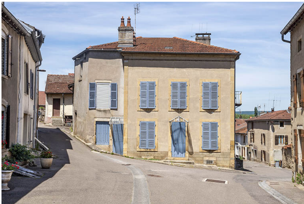
Façade antérieure du n° 41. 70, Jussey rue Charles Rech