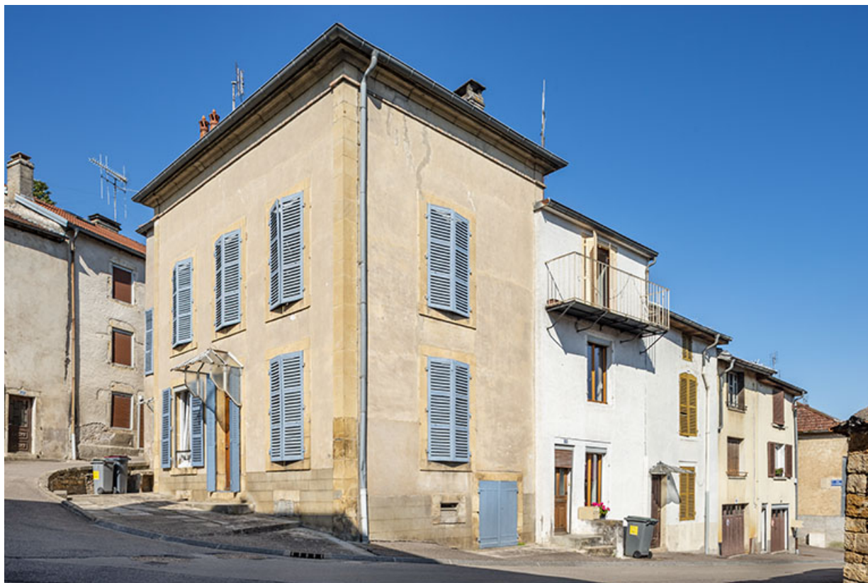
Trois quarts droit du n° 41 et des façades adjacentes de la rue Patet-Tournante. 70, Jussey rue Charles Rech