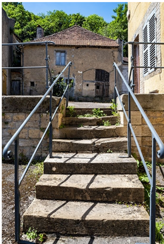
Escalier isolé débouchant sur la rue Charles-Rech, face à la ferme, au n° 69. 70, Jussey rue Charles Rech