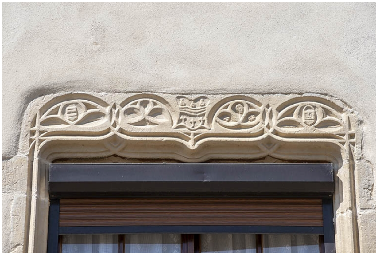
Détail du premier étage du n° 37 : linteau sculpté de la baie. 70, Jussey rue Charles Rech