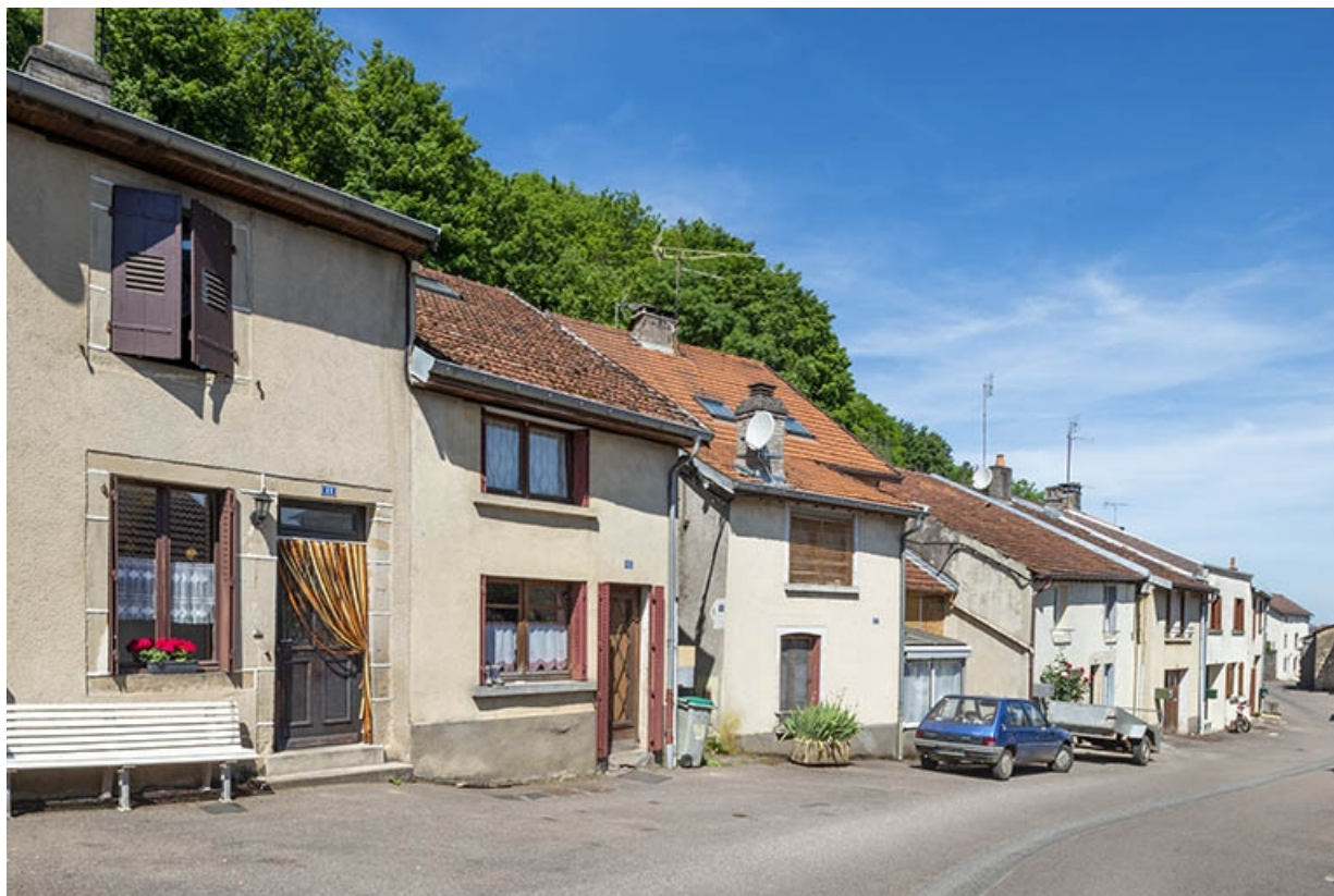
Côté des numéros impairs, à la hauteur du n° 11. 70, Jussey rue Charles Rech