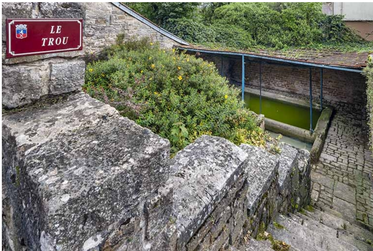
L'escalier et les bassins depuis la rue.