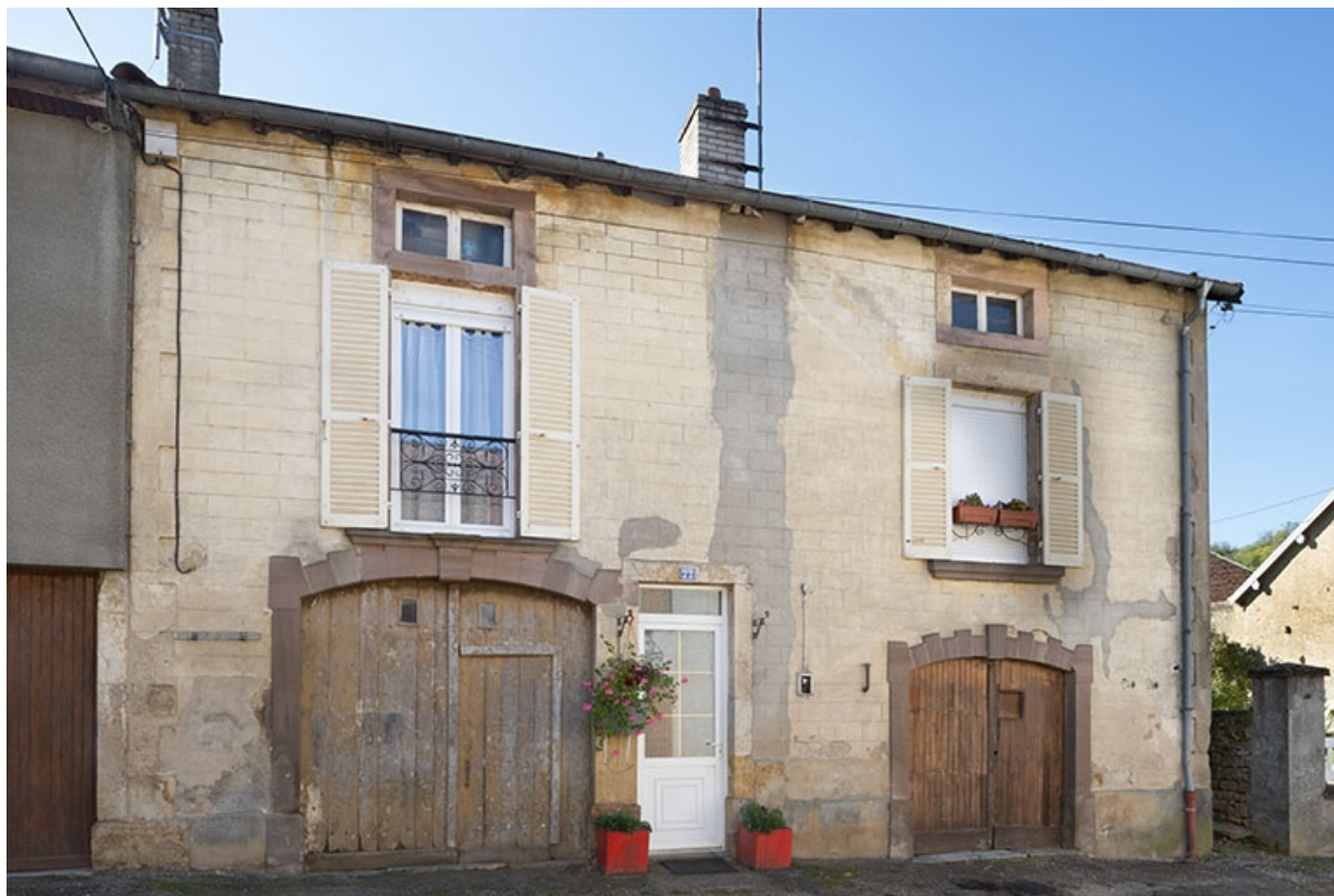
Face antérieure du n° 77. 70, Jussey rue Charles Rech