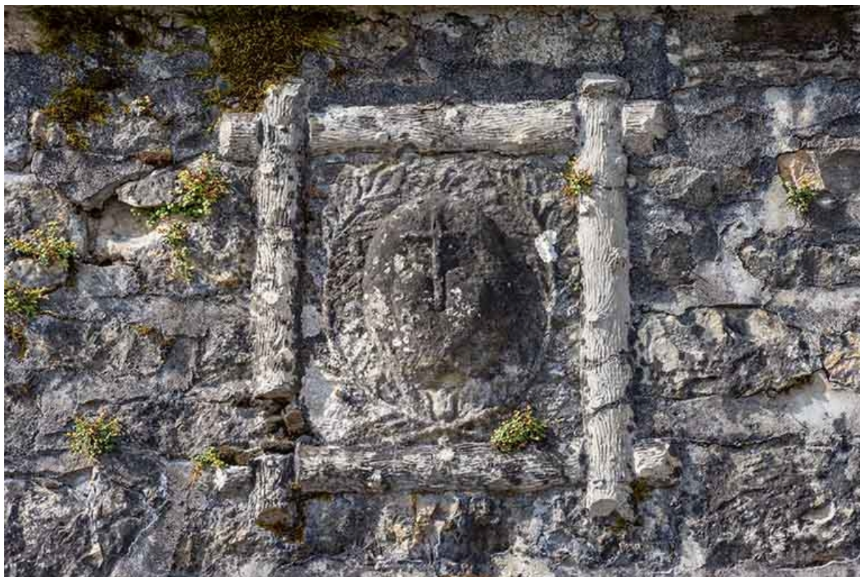
Détail de la façade du n° 37 : bas-relief.