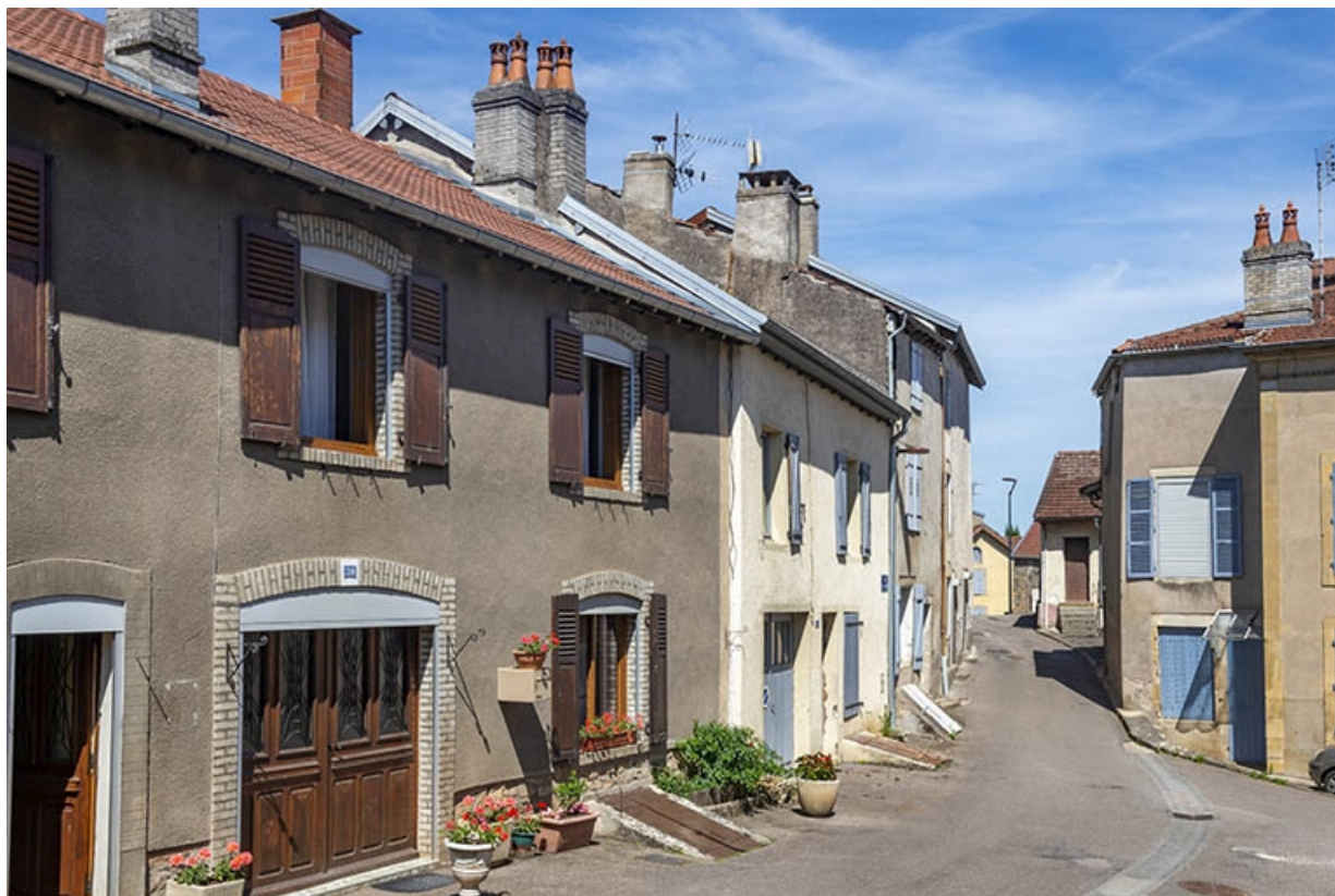
Trois quarts gauche des façades vers le nord, à hauteur du n° 39. 70, Jussey rue Charles Rech