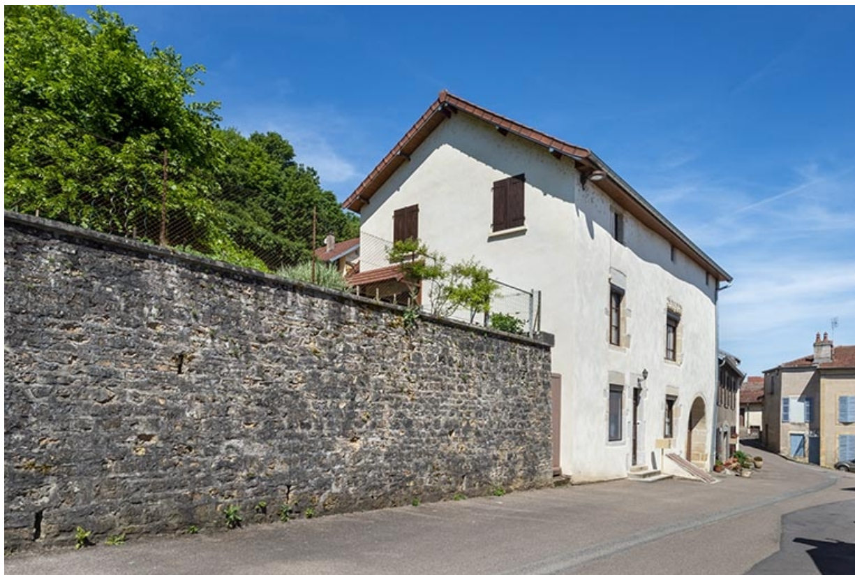
Trois quarts de la façade, du mur de soutènement du jardin et du pignon sud du n° 37. 70, Jussey rue Charles Rech