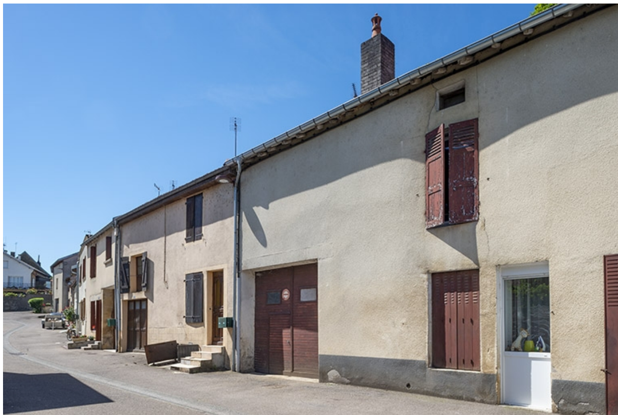
Trois quarts droit des façades vers le sud, à hauteur du n° 29. 70, Jussey rue Charles Rech