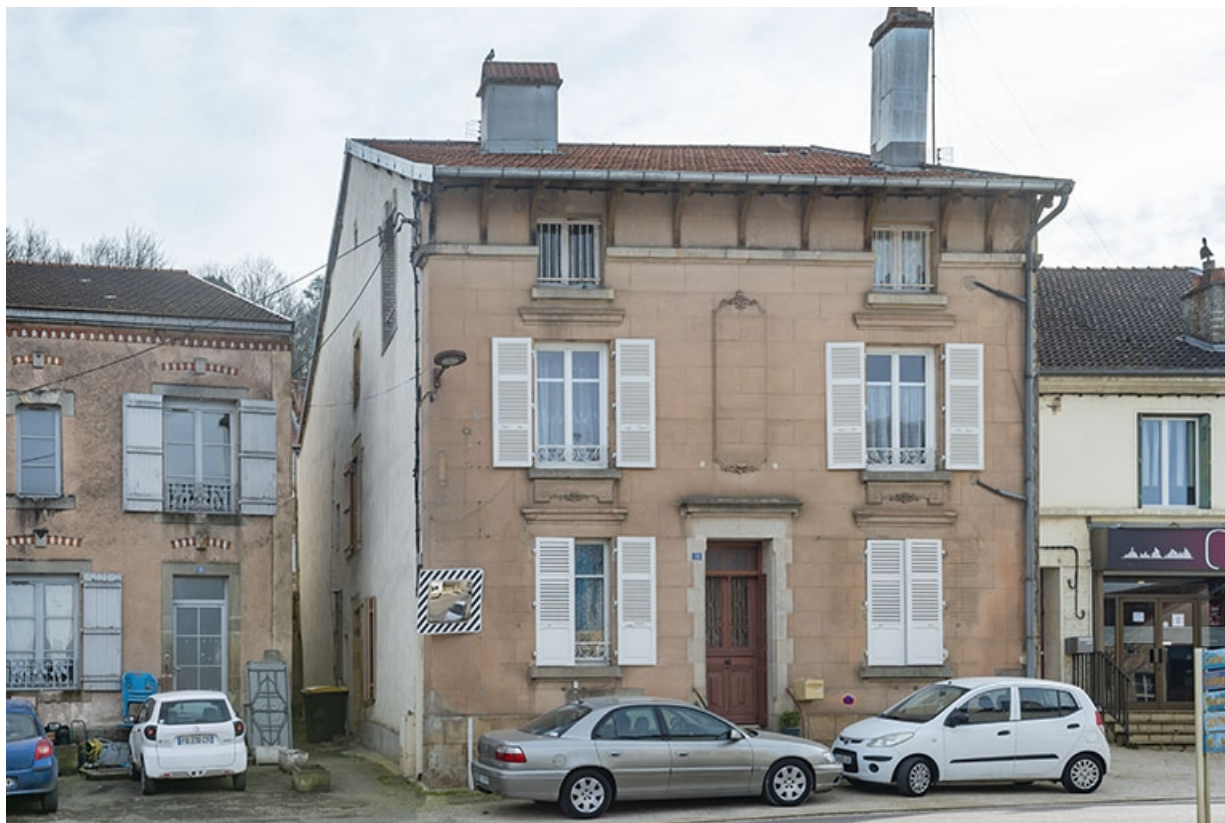
Trois quarts gauche du n° 16.