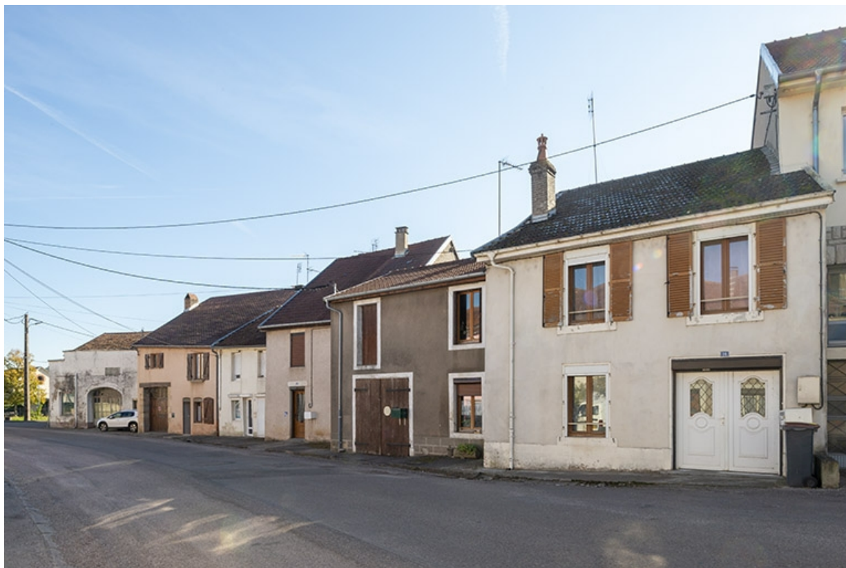
Trois quarts droit des façades des maisons, 16, 18 et suivants, vers le nord-est. 70, Jussey rue de la Pêcherie