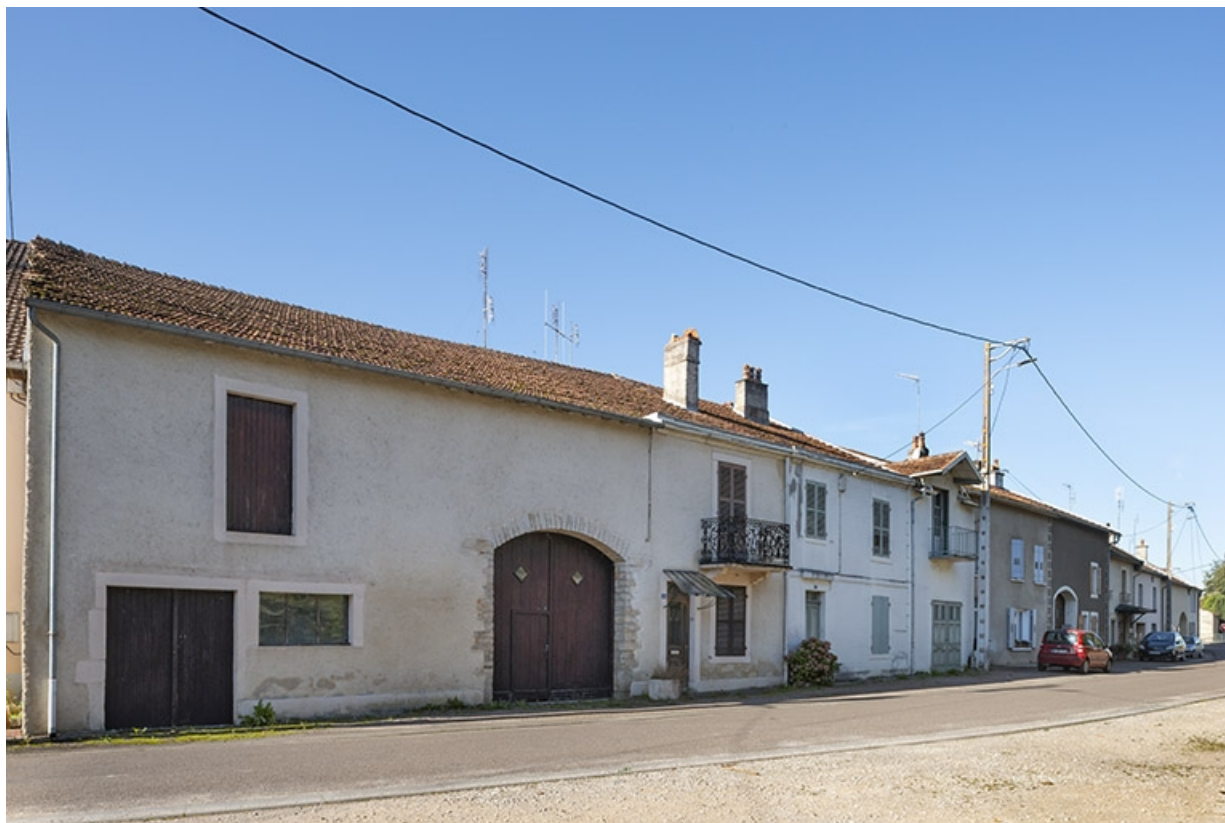
Trois quarts gauche des façades des fermes et maisons, 44, 42 et suivants, vers le nord-ouest. 70, Jussey rue de la Pêcherie