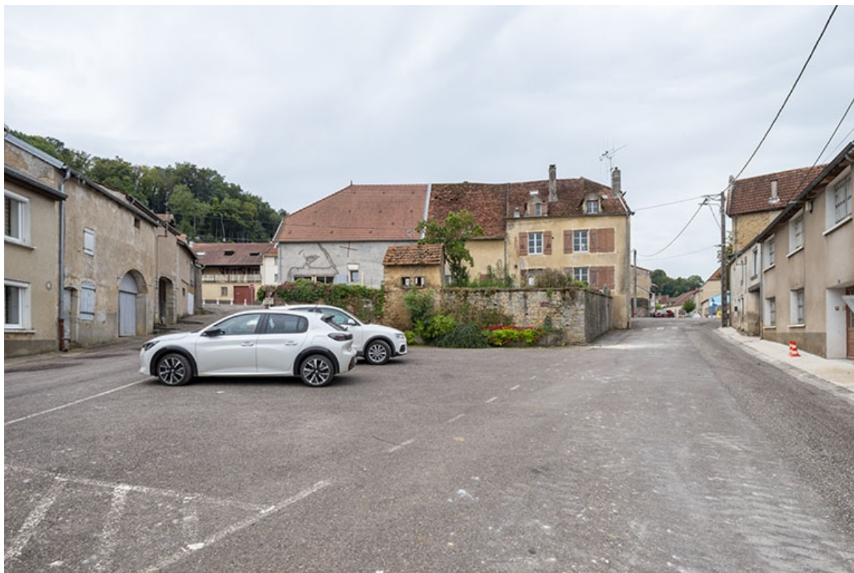
Les deux côtés de la rue aux environs de la fontaine.