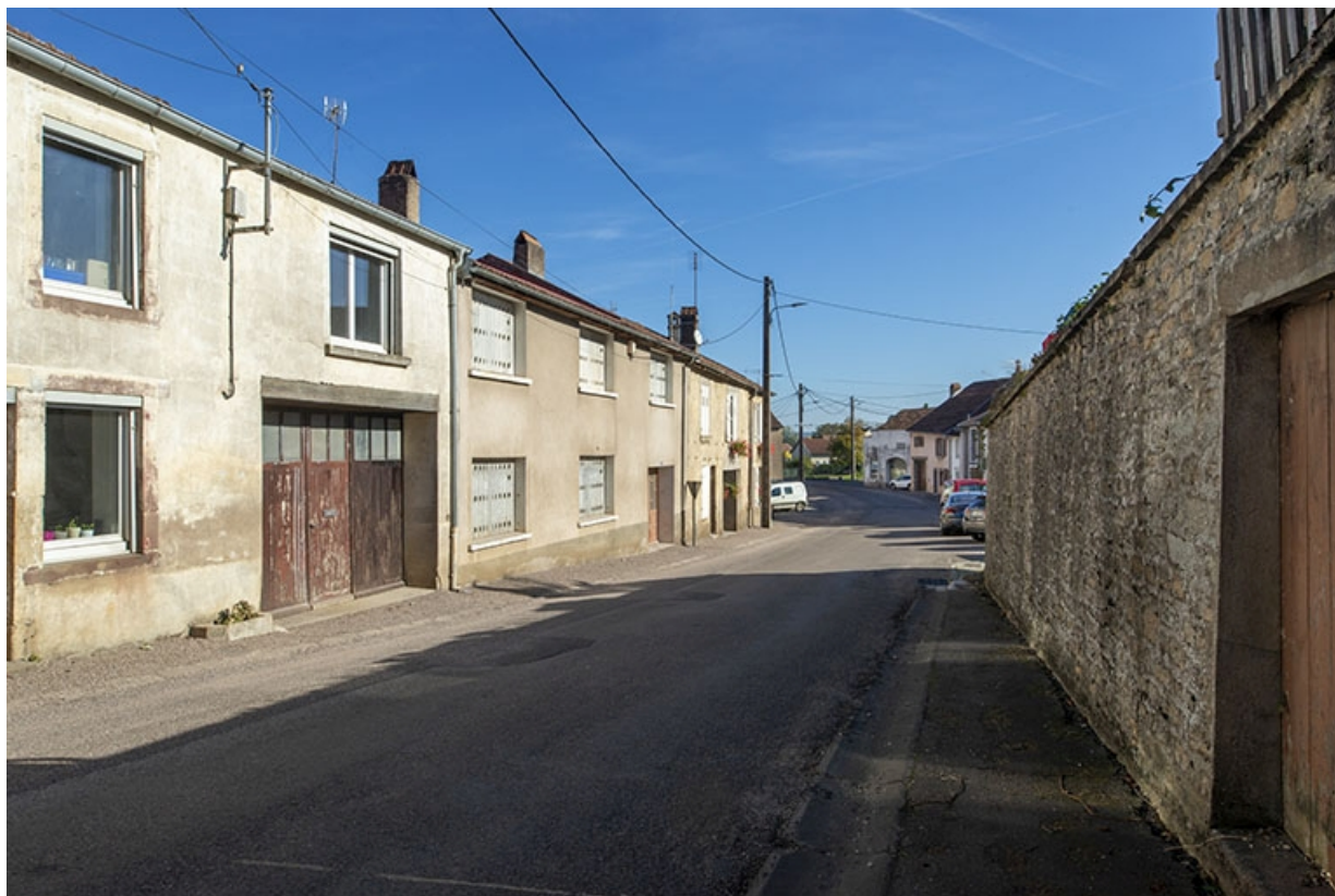
Trois quarts gauche des façades des maisons, 1, 3 et suivants, vers le nord-est. 70, Jussey rue de la Pêcherie