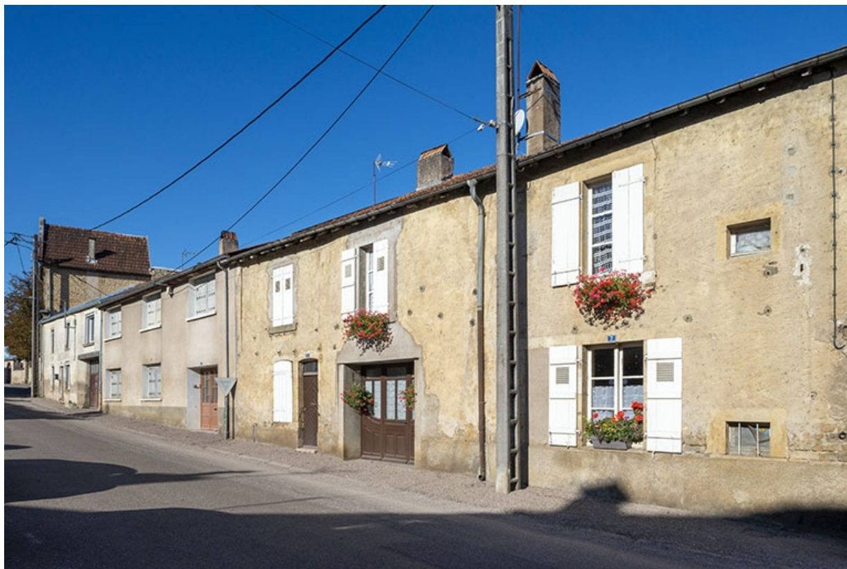
Trois quarts droit des façades des maisons, 7, 5 et suivants, vers le sud-ouest. 70, Jussey rue de la Pêcherie