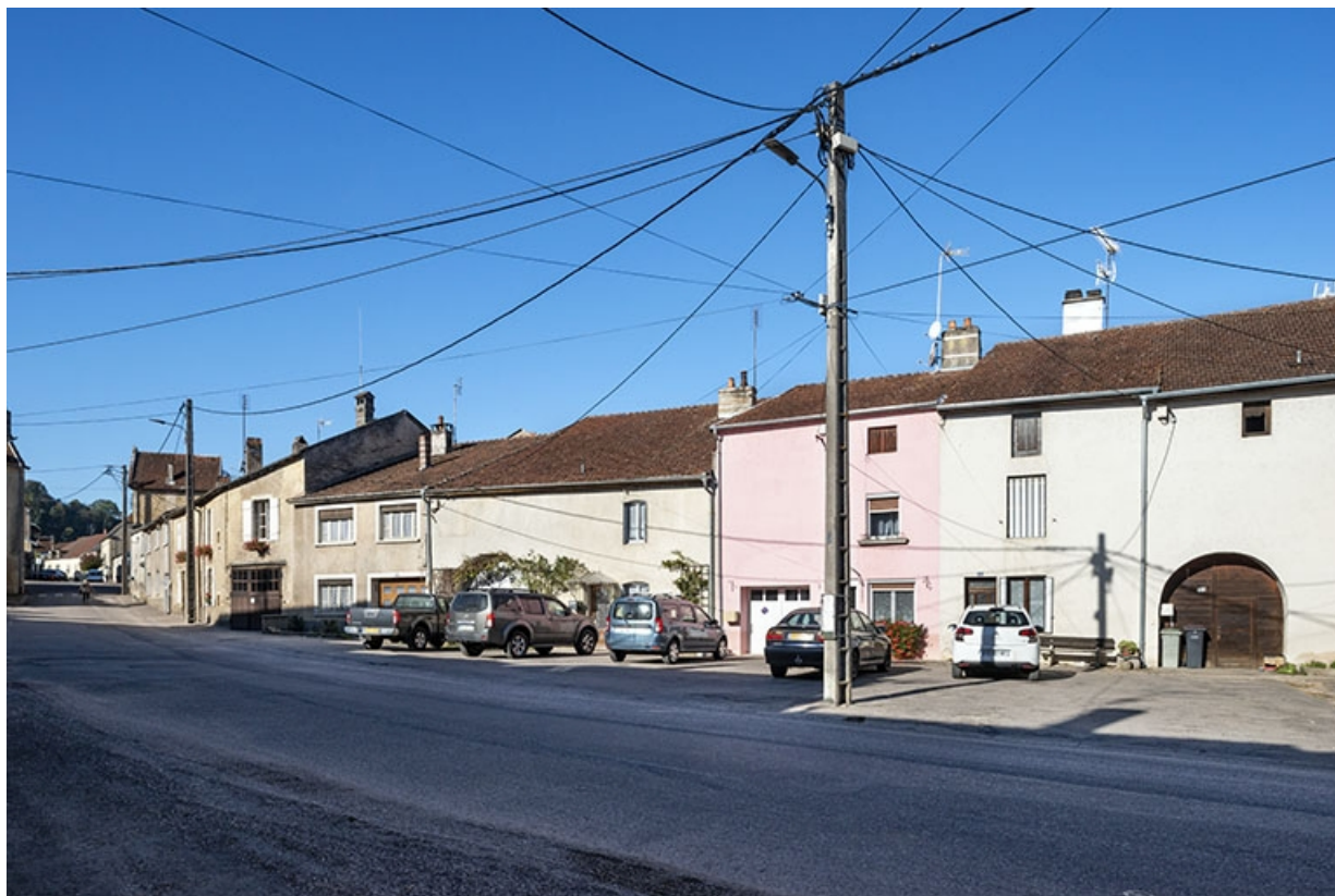
Trois quarts droit des façades des maisons et fermes, 15, 13 et suivants, vers le sud-ouest. 70, Jussey rue de la Pêcherie