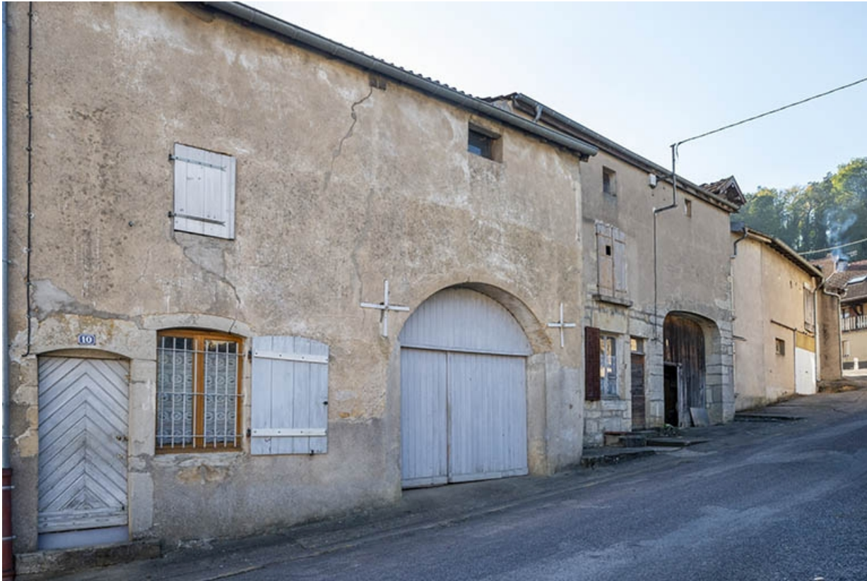
Trois quarts gauche des façades des maisons et fermes, 10, 8 et suivants, vers le sud. 70, Jussey rue de la Pêcherie