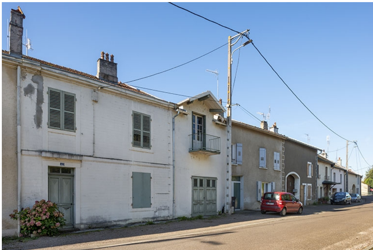
Trois quarts gauche des façades des maisons, 42, 40 et suivants, vers le nord-ouest. 70, Jussey rue de la Pêcherie