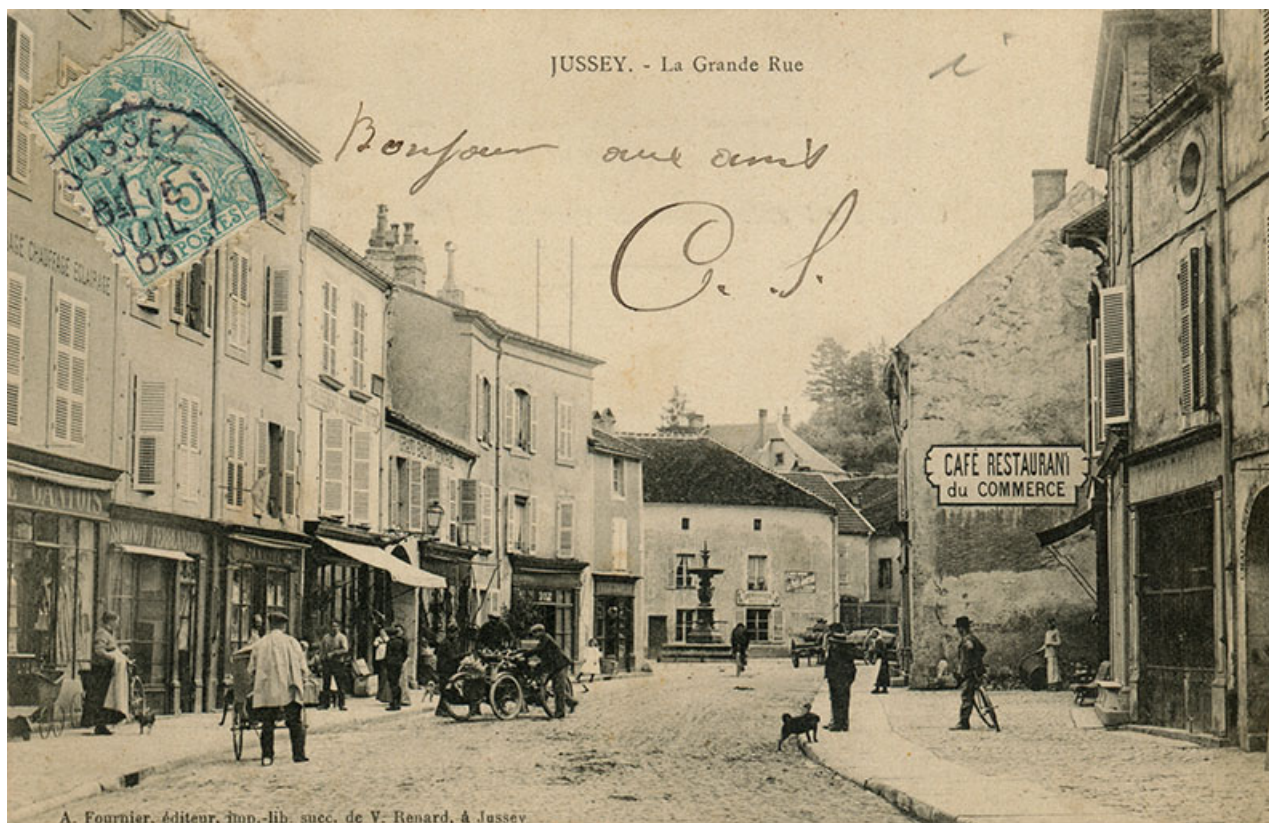
La rue Gambetta au début du 20e siècle. 70, Jussey rue Gambetta