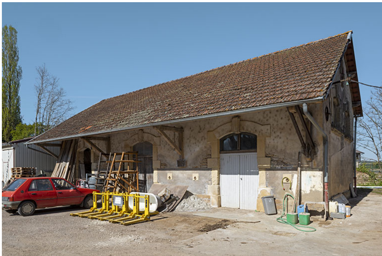
Le bâtiment central, de face.