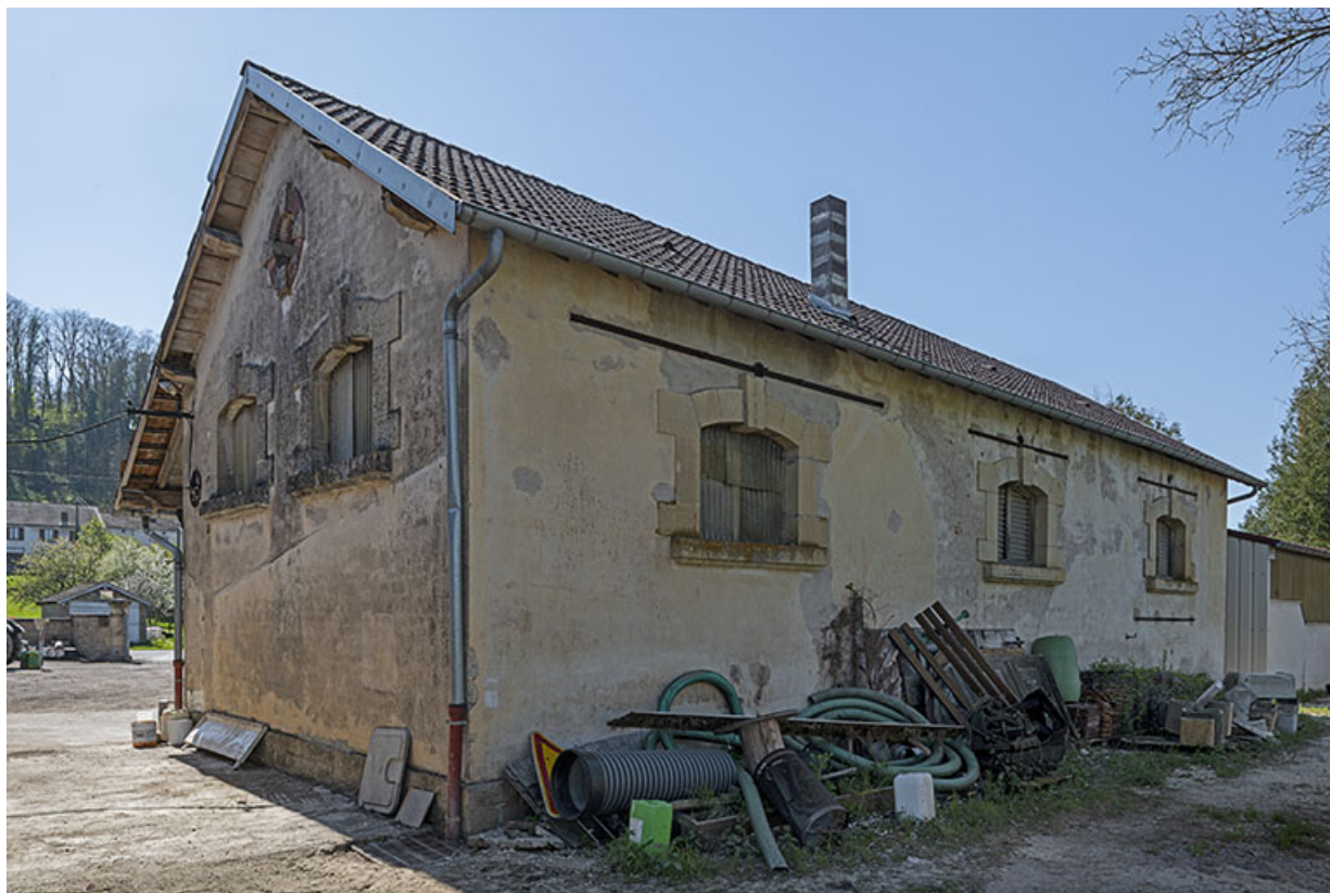
Le bâtiment central, de l'arrière.