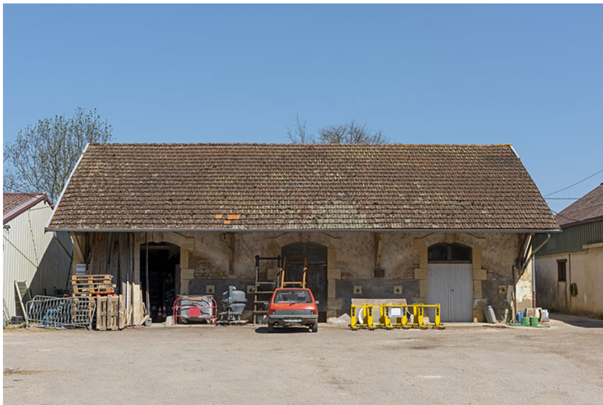
Le bâtiment central, de face.