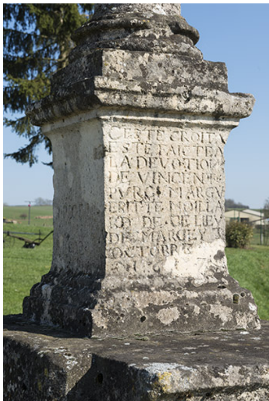
Détail sur les inscriptions.