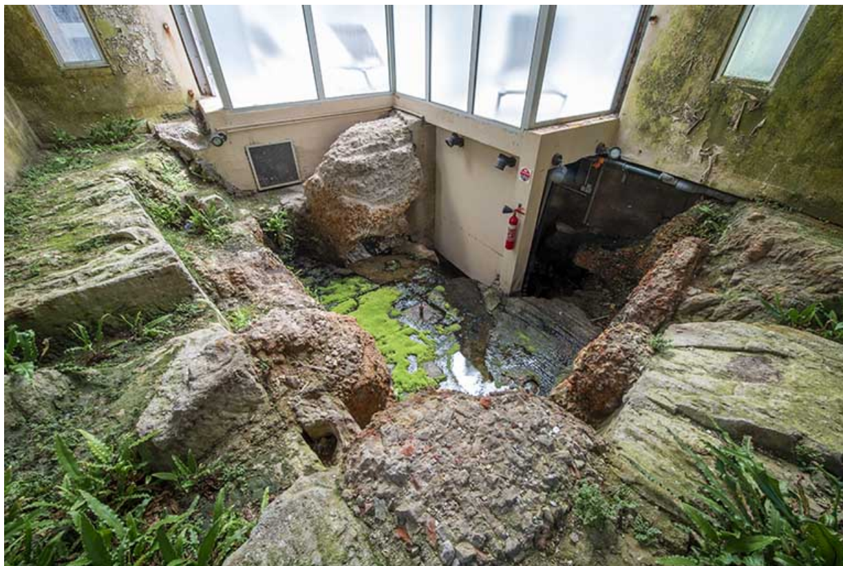
Source et vestiges d'une construction.

70, Luxeuil-les-Bains, 3 rue des Thermes