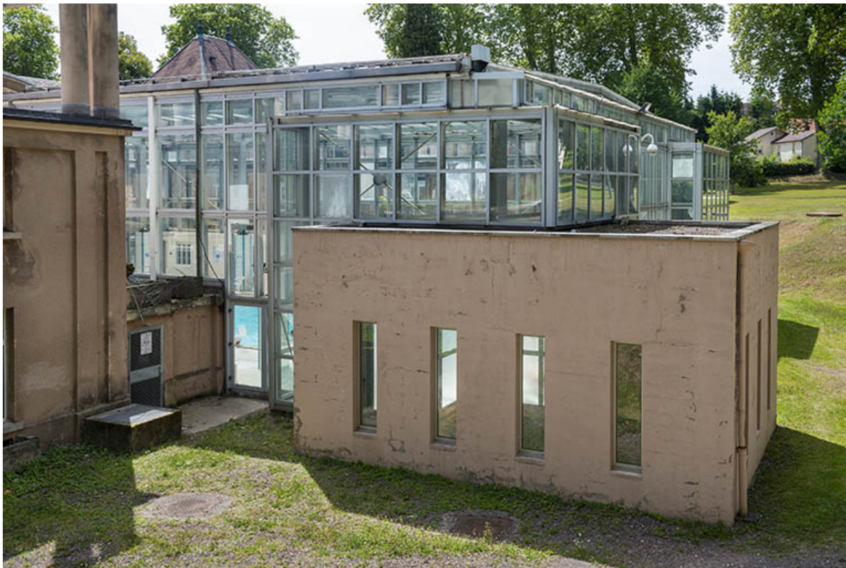
Édicule abritant la source.

70, Luxeuil-les-Bains, 3 rue des Thermes