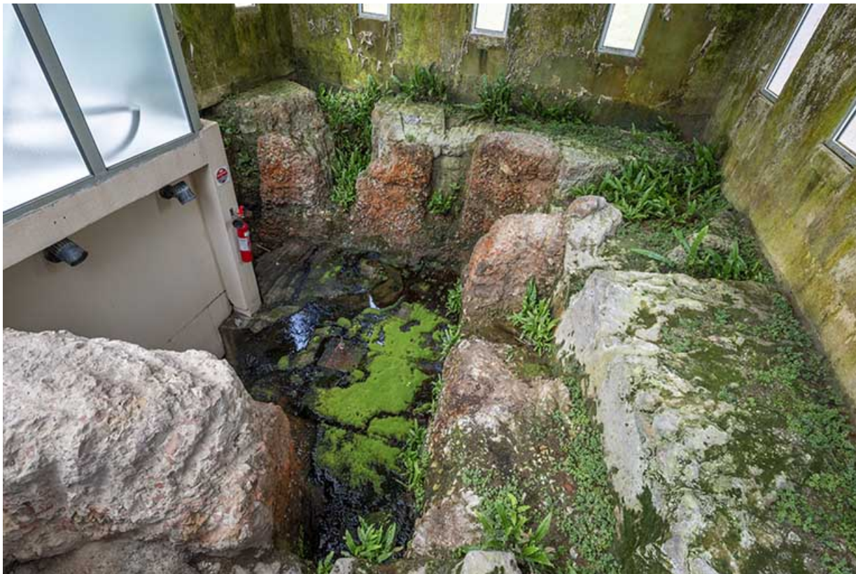
Source et vestiges d'une construction.

70, Luxeuil-les-Bains, 3 rue des Thermes