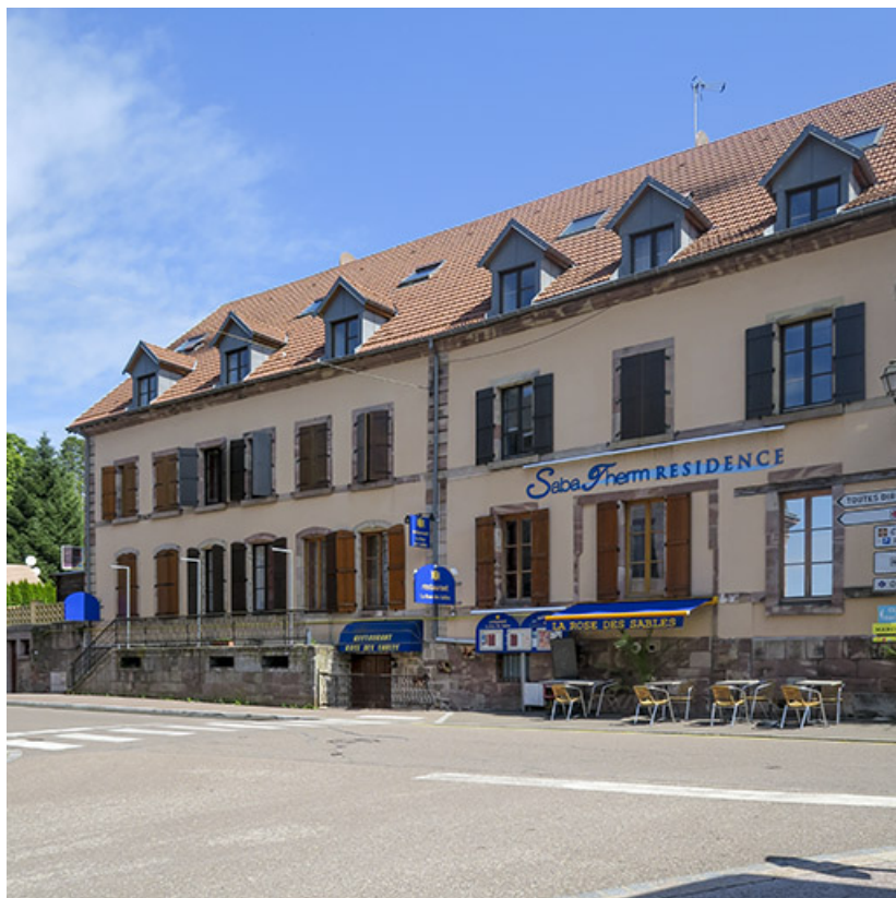
Façade sur la rue de Grammont.

70, Luxeuil-les-Bains, 6 rue de Grammont