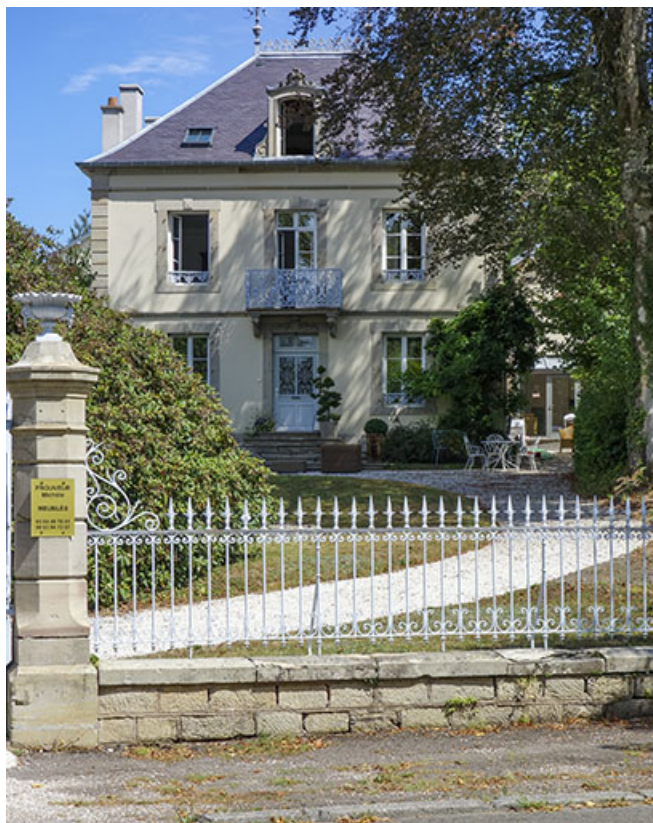
Vue depuis la rue.

70, Luxeuil-les-Bains, 17 avenue Jean Moulin