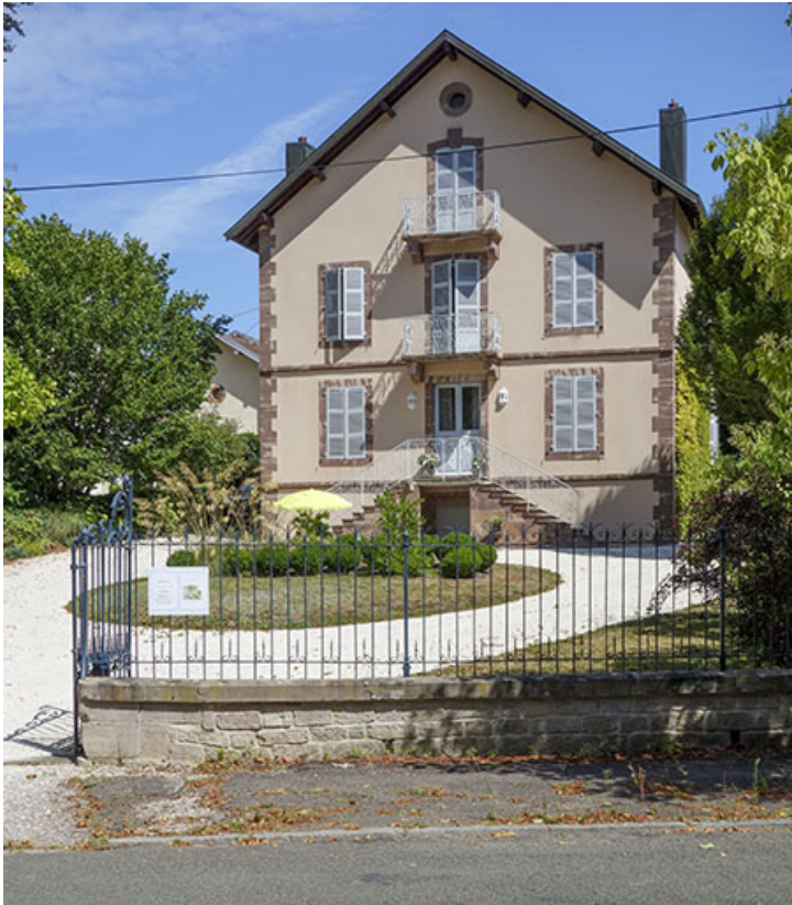
Vue depuis la rue.

70, Luxeuil-les-Bains, 15 avenue Jean Moulin