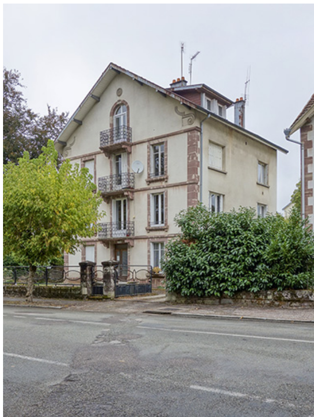
Vue depuis la rue.

70, Luxeuil-les-Bains, 13 avenue Jean Moulin