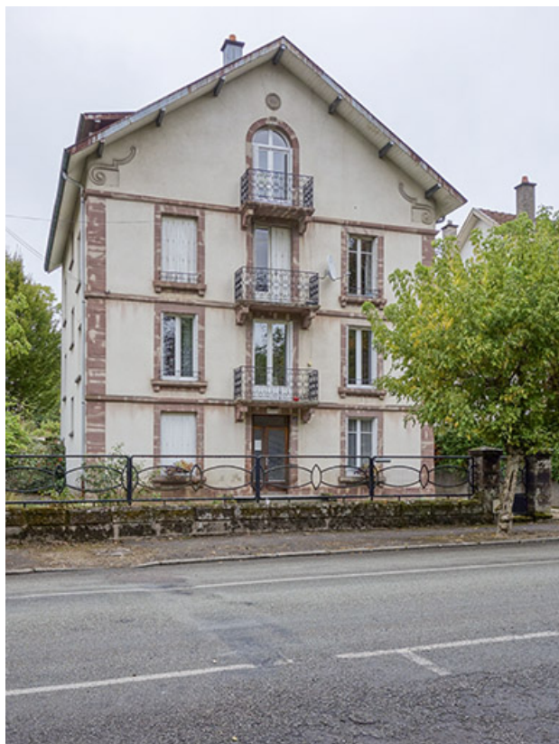
Vue depuis la rue.

70, Luxeuil-les-Bains, 13 avenue Jean Moulin