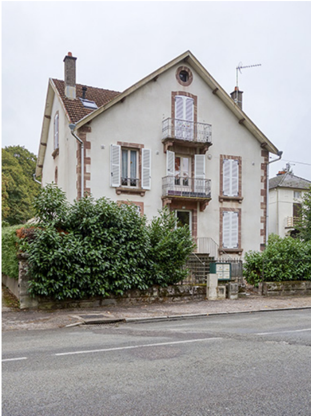
Vue depuis la rue.

70, Luxeuil-les-Bains, 11 avenue Jean Moulin