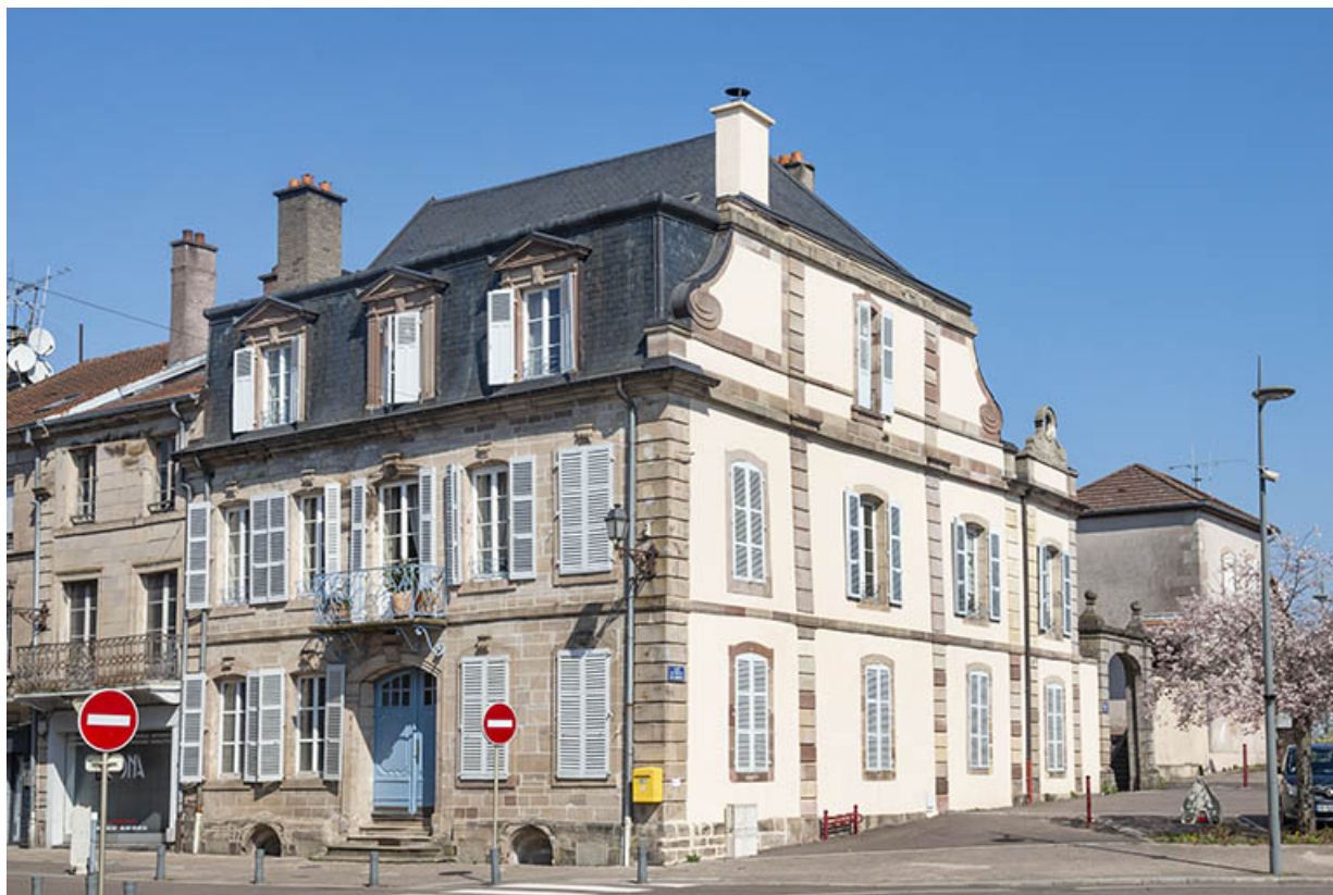
Vue d'ensemble de trois quarts.