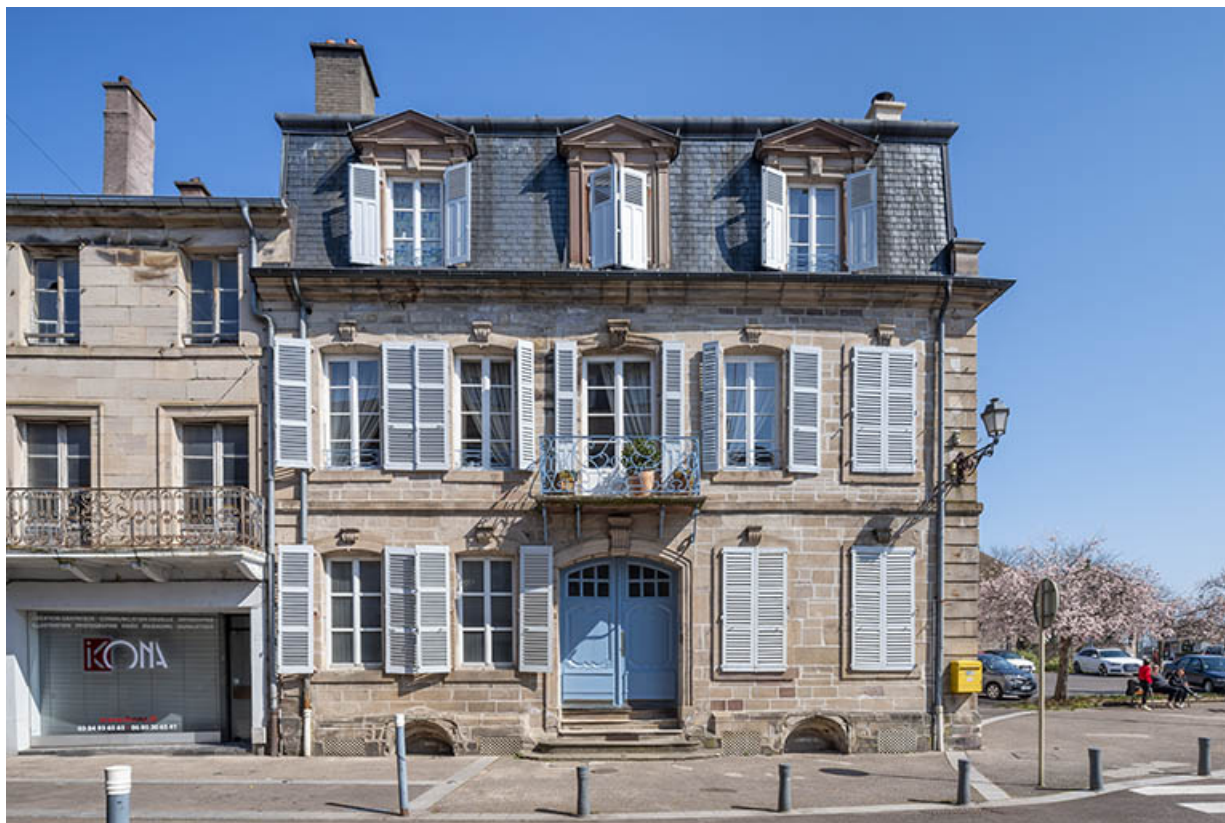
Façade sur la rue Carnot.