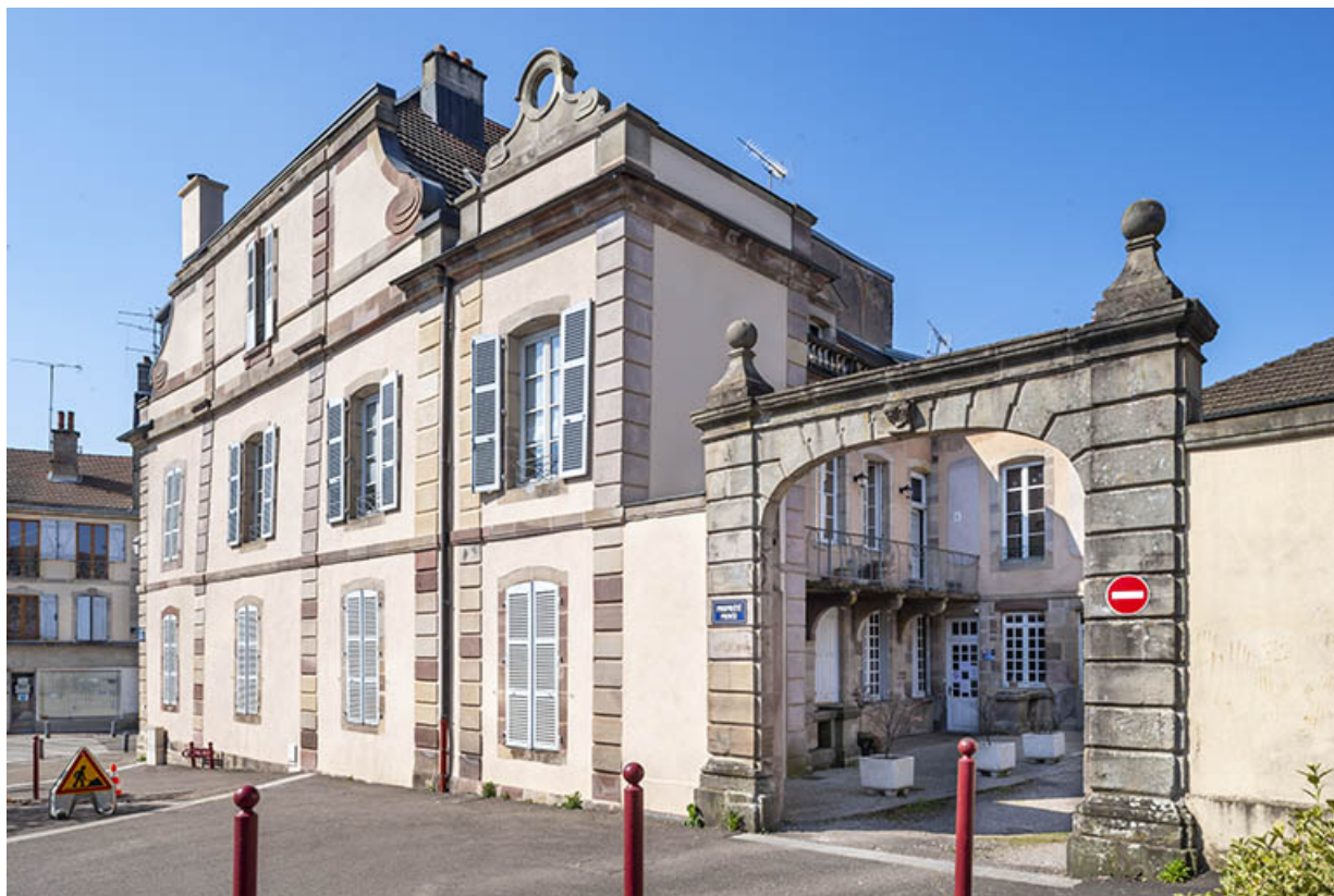
Façade sur la place du Général de Gaulle.