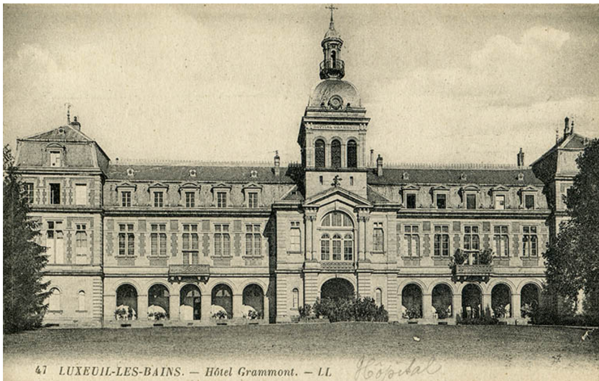
Vue de la façade principale au début du 20e siècle.

70, Luxeuil-les-Bains, 12 rue de Grammont