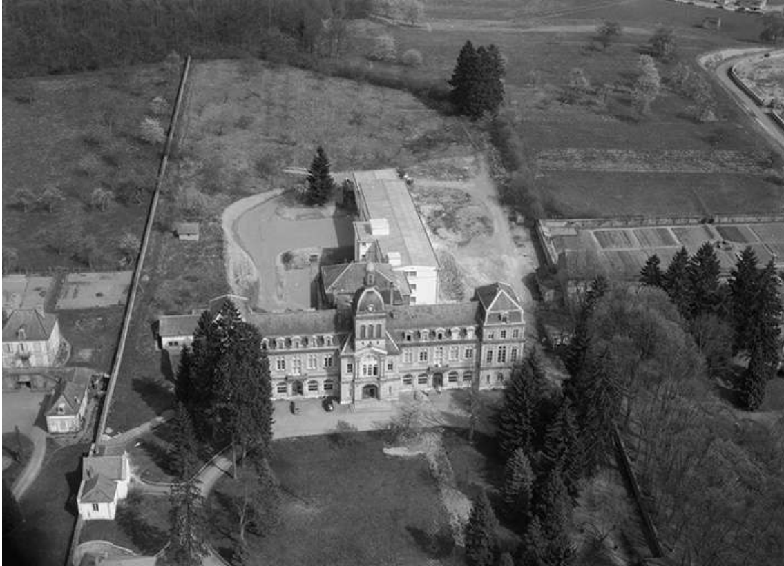
Vue aérienne montrant l'agrandissement de l'hôpital vers l'est.

70, Luxeuil-les-Bains, 12 rue de Grammont