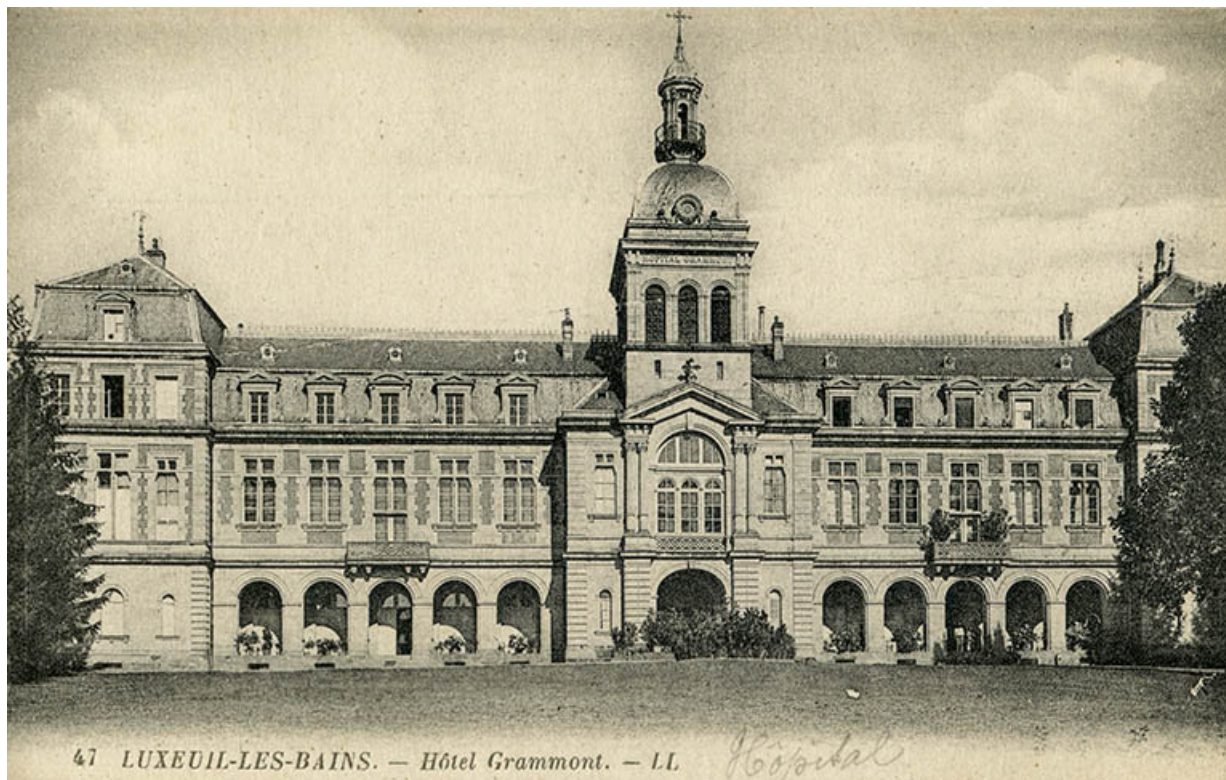
Vue de la façade principale au début du 20e siècle.

70, Luxeuil-les-Bains, 12 rue de Grammont