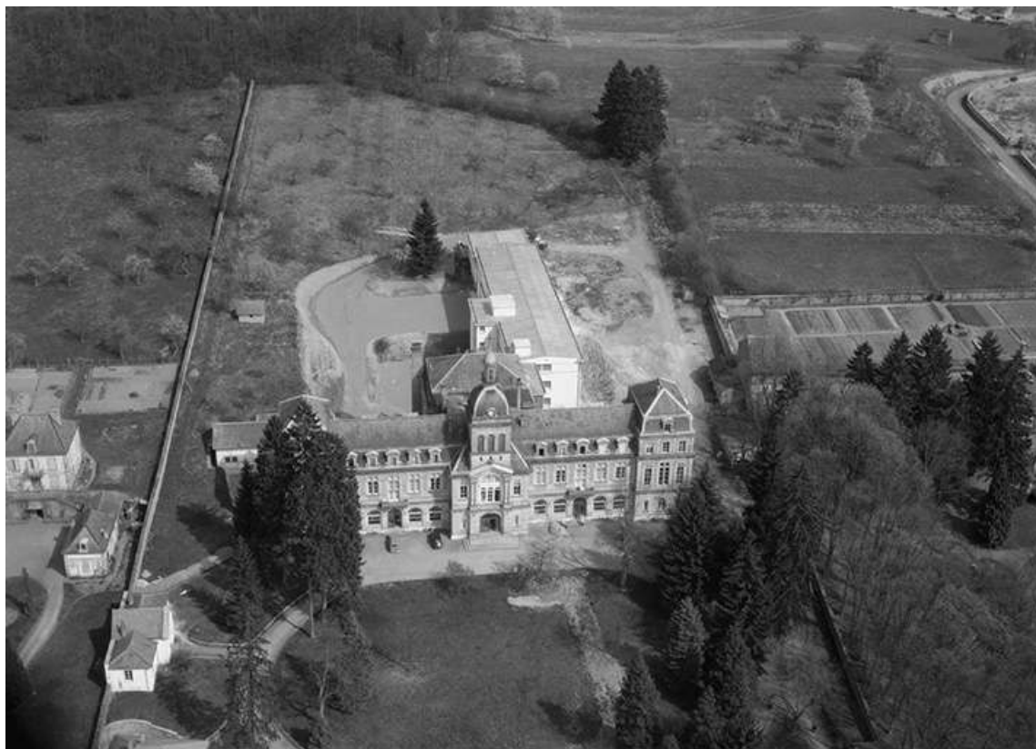
Vue aérienne montrant l'agrandissement de l'hôpital vers l'est.

70, Luxeuil-les-Bains, 12 rue de Grammont