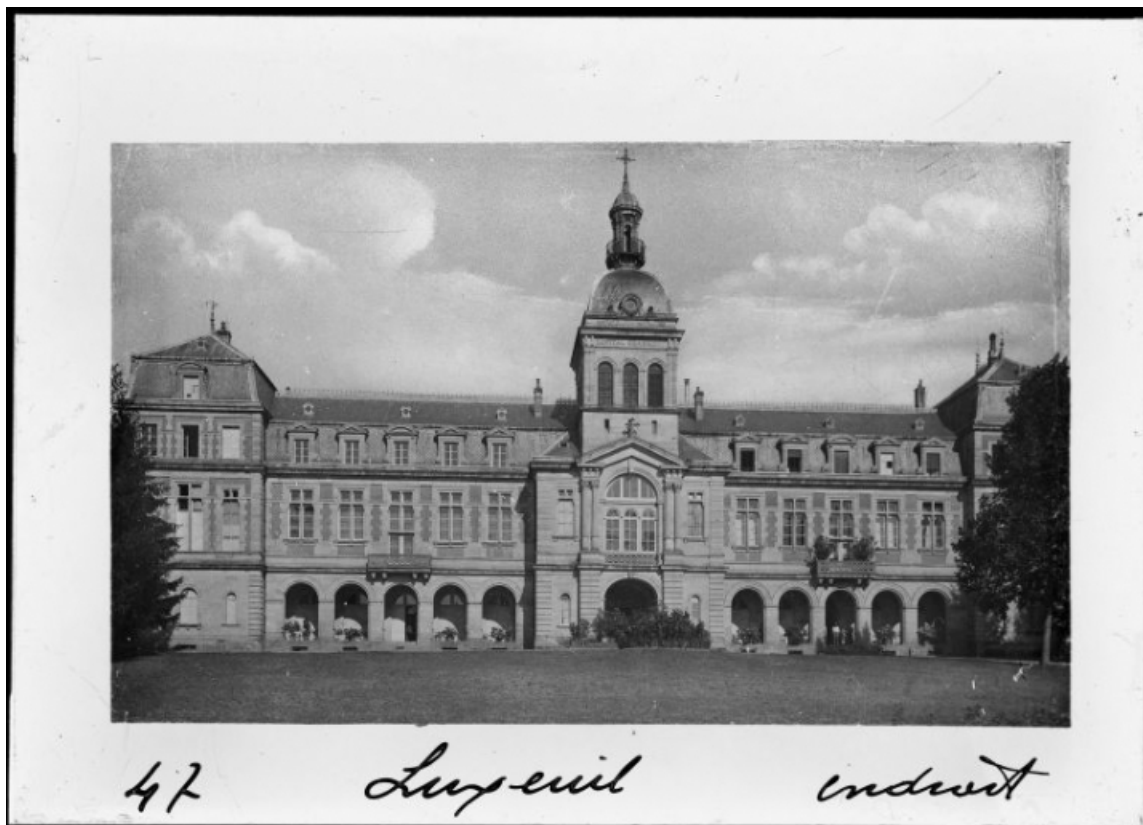
Vue de la façade principale au début du 20e siècle.

70, Luxeuil-les-Bains, 12 rue de Grammont