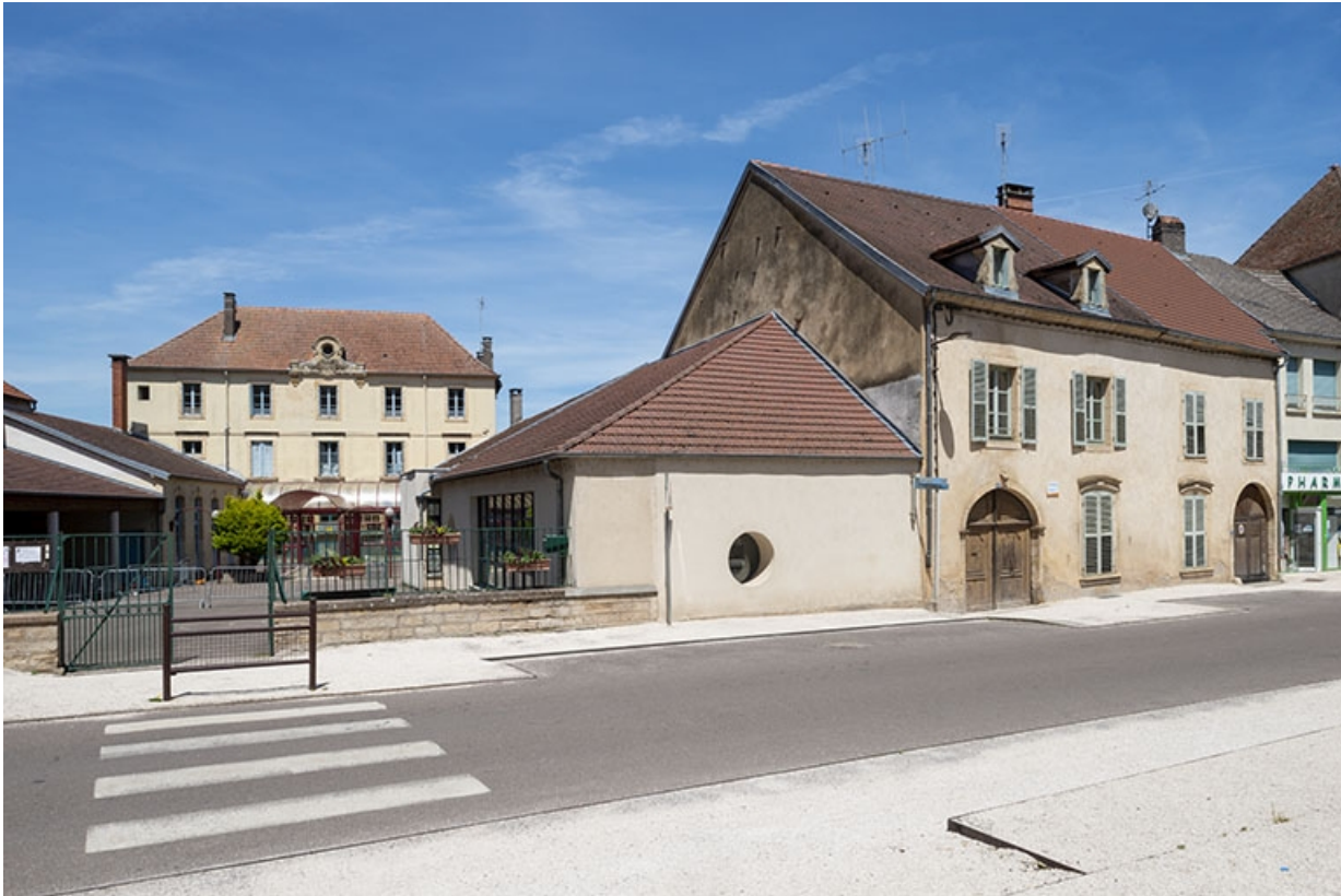
Pignon gauche avec l'école voisine.