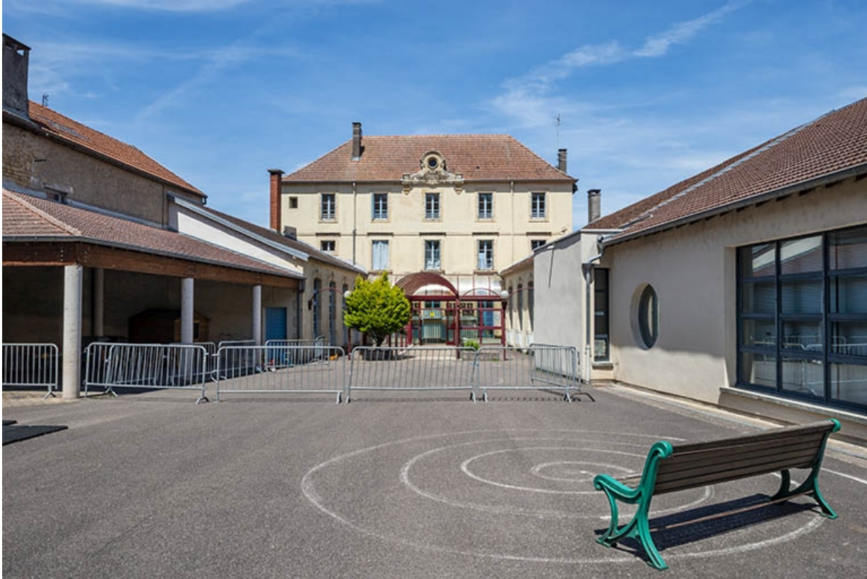
Vue d'ensemble de la cour et du bâtiment principal.