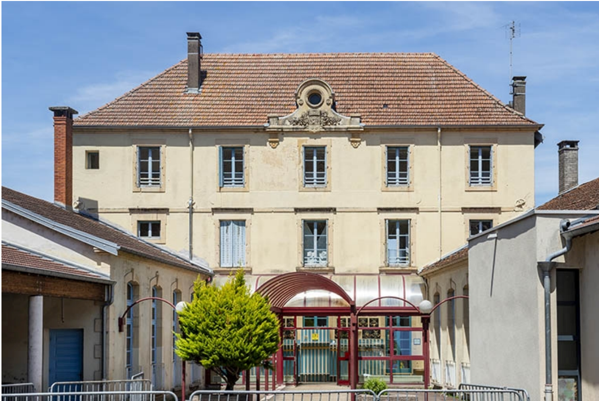
Vue d'ensemble de la cour et du bâtiment principal.