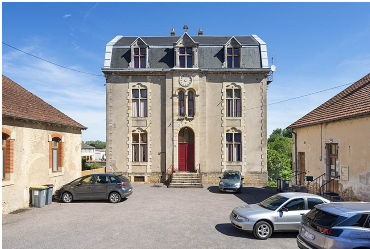
La façade du bâtiment principal.