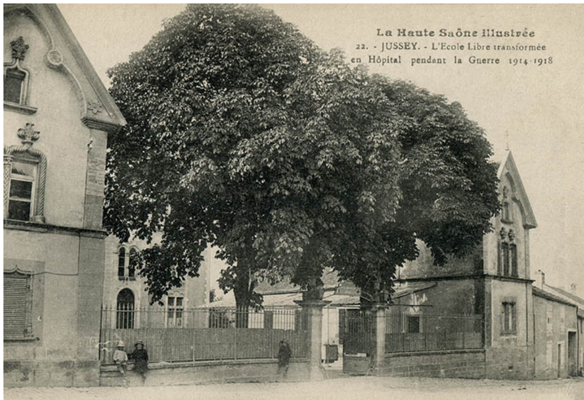
L'ancienne école libre de la rue de l'Hôtel-de-Ville. 70, Jussey, 29 rue de l'hôtel-de-ville