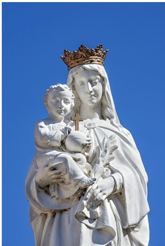
La statue de la Vierge à l'Enfant.