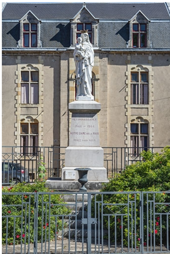
La statue de la Vierge à l'Enfant.