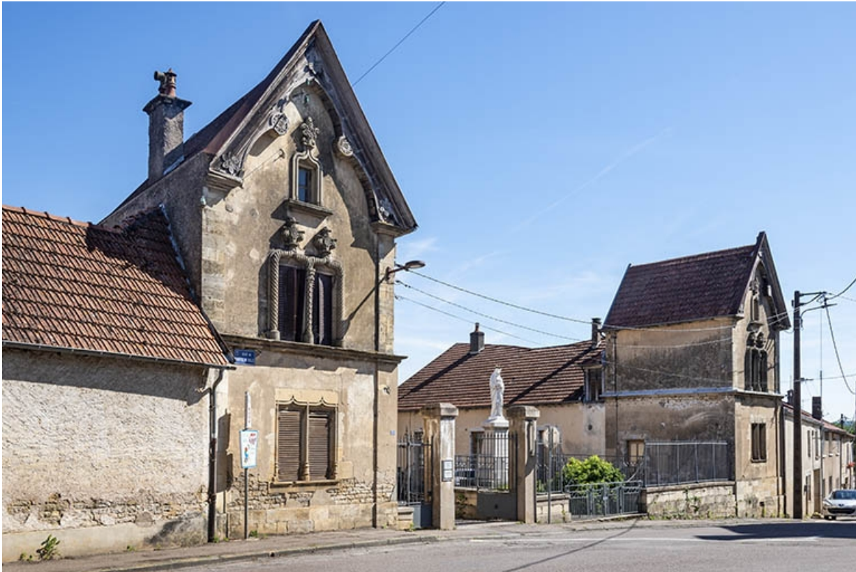
Les pignons sur rue, vue de trois quarts.