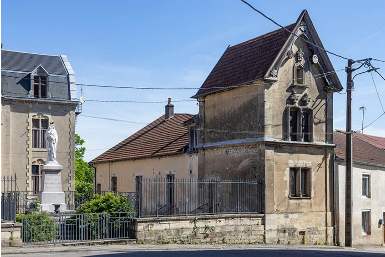
L'aile droite de trois quarts.