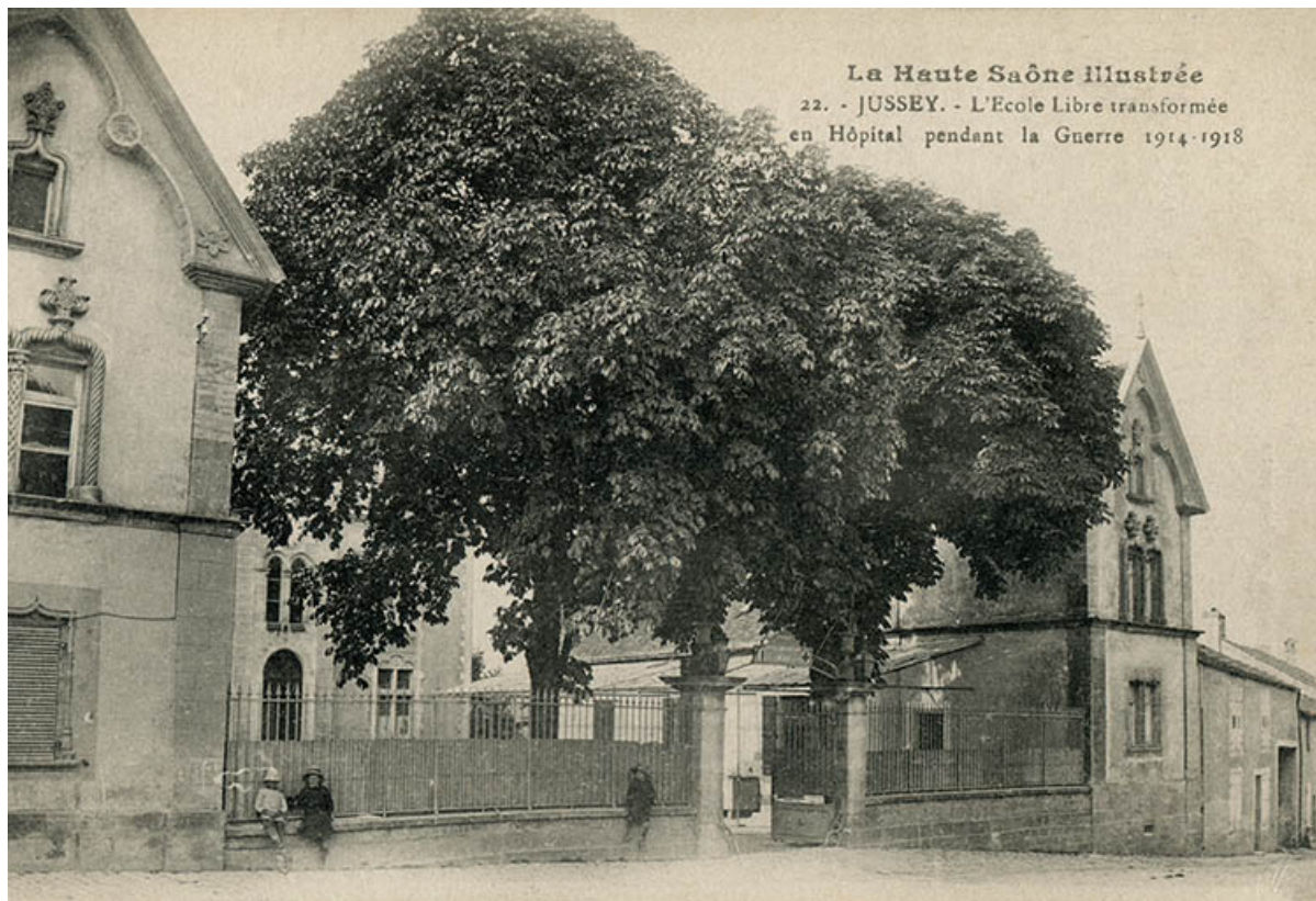
L'ancienne école libre de la rue de l'Hôtel-de-Ville. 70, Jussey, 29 rue de l'hôtel-de-ville