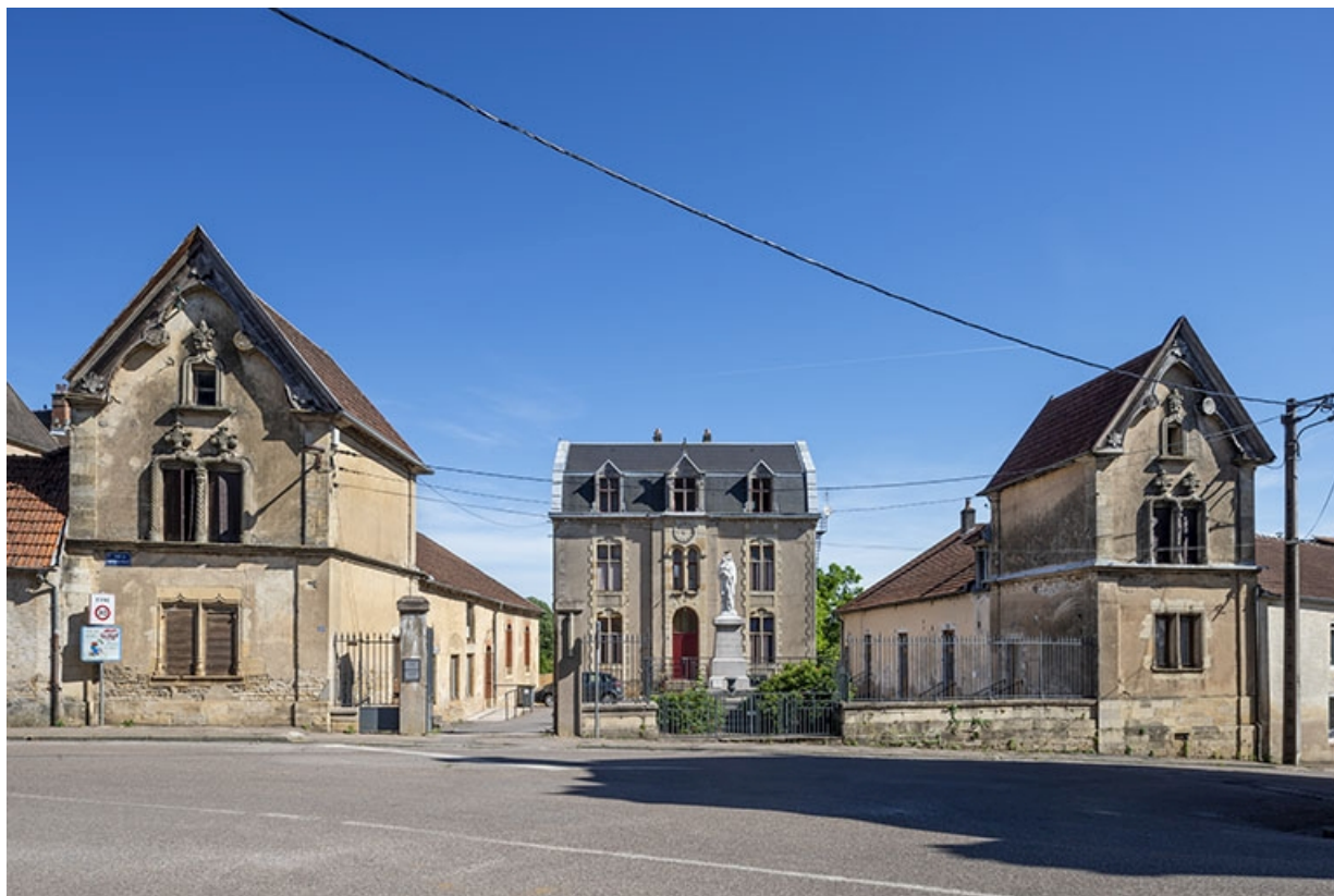
L'ensemble des bâtiments depuis la rue.