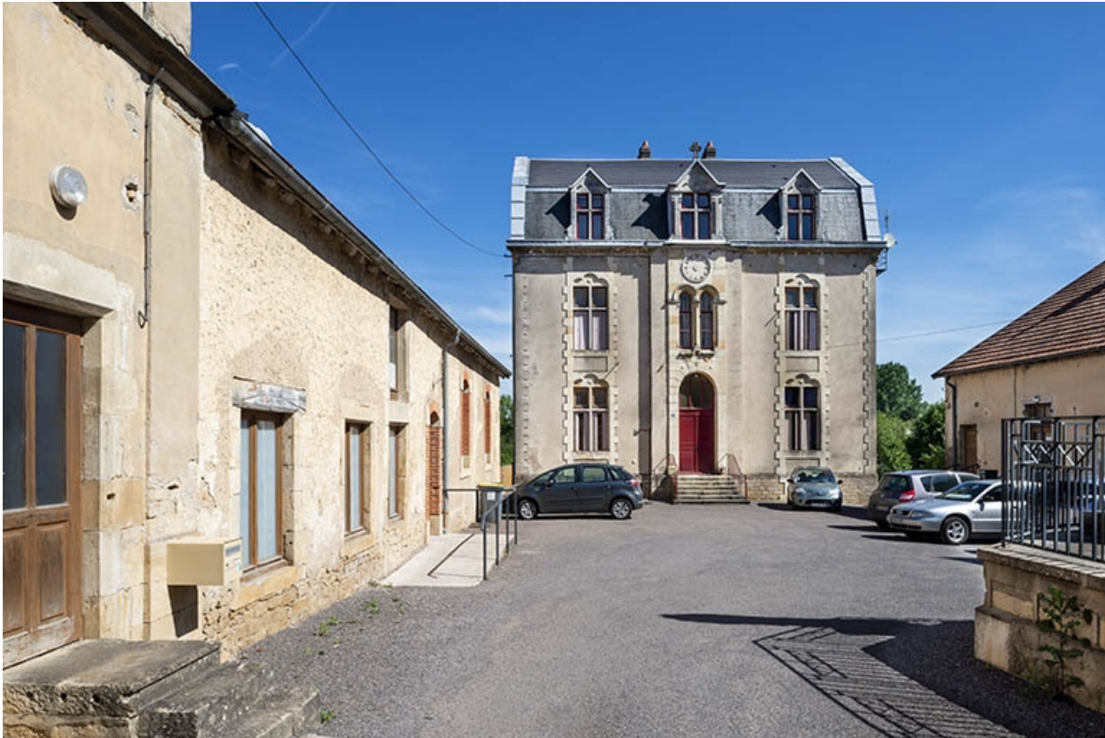
La cour et le bâtiment principal.