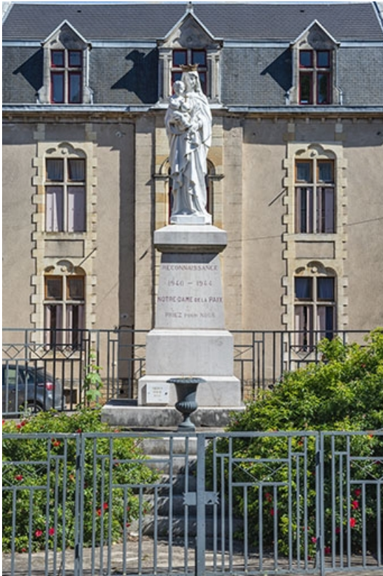
La statue de la Vierge à l'Enfant.