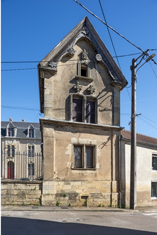
Le pignon de l'aile droite.