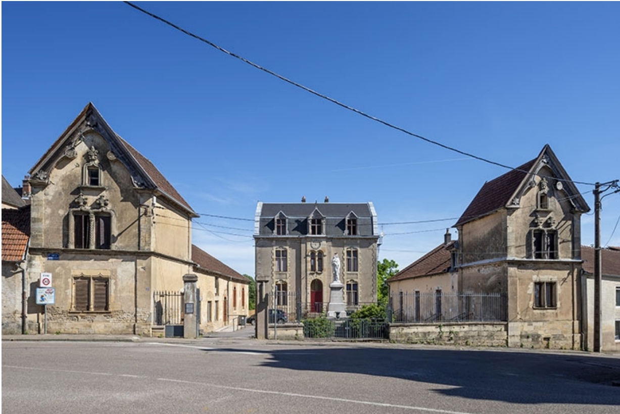
L'ensemble des bâtiments depuis la rue.