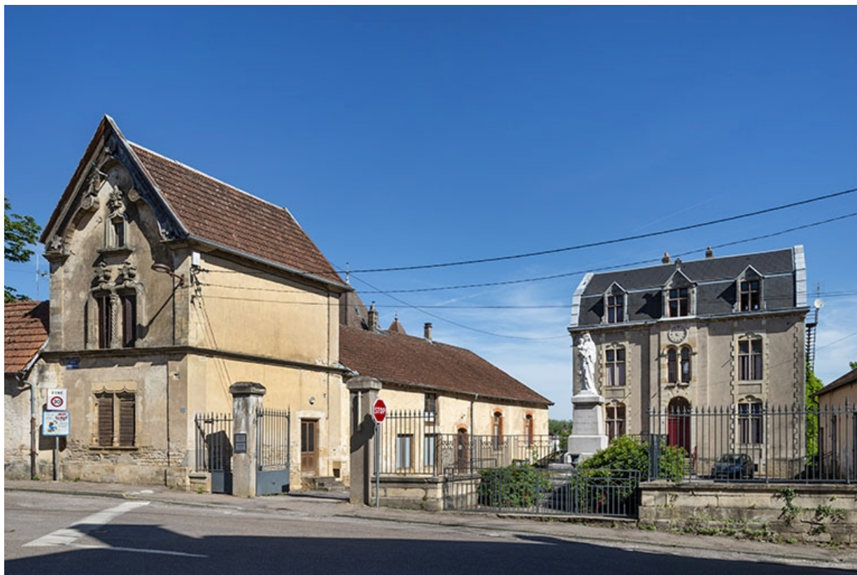
L'aile gauche et le bâtiment central.