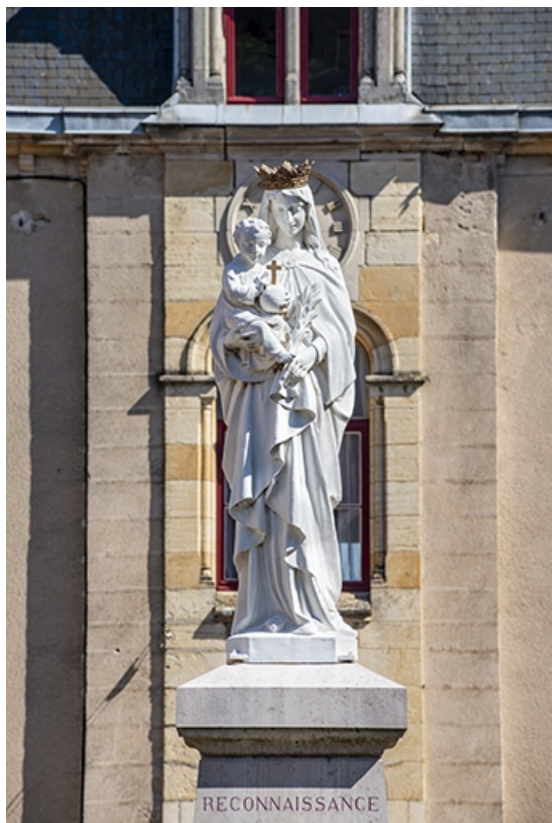
La statue de la Vierge à l'Enfant.