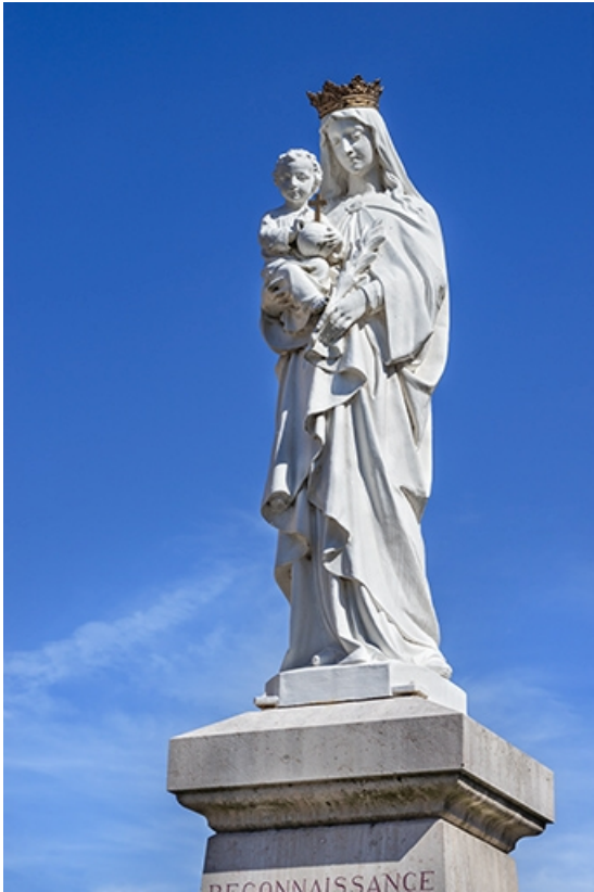
La statue de la Vierge à l'Enfant.