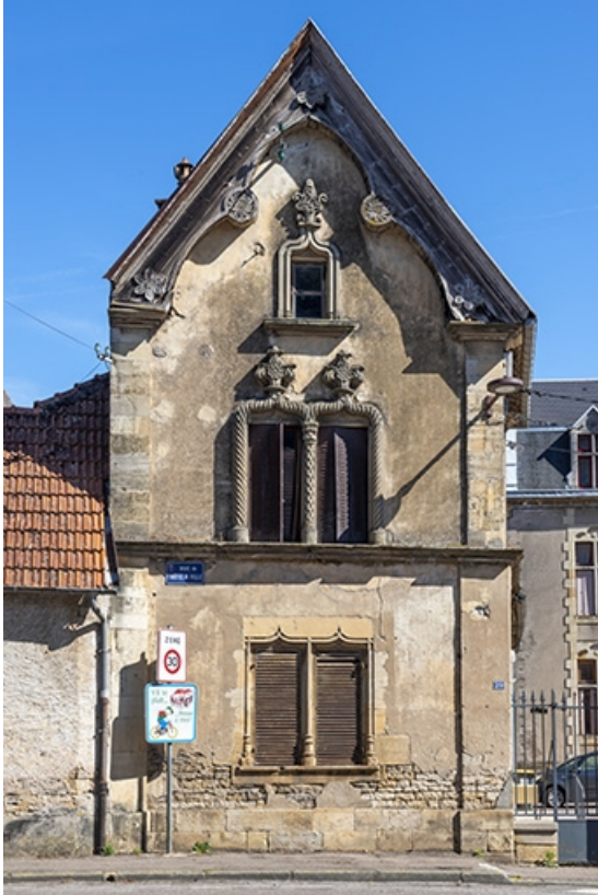
Le pignon de l'aile gauche.