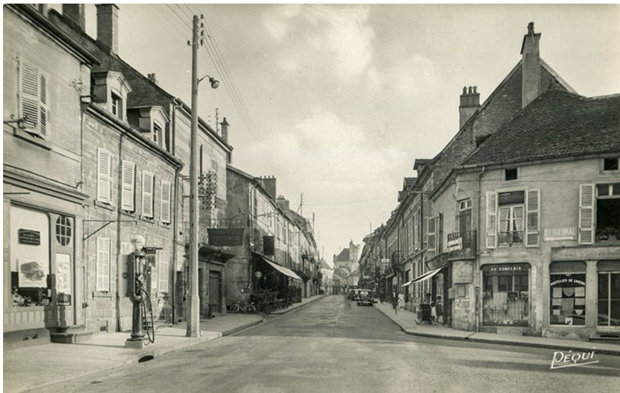
Vue de la rue Carnot.