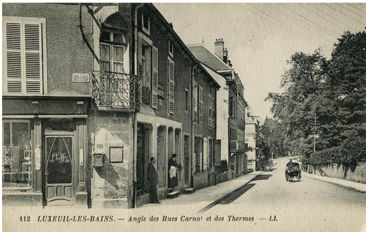
Vue de la rue des Thermes.