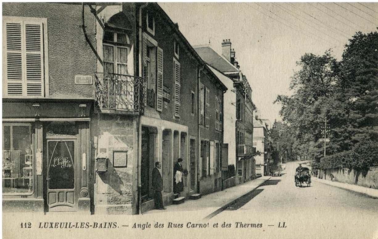
112 LUXEUIL-LES-BAINS. — Angle des Rues Carnot et des Thermes — LL