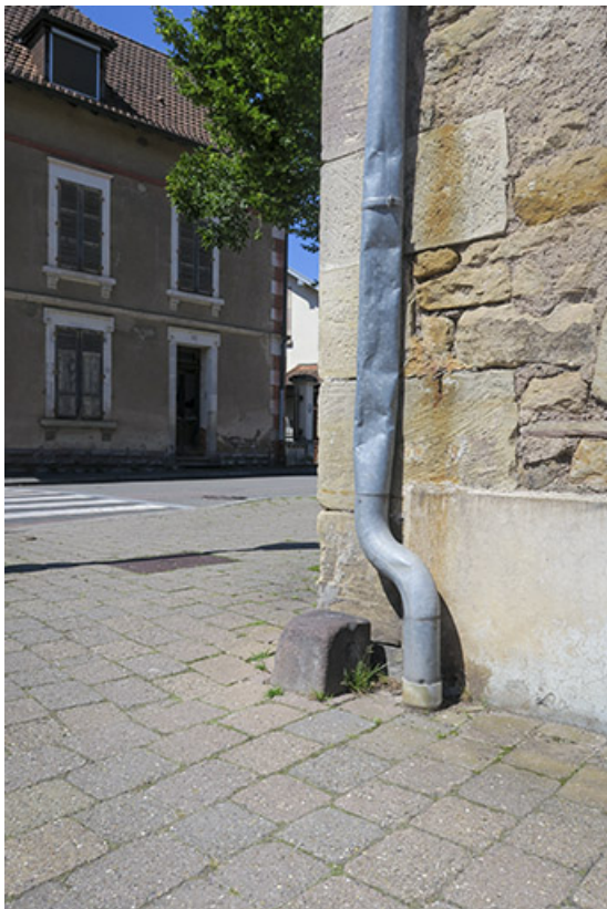
Vue de la borne à l'angle de la rue Jean Jaurès et de la rue de la Saline. 70, Luxeuil-les-Bains rue Jean Jaurès