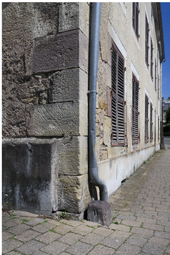
Vue de la borne à l'angle de la rue Jean Jaurès et de la rue de la Saline. 70, Luxeuil-les-Bains rue Jean Jaurès