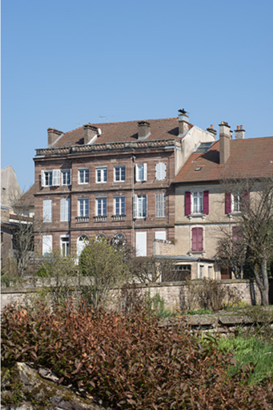
Façade sur le jardin.