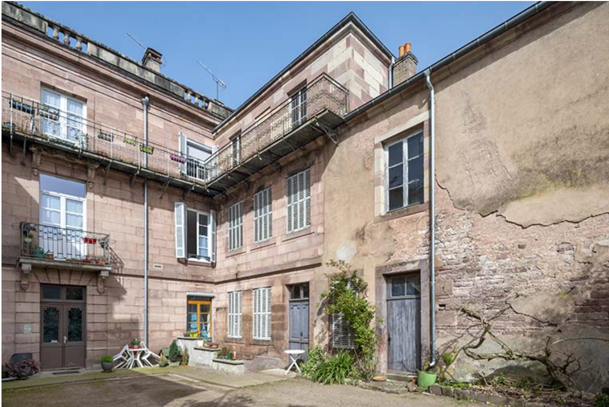
Façade sur la cour.