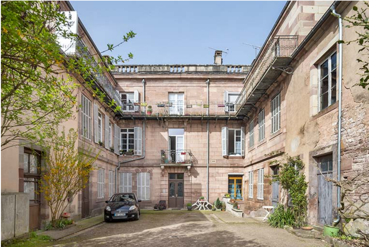
Façade sur la cour.