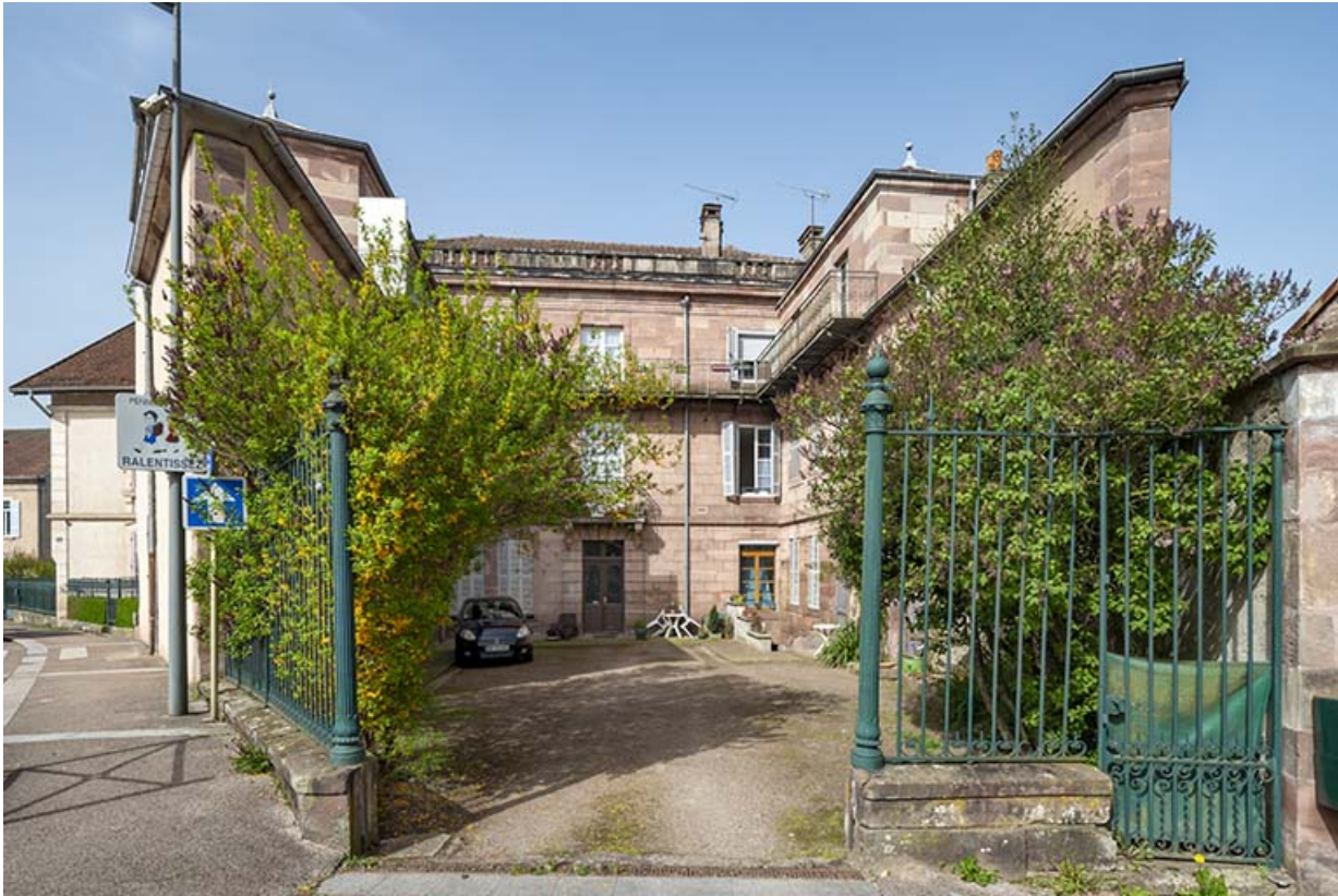
Façade sur la cour.