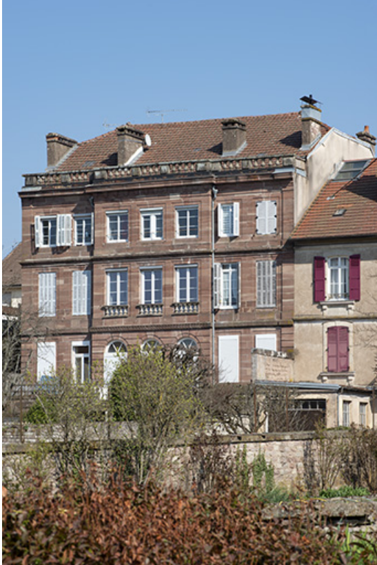
Façade sur le jardin.