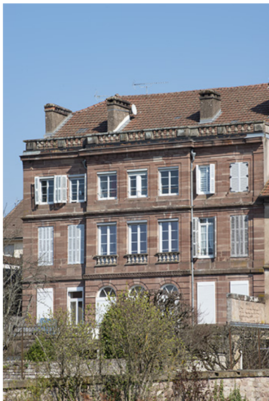
Façade sur le jardin.