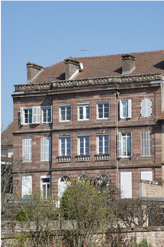
Façade sur le jardin.