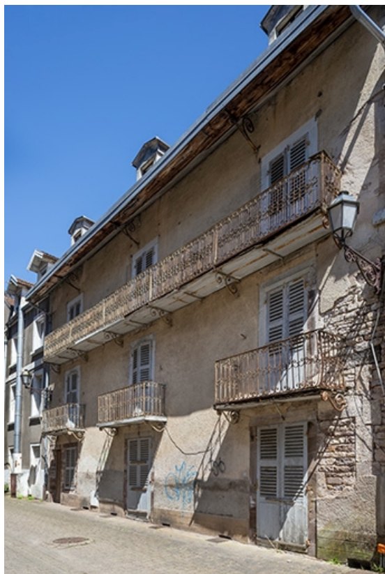
Façade sur l'allée des Romains, vue de trois quarts depuis le sud. 70, Luxeuil-les-Bains rue des Romains