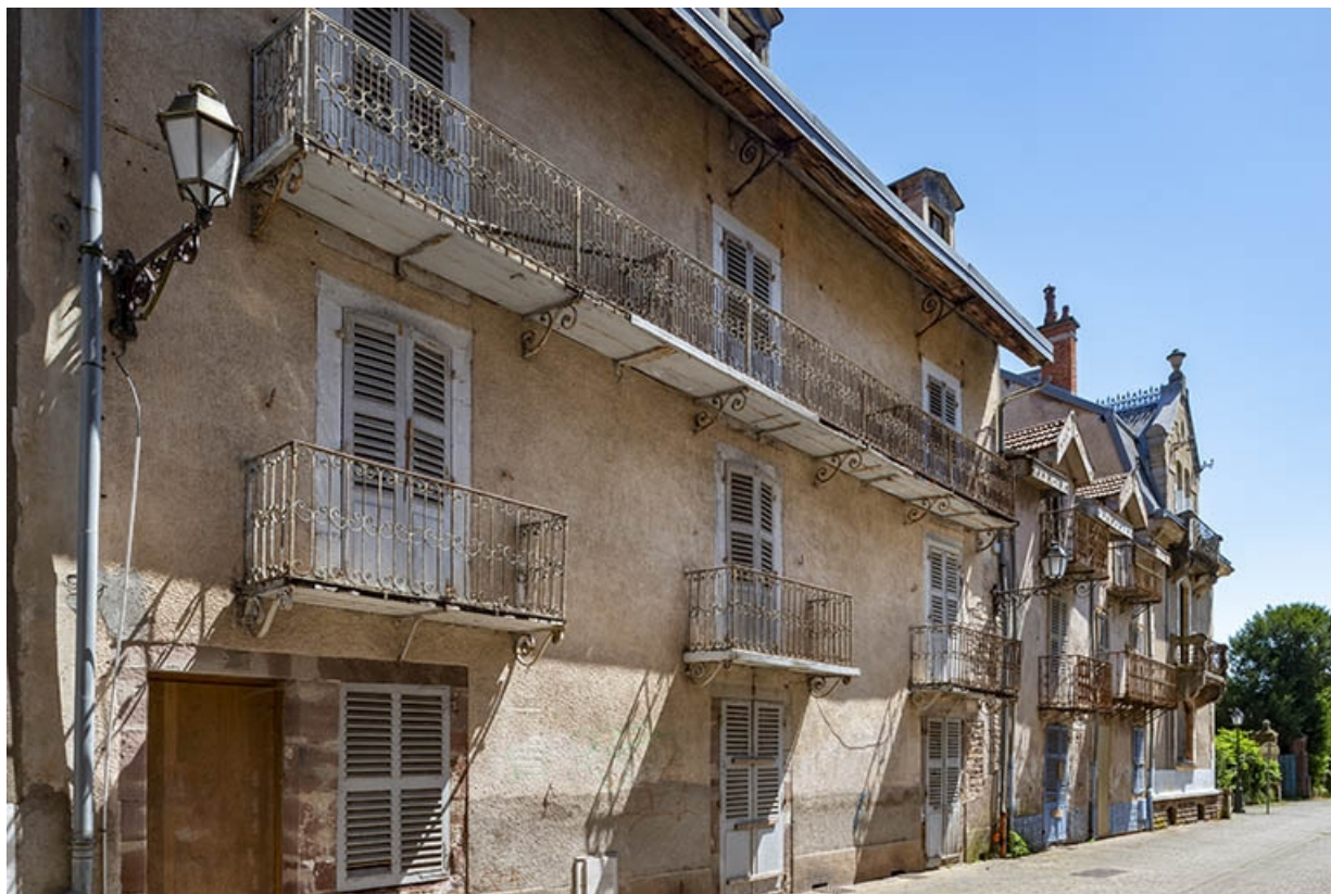
Façade sur l'allée des Romains, vue de trois quarts depuis le nord. 70, Luxeuil-les-Bains rue des Romains