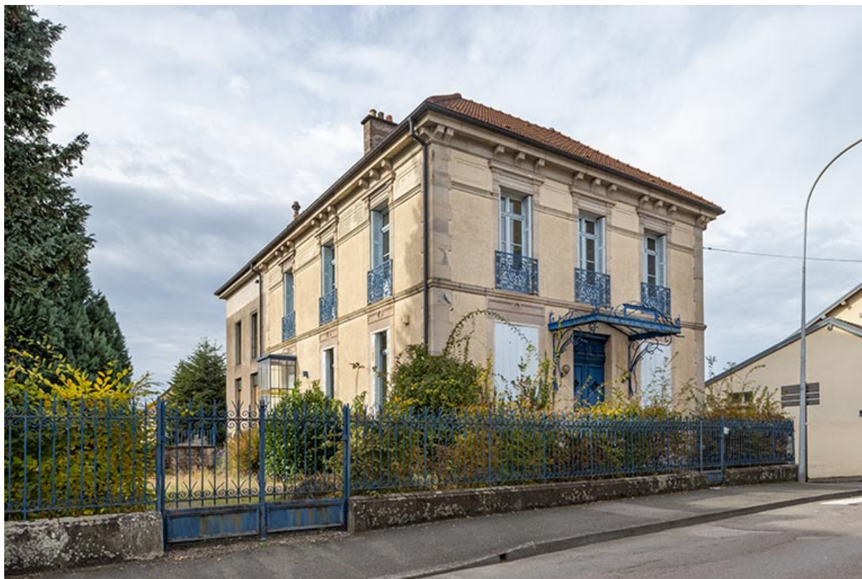
Vue d'ensemble depuis le sud-est (vue actuelle).